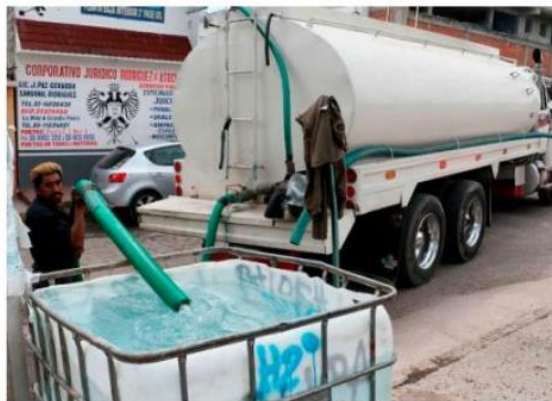
Colonos denuncian que las pipas realizan hasta 45 viajes al día.