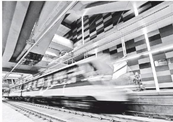
La Línea 4 del Tren Ligero irá rumbo a Tlajomulco.

A decir del Gobernador de Jalisco, tendrá un costo de 13 mil millones de pesos