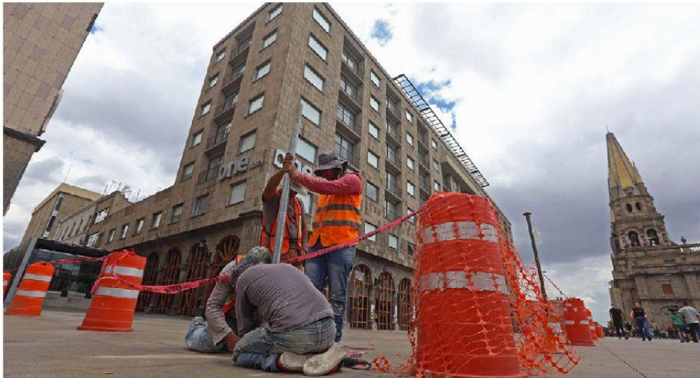
El edificio Plaza en el Centro Histórico de Guadalajara fue acordonado para evitar el paso de ciudadanos. FERNANDO CARRANZA

Manuel Baeza "A los locatarios del Edificio Plaza les llueve sobre mojado" - P. 4