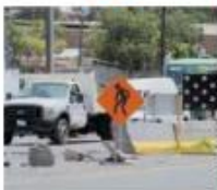
PROTESTAS EN TLAJEPAQUE