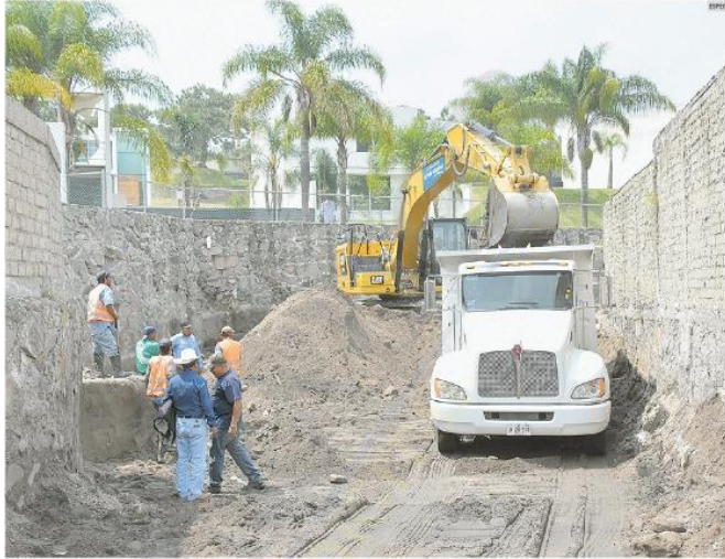
PREVENCIÓN. El Ayuntamiento de Tlajomulco proyecta trabajar en 40 puntos de riesgo de inundación para evitar afectaciones entre la población.

En el caso de los vasos reguladores en el municipio se han realizado trabajos en las presas El Guayabo, El Eucalipto, Primero de Mayo, Villas de la Hacienda y San Agustín, donde se retiraron 492 mil 380 mil metros cúbicos de desechos.