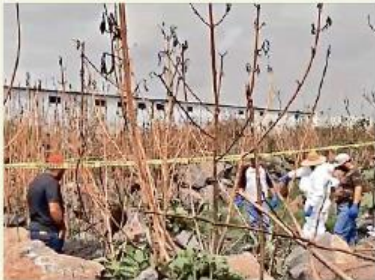
Los trabajos en San Martín de las Flores concluyeron.

Según la Fiscal especial en Desaparecidos, Blanca Trujillo Cuevas, el personal forense y ministerial agotó