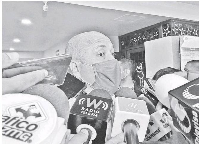
Duro arremetió el Gobernador contra el subsecretario de Salud a nivel federal.

El Gobernador reafirmó el compromiso de seguir apoyando a los niños enfermos de cáncer en Jalisco