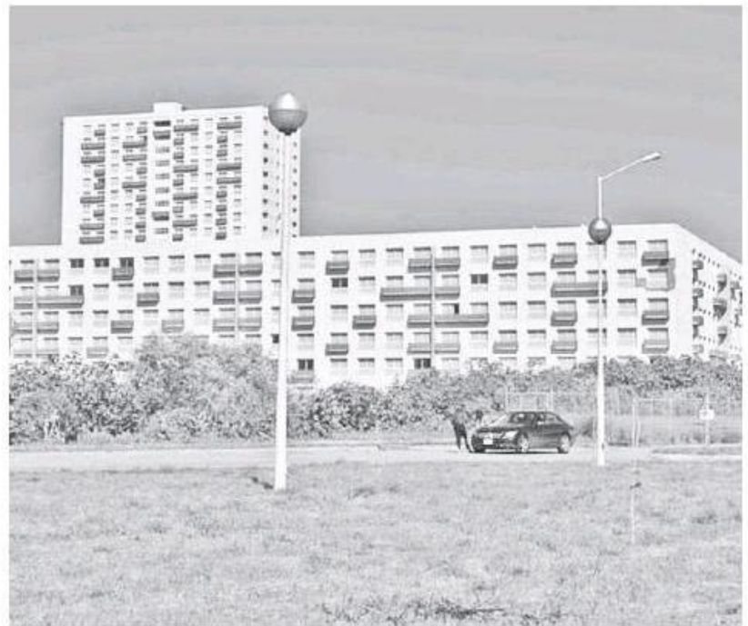
Frangie habló sobre las Villas Panamericanas.

Dijo que la empresa inmobiliaria que comercializa esos espacios no se ha acercado a las autoridades municipales para obtener los permisos faltantes.