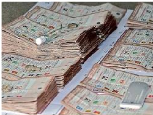
Una de las quejas es en contra del cómputo de la elección de diputaciones federales de Mayoría Relativa.