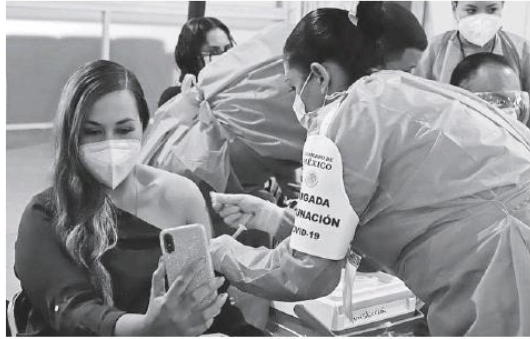
Vacunación con el biológico Cansino a maestros de Jalisco.

Dichos datos corresponden al 2020, pero afirma que serán peores una vez ac-