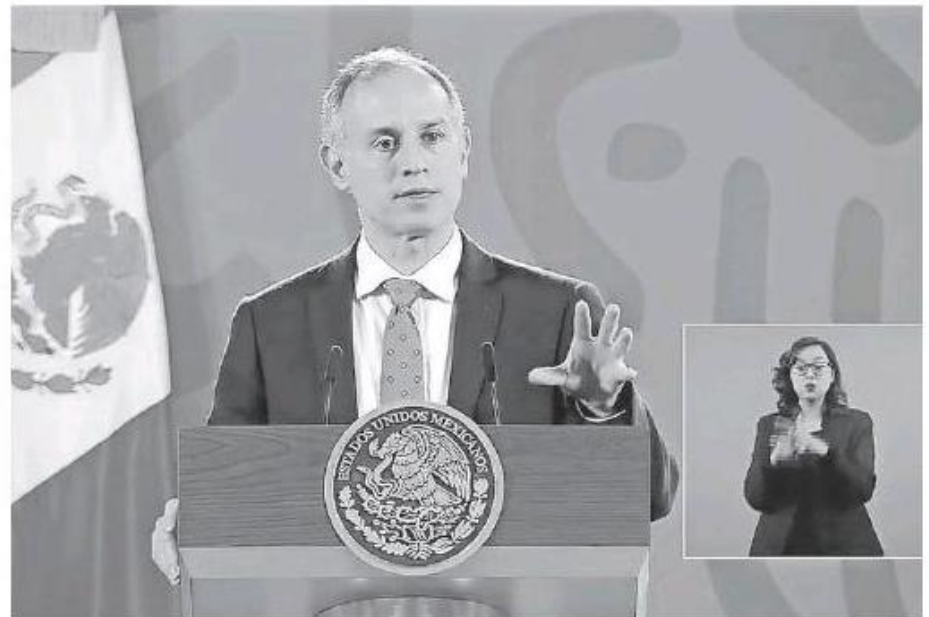
El subsecretario da justificaciones en la mañanera.