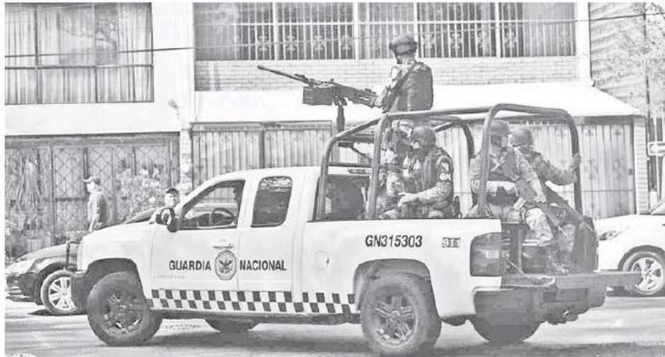
Los muchachos habrían sido golpeados y despojados de su dinero.

Dijo a EL OCCIDENTAL que "Esto es un abuso