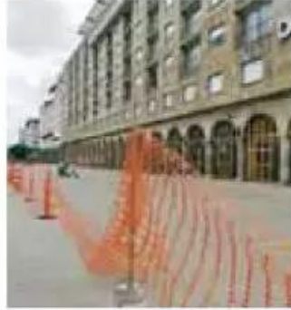
Afectación. Agua del sótano sería la causa.

En rueda de prensa, se informó que buscarán dar apoyo a los locatarios que fueron desalojados, aunque muchos de ellos rechazan dejar sus fuentes de ingresos, pues ya han