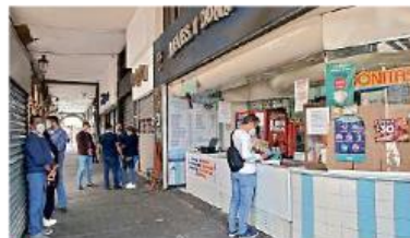
Pese a la apertura de algunos negocios, ayer se realizó el cierre de comercios.