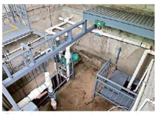
El desarrollo tiene planta de tratamiento de aguas residuales.

ALTO IMPACTO Cuatro muertos y ocho lesionados dejaron un accidente en la Autopista GDL-Lagos de Moreno cuando un tráiler impactó a ocho autos. JUSTICIA PÁG. 4