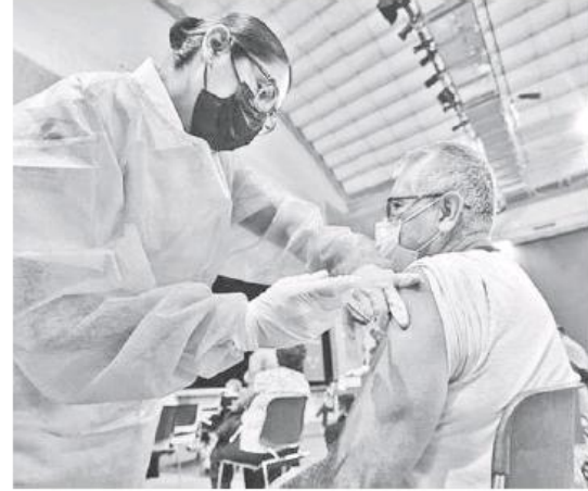
Una vez que se vacuna se evalúa la evolución de los trabajadores.

Trabajadores de las empresas afiliadas son enviados a sus domicilios para que se recuperen.