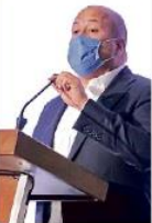
El Gobernador Enrique Alfaro dijo que toca a la Federación definir la altura de la presa.

Aunque la Presa El Zapotillo es una obra mal planeada y mal ejecutada, debe llevarse a cabo porque tuvo una inversión de miles de millones de pesos y porque es necesario acceder al agua del Río Verde, aseguró el Gobernador Enrique Alfaro. En entrevista, el Mandatario dijo que tiene el compromiso del Presidente Andrés Manuel López Obrador para impulsar ese proyecto, que tiene como objetivo que Jalisco y Guanajuato accedan al agua del Río Verde. “El Presidente ayer (el lunes) hizo un compromiso muy puntual. Lo que me dijo el Presidente es: ‘le vamos a entrar al tema y vamos a cumplir nuestra responsabilidad para resolver el problema de abasto de agua de la Ciudad de Guadalajara y de Los Altos de Jalisco’”, refirió Alfaro. “Para mí, es planteamiento del Presidente es un gran avance y vamos ahora el martes (próximo)