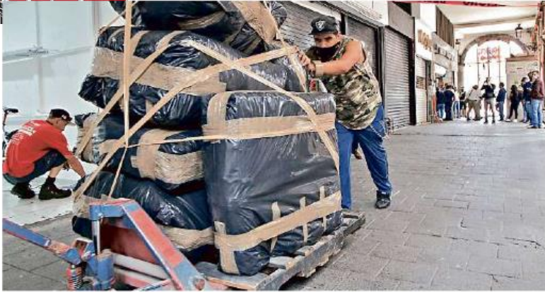
Locatarios sacan mercancía de las tiendas ubicadas en Pedro Moreno casi esquina Paseo Alcalde, debajo del Hotel One.