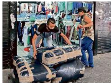
Protección Civil informó que la desocupación del inmueble tiene como objetivo salvaguardar la seguridad de la población.

El cierre del edificio y sus alrededores es indefinido y se harán mesas de trabajo para informar sobre las acciones que se lleven a cabo y las decisiones que se tomen.