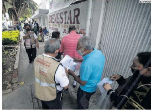
ESPERA. Por el momento, sólo las personas que tengan 68 años cumplidos pueden iniciar el trámite para obtener la pensión en los 10 centros integradores que operan en Guadalajara, Zapopan, Tonalá, Tlaquepaque y Tlajomulco de Zúñiga.

Uno de los puntos a resolver con la Federación es el correspondiente a la Presa El Zapotillo, que de acuerdo con el Ejecutivo estatal es clave para dotar de agua a la Entidad y Guanajuato.