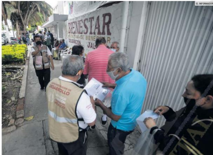
ESPERA. Por el momento, sólo las personas que tengan 68 años cumplidos pueden iniciar el trámite para obtener la pensión en los 10 centros integradores que operan en Guadalajara, Zapopan, Tonalá, Tlaquepaque y Tlajomulco de Zúñiga.

Por el momento, sólo los que tengan 68 años cumplidos pueden iniciar el trámite en cualquiera de los 10 centros integradores que operan en Guadalajara, Zapopan, Tonalá, Tlaquepaque y Tlajomulco.