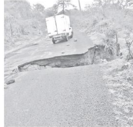
Un vehículo de carga que pasaba por el lugar quedó varado.

Pese al incidente de la camioneta, no hubo lesionados, ni pérdidas humanas. La autoridad municipal en coordinación