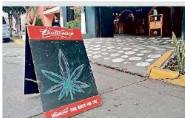
En Guadalajara existen establecimientos que ofrecen a sus comensales alimentos con extracto de CBD, que no causan efectos psicoactivos.

Sin embargo, no menciona en ninguno de sus artículos restricciones para el CBD.