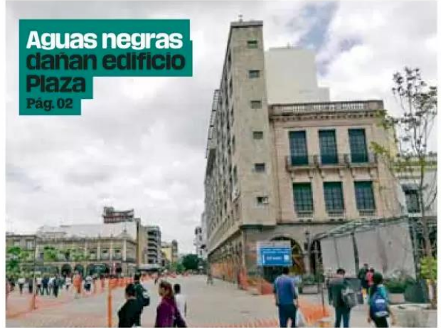
Riesgo. Autoridades advirtieron de nuevos daños en el inmueble.