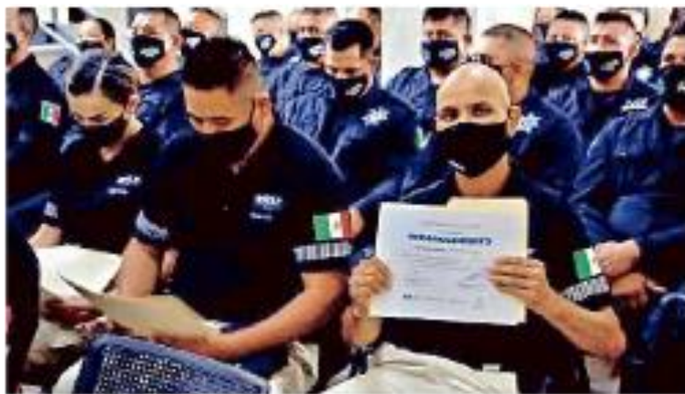
■ Ayer hubo personal graduado en Autlán.

De acuerdo con integrantes de las comisarias locales, tras el vencimiento del plazo para la implementación del certificado, no se ha fijado una nueva prórroga por parte del Gobierno federal.