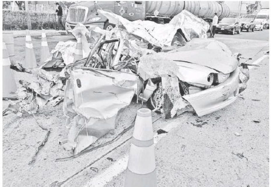
Los hechos en la caseta de cobro de la autopista Guadalajara-Lagos de Moreno.

La vialidad fue cerrada en el referido sentido de circulación y más tarde en su totalidad para que peritos realizaran su trabajo