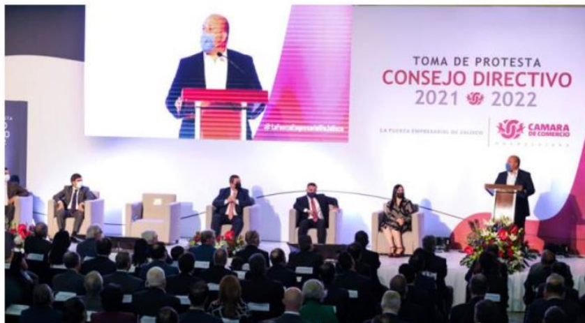
El Gobernador de Jalisco, Enrique Alfaro Ramírez, en la toma de protesta a los integrantes del nuevo Consejo Directivo 2021-2022 de la Cámara Nacional de Comercio, Servicios y Turismo de Guadalajara.

“Agradecerle a la Cámara de Comercio todo lo que hizo por Jalisco, en medio de los tiempos difíciles que hemos vivido, la verdad es que hoy que vemos los números, los resultados, los indicadores en términos de salud pública, podemos estar muy tranquilos todos los jaliscienses de saber que tomamos las decisiones que se tenían que tomar, que actuamos a tiempo, que nos tomamos en serio la responsabilidad que teníamos y que pu-