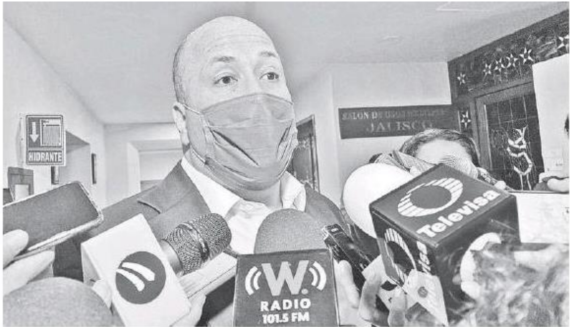
Enrique Alfaro, gobernador de Jalisco.