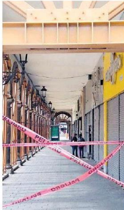
Estructuras de acero dan soporte a los arcos del edificio.

Con la presencia de autoridades municipales y estatales, en conferencia de prensa se explicó que el ayuntamiento tapatío ha trabajado para monitorear el inmueble desde el 2016, debido a las afectaciones iniciales que sufrió por las obras de la Línea 3 del Tren Eléctrico, y como parte de esto es que el pasado 18 de julio se hizo un recorrido por el sótano en donde se