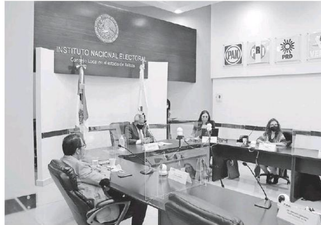
La sesión del Consejo Local del INE en Jalisco.

Los informes fueron remitidos mediante dos modalidades: presencial, en las cabeceras de cada circunscripción y en la Secretaría General de la Cámara de Diputados; y digital, a través del Sistema de Resultados y Declaraciones de Validez de las elecciones del Proceso Electoral Fed-