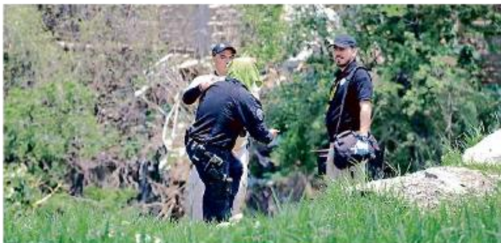
■ En Lomas del Refugio fueron hallados restos humanos.

Media hora después fue encontrado un hombre tendido sobre un charco de sangre en la Avenida Malecón, en la Colonia Lagos de Orien-