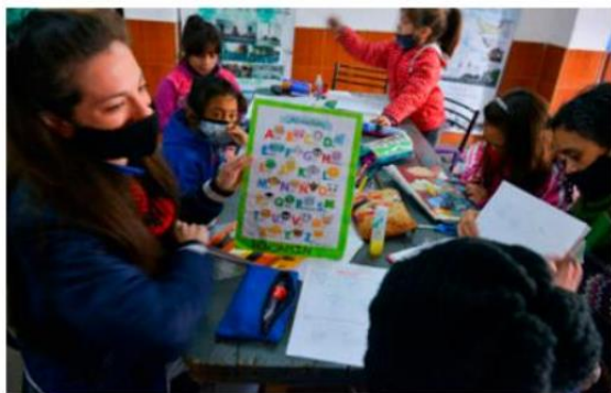
Red Jalisco, que conectará con internet a los 125 municipios del estado, contempla la apertura de la Plataforma de Cursos Básicos de Inclusión Digital.