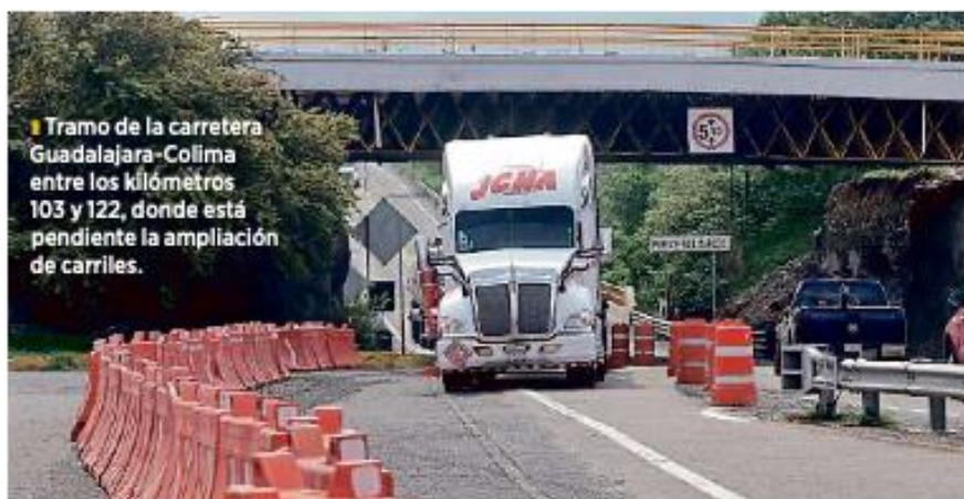
Tramo de la carretera Guadalajara-Colima entre los kilómetros 103 y 122, donde está pendiente la ampliación de carriles.

En el tramo faltante, los dos nuevos carriles que servirían para circular en el sen-