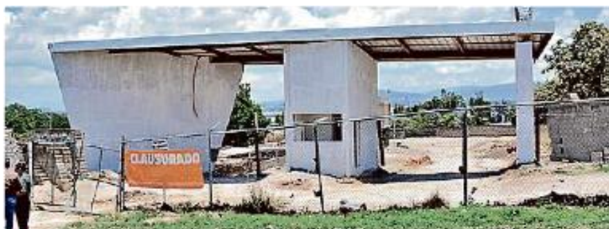
El 23 de junio de 2016, Zapopan clausuró la construcción de Bosque Encantado por no contar con medidas de seguridad y dañar casas contiguas por una barda mal cimentada.

El fraccionamiento fue adquiriendo diversos permisos, entre ellos el cambio de uso de suelo forestal a urbano concedido por la Secretaría de Medio Ambiente y Recursos Naturales en 2013,