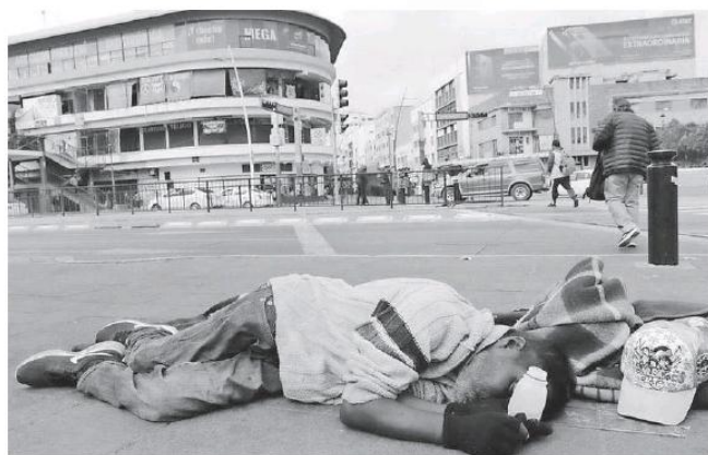
Mendicidad con fines lucrativos, es una modalidad en la trata de personas.