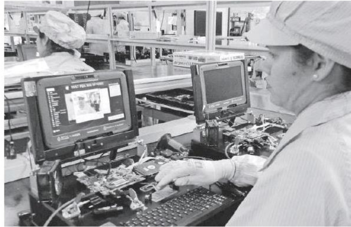
Leve crecimiento en la industria manufacturera.

El INEGI informó de los Indicadores de Confianza Empresarial (ICE) correspondientes a junio del año en curso. Indicadores que se elaboran con los resultados de