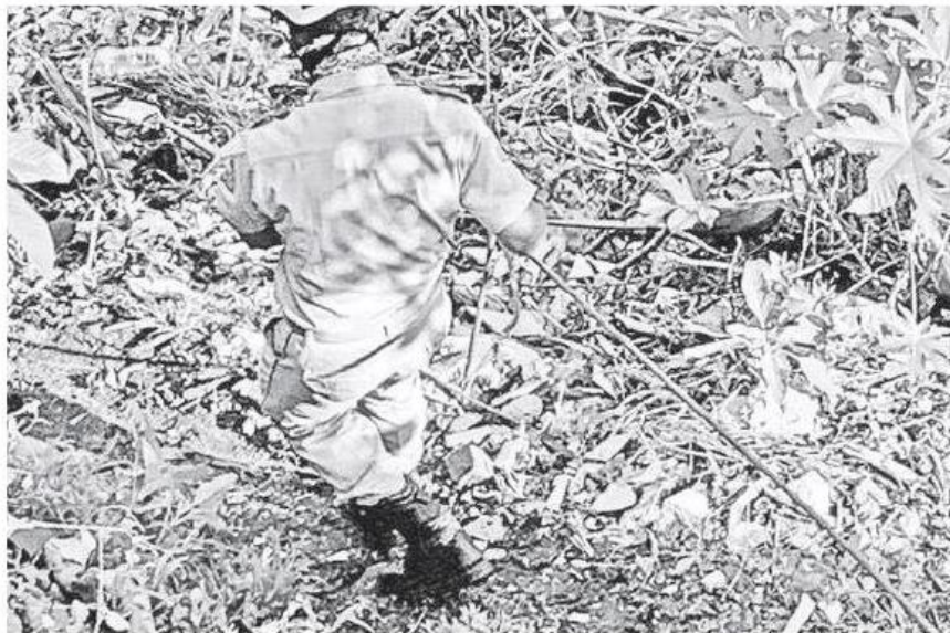
Jornada violenta este domingo en Zona Metropolitana.

El reportante informó que vio a un perro con una extremidad y se acercó al barranco, en donde observó cerca de un arroyo un costal con bolsas negras y extremidades semienterradas, por lo que de inmediato dio aviso a las autoridades. Po-