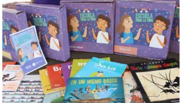
El Programa Escuelas de Tiempo Completo que ponía énfasis en las materias de español y matemáticas es prácticamente sepultado por el gobierno de la Cuarta T, con lo que muestra su falta de interés en la educación con calidad.

“Depende mucho del nivel, pero en primaria la aprobación anda en el orden del 97 por ciento, es muy alta, tal vez más alta que eso, en preescolar básicamente los niños son promovidos sistemáticamente por las habilidades que se les inculcan, el problema de reprobación lo tenemos en secundaria con un 3 por ciento. En