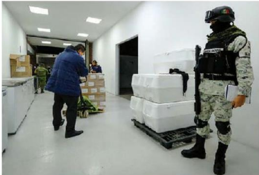
El sábado llegaron más dosis al estado.

La Secretaría de Salud Jalisco informó este domingo que se notificaron 230 casos nuevos de covid-19 en la entidad, por lo que suman 254 mil 839 contagios desde el 14 de marzo de 2020, cuando se registró al primer paciente por la enfermedad en el estado. Este domingo no se reportó ningún deceso por complicaciones de coronavirus. ■