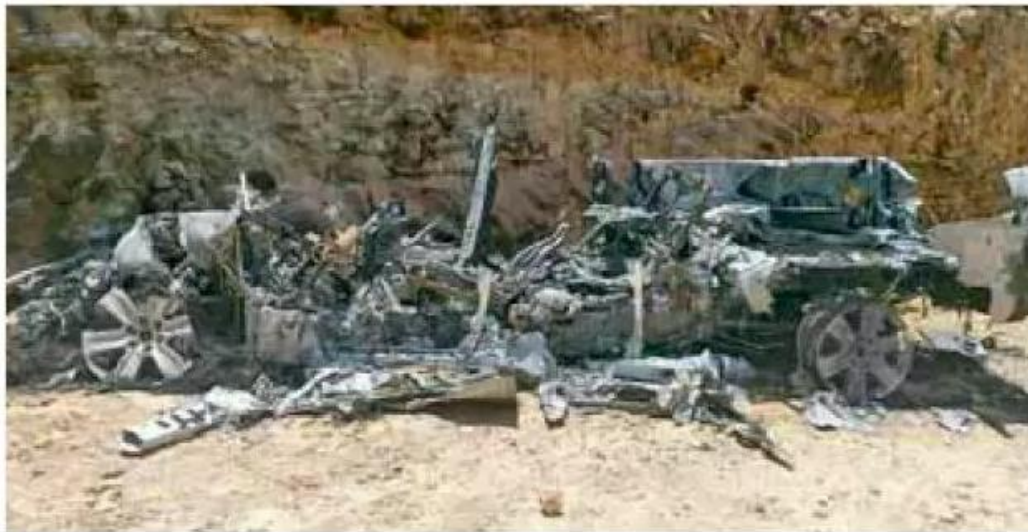
Fojo Rojo. Al menos 20 muertos han dejado los enfrentamientos entre criminales.