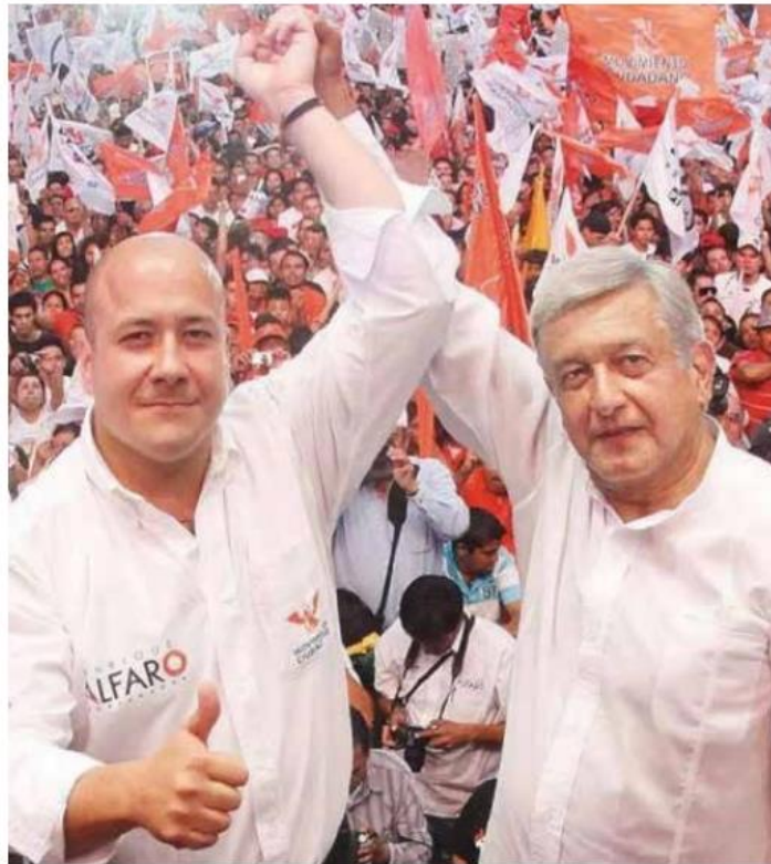
Tan parecidos, Alfaro y Amlo.

CLEMENTE CASTAÑEDA EXIGE QUE SE TRABAJE A NIVEL NACIONAL PARA AMPLIAR LA AGENDA DE LIBERTADES PERO EN JALISCO, DONDE MC CONTROLA EL GOBIERNO DEL ESTADO, NO SE APRUEBA EL MATRIMONIO IGUALITARIO.