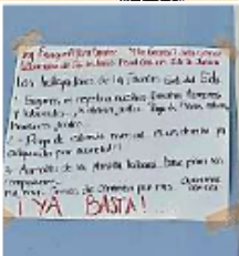
■ Empleados colocaron mensajes, a manera de protesta.