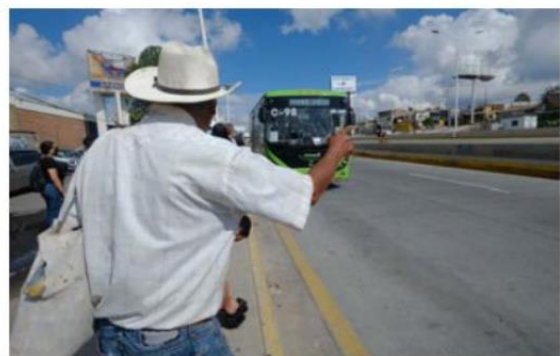
Mi Transporte Eléctrico, en un plazo de dos a tres semanas se ampliará hasta el aeropuerto.

es de aproximadamente 4 horas pasando del 20 al 100 por ciento, que es como se planea hacer.