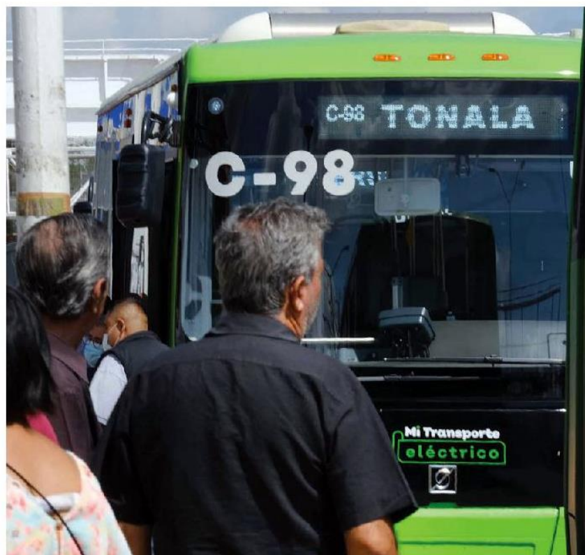
Ayer comenzaron a operar en la metrópoli. ESPECIAL

Movilidad. Funcionan en la ruta C98, la primera totalmente eléctrica del país, recorre de Periférico Norte a CUTonalá