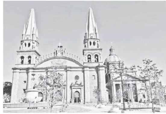
Por el momento continuarán las tradicionales misas en la Catedral Metropolitana.

Esto, porque la Catedral tapatía se ubica a unos metros del inmueble dañado y que está apuntalado, justo frente a la Pla-