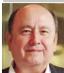
Por Gabriel Ibarra Bourjac