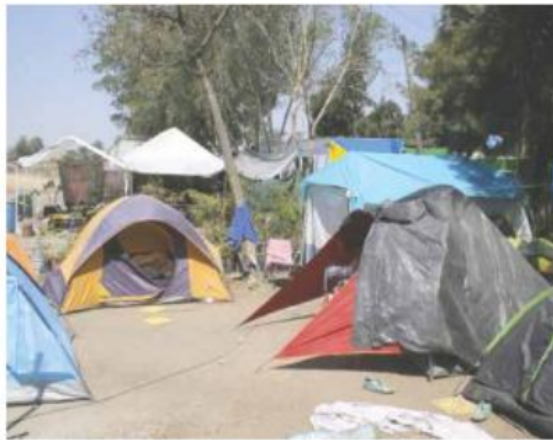
DESDE FINES DE MARZO. El predio a desarrollar actualmente se encuentra tomado por vecinos de Huentitán y la Federación de Estudiantes Universitarios.

En esa fecha el proyecto Iconia todavía no había sido autorizado por el Ayuntamiento de Guadalajara, pues el contrato que estaba vigente en ese momento era el del proyecto Puerta Guadalajara, con la empresa española Mecano. Fue hasta agosto de 2016 que la autoridad municipal autorizó el cambio de proyecto. Aun