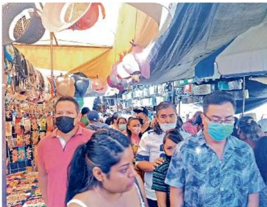
El tianguis artesanal de Tonalá relajó sus medidas de sanidad ayer y permitiera aglomeraciones de riesgo, cuando los casos de Covid-19 van en ascenso.

Sin embargo, el parque ecológico, pese a ser un área verde con espacios abiertos, oxigenados y con bajo riesgo de contagio, sigue con puertas cerradas, de manera que quienes ingresan para ejercitarse o disfrutar el paisaje lo hacen forzando el enmallado.