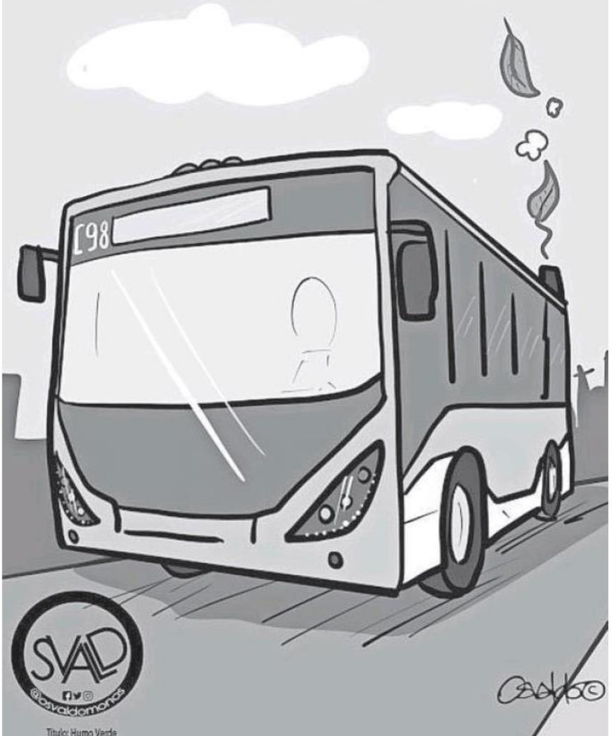
Título: Humo Verde