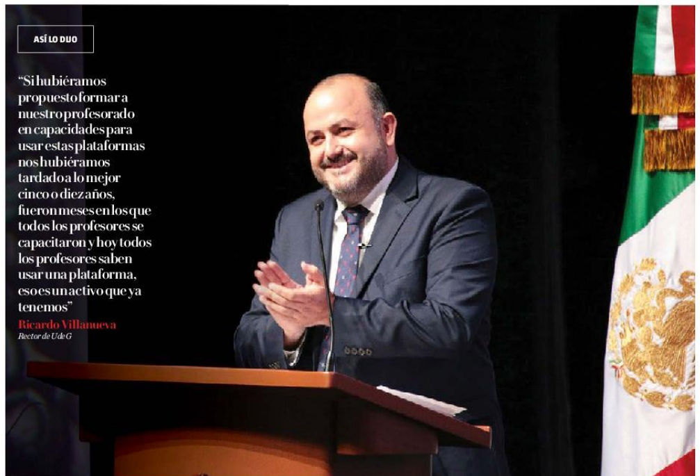
La semana pasada presentó el informe de su gestión. ESPECIAL

en su presupuesto federal de mil 875 millones de pesos, lo que representa 14 por ciento menos de lo que recibió durante 2015, de mil 461 millones de pesos. “La UdeG en 2015 bajó mil 400 millones de pesos con calidad y con resultados, porque esas bolsas las bajamos con indicadores, y hoy esos seis mil millones de pesos ya son 121 millones de pesos en todo el país, y la UdeG de mil 400 millones de pesos. Si sumamos eso son mil 400 millones de pesos menos y con menos presupuesto la UdeG tiene 25 por ciento más de matrícula con el 14 por ciento del presupuesto menor”, precisó.