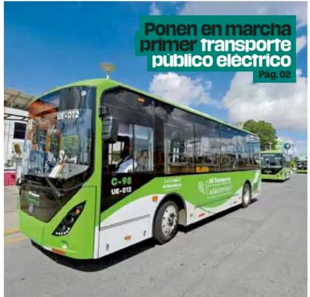
Ponen en marcha primer transporte público eléctrico Pág. 02

● Autoridades zacatecanas informaron de una reunión con autoridades federales y de Jalisco para reforzar la vigilancia en la zona limítrofe entre ambas entidades. Pág. 02