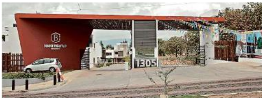
Actualmente el fraccionamiento ya se construyó, además de que viviendas ya están habitadas y se siguen vendiendo.

así como licencias de urbanización en 2014.