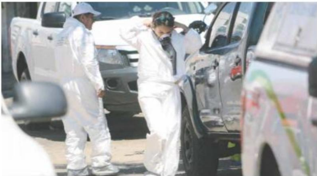
IJCF. Los indicios hallados en Zapopan ya están siendo analizados en el Instituto Jalisciense de Ciencias Forenses.

En cuanto a la fosa detectada en Zapopan, se halló en un predio rústico localizado en los límites de las