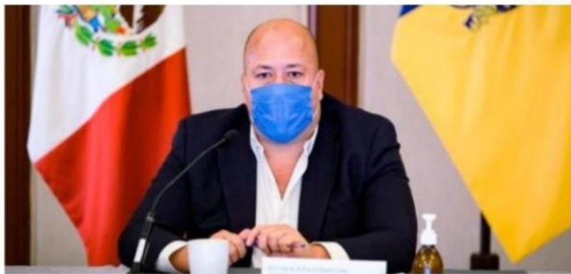
El Gobernador del Estado, Enrique Alfaro Ramírez, aclaró que Jalisco no busca romper con el pacto fiscal.

El Gobernador del Estado, Enrique Alfaro Ramírez, aclaró que Jalisco no busca romper con el pacto fiscal y que la consulta pública que se realizará en la entidad será sobre la iniciativa de Reforma Constitucional que propuso el Ejecutivo para que periódicamente el legislativo revise los convenios de coordinación fiscal, y no solamente sobre la perma-