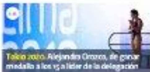
Taliazo 2020. Alejandra Orozco, de ganar medalla a los 15, a líder de la delegación

La lluvia provocó el caos en la noche de la ciudad de México, con inundaciones en las calles y cortes de energía. Los afectados se resquebrajaron en las calles, con el agua cubriendo los vehículos y las personas. La lluvia provocó el caos en la noche de la ciudad de México, con inundaciones en las calles y cortes de energía. Los afectados se resquebrajaron en las calles, con el agua cubriendo los vehículos y las personas.