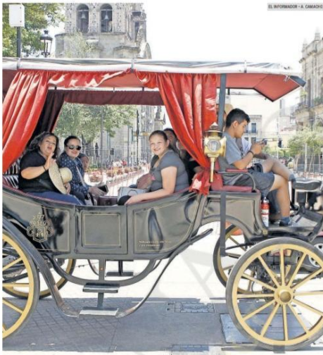
FALLAS. Las plataformas de hospedaje ofrecen costos más bajos a los turistas en Jalisco, pero la mayoría continúa evadiendo impuestos.

La Ley de Hacienda del Estado establece que las plataformas digitales de servicios de hospedaje deberán presentar a más tardar el día 15 posterior a cada bimestre, la declaración para el impuesto en los términos que establece la Secretaría de la Hacienda Pública de Jalisco, "y con apego a los ordenamientos en materia de protección de datos personales en posesión de los sujetos obligados". De acuerdo con la plataforma de Airbnb, que es la de mayor cobertura, "en las áreas en las que ha llegado a los acuerdos con los Gobiernos estatales está obligada por ley a recaudar y pagar impuestos locales a nombre de los anfitriones". En las políticas de la empresa se puntualiza que esto puede aplicarse en los Impuestos Sobre la Ocupación, los Impuestos al Valor Agregado (IVA) y los Impuestos Sobre Bienes y Servicios en el Alojamiento. Sin embargo, en la lista de los Estados en los que la compañía cumple con estas obligaciones no aparece Jalisco. Solo Baja California, Baja California Sur, Estado de México, Ciudad de México, Oaxaca, Quintana Roo, Sinaloa y Yucatán.