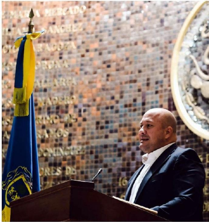
El gobernador encabezó la conmemoración del aniversario de la Constitución estatal. ESPECIAL

El mandatario estatal solicitó al Congreso local que, antes de discutir esta iniciativa, se lleve a cabo antes una consulta ciudadana para que sean los mismos quienes decidan qué pasará con el pacto fiscal. “La consulta no sería sobre si permanecer o salirnos del convenio fiscal, la consulta sería sobre el contenido de una reforma constitucional para obligar a los poderes públicos de este estado a realizar una revisión periódica de los convenios de coordinación fiscal, garantizando que