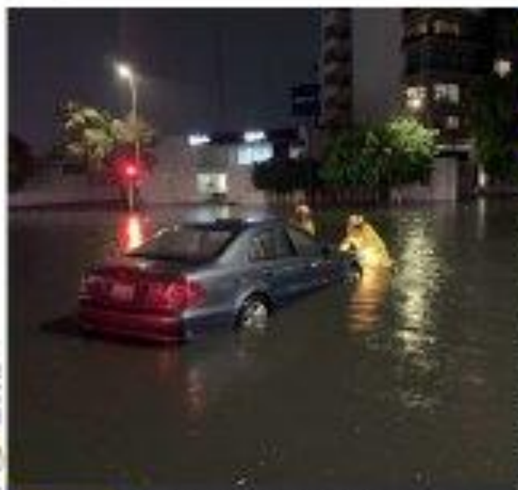
Temporal. Lluvia causa estragos en la metrópoli

Se disparan contagios El repunte por la tercera día es de 324 por ciento en Oaxaca y de 314 en Sinaloa, mientras que la capital registra incremento de 193, sobre todo de jóvenes; Shierbaum insta a medidas adicionales.