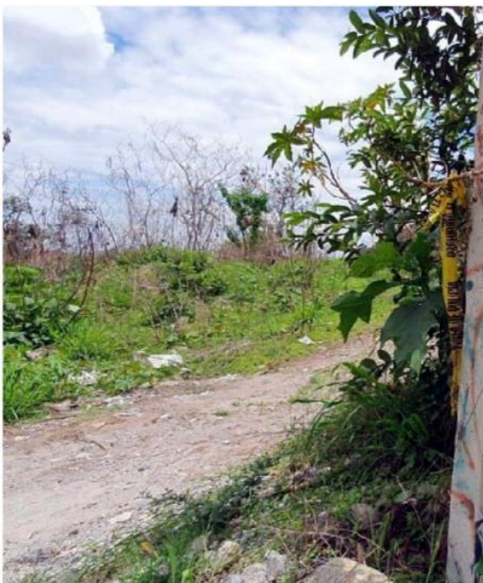
Las autoridades continúan con los trabajos. J.C. MUNGUÍA

Inicialmente llegó un reporte a las autoridades sobre una osamen-