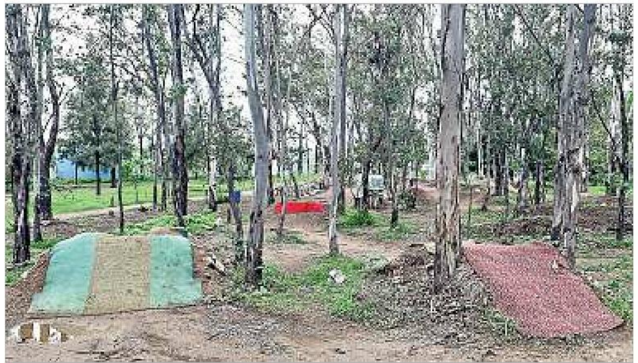
■ Para que no se degrade la tierra con el impacto de las bicicletas, Zapopan ha colocado tapetes en las pistas habilitadas.

“Hemos estado ya en pláticas con las ligas de ciclismo para establecer rutas, todavía no hemos llegado al acuerdo final, pero está caminando hacia allá, hemos platicado