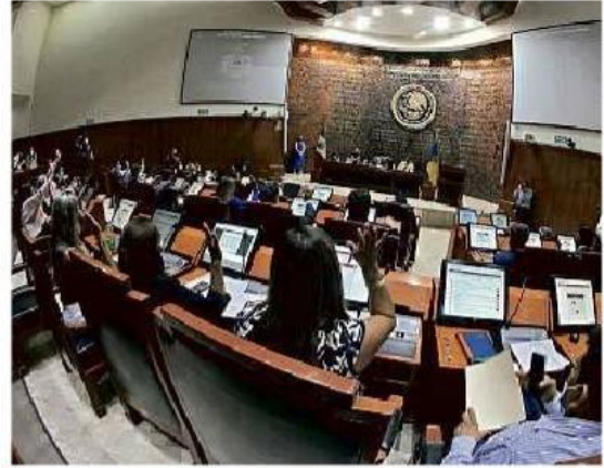
■ Los diputados locales ya no podrán usar dinero público para realizar sus informes de actividades.

“No eran obligatorios los informes, ahora lo serán; también modificamos que se impida que se asigne partida presupuestal para uso en informes”, indicó.