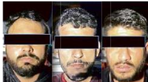
Los sujetos fueron llevados ante la Fiscalía estatal.

CAE NIÑO A UN ALJIBE Y FALLECE Aunque su familia, los bomberos y los paramédicos intentaron de todo para salvarlo, un niño de 5 años falleció ahogado en un aljibe de la Colonia Plan de Oriente, en Tlaquepaque, la tarde de ayer. Sus parientes lo perdieron de vista en la vivienda de la Calle San Martín y lo hallaron en el agua. Staff