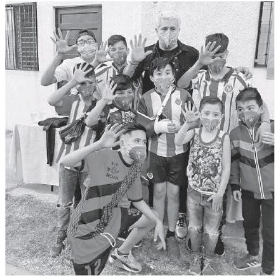
Frustrada campaña y carrera política del exfutbolista.

Recordó que el Bofo Bautista los buscó para que le llevaran la campaña electoral a inicios de abril pasado, para lo cual la agencia le puso un coordinador -ya que