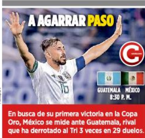
A AGARRAR PASO En busca de su primera victoria en la Copa Oro, México se mide ante Guatemala, rival que ha derrotado al Tri 3 veces en 29 duelos.