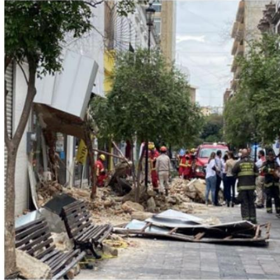
Debido al incidente, se le aplicará una multa al propietario por falta de mantenimiento y poner en riesgo a las personas.

Este accidente se da en el Centro Histórico a un par de semanas del desalojo en el Edificio Plaza por encontrar que