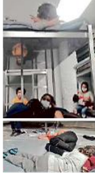
Menores de edad retenidos en la habitación de la Terminal 2 del AICM, adaptada con literas y colchonetas en los pisos.

De acuerdo con testimonios recabados por Grupo REFORMA, el lugar parece más una celda gestionada por el INM y vigilada por personal privado, de la que no pueden salir a voluntad.