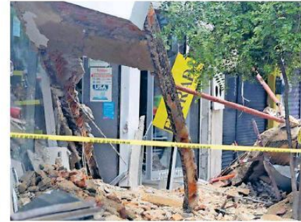
Los hechos sobre calle Colón y López Cotilla en el Centro de Guadalajara. AURELIO MAGAÑA

Agregó que la posible causa del colapso fue falta de mantenimiento "porque puedes ver que los ladrillos estaban