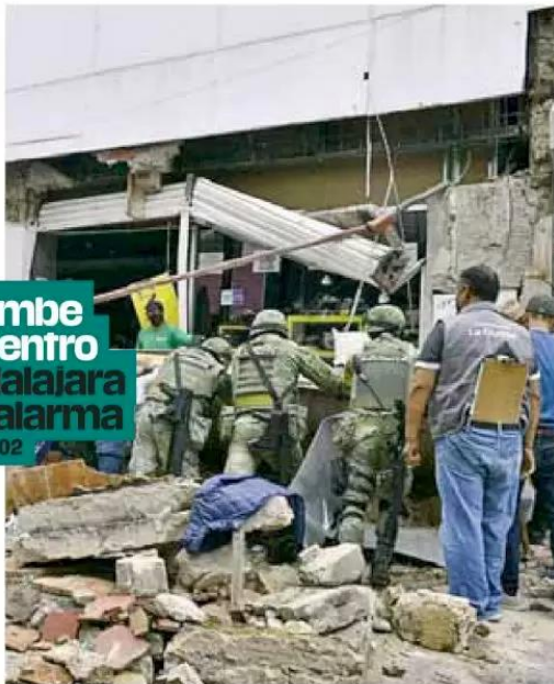
Operativo. El desplome de la marquesina de una zapatería, movilizó a bomberos y soldados; sólo una mujer resultó lesionada.