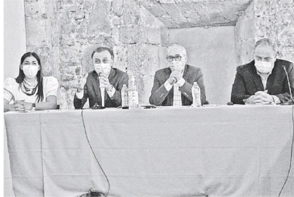
Autoridades detallan que por sexto mes consecutivo, el estado presenta números positivos en generación de empleo. VÍCTOR RAMÍREZ