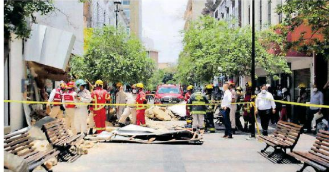
Elementos de Protección Civil llegaron para el rescate.

Aunque originalmente se creía que eran dos personas atrapadas bajo los escombros, finalmente sólo se confirmó que se trataba de una mujer de 40 años que