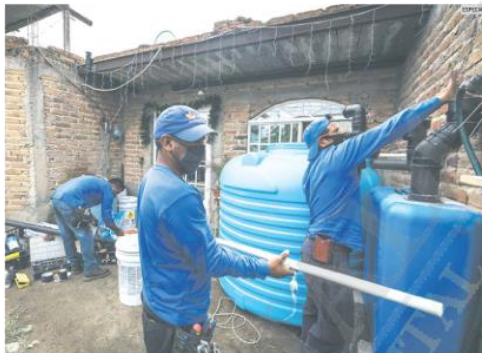
ARRANQUE. El programa piloto "Nido de lluvia" comenzó en 600 casas de la Mesa Colorada Poniente, en Zapopan. El Gobierno del Estado anunció que espera que su implementación proporcione agua a las familias hasta por seis meses al año.