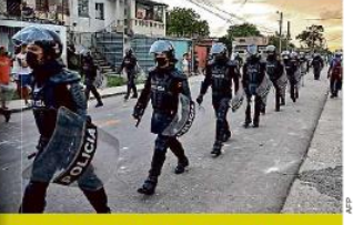
Detiene Cuba a opositores LA HABANA. Tras la histórica jornada de manifestaciones en Cuba, activistas denunciaron que al menos 114 personas están detenidas o no localizadas. INTERNACIONAL PÁG. 12

Anteriormente, el Ayuntamiento de Guadalajara preveía en su reglamento una forma de presionar al infractor foráneo a pagar la multa por omitir el pago de los estacionamientos; los inmovilizadores, pero ya no se utilizan.