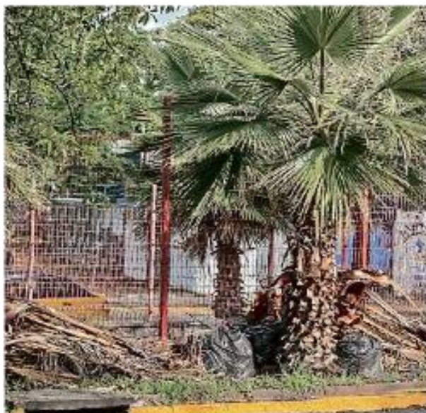
En el camellón de Normalistas abandonan de forma recurrente bolsas de basura y restos de árboles.

Recordó que para cualquier tipo de reporte que le compete al Ayuntamiento puede ser a través de la aplicación Ciudadapp o al número 070.