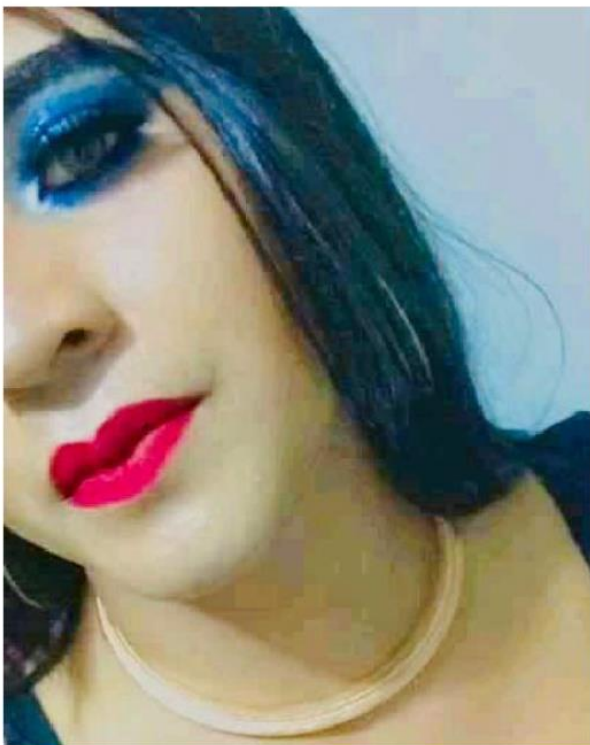
La joven de 18 años fue asesinada en junio.