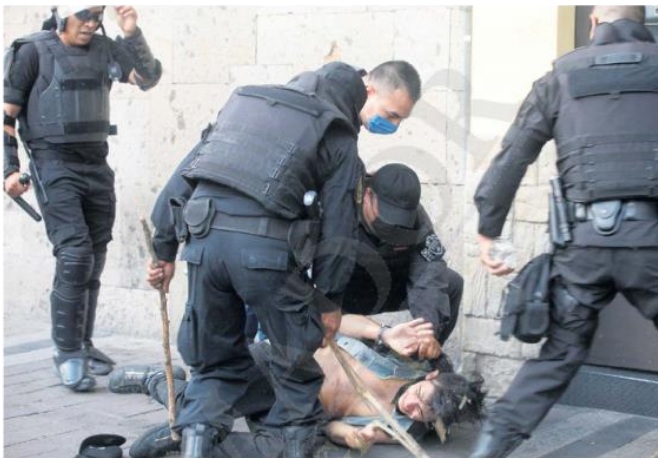
PANORAMA. Jalisco es líder nacional en casos de tortura, con 69 reportes entre enero y mayo pasados.