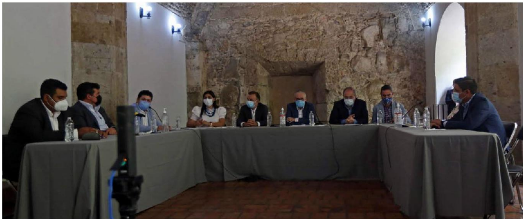
Autoridades estatales y municipales se reunieron para acordar acciones. FERNANDO CARRANZA