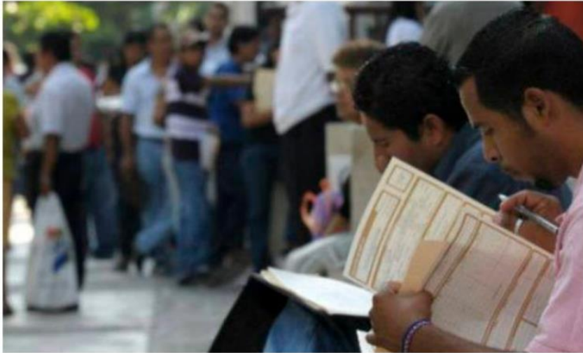
En Jalisco, con corte a junio de 2021, se registran 1,820,785 trabajadores en el IMSS.

do de la implementación del Plan Jalisco para la Reactivación Económica, con apoyos