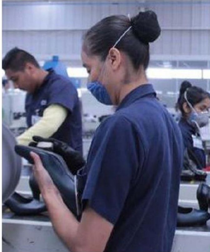
En Jalisco se han recuperado 78 mil empleos.

Por sexto mes consecutivo, la entidad presentó números positivos en la generación de empleo, ya que durante junio se crearon 5 mil 178 empleos