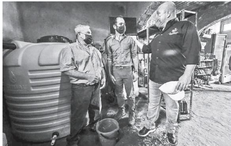
El Gobierno del Estado implementó el programa piloto para el abasto de agua en la Mesa Colorada.

Por eso el proyecto "Nido de Lluvia" es una apuesta en materia de abastecimiento