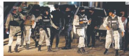
PROBLEMAS. Jalisco es de los Estados con más atrocidades, según Causa en Común.

“Es una tormenta perfecta para que todo esto prevalezca la forma en cómo el crimen organizado ha logrado doblar a las autoridades y a la ciudadanía, con la finalidad de seguir haciendo lo que les da la gana”.