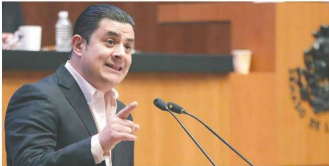
OTRO CARGO. El ex panista será diputado local de Morena en la próxima legislatura.