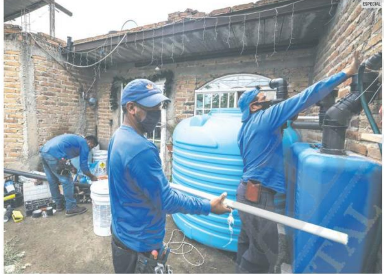
ARRANQUE. El programa piloto "Nido de lluvias" comenzó en 600 casas de la Mesa Colorada Poniente, en Zapopan. El Gobierno del Estado anunció que espera que su implementación proporcione agua a las familias hasta por seis meses al año.