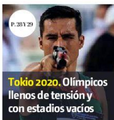
Tokio 2020. Olímpicos llenos de tensión y con estadios vacíos