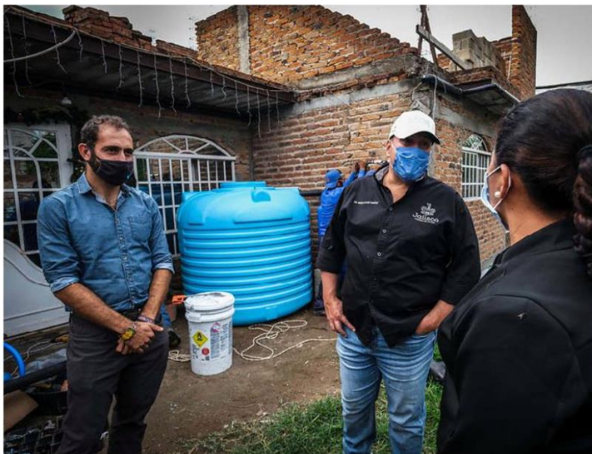
El gobernador acudió a la instalación en una vivienda en Zapopan.

El gobernador Enrique Alfaro Ramírez informó que en esta zona el desabasto de agua es recurrente por su ubicación en la parte alta de la ciudad que tiene décadas de falta de infraestructura por la urbanización irregular; además, este año tuvo mayor falta de agua por la