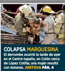
COLAPSA MARQUESINA El derrumbe ocurrió la tarde de ayer en el Centro tapatío, en Colón cerca de López Cotilla; una mujer resultó con lesiones. JUSTICIA PÁG. 4