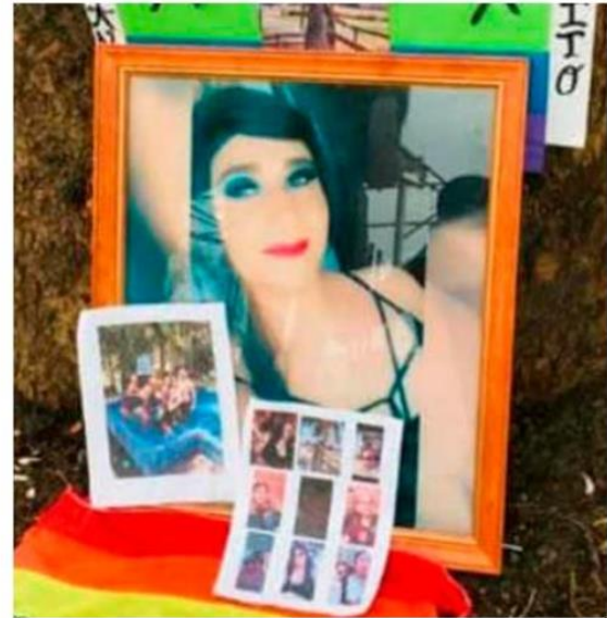
La asociación Unión Diversa Jalisco exige con urgencia atención al Gobierno de Jalisco para evitar los crímenes de odio que han aumentado.

“Levantamos la voz el día de hoy en el estado de Jalisco por