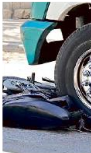
■ De enero a junio fallecieron 11 personas en accidentes con el Transporte Público.

Una de ellas fue la migración al modelo empresarial, lo que evita la competencia por el pasaje, y un cambio en la relación laboral con los conductores, que se han capacitado y sensibilizado.