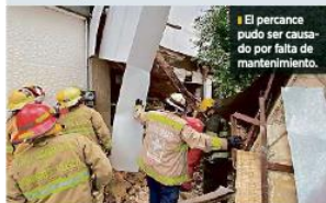
El paracaño pudo ser causado por falta de mantenimiento.

Las autoridades retiraron los escombros y demostraron el resto de la marquesina para eliminar riesgos, además, el negocio fue clausurado por Protección Civil.