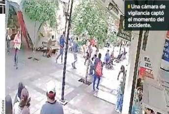
Una cámara de vigilancia captó el momento del accidente.