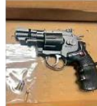
Entre lo asegurado había un revólver.

Uno tiene 26 años; otro, de 35, cuenta con cuatro registros de detenciones por delitos contra la salud y robo a negocio; el tercero, de 32, tiene un orden de reprobación por robo y seis