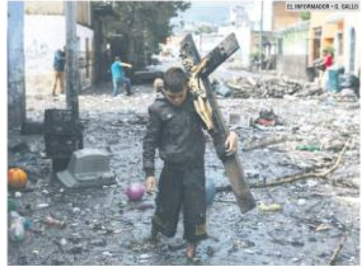
TRAGEDIA. Con una cruz a cuestas, un vecino de Paulina ayuda a buscar pertenencias que ve flotando entre los escombros en la Calle Costa Chica.