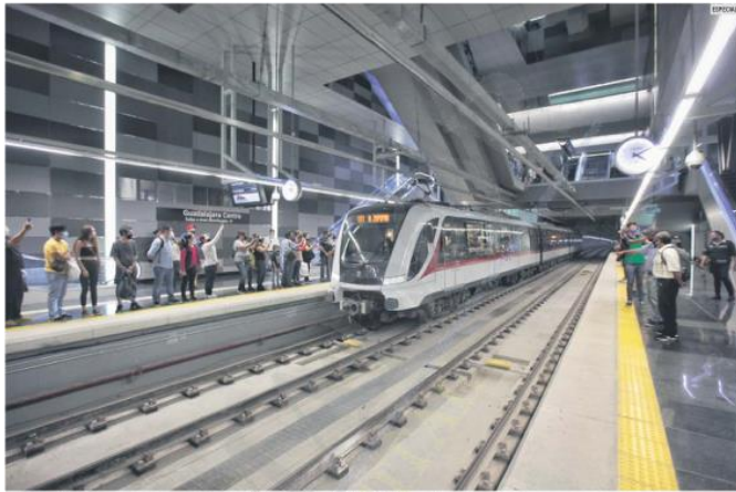
IRREGULARIDADES. Por anomalías detectadas en la planeación del gasto y trabajos de la L3, la ASF ha solicitado a la SCT investigar a servidores públicos.

A mediados de 2019, este medio reportó que la Dirección de Transporte Ferroviario y Multimodal confirmó que no había penalizaciones en contra de las contratistas por la ejecución y supervisión de obras, pese a que, por ejemplo, en 2018 se confirmó que se detectaron fallas en los neoprenos (amortiguadores) colocados en las columnas de los dos viaductos, los cuales debieron ser sustituidos.