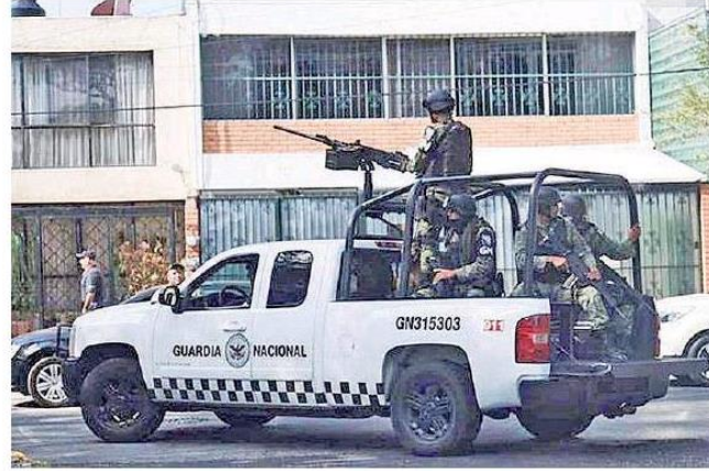
Un total de 15 estados pasan momentos difíciles.

Jalisco presenta semáforo rojo en homicidios, extorsión, feminicidio, robo de