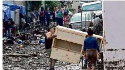
■ Esta familia sacó todos los muebles que tenían en la segunda planta del domicilio. Algunos vecinos ayudaron a cargarlos.