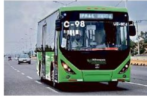
Son 16 camiones eléctricos que prestarán el servicio desde la Estación Periférico Norte de la L1, al Aeropuerto.

La Secretaría de Transporte ya tiene listos los 16 camiones eléctricos que entrarán al Aeropuerto Internacional de Guadalajara a dejar y subir pasaje.