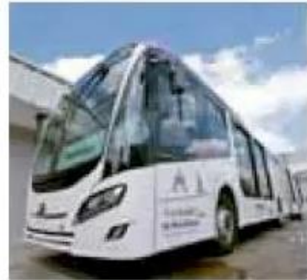
En proceso, la renovación de la flotilla.

“Ya está lista y en operación la Plataforma Mi Transporte, la extraordinaria noticia que tenemos con un convenio con Google Maps, a través de la operación Mi Transporte, podemos conocer el derrotero completo de las rutas de la ciudad, así como sus conexiones, esto jamás había existido en Guadalajara, hoy en la plataforma está la información completa y además en Google Maps tenemos una aplicación en este momento que nos permite planear viajes en el Área Metropolitana de Guadalajara, es entonces muy importante que por primera vez tendremos un sitio web en el que se puede consultar to-