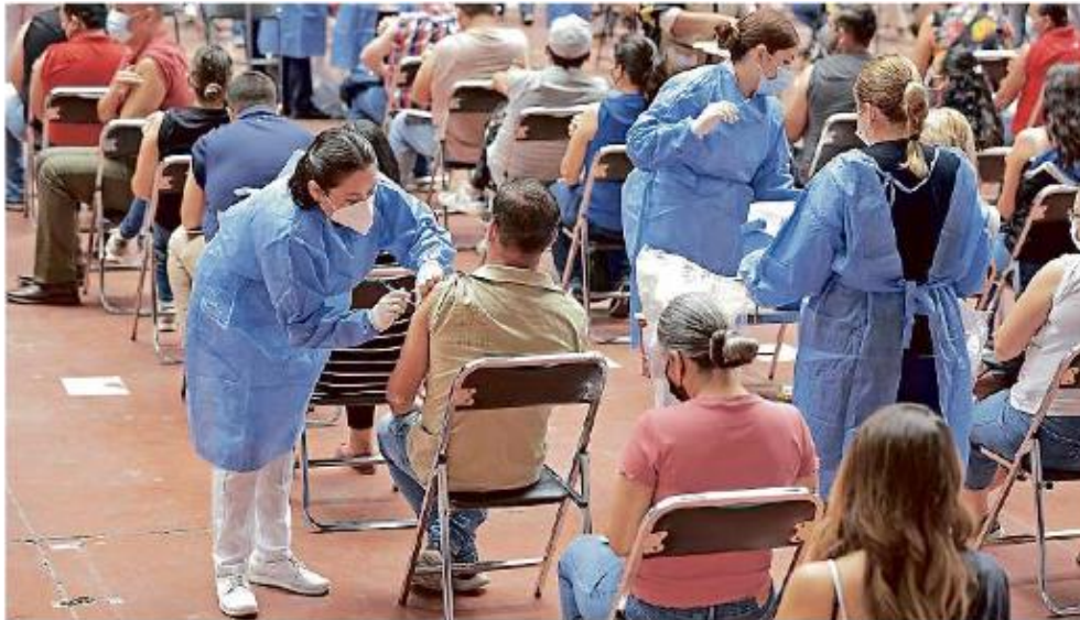
El Gobierno del Estado prevé que el próximo lunes arranque la inmunización para treintañeros en la zona metropolitana.

A partir de mañana pueden apuntarse para vacuna