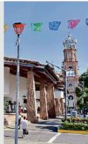
El Gobierno de Puerto Vallarta adeuda al Ipejal 466 millones 191 mil pesos que se supone retuvo a los trabajadores.

Uno de los argumentos que el Gobernador Enrique Alfaro expuso, al presentar una iniciativa para topa las pensiones en 106 mil pesos, era que había 87 jubilados que superaban los 100 mil pesos mensuales, lo que "compromete" las finanzas del Ipejal.