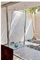
La explosión fue ocasionada por acumulación de gas en la casa.

Reporte extorsiones telefónicas ante la Fiscalía al 333-837-6000, extensión 16699, las 24 horas del día.