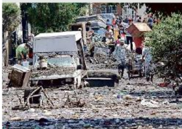
Cientos de familias perdieron todo el menaje.