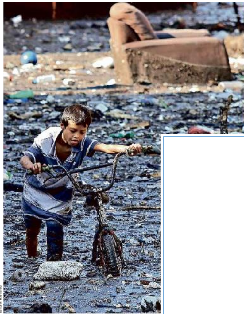
Tras desbordarse el arroyo, las calles en Arenales Tapatíos quedaron inundadas y llenas de lodo.

Además, es usado como depósito de residuos que van desde muebles, escombros, basura urbana, animales, entre otros, que dificulta el paso del agua cuenca abajo y contribuye a su desbordamiento.