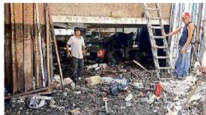
■ En la Calle Magnetita quedó un auto Dodge sepultado en el lodo, en la cochera de una casa, tras la lluvia del domingo.