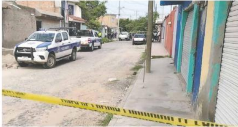
MULTIHOMICIDIO. La comandante y otras tres personas fueron asesinadas en calles de la colonia Santa Rosa del Valle.

“Ya estaba lista para iniciar sus actividades. Ya traía su equipo y todo, desgraciadamente el número