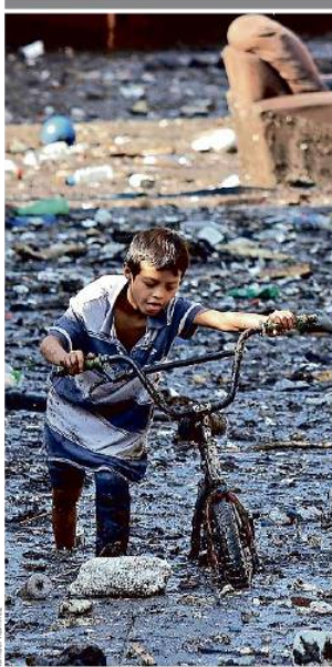
Tras desbordarse el arroyo, las calles en Arenales Tapatíos quedaron inundadas y llenas de lodo.