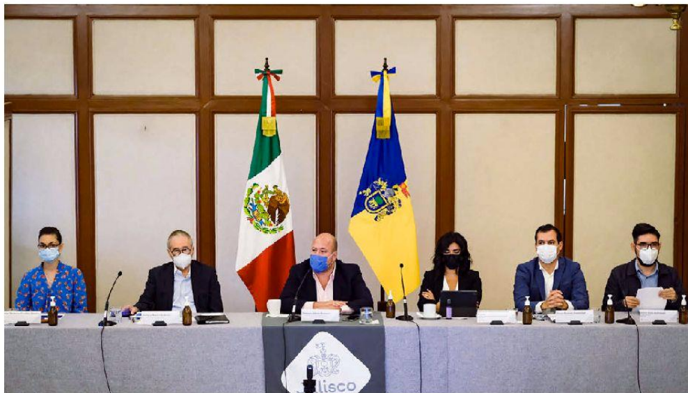
Las autoridades estatales ofrecieron ayer una rueda de prensa en Casa Jalisco.