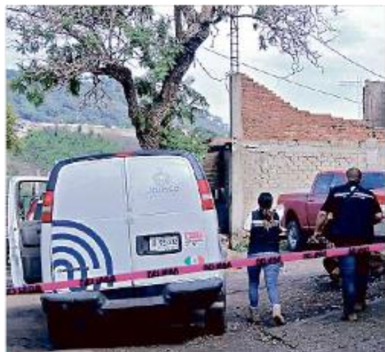
Entre los crímenes registrados el fin de semana estuvo el hallazgo de un hombre sin vida, en Zapopan.