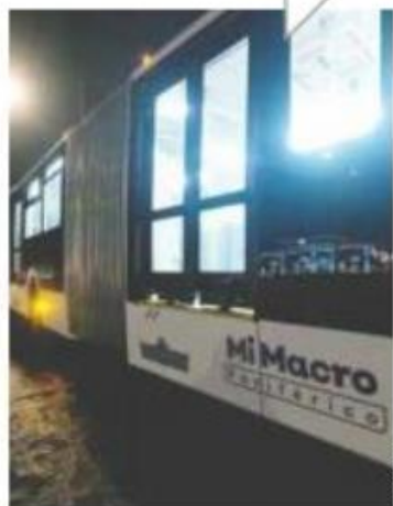
BRT. El sistema de pago se implementará con MiMacroPeriférico.

ENRIQUE ALFARO RAMÍREZ GOBERNADOR DE JALISCO