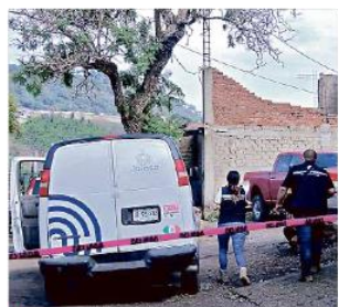
Entre los crímenes registrados el fin de semana estuvo el hallazgo de un hombre sin vida, en Zapopan.

El fin de semana se registraron 20 homicidios, según el Gobierno Federal