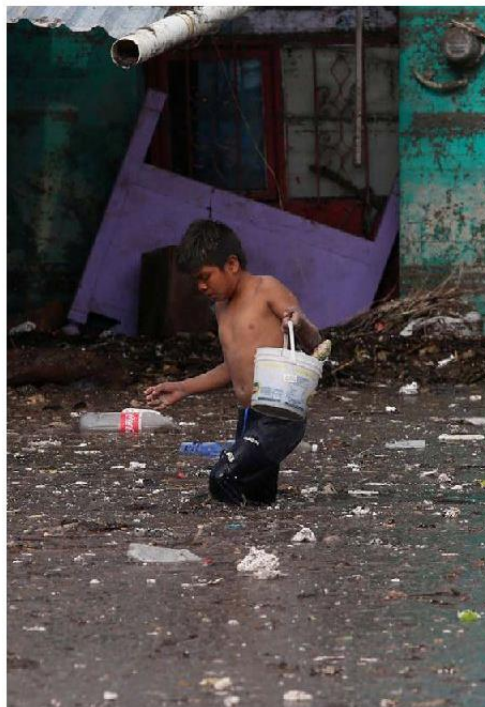
Prometen dotar de muebles a damnificados.