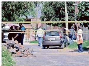
La comandante y otras tres personas fueron asesinadas ayer en la Colonia Santa Rosa del Valle.

Las circunstancias en que los integrantes de las corporaciones de seguridad han si-