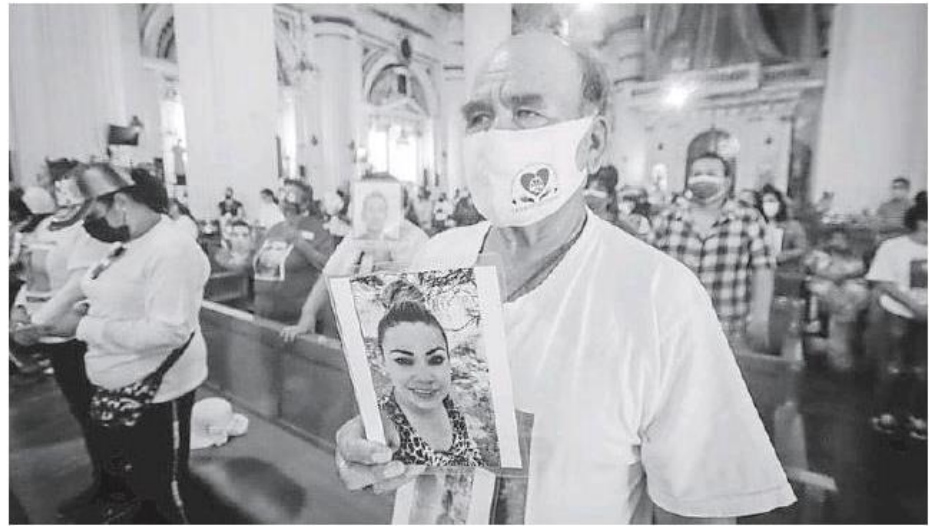
Una oración por las personas desaparecidas.

Uno de esos amigos apareció un día en su casa. Platicaron por horas y una vez que terminaron, el muchacho salió a despedirlo, pero pasaron los minutos, luego más de una hora y ante la sospecha de que algo no estaba bien, la