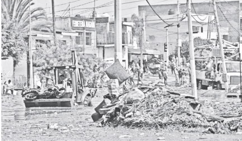
Debastador lucía el panorama en la zona; lodo y basura era el principal escenario.