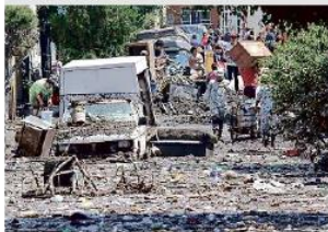
Cientos de familias perdieron todo el menaje.

El camión tendrá como terminal la Estación Periférico Norte de la Línea 1 del Tren Ligero, se va por todo el Anillo Vial hasta Colimilla,