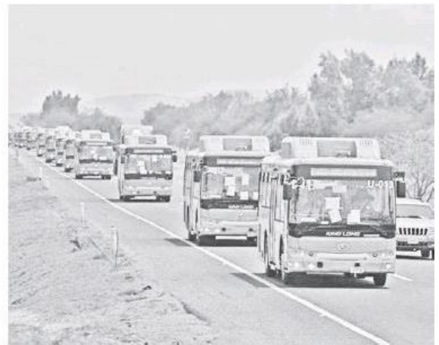
A partir del primero de agosto entrará en operación la ruta rumbo al aeropuerto.

Además se facilitará el sistema de pago del pasaje en el transporte público.