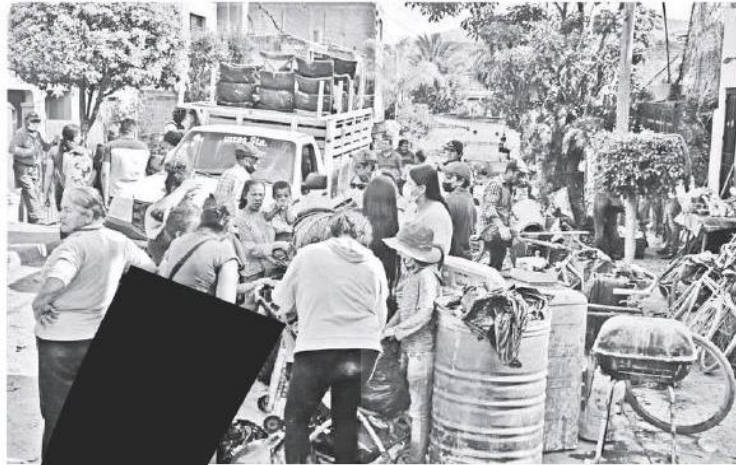
Familias enteras lo perdieron todo.

Fue una pérdida total porque ya nuestra casa se está cuarteando horrible