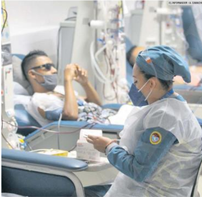
SANEFRO. Las clínicas cuentan con 335 enfermeros especializados, 41 médicos generales, 31 nefrólogos y cerca de 700 máquinas cicladoras.

Además, actualmente SANEFRO atiende a cuatro mil 500 pacientes en todas sus clínicas, de ambos tipos de tratamientos.