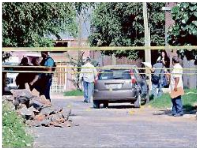
La comandante y otras tres personas fueron asesinadas ayer en la Colonia Santa Rosa del Valle.

Las circunstancias en que los integrantes de las corporaciones de seguridad han si-