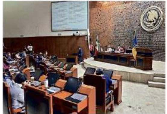
■ El gasto en nómina del Congreso de Jalisco se ha incrementado un 34 por ciento.

Y por otro, advirtió que fue necesario recurrir a contratar más personal supernumerario para el trabajo de los legisladores.