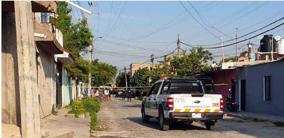
El multihomicidio ocurrió en la colonia Santa Rosa del Valle, en el municipio de El Salto. JUAN CARLOS MUNGUÍA

Jornada violenta. Atacan a la elemento municipal y tres personas más en El Salto; seis hombres fueron agredidos a balazos en diferentes hechos ocurridos en San Pedro Tlaquepaque, Guadalajara y Tonalá