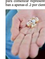
En 2020 fueron atendidas 7 mil 70 personas por adicciones en Jalisco.

PROCESAN A SUJETO POR DESAPARICIÓN Anusado por la desaparición de un hombre ocurrida el 20 de abril, en Tonalá, Jesús Manuel "N" o Manuel "N" fue detenido y enviado a prisión preventiva por un año. Un juez resolvió el caso y vinculó a proceso al sujeto por el delito de desaparición cometida por particulares. Staff