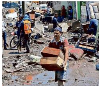
■ Vecinos de la calle Costa Chica entre las calles Puerto Galileo y Puerto Chamela rescataron algunas pertenencias.

MURAL publicó que, según cifras del Ayuntamiento de Zapopan, 275 viviendas resultaron afectadas, por lo que se declarará la emergencia en la zona para acceder a los apoyos estatales.