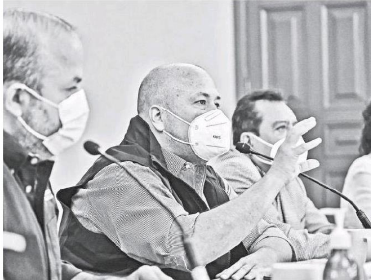
El Gobernador aseguró que por el momento no hay suspensión de ninguna actividad económica.

Además también se determinó que las Fiestas de Octubre no se realizarán porque, desde su punto de vista, estas festividades son asuntos que no son necesarios realizar concentraciones masivas para