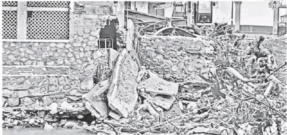
Puerto Vallarta , uno de los municipios más afectados.

La declaratoria obedece a la petición realizada por el Gobernador emitida el pasado 4 de septiembre.