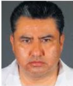
Naasón Joaquín García, líder de la Luz del Mundo.

Naasón Joaquín García iniciará su juicio que enfrenta en California, Estados Unidos, hasta el 9 de mayo de 2022, en un nuevo aplazamiento que logró su equipo legal, según informes de la cadena Univisión.