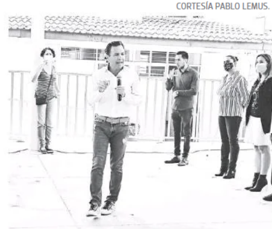
Pablo Lemus, alcalde electo de Guadalajara.

El todavía presidente municipal de Zapopan, que en junio pasado ganó la elección para gobernar Guadalajara, aseguró que el municipio tapatío puede reducir su cantidad de empleados, sin que eso afecte a los ciudadanos. “Toda la base de la pirámide, trabajadores que estén en Parques y Jardines, Mantenimiento Urbano, Aseo Público, Alumbrado, Bacheo, todos esos tienen asegurado su trabajo, que no se preocupen, donde vamos a hacer un recorte importante es en los niveles salariales que están entre 25 y 60 mil pesos, que