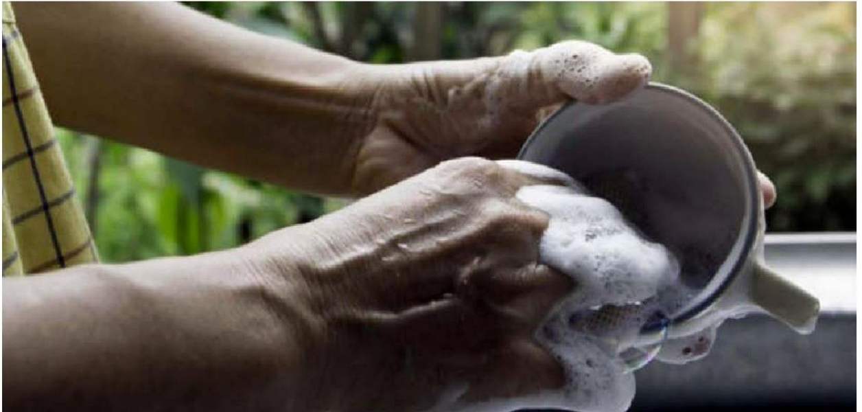
Quienes se integran al mercado de trabajo lo hacen "en condiciones muy desfavorables", ya que "su retaguardia, la situación en el hogar, no está cubierta. ESPECIAL