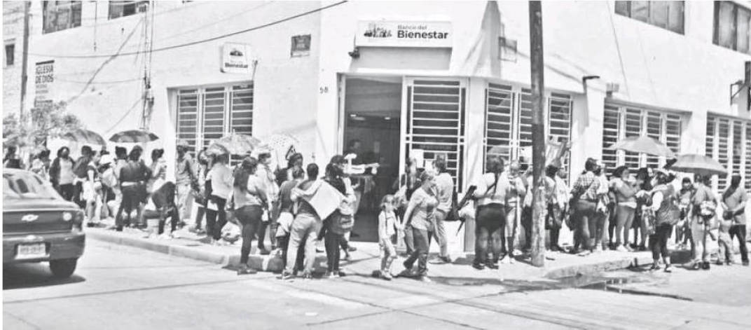
Largas filas se pudieron apreciar en el Banco Bienestar de Tlaquepaque.