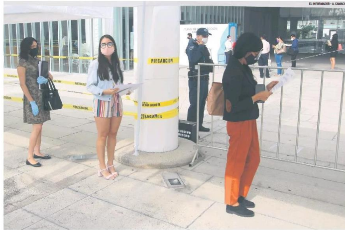
ENFERMOS. En el Poder Judicial hay tres juzgadores contagiados del nuevo coronavirus.

"En Jalisco sí es obligatorio para nosotros acudir a las escuelas".