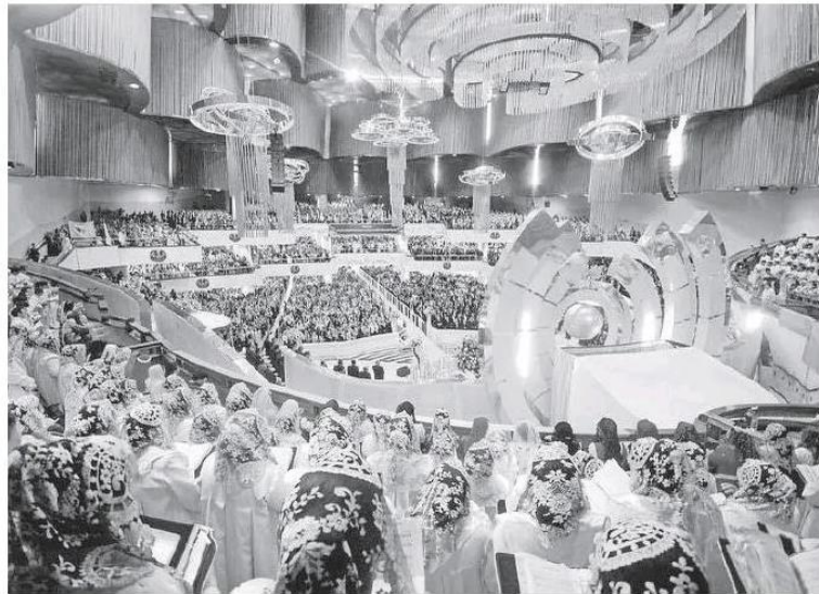
Los fieles de la iglesia confían en la inocencia de su pastor.

"Confiamos en que, una vez concluido el caso, se demostrará la inocencia del