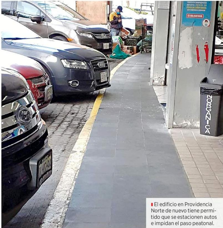
El edificio en Providencia Norte de nuevo tiene permitido que se estacionen autos e impidan el paso peatonal.

Además, el mismo recurso legal establece que no se podrá clausurar o desaparecer los espacios, impidiendo que el Ayuntamiento de Guadalajara pueda intervenir para futuras suspensiones, pues se les permitirá el uso para los vehículos.