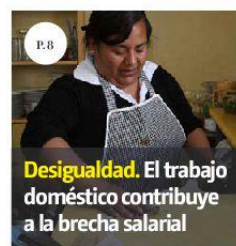
Desigualdad. El trabajo doméstico contribuye a la brecha salarial

propios de la relación bilateral, declaró el embajador Ken Salazar, en respuesta a la petición de Andrés Manuel López Obrador a Washington. PÁGS. 14 Y 15