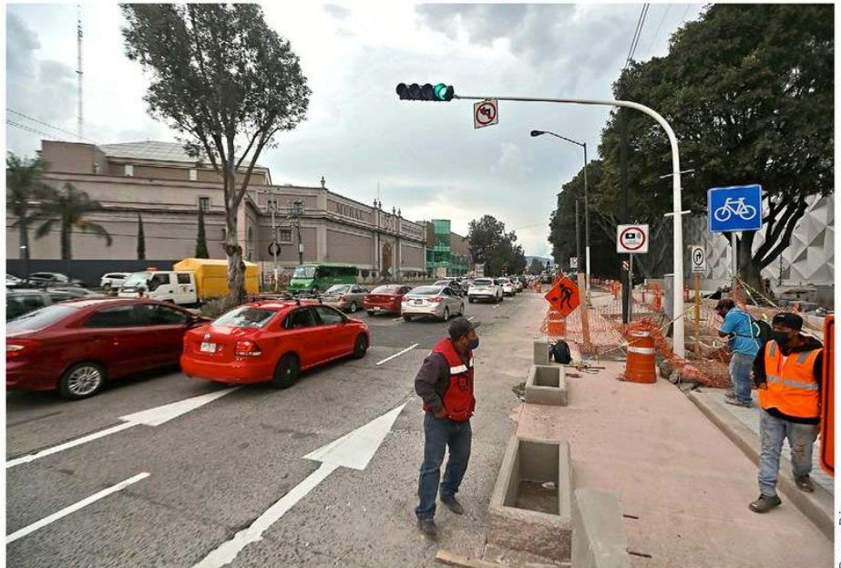
El acceso al centro comercial tomará parte del carril derecho de Mariano Otero.

Además, aunque aún no está inaugurada, la construcción ya provoca caos vial y