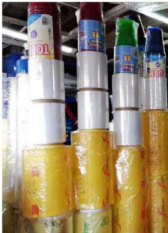
La demanda de este material se disparó por la pandemia. ESPECIAL

Los principales subsectores manufactureros, con base en su participación en la producción del estado, el subsector que ha tenido un mayor crecimiento absoluto anual en producción ha sido el de las industrias metálicas básicas con una variación anual de 30.5 por ciento, seguido de la industria química que creció 4.7 por ciento a tasa anual y la industria de las bebidas y del tabaco que aumentó anualmente 3.7 por ciento. ■