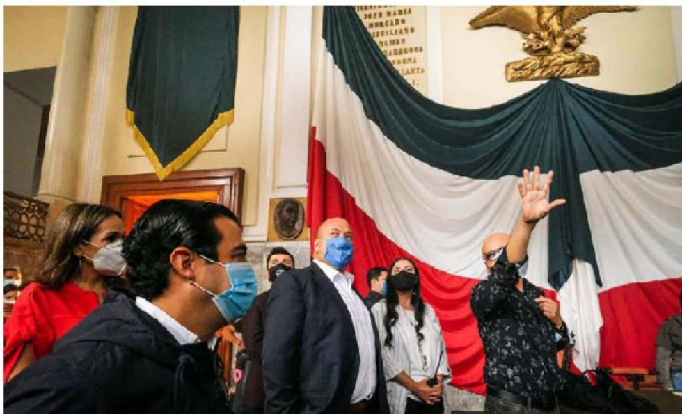
Enrique Alfaro en Palacio de Gobierno.