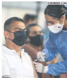
REZAGO. En el Gobierno estatal y Ayuntamientos desconocen el porcentaje de vacunación de la burocracia.

Las que sí contestaron fueron la Secretaría de Gestión Integral del Agua, con seis trabajadores, de los cuales "cuatro ya tienen la aplicación de la primera dosis de la vacuna y dos con la segunda dosis; la Secretaría de Transporte, con 31% de su personal con la primera dosis y 45% con el esquema de vacunación completo; la Secretaría de Infraestructura y Obra Pública registra el 68% de los trabajadores vacunados, así como el 88.58% de los empleados de la Secretaría de Turismo ya están inoculados, que representan el porcentaje más elevado.