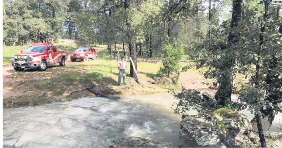
TRAGEDIA. Elementos de Protección Civil encontraron el cuerpo del bebé en el cauce del río en la comunidad de Chonacata.

Por otra parte, las lluvias registradas la madrugada ayer provocaron daños en 21 ca-