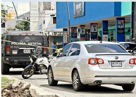
El conductor fue retenido por policías estatales.