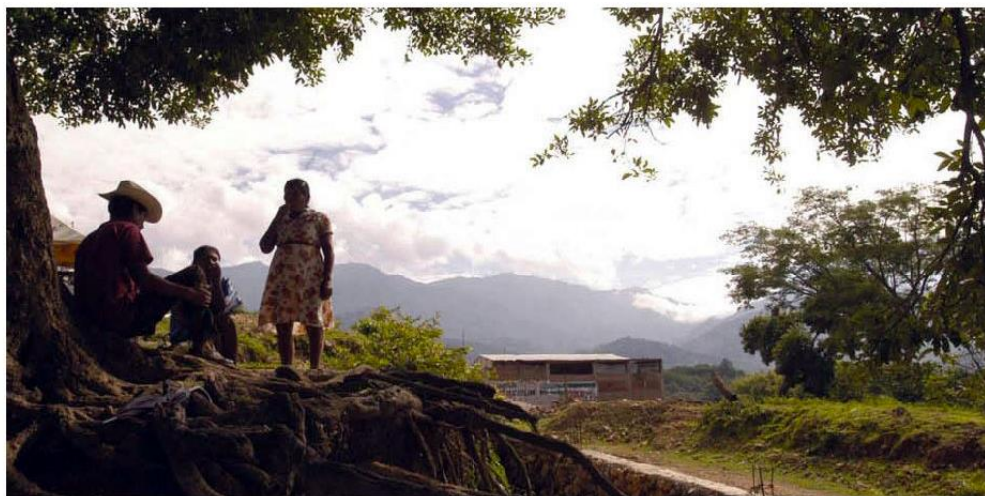
En su estancia en la sierra ha "movido aguas" inconvenientes.