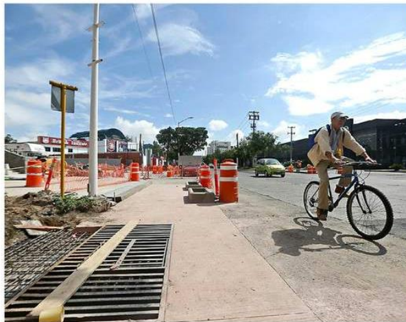
La construcción del acceso a Distrito La Perla ocasiona tráfico en la zona.

embotellamientos para los automovilistas que transitan la zona, debido a la reducción de cuatro a tres carriles. “Todavía no abren y ya se