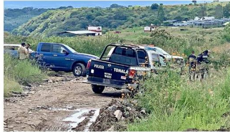
En la zona de las Siete Cascadas, a un kilómetro del Nuevo Periférico, fue localizado un hombre muerto.

Por protocolo, los oficiales llamaron a los paramédicos y estos confirmaron el