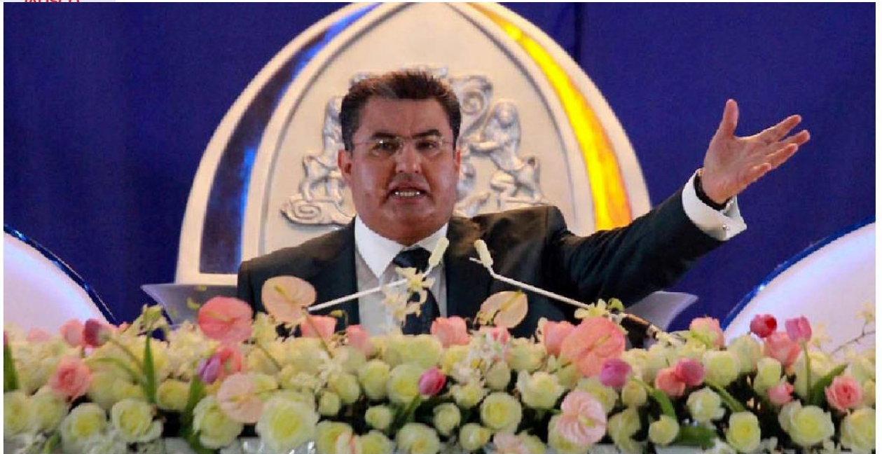
El conocido como Apóstol de Jesucristo fue detenido el 4 de junio de 2019, tres semanas después de ser homenajeado en el Palacio de Bellas Artes de la CdMx. ESPECIAL