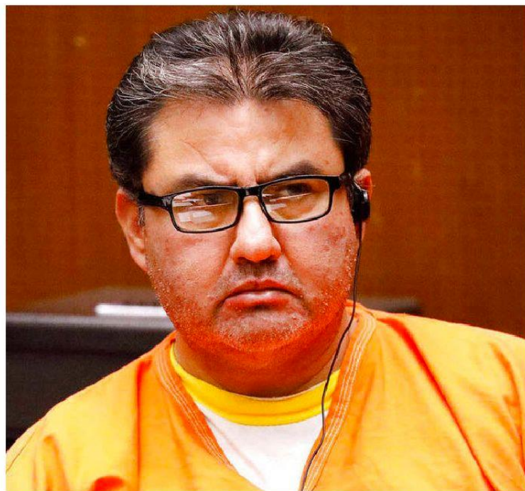
El líder religioso fue detenido el 4 de junio de 2019.