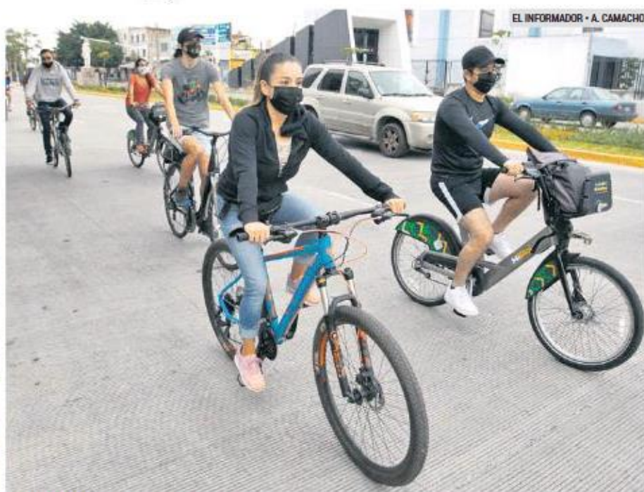
RODADA. Participaron unos 30 ciclistas.

“El plan necesita ser pensado en el contexto de la coordinación que, entre otras cosas, tiene una visión metropolitana de los nueve municipios. Conectar las partes periféricas que