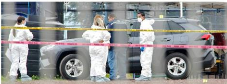
En la Colonia Azahares fue asesinado a balazos un hombre.

La agresión ocurrió a las 10:47 horas, cuando la víctima detuvo su Toyota RAV-4 en una zona donde hay restaurantes y un campo de fútbol en la Calle De Los Azahares, entre De las Violetas y la Avenida López Mateos.