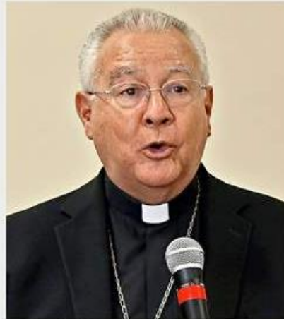
■ Cardenal Francisco Robles Ortega

“Esta marcha tiene como lema: A favor de la mujer y de la vida. Y tiene como finalidad manifestar el aprecio y protección de la vida humana de la mujer y de su hijo en toda circunstancia”, dice parte del aviso que debe ser leído en las misas.