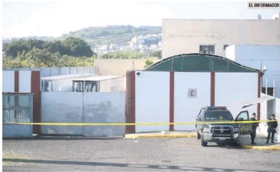
HACE CASI TRES AÑOS. Imagen del 20 de septiembre de 2018.

“Lo que usted señala en medios es totalmente distinto a lo que sus Ministerios Públicos señalaron en la audiencia de imputación, demostrando un desorden, así como la consigna que tienen de vincularme a proceso ‘haiga sido como haiga sido’, de manera coordinada entre usted y los ile-