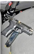
Autoridades localizaron un arma en el auto.

Las autoridades revisaron el vehículo y hallaron un arma, aunque no se precisó oficialmente si la portaba el agente estatal o si la dejó uno de los agresores.