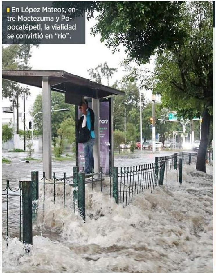
En López Mateos, entre Moctezuma y Popocatepetl, la vialidad se convirtió en "río".