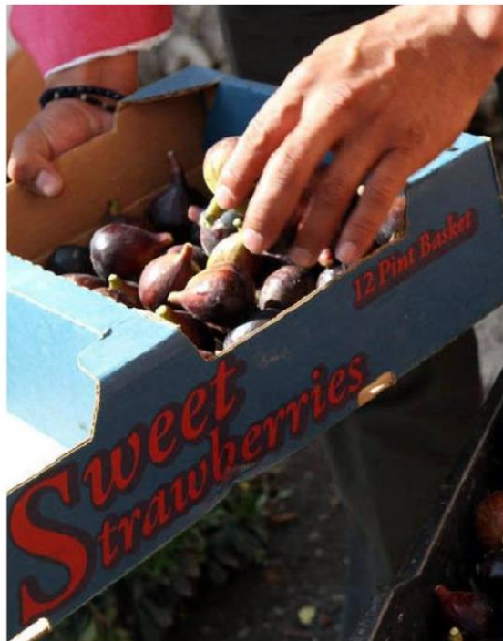
Santa Anita fue el primer poblado en sembrarlo.

“Aproximadamente 600 toneladas exportó Jalisco el año pasado, en realidad es poco porque las huertas son mejores y las superficies muy poca, pero la idea y la demanda mundial es mucho. Estamos hablando de miles de toneladas, por ejemplo, Estados Unidos tiene una demanda de más de 50 mil toneladas anuales, hay una demanda mundial muy grande y el potencial productivo del estado es bastante amplio, creo que es muy interesante para Jalisco, porque es un cultivo de alto valor de-