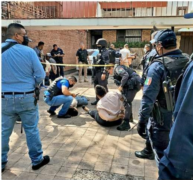
■ En Chapalita fue desarticulada una célula de 33 integrantes, entre los que había dos menores de edad.

En el documento se explica que se le daba segui-