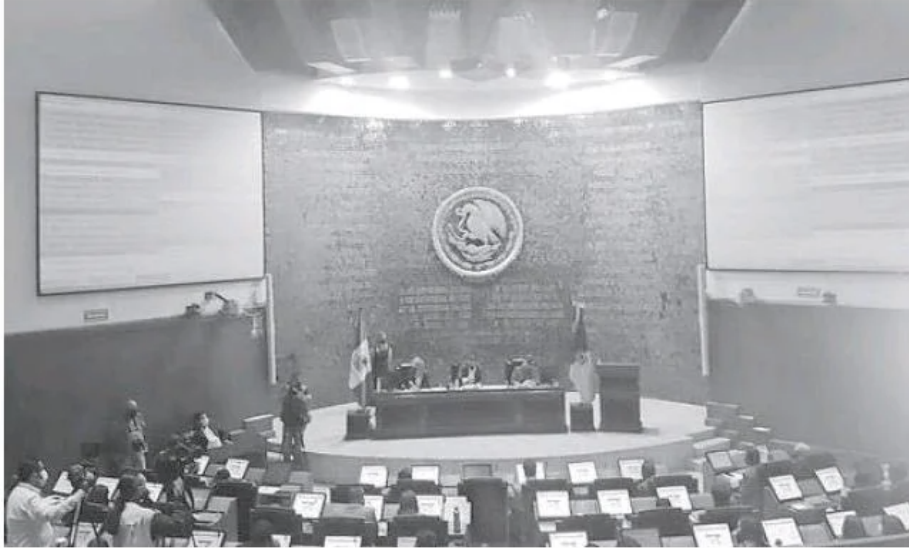
La votación en la sesión del Congreso de Jalisco.