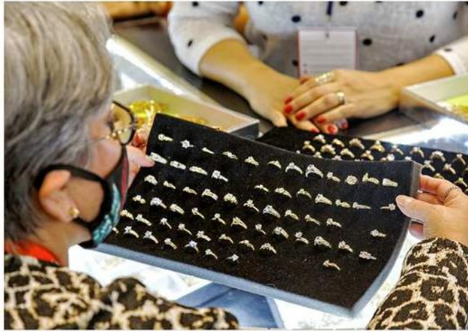
■ Expo Joya se realizará del 5 al 7 de octubre.

“Estamos contentos porque nuestra recuperación económica en este sector representa un 90 por ciento a como hemos caminado, el hecho de poder hacer esta exposición, que representa hasta un 30 por ciento de las ventas anuales para industriales joyeros”, indicó.