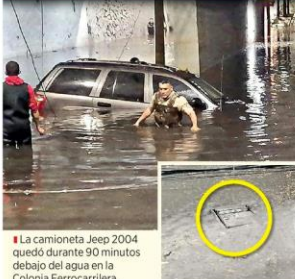
La camioneta Jeep 2004 quedó durante 90 minutos debajo del agua en la Colonia Ferrocarriera.