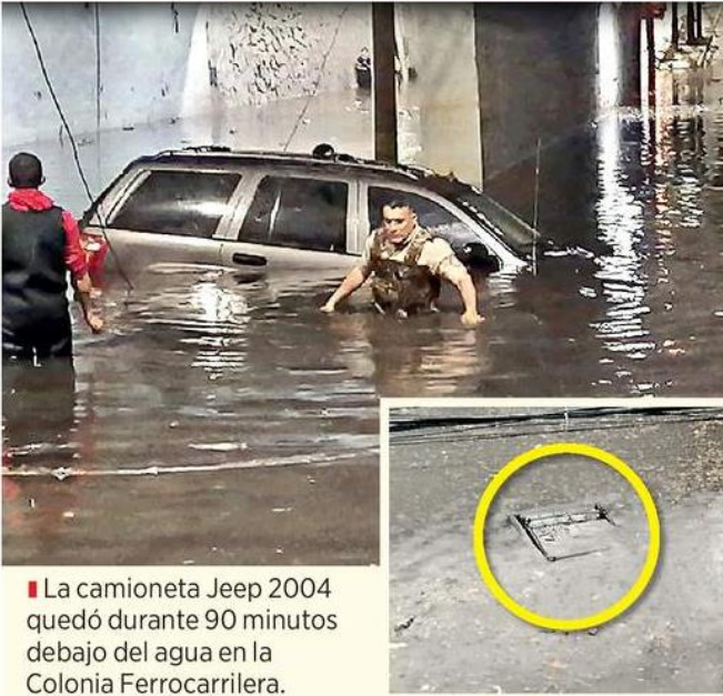
La camioneta Jeep 2004 quedó durante 90 minutos debajo del agua en la Colonia Ferrocarrilera.