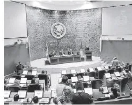
Congreso de Jalisco.

por lo que la CNDH exhorta al Congreso Estatal a que se analice la propuesta del Gobernador del Estado de Jalisco sin vulnerar el carácter de autonomía que tiene este organismo ciudadano.