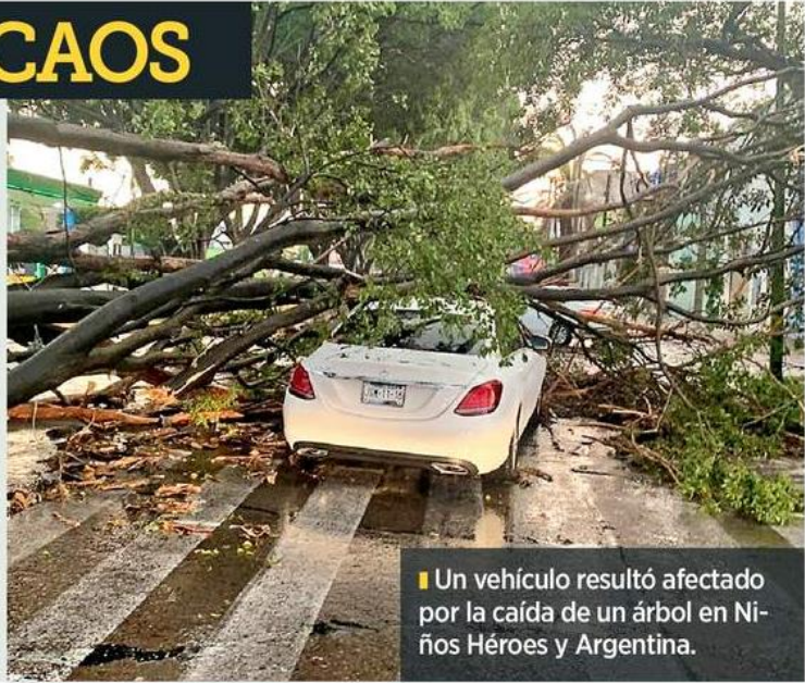
Un vehículo resultó afectado por la caída de un árbol en Niños Héroes y Argentina.

El Macrobus suspendió el servicio de manera temporal. Pasajeros también reportaron goteras en estaciones de la Línea 3 del Tren Ligero.