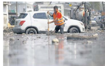
DAÑOS. Las lluvias han provocado el desbordamiento de ríos en la ciudad, afectando a colonias de Zapopan principalmente (daños por el arroyo "El Seco").

Respondió que la información no la tiene clasificada de esa manera. Ofreció consulta directa para revisar expedientes que "podrían arrojar información relacionada con lo que se solicita".