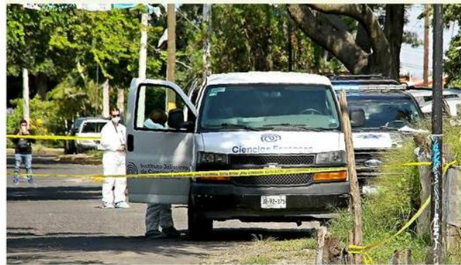
El cadáver de un hombre fue encontrado en Miravalle.

En ninguno de los casos se reportaron detenidos.