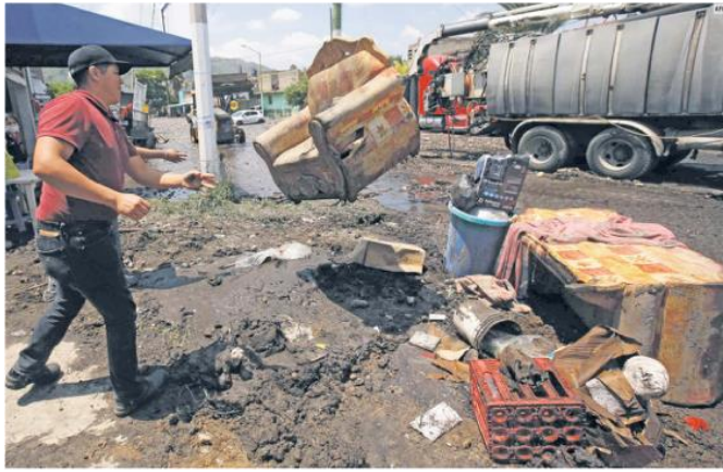
SALDO. Entre enero de 2020 y agosto pasado, en Zapopan, Tlaquepaque, Tonalá y Tlajomulco han emitido tres mil 755 apercebimientos a los inmuebles en zonas de riesgo por inundaciones y deslaves.

"Una vez que se hizo el 100% del levantamiento, nos arrojó que tenemos alrededor de tres mil 157 viviendas que sufrieron daño en el menaje de sus casas, que lo que estaríamos entregando a partir de esta semana para poderles reponer sus pérdidas de camas, refrigeradores, sillas o estufas... todo lo que se considera menaje de casa", detalló.