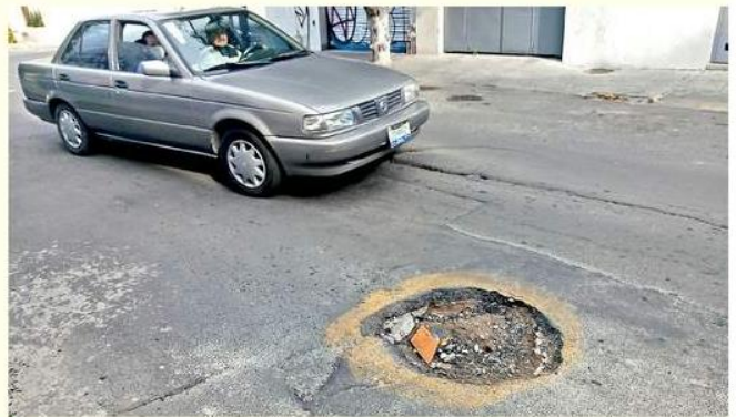
■ Vecinos han señalado con pintura amarilla los baches a la altura de Gregorio Dávila.

Vecinos y locatarios consultados refirieron que aunque las autoridades acuden en ocasiones a tapar los socavones que se generan, estos vuelven a surgir, lo que provoca que la calle quede desnivelada y con grava suelta. Coincidieron en que este problema se agrava en el temporal.