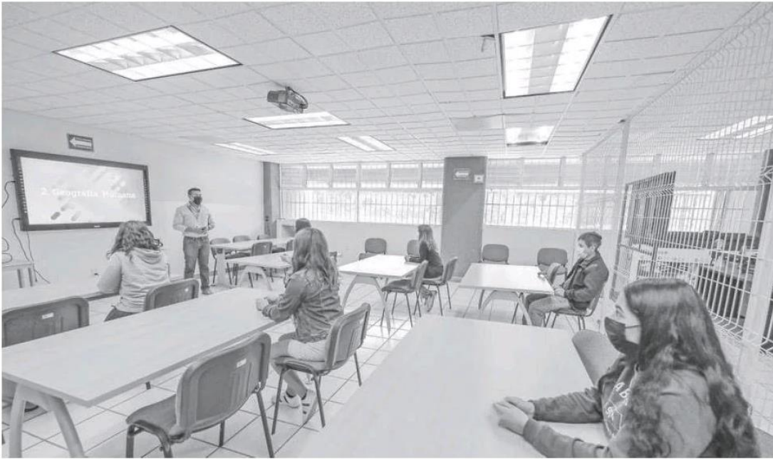
Los salones universitarios dispondrán de aditamentos para control sanitario.

Reconoció a todos los trabajadores de la Universidad de Guadalajara como se reconvirtieron y un plan educativo hecho para la presencialidad rápidamente se transformó en virtual. "Asumimos el reto