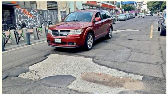
■ Entre Avenida Chapultepec y Andrés Terán la calle requiere mantenimiento total.