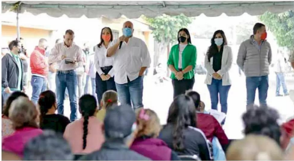
Prevención. El gobernador Enrique Alfaro señaló que se realizarán obras para prevenir nuevas inundaciones.

Damnificados. Los cheques fueron entregados a habitantes de 8 colonias que lo perdieron todo al desbordarse un canal en el municipio. / Pág. 02