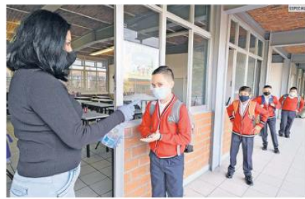
ESTUDIOS. Hasta el momento, expertos recomiendan vacunar a los menores de entre 12 y 17 años.

La Comisión Federal para la Protección contra Riesgos Sanitarios (Cofepri) dictaminó que es procedente la modificación a las condiciones de la autorización para el uso de emergencia de la vacuna Pfizer, ampliando la indicación terapéutica para la aplicación a partir de los 12 años.