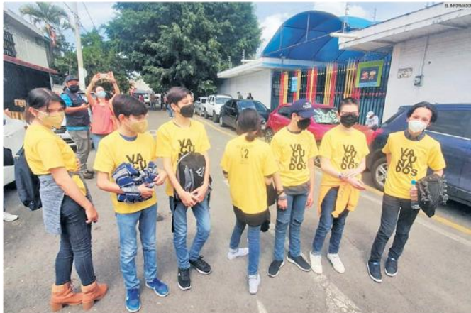
AVANCE. Al cierre de la semana pasada, en cinco Estados se han aplicado vacunas a menores de 17 años, como Jalisco.

Página de Mi Vacuna: http://mivacuna.salud.gob.mx