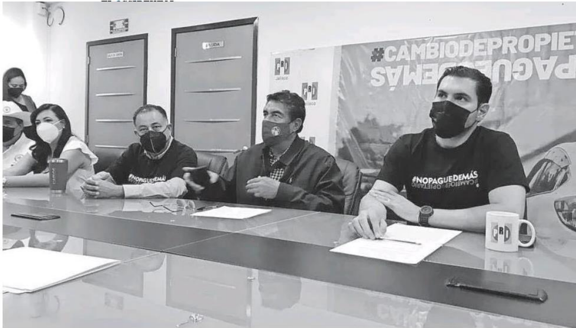
La dirigencia del PRI Jalisco en rueda de prensa.