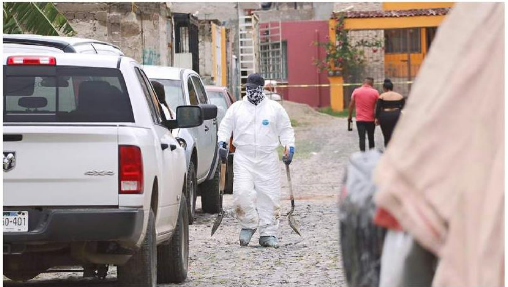
Entre enero y agosto fueron descubiertas 17 fosas clandestinas en Jalisco.

“Los Registros Estatales son herramientas que contie-