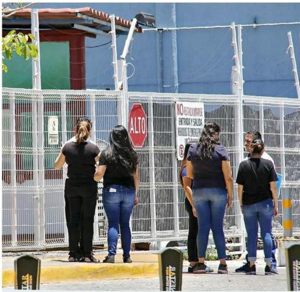
Los dictámenes de identificación de personas en el IJCF se desplomaron 65 por ciento en 2021.