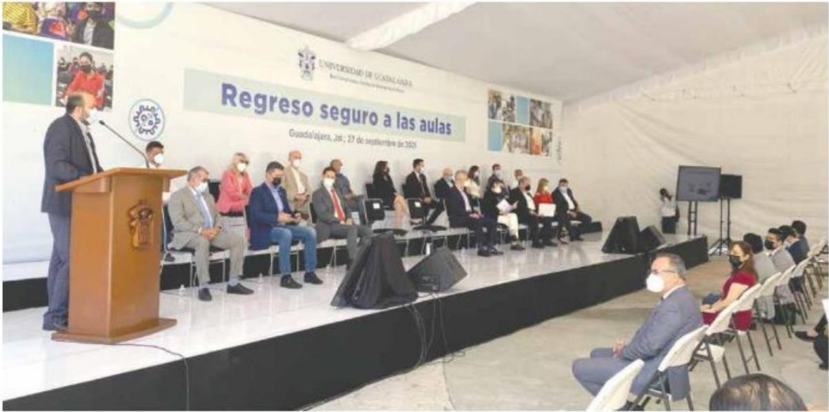
APERTURA. El rector adelantó que desde esta semana reabren los laboratorios y talleres.