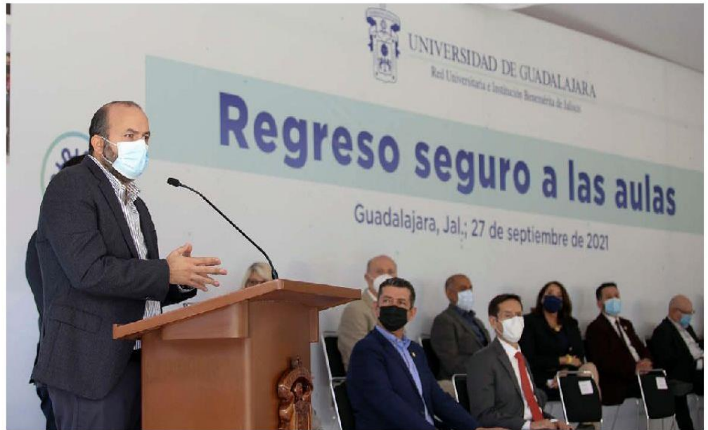
Ricardo Villanueva Lomelí dio a conocer el protocolo para el regreso a los salones de clases.

El cuarto punto es la creación del Protocolo de Regreso Seguro para covid-19, en el que se verificará que las aulas y espacios cumplan con las medidas de ventilación; quinto, cada plantel tendrá brigada