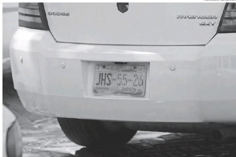
Circulan vehículos con placas de otros estados.

"Un auto con placas de otros estados genera una infinidad de problemas sociales para el gobierno y para la sociedad en general... Vamos a comenzar a reunir firmas a todas las personas que se quieran sumar, que quieran tener sus papeles ordenados", informó el diputado local, Ma-