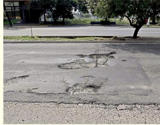
■ El temporal dejó muy dañada Avenida Mariano Otero en el tramo de López Mateos a Las Rosas.

Sobre Mariano Otero, afuera de los establecimientos El Pipiolo, Elektra y a la altura del Hotel City Express, son otros de los tramos de la vialidad con más daños.