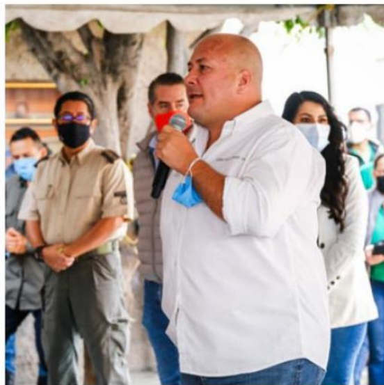
Enrique Alfaro entregó apoyos a 689 familias por un monto general de más de 20.6 mdp para reposición de enseres domésticos dañados por la tormenta del pasado 3 de septiembre en 8 colonias del municipio.

El monto total de la inversión del FOEDEN en Tlaquepaque asciende a 20 millones 696 mil 130.78 pesos que serán destinados para la reposición del menaje de casa dañado en los hogares, de los cuales, el 80 por ciento fue aportación estatal a través del FOEDEN, y el 20 por ciento restante por el municipio.