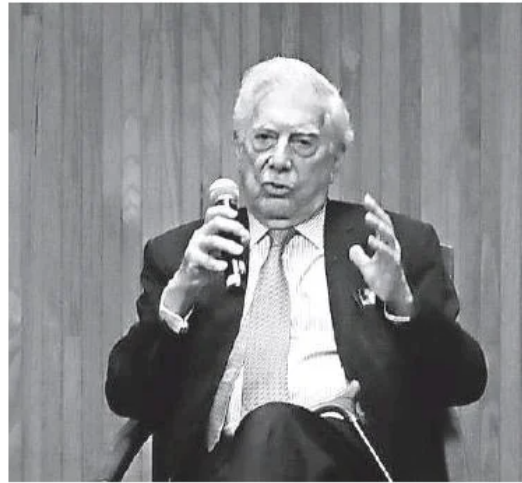
Duras palabras del escritor Mario Vargas Llosa.

Ejecutivo Estatal, cuando se ha negado a ceder a las presiones y ha sostenido que todas las decisiones sobre la pandemia de Covid-19, deben privilegiar la salud y la vida.