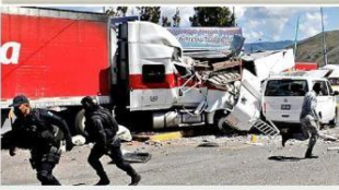
El saldo del enfrentamiento fue de 22 heridos, 14 de la Guardia Nacional y ocho policías estatales.

camión que hablaban secuestrado portaban decenas de piedras. Al percatarse de ello los agentes intentaron retirarlos del lugar y se desató un fuerte enfrentamiento donde los agentes utilizaron gases lacrimógenos y los jóvenes lanzaron petardos y las piedras. Cuando los estudiantes ya casi se retiraban, bajaron al conductor de un tráiler y lo pusieron en punto muerto para que se fuera contra las fuerzas policíacas. El tráiler se fue a estrellar a un módulo de información turística que está metros después de la caseta en el carril norte sur.