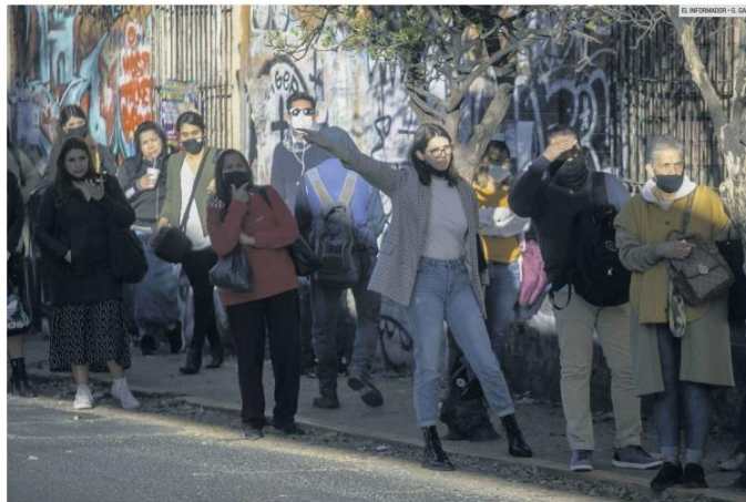
INCÓMODA ESPERA. Algunos derroteros están saturados por la poca cantidad de unidades que operan durante las horas pico.

El resto usó la bicicleta, unidades de transporte de personal, mototaxis, el sistema de MiBici y camioneta comunitaria. "Las medidas adoptadas en el transporte público fueron vistas como insuficientes para el 88.2% de las personas usuarias", se destaca en la encuesta.