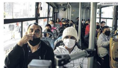
RIESGO LATENTE. El transporte público es un lugar en el que el riesgo de contagio de COVID-19 es alto.

Nuevos Continúa la renovación de las unidades, teniendo una meta de mil 674 camiones. "Hasta noviembre del 2021 se han logrado cubrir 984. Esta renovación se hizo después de la aplicación de la Encuesta de Satisfacción de Usuarios 2021".