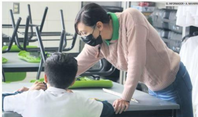
ESFUERZO. Pese a la extinción del programa, las maestras de la primaria "Margarito Ramírez" no se rinden.

"Ahorita trato de aplicarlo un poco a las materias que vemos con actividades al aire li-