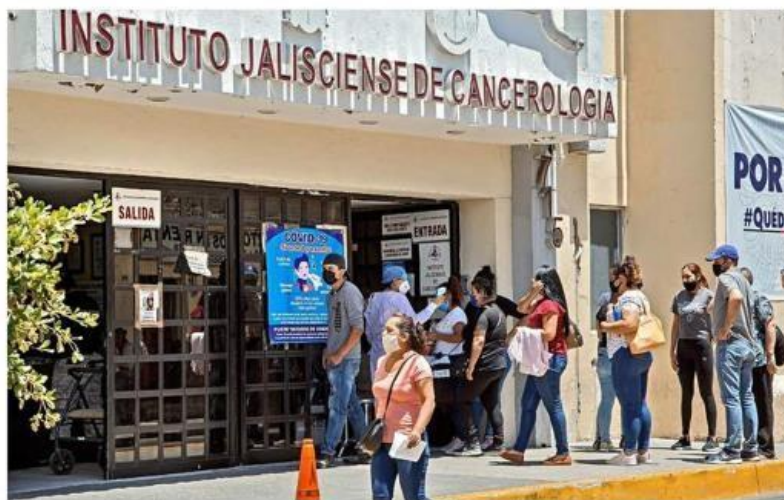
El Instituto Jalisciense de Cancerología atendió, en 2021, 3 mil 282 consultas de primera vez mientras que en 2020 fueron 2 mil 595.

El cáncer de próstata es el más letal, con 619 víctimas, y el de mama, con 559. Por afec-