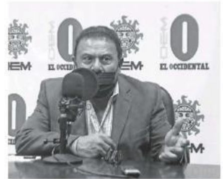
El director de Prevención y Reinserción.

“Sin tener contacto con el secuestrado, sin participar directamente o físicamente, se involucra como cómplice. Eso lo entendemos, pero lo que no entendemos es cómo un juez irresponsable alejándose de la Ley de la Perspectiva de Género no valora que esa mujer primero fue sumisa al autor material que es un masculino y segundo,