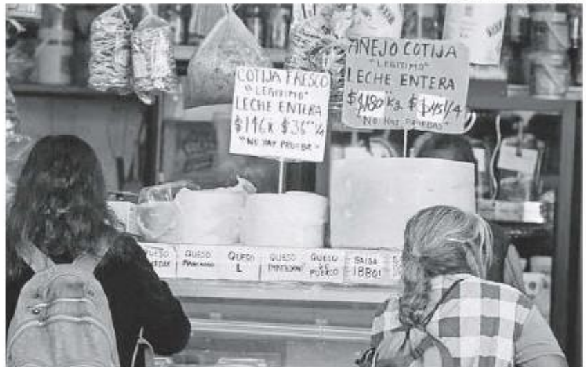
Por las nubes los precios de la canasta básica.

La encuesta se realizó vía telefónica en 603 hogares, la mayoría de ellos del área metropolitana de Guadalajara, del 17 al 31 de enero pasado.