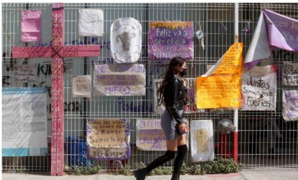
Feministas dejan mensajes en el Centro de Justicia para las Mujeres.