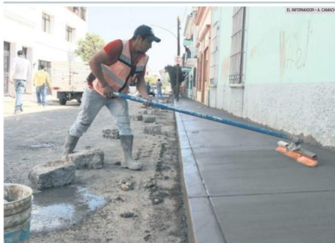
INTERVENCIÓN. Además de las obras que actualmente lleva a cabo en el Centro tapatío, el Ayuntamiento de Guadalajara ya alistó más trabajos en el primer cuadro del municipio y otras colonias alejadas. Esta semana atenderá 20 puntos.

Se documentó que el kilo de limón llegó hasta los 99 pesos y el de chile serrano a los 100.