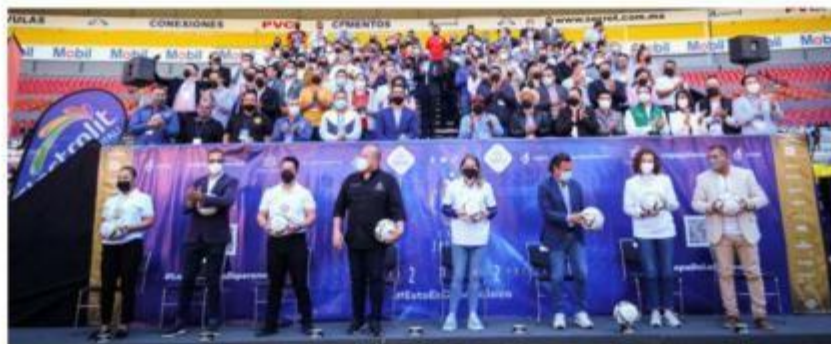
El Gobernador Enrique Alfaro Ramírez presentó este lunes la Copa Jalisco 2022, el torneo de fútbol amateur más grande de la entidad.

La presencia femenina se ha incrementado 30 por ciento en relación con el año anterior al ir de 56 equipos femeniles en su edición anterior a 71 escuadras para la edición 2022. La Copa Jalisco, detalló el mandatario, es organizada por el Gobierno del Estado, el Consejo Estatal para el Fomento Deportivo (CODE Jalisco), y la Asociación de Fútbol Aficionado del Estado de Jalisco, y tiene como finalidad fomentar la cultura de la paz por medio del deporte, enseñar la sana com-