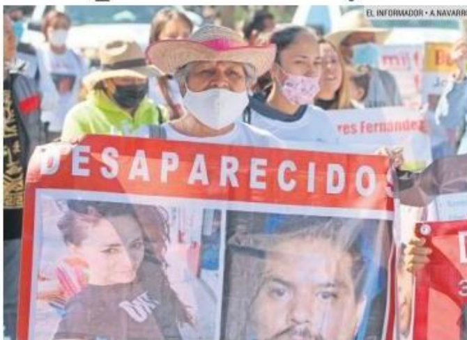
MANIFESTACIÓN. Familiares solicitan mejoras a procedimientos en la Fiscalía.

“Queremos que sepan que estamos con ellos y con todos los desaparecidos. Somos 19 mil víctimas en todo el Estado, y cada día se van sumando. No es la causa de