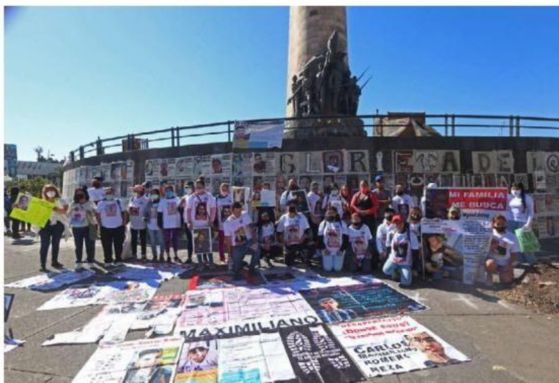
El contingente partió de la Glorieta de las y los Desaparecidos. FERNANDO CARRANZA

Con pancartas en mano y pliegos con las imágenes de sus familiares desaparecidos, el contin-