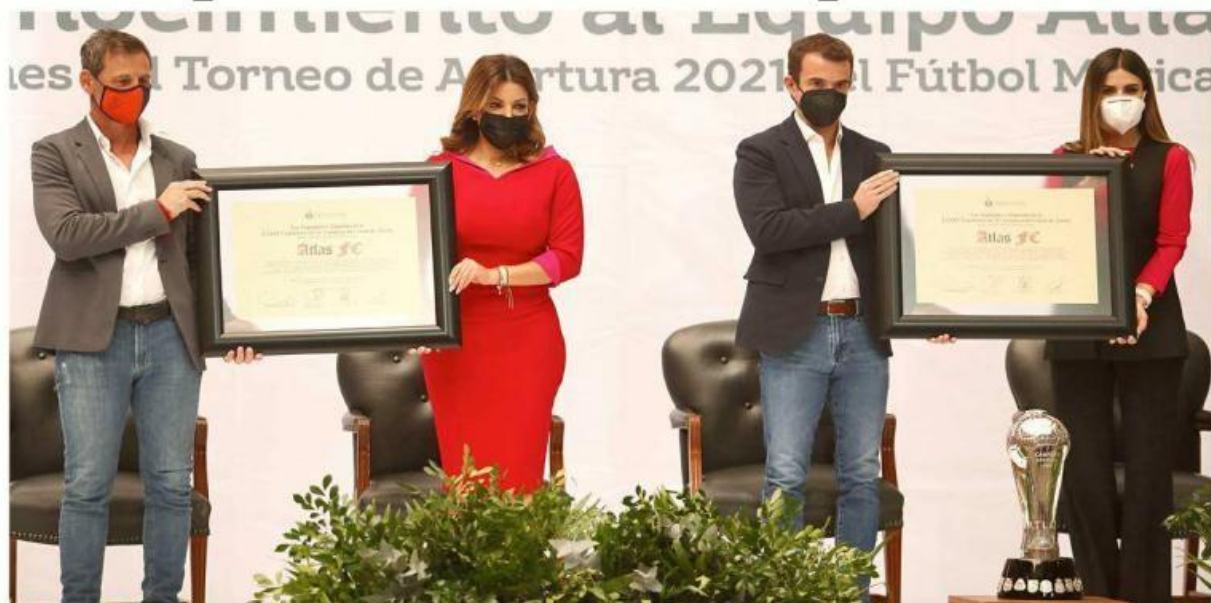
Los diputados reconocieron la labor del plantel del Atlas al conseguir su segundo título de la Liga mexicana.