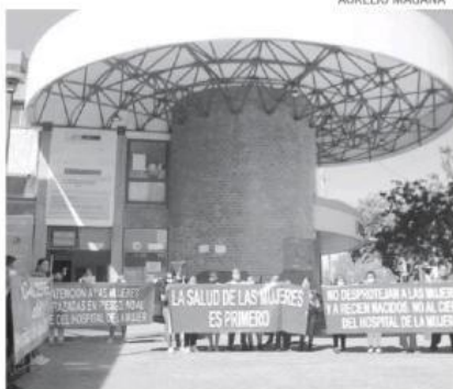
Vecinos y pacientes se manifestaron.