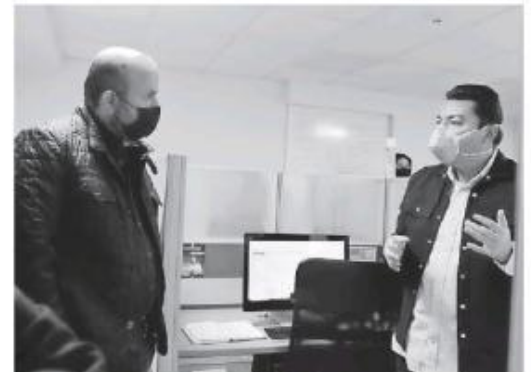
El Rector visitó la Universidad Virtual.

Una universidad del futuro, destacó, tiene que pensar en profesores que desempeñen su trabajo con más flexibilidad, en muchas modalidades, lo virtual y lo presencial, y que esta transformación sea una de las herencias positivas de la pandemia. Destacó que definitivamente la pandemia ha sido una tragedia, pero al final si la UdeG "es una universidad mejor de lo que era antes, eso será al-