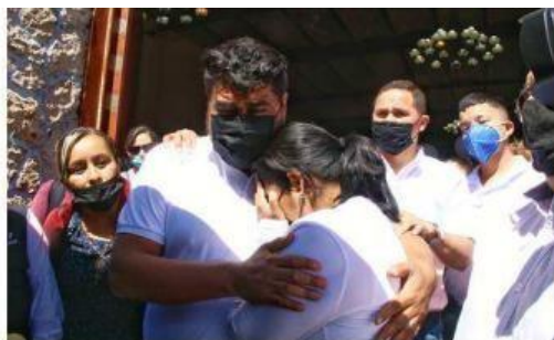
■ Los papás del menor saliendo de la misa que se ofició en la Parroquia de la Inmaculada Concepción.