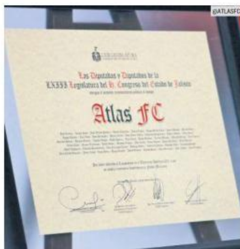
MERECIDO. Jugadores, cuerpo técnico y staff del primer equipo fue incluido en el reconocimiento,

“El poder levantar el campeonato, transformar una historia y hoy recibir este reconocimiento, nos llena de alegría; reiteramos el compromiso para seguir trabajando de la mano, muchas gracias por recibirnos”, sentenció el mandamás.