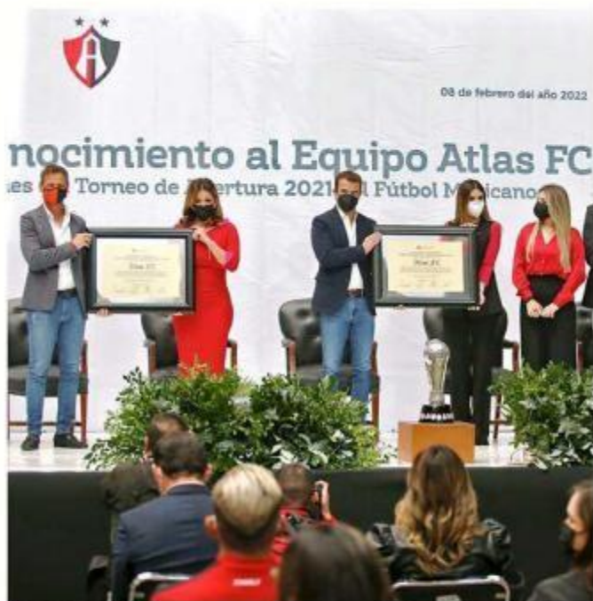
El Atlas recibió un reconocimiento en el Congreso del Estado por su campeonato en el torneo de apertura 2021.

Al concluir la entrega del reconocimiento, empleados del Congreso que habían permanecido como espectadores durante el evento, se agluti-