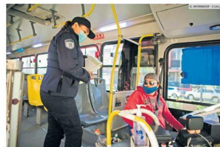
OPERATIVOS. La Setran aumentó las revisiones con la llegada de la variante Omicron a la Entidad.

Lo anterior, dijo, considerando que la mayoría de las unidades del transporte que operan en la metrópoli están funcionando a su máxima capacidad.