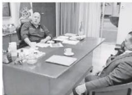
Alfaro dio a conocer la noticia.