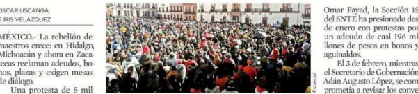
En Zacatecas (foto) y otras entidades, maestros han salido a las calles a protestar por incumplimiento de pagos.

En Zacatecas (foto) y otras entidades, maestros han salido a las calles a protestar por incumplimiento de pagos. Una protesta de 5 mil maestros y jubilados del SNTE, estalló ayer para exigir al Gobernador de Zacatecas, el morenista David Monreal, el pago de la segunda quincena de enero y de un bono. “¿Dónde está el recurso que remitió Hacienda, a tra-