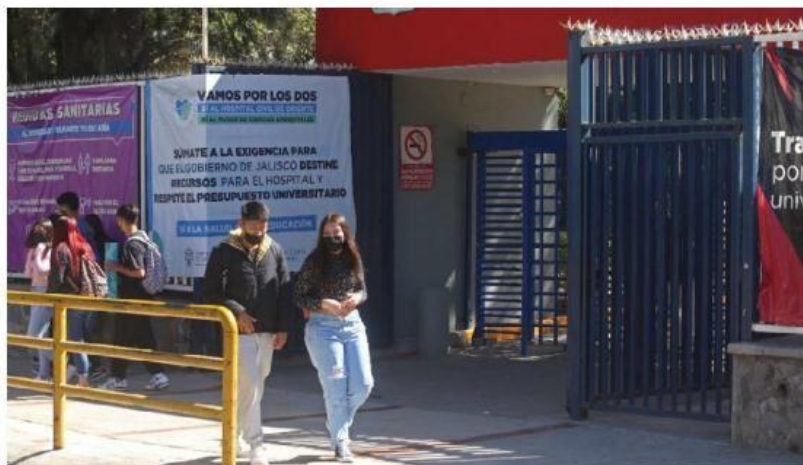
En bachillerato acudirá una semana 50% del alumnado, y la siguiente el resto. F. CARRANZA

Mediante un comunicado, la casa de estudios precisó que el regreso a la presencialidad se hace según las condiciones de los centros universitarios y preparatorias. En bachillerato, asistirá