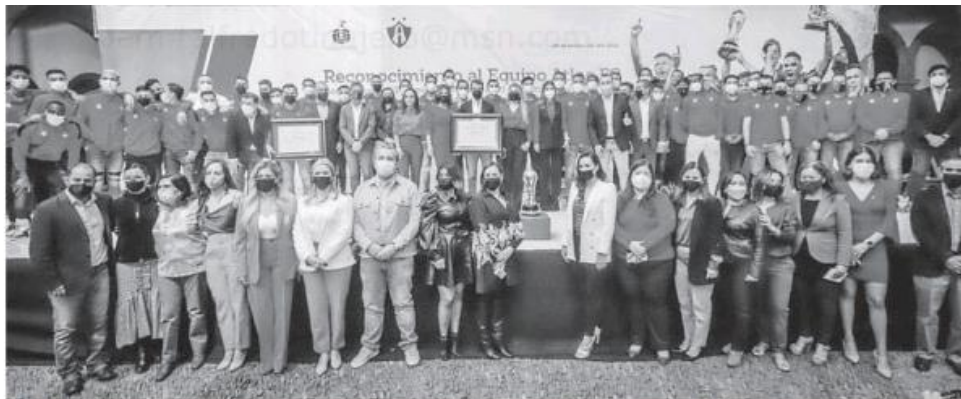
Los rojinegros siguen de manteles largos tras su título conseguido en diciembre pasado.