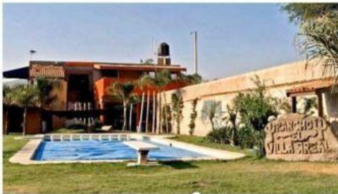
La fábrica de droga sintética estaba en el Rancho El Villarreal.

Se trató de 15 toneladas de sustancias almacenadas en el Rancho El Villarreal, un salón de eventos ubicado cer-