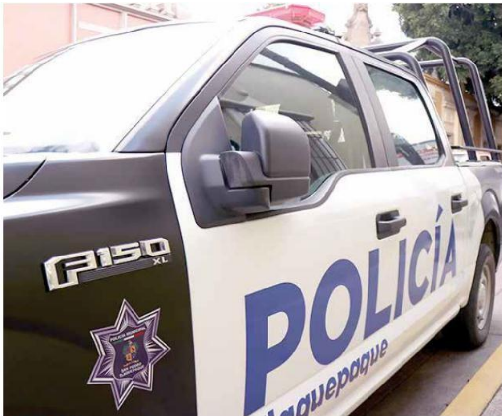
VILLA ALFARERA. Uno de los crímenes ocurrió en la colonia Santa María Tequepepan, en Tlaquepaque.

El homicidio fue reportado por el cruce de las calles Arenal y privada La Luna, hasta donde acudieron paramédicos de Cruz Roja para atender a la víctima, pero al llegar descubrie-