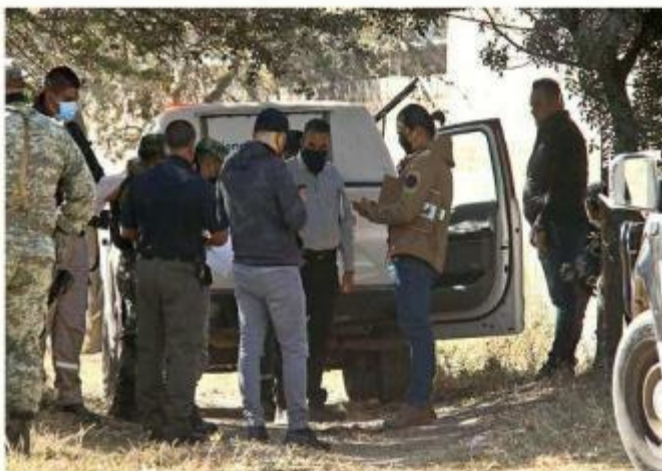
■ En la Colonia Santa María Tequepexpan fue asesinado a balazos un hombre aproximadamente de 40 años.

Habitantes de la zona reportaron haber visto un bulto que les pareció sospechoso en un área donde se acumula basura y escombros a las afue-