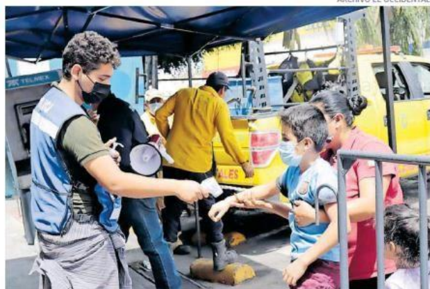
Los protocolos sanitarios se mantienen como están en Jalisco.

También se mantendrá la evaluación permanente con el regreso a clases de forma presencial en las aulas y que a partir de este ocho de febrero se suma la Universidad de Guadalajara tanto en preparatoria como en licenciaturas y grados superiores.