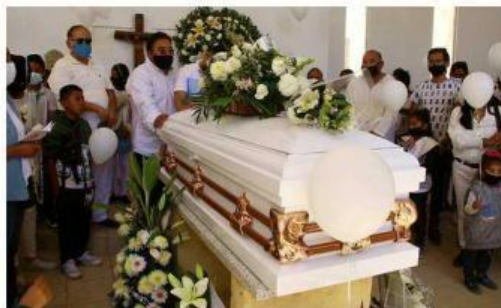
■ En la misa se permitió la presencia de amigos y allegados, pero en el entierro sólo a la familia.