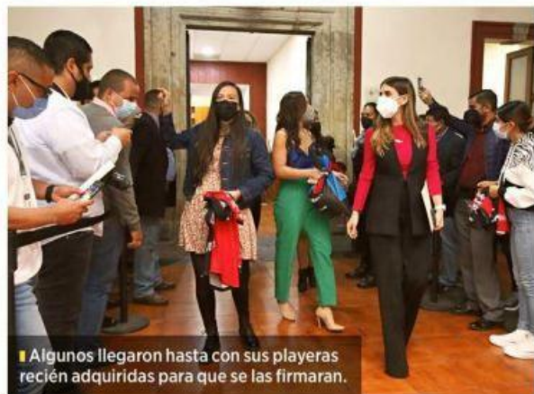
Algunos llegaron hasta con sus playeras recién adquiridas para que se las firmaran.

"Tomamos este reconocimiento y alegría de la gente de esta manera. Mi compromiso es hacer que nuestros jugadores tengan la cabeza bien clara de seguir dando alegría con respeto, humildad y nos movilizan y ayuda este reconocimiento", mencionó Cocca.