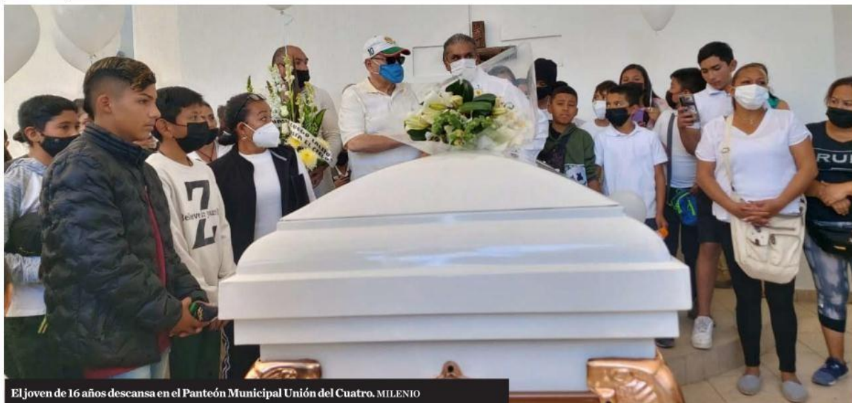
El joven de 16 años descansa en el Panteón Municipal Unión del Cuatro.