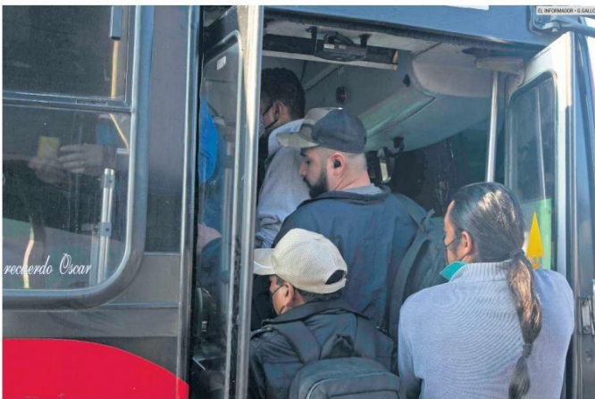
PELIGRO. Usuarios y activistas llevan años solicitando más unidades para evitar la saturación.