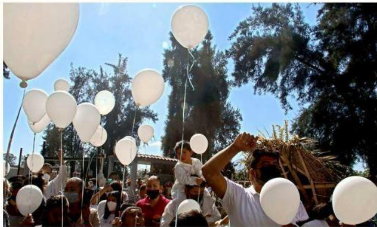
■ Durante la celebración eucarística y el sepelio predominaron los globos blancos.