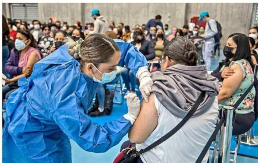
■ Especialistas recomiendan que las personas se apliquen el refuerzo de la vacuna contra Covid.