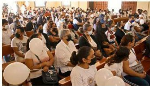
■ Así lució la Parroquia de la Inmaculada Concepción.