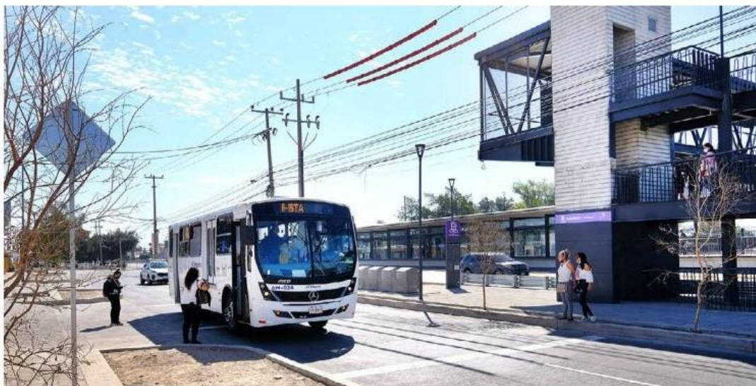
Más de un millón de personas han utilizado el nuevo sistema de transporte. FERNANDO CARRANZA

“Con estos números vamos a tener la cobertura completa del sistema y con estos números pues nos convertimos en el sistema de transporte masivo más importante del occidente del país por su número de unidades y número de viajes. La alimentadora A01 saldrá de Barranca de Huentitán y contará con 18 unidades y una frecuencia de paso de siete minutos. La A02 saldrá de Barranca de Huentitán hasta llegar a San Pedrito y la frecuencia de paso será de 9 minutos. En el caso de la alimentadora a03 partirá del Centro Cultural Universitario Acueducto y contará con nueve unidades. La