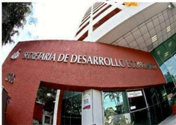
La Sedeco destinó gran parte del recurso para hacer frente a la pandemia, en comida y papelería.

También destaca la compra de un monitor de presión arterial por mil 380 pesos, así