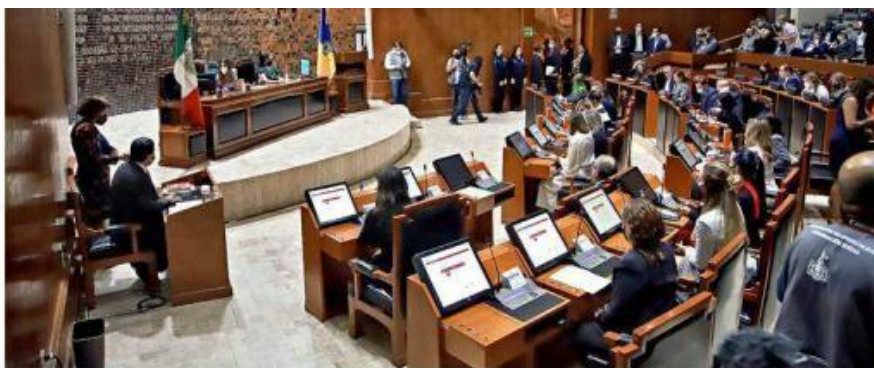
■ Diputados buscan que se informe con anticipación cuando pretenda acceder a un crédito.

Morena y PAN cuestionan créditos estatales