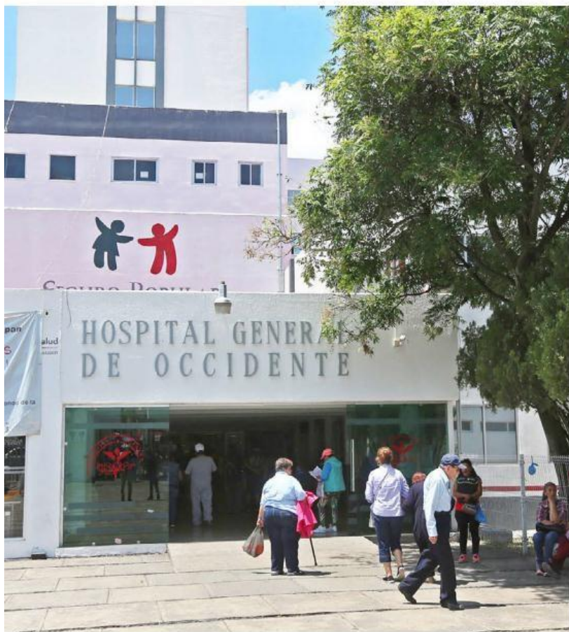
El Hospital de Zoquipan se consolidará como Materno Infantil.