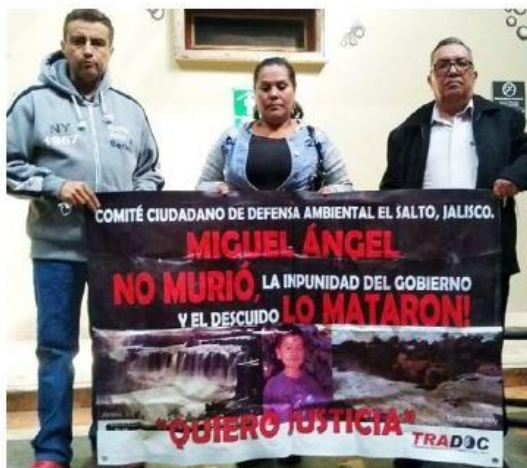
Activistas y académicos cuestionaron falta de acciones. RH

Por su parte, el abogado de la familia denunció que pese a que diversos órganos tanto federales como estatales ordenaron la reparación integral del daño a la familia esto no ha ocurrido, ya que ni siquiera ha existido acompañamiento mencionado, además de que la indemnización fue