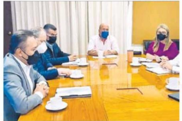
Los nuevos hospitales, unidades e institutos están en marcha.

En el caso del Instituto de Cancerología se trasladará a las instalaciones que se construyen en la zona de Miramar y dejará de ser de tipo estatal para convertirse en una institución regional de cancerología, se tendrán disponibles más de 120 camas, se ampliarán todos los servicios para albergar las áreas médico-quirúrgicas que actualmente se ubican en el Hospital de Zoquiapan.