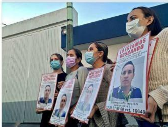
■ Cuatro mujeres solicitaron a la Fiscalía agilizar la búsqueda.

“Desde que crecemos nos enseñan que un día nos vamos a ir y que cuando se va una persona tenemos que hacer un entierro, una despedida, pero nosotros en dónde vamos a ir a llorarle o en dónde vamos a despedirlo”, lamentó la familiar.