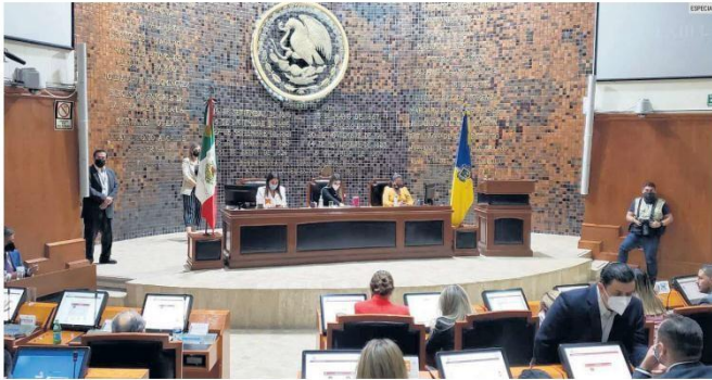
NUEVA GESTIÓN. La LXIII Legislatura de Jalisco está integrada por 38 diputados y diputadas.