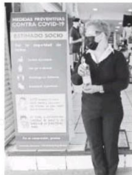
Filtros sanitarios en negocios.

antros, centros nocturnos, salones de eventos y casinos de las zonas Andares, Chapalita, Zona Real, Santa Margarita, Servidor Público y los corredores López Mateos, Patria y Mariano Otero, así como en el Auditorio Telmex.