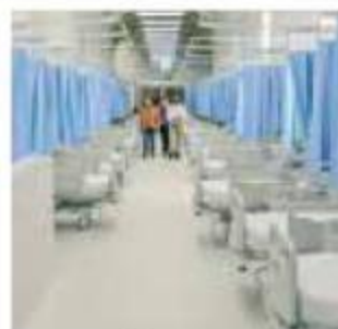
Compromiso. Se reiteró la atención a la salud.