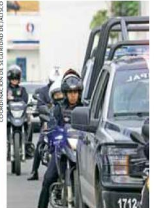
COORDINACIÓN DE SEGURIDAD DE JALISCO