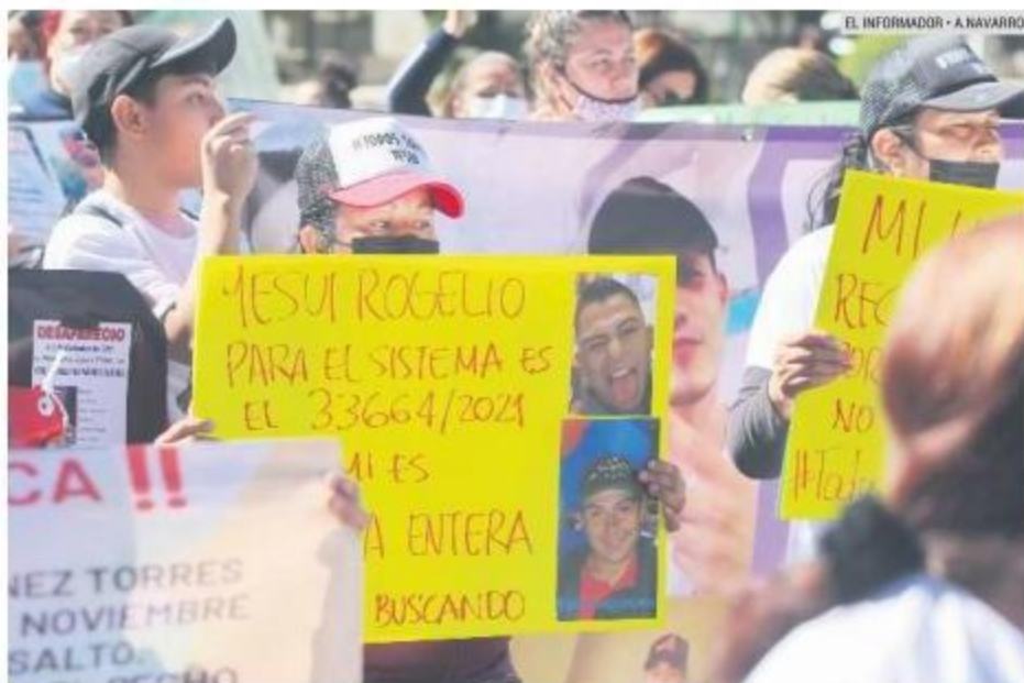
EDAD. La mayoría de los desaparecidos tiene entre 15 y 17 años.

El rango de edad de la mayoría de los menores se encuentra entre los 15 y 17 años. De las víctimas, 686 son hombres y 606 son mujeres. El coordinador del Comi-