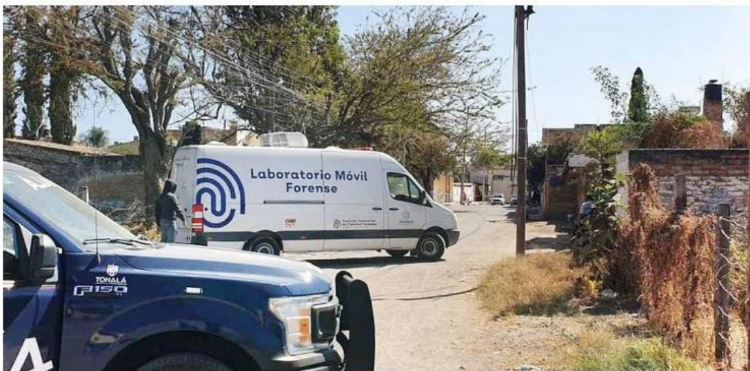
Ayer se apreció una retroexcavadora en las fincas, de donde salió el Laboratorio Móvil Forense. JUAN CARLOS MUNGUÍA

Investigación. Los oficiales aprehendieron a un hombre en la colonia Santa Cruz de las Huertas, y ya no se supo nada más de él; identifican a cinco de los 28 cuerpos hallados en fosa de Zalatitisán