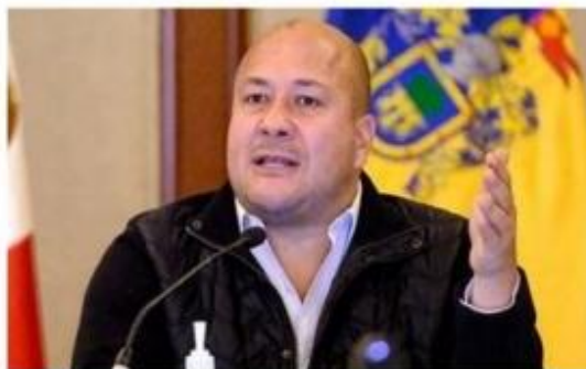
El Gobernador Enrique Alfaro Ramírez, tras el anuncio.

las instalaciones donde se proyectó el Instituto de Cancerología, se construirá la Unidad de Hemodiálisis del Estado de Jalisco: "un asunto necesario y urgente, en un espacio que, con una adecuación no menor, pero digamos realizable en los próximos años se puede convertir una unidad de hemodiálisis que nos va a permitir atender un servicio que tiene una altísima demanda y que estará ubicado además junto con los hospitales civiles de Guadalajara".