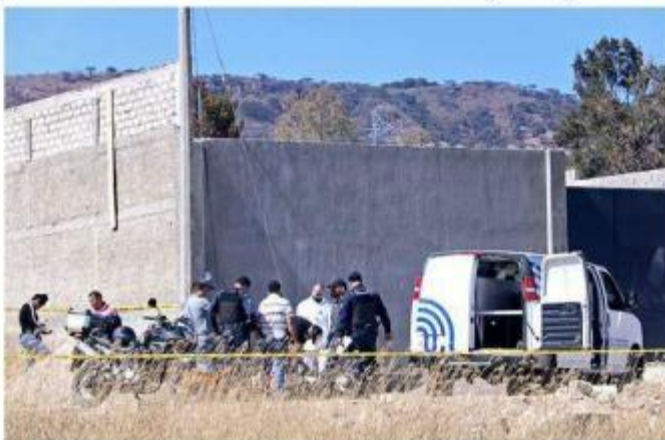
■ El hallazgo ocurrió en la Colonia Lomas de Tesistán.

minicidios de la Fiscalía del Estado llegaron a la escena del crimen para comenzar con las indagatorias bajo el protocolo de crímenes por razón de género.