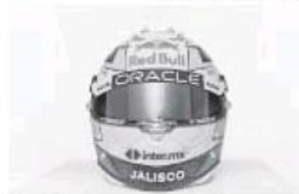
Así será el casco de Sergio Pérez.

parte del Gobierno de Jalisco a través del presupuesto de la Secretaría de Turismo es de 13 millones de pesos con el Impuesto al Valor Agregado (IVA) incluido.