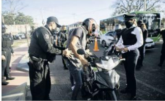
ALEATORIO. Verifican a algunos conductores al azar.