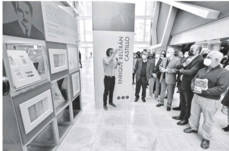
Autoridades universitarias inauguraron la exposición.

controversia porque la UdeG está constituida como Organismo Público Descentralizado (OPD) y no como un órgano autónomo constitucional (OCA), aunque confirmó que esta Casa de Estudio no está subordinada a ninguno de los tres poderes constitucionales y goza de autonomía. Dijo que el fondo del asunto todavía se encuentra en la SCJN, pues el Ejecutivo estatal violó la Ley de Egresos al indicarle al Congreso cambios en el presupuesto.