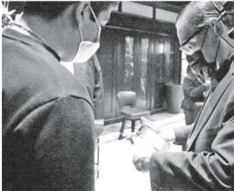
En antros es obligatorio.