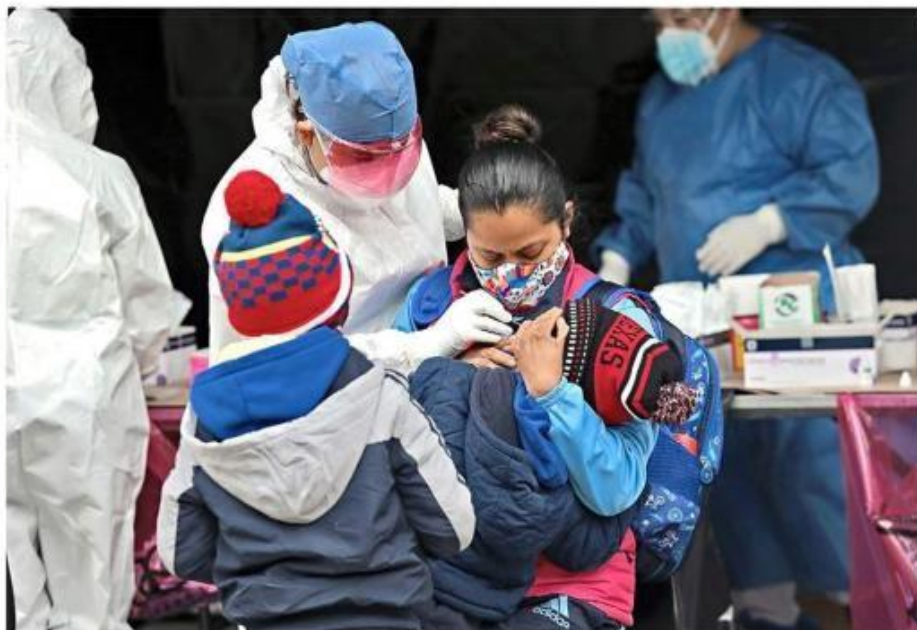
■ Al inicio de la semana había mil 314 casos activos de Covid-19 en niños de 3 a 14 años.

Estadísticas de la Secretaría revelan que el virus ha