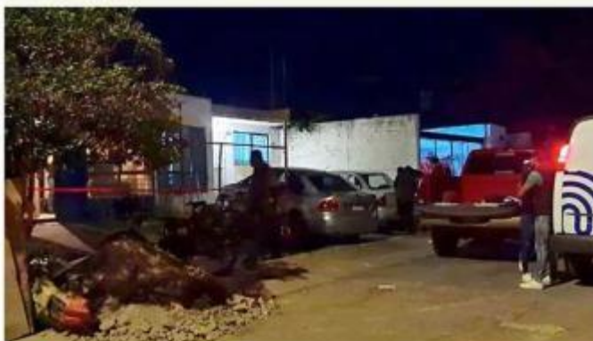
■ El cuerpo de un hombre fue localizado en el interior de una finca de la Colonia Haciendas de Zapopan.

La víctima tenía aproximadamente 5 días de evolución cadavérica.