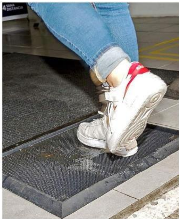
El Gobierno del Estado compró tapetes decorativos y los hizo pasar como sanitizantes.