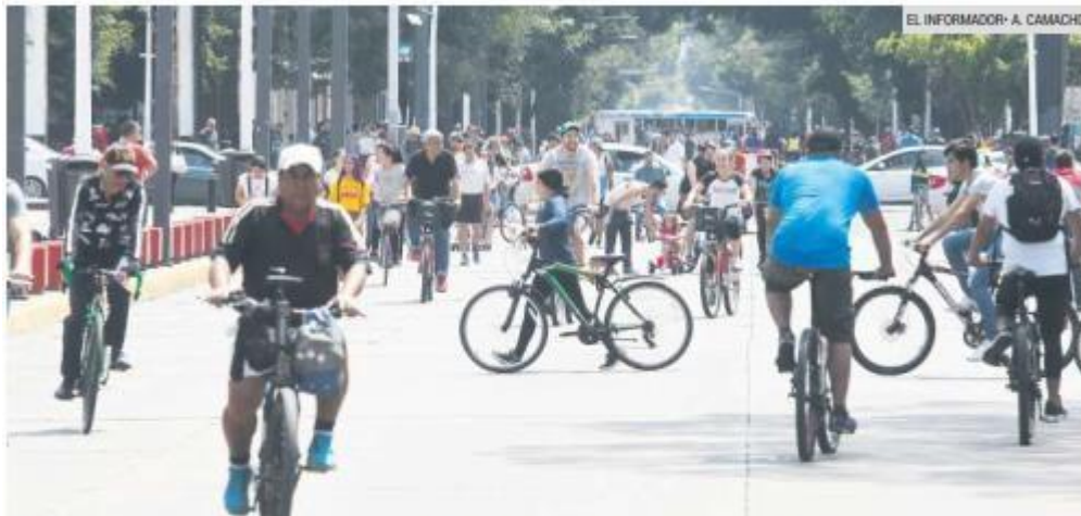
AJUSTE. Se esperan más visitantes a la Vía RecreActiva a partir del siguiente domingo.

Por su parte, de Avenida Atemajac, la C43 (636 Haciendas del Valle-636 Valdepeñas) se