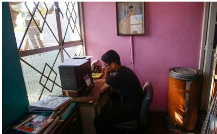
Los reportes se pueden hacer el sitio www.teprotejomexico.org . ESPECIAL

Y esto sucede porque cada uno de los países aliados cuenta con un equipo encargado de analizar y canalizar cada reporte y después de eso la información es enviada al país donde se detectó el origen de la publicación. Las autoridades de cada país son las encargadas de llevar hasta la eliminación cada reporte. ■