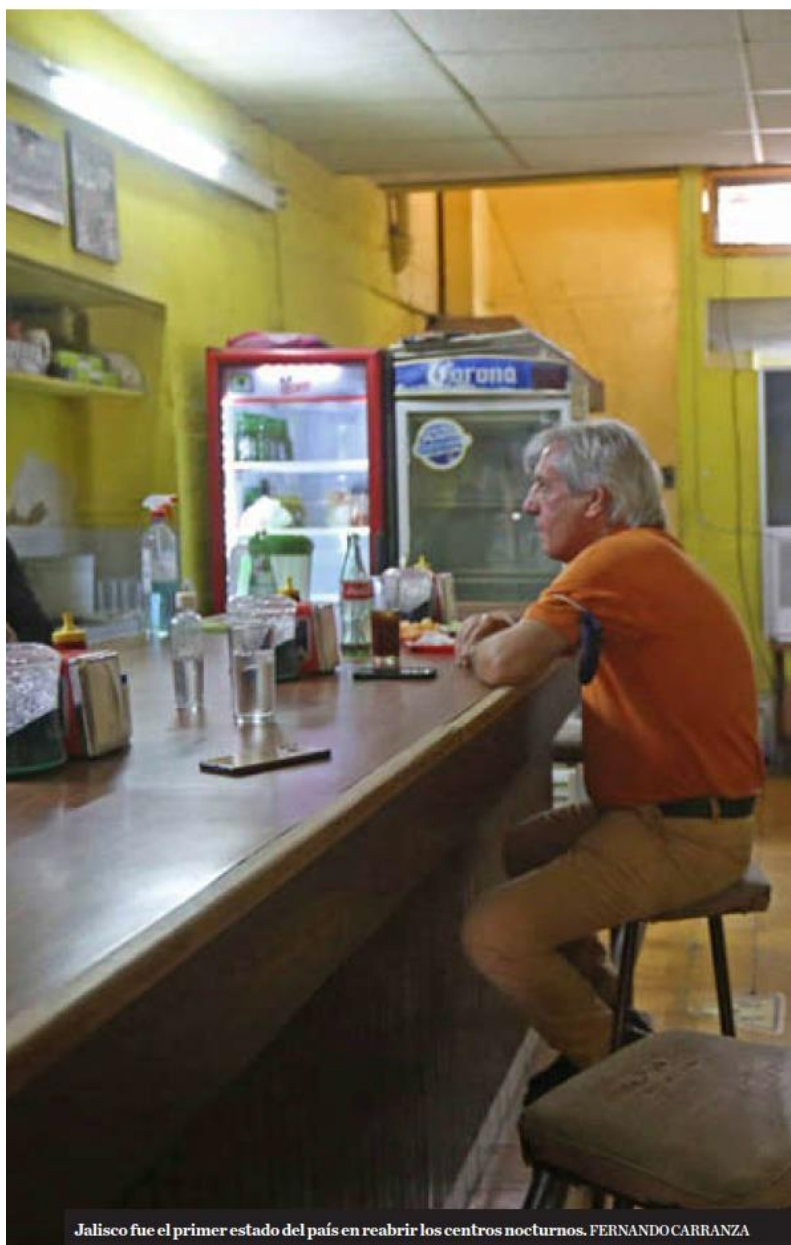
Jalisco fue el primer estado del país en reabrir los centros nocturnos. FERNANDO CARRANZA

ción para la industria del entretenimiento, que, según el presidente del Conbar Jalisco, ha sido de las más castigadas durante la emergencia sanitaria por el tiempo que se mantuvieron cerrados y por la cantidad de negocios que han tenido que cerrar de manera definitiva.