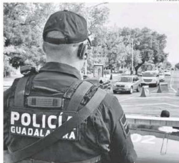
Esto para combatir la portación ilegal de armas.