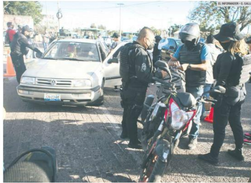
SUPERVISIÓN. Las autoridades indican que, para evitar abusos, invitarán a observadores de la Comisión Estatal de Derechos Humanos, Jalisco (CEDHJ) a los operativos. La revisión comenzó ayer a las 17:00 horas en Periferico y Tabachines.