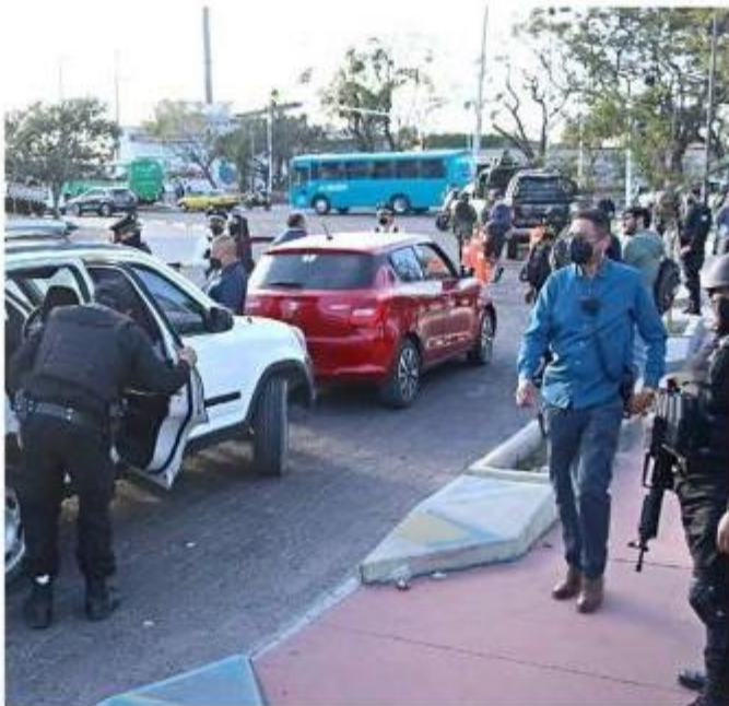
■ El programa "Módulo Seguro" arrancó oficialmente ayer.

El 15 por ciento de los 12 mil 954 policías evaluados no pasó el filtro, mientras que hay 3 por ciento pendiente de presentar las pruebas; el