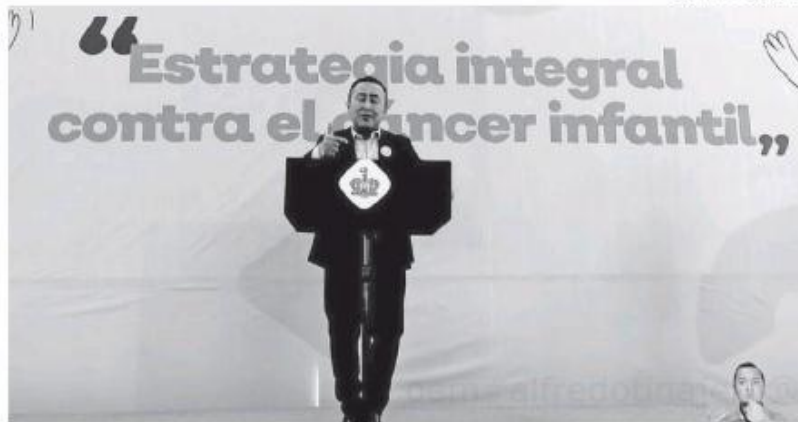
El director de los Hospitales Civiles en Jalisco.