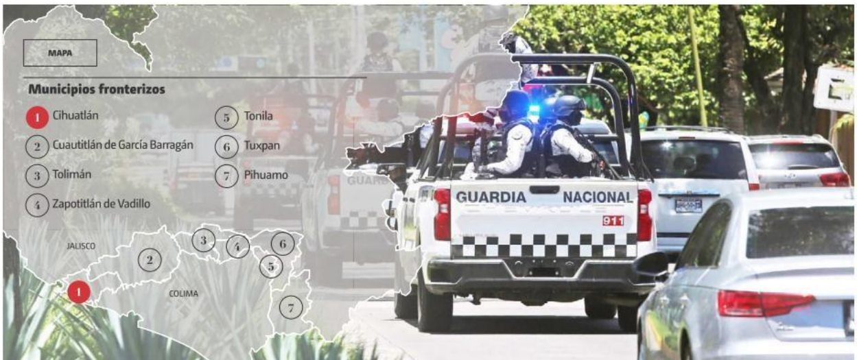
La estrategia contempla coordinación entre elementos estatales y federales en la zona. FERNANDO CARRANZA