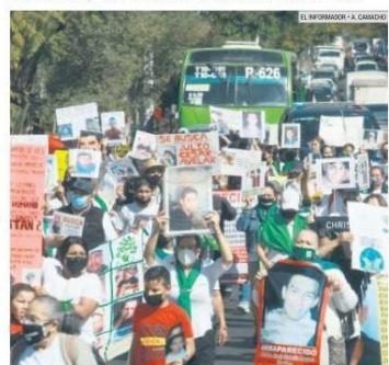
HARTAZGO. Los familiares de desaparecidos recorrieron ayer Avenida Chapultepec para mostrar a otros el problema que no han podido resolver las autoridades.

De acuerdo con el último reporte del Registro Nacional de personas Desaparecidas y No Localizadas, en Jalisco hay 15 mil 763 personas desaparecidas.