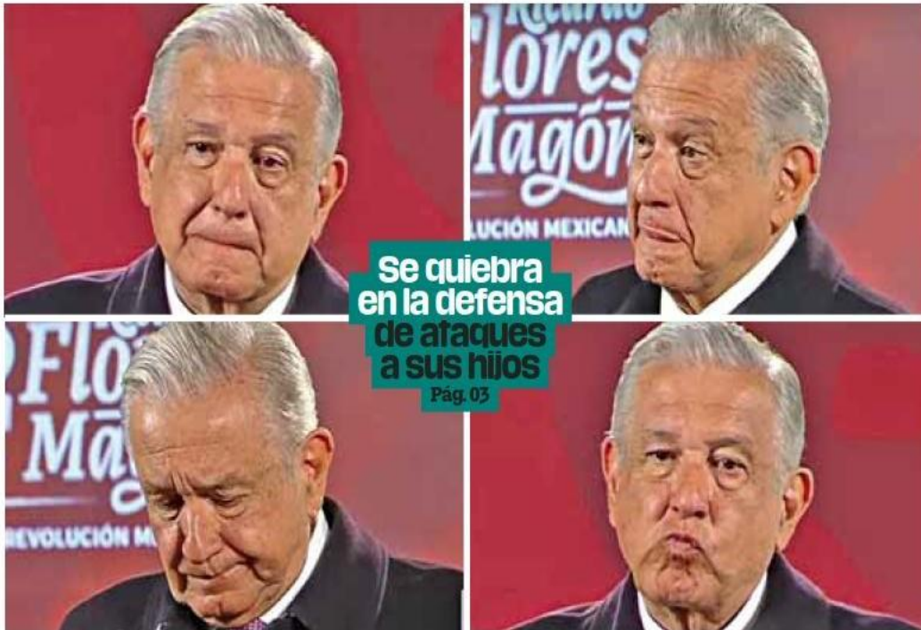
Mañanera. López Obrador dijo, al borde del llanto, sentirse orgulloso de que su familia oponga resistencia ante el espionaje que ha sufrido por años.

Compromiso. La administración de Enrique Alfaro informó que se invertirán 364 mdp para la atención a menores con este padecimiento y también se trazó la atención integral. / Pág. 04