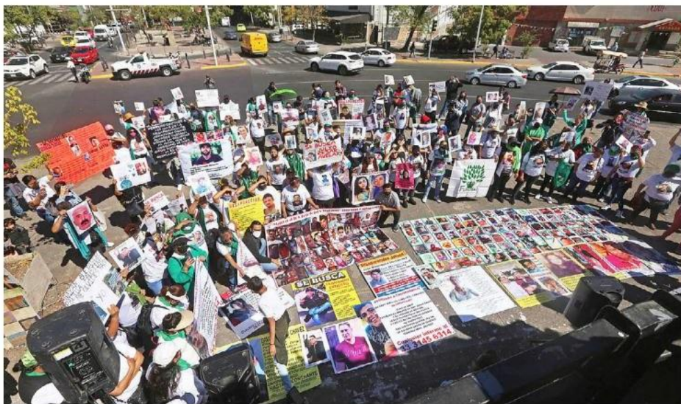
En la Glorieta de las y los Desaparecidos colocaron imágenes de sus familiares ilocalizables.