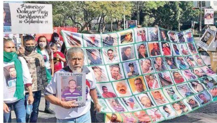
Más desaparecidos se suman a la trágica lista negra en Jalisco.

“Lo único que se ha acumulado ahí es dolor y restos humanos y en este aniversario de Guadalajara decimos recio y quedito que Jalisco es una fosa y es la más grande del país”, agregó la mujer, mientras