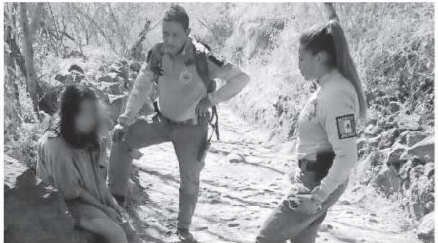
El C5 Guadalajara recibió un reporte sobre una mujer extraviada.

Personal de la Unidad de Resguardo de Espacios Recreativos y Deportivos (UREDDES) se coordinaron desde el ingreso que se encuentra en Ramón Aldana del Puerto y Belisario Domínguez, en la colonia Dr. Atl y comenzaron la búsqueda desde diferentes puntos. La mujer no tenía lesiones visibles y se solicitó el apoyo de la Unidad de Búsqueda de Personas Desaparecidas (UBPD) de la Comisaría de Guadalajara,