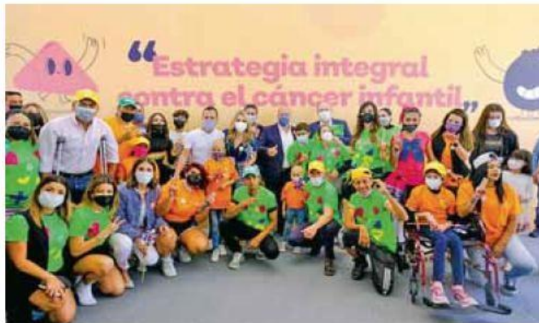
Prioridad. Se firmó una serie de compromisos transversales.

Bajo un modelo único de atención y gestión de los recursos se atenderá a los menores de edad con diagnóstico de cáncer, con una inversión de 100 millo-