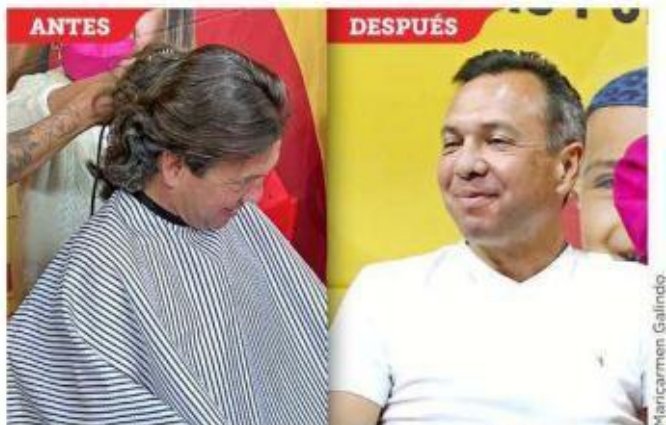
El Alcalde Pablo Lemus quedó "pelón" tras participar en el reto Invencibles, de Nariz Roja.