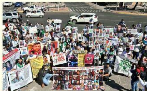
En la marcha, asistentes advirtieron que Jalisco es una fosa.