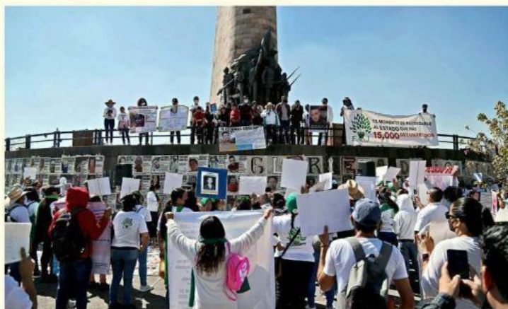
Los manifestantes se congregaron en la Glorieta de los Niños Héroes.