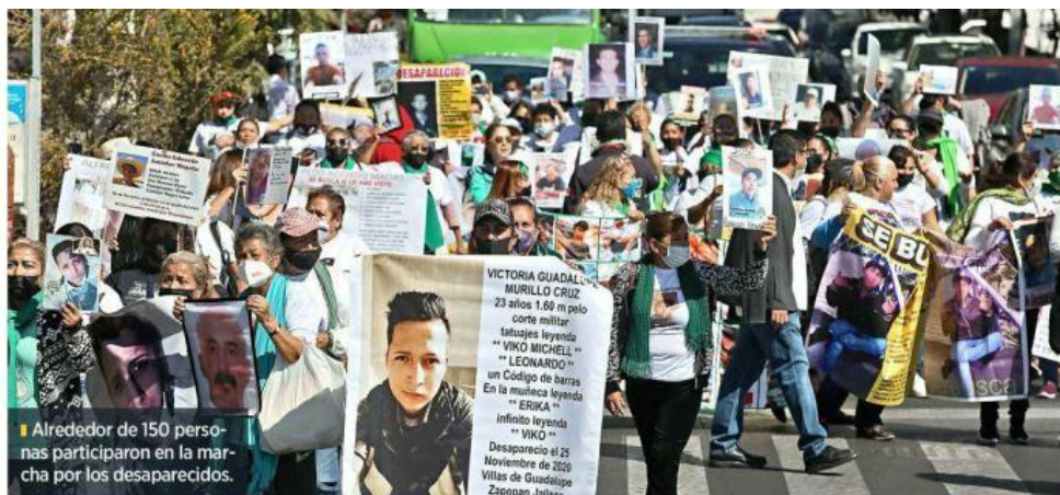
Alrededor de 150 personas participaron en la marcha por los desaparecidos.