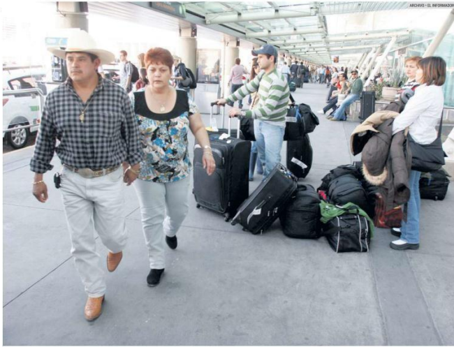
PAISANOS. En total, los tapatíos recibieron 638 millones de dólares de sus familiares en 2021.

Las características de los financiamientos ofrecidos a los paisanos jaliscienses en Estados Unidos con ideas de nuevos negocios o empresas son una tasa de 8% y hasta 48 meses. Los recursos se podrían aplicar para empresas del sector comercio, servicio, industria o agroindustria. El crédito puede ser para mercancías, materia prima, inventarios, nueva maquinaria, remodelación o adaptación de espacios.