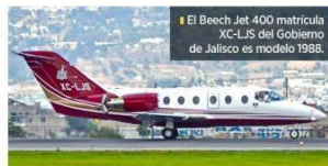
El Beech Jet 400 matrícula XC-LJS del Gobierno de Jalisco es modelo 1988.

Especialistas consultados por MURAL, señalaron que para establecer si son muchos o pocos los viajes realizados en esta aeronave habría que conocer el uso que se hizo de la misma, sin embargo, en su respuesta a la solicitud de información, el Gobierno no especificó quiénes los realizaron ni cuáles fueron los destinos.