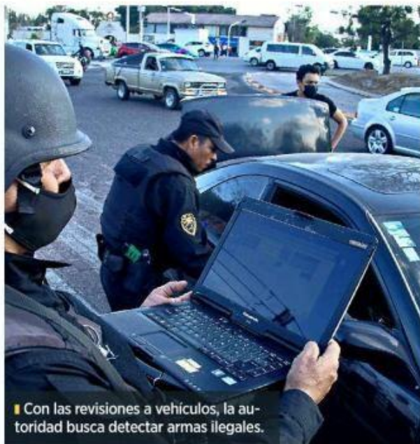
Con las revisiones a vehículos, la autoridad busca detectar armas ilegales.