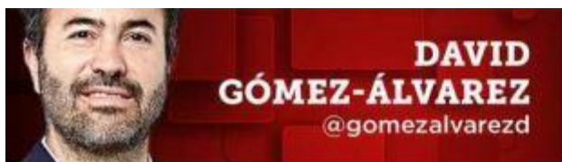
DAVID GÓMEZ-ÁLVAREZ @gomezalvarezd

Las “volantas” dan una falsa sensación de seguridad en un marco de ilegalidad sin lograr tocar al crimen organizado.