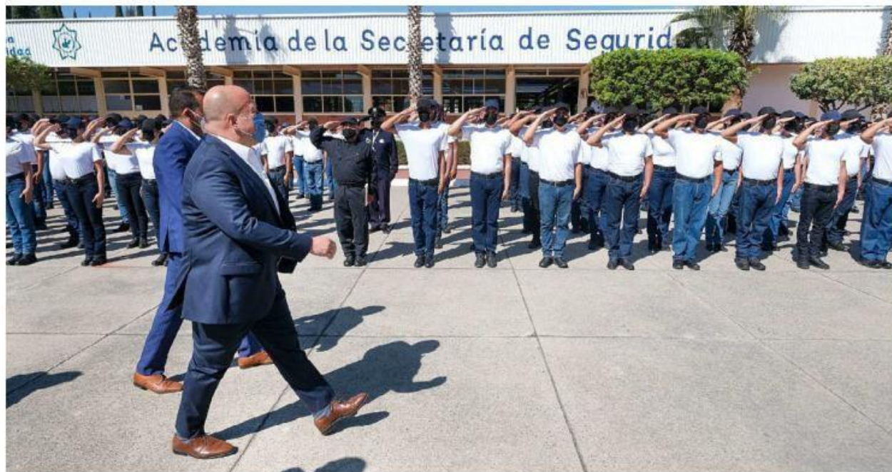
Autoridades reconocen el compromiso de los nuevos elementos. ESPECIAL