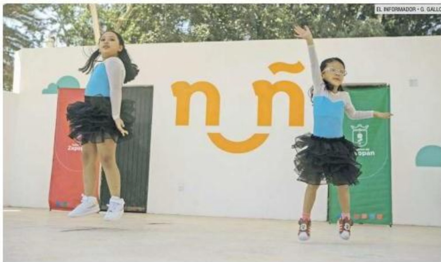
ACTIVIDADES. Los usuarios pueden inscribirse a talleres de danzas polinesias, ballet y guitarra, entre otros.

“Era un centro muy antiguo, con esta intervención estamos incentivando a la cultura, queremos que la gente participe. En esta ad-