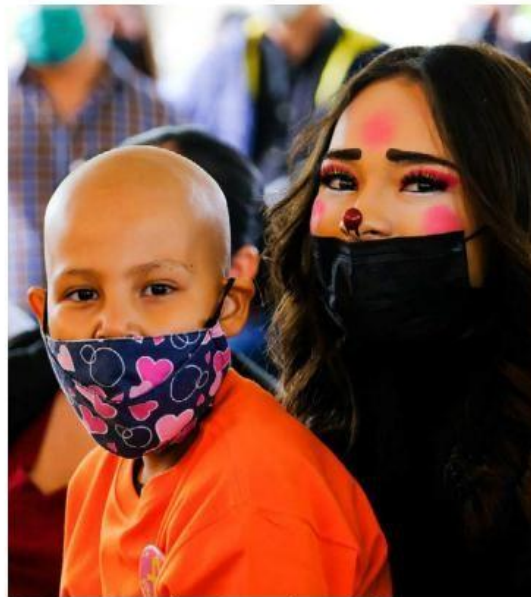
El objetivo es garantizar el tratamiento a los infantes. ESPECIAL

El centro contará con cinco unidades de cuidados intensivos, consulta externa, unidad de quimioterapia ambulatoria, tres áreas para