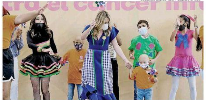
Joanna Santillán, presidenta del DIF Jalisco, con menores con cáncer.

La inversión para la reconversión del piso 7 área de oncología y hematología pediátrica del NHCG será de 70 millones de pesos para infraestructura y equipamiento; aumentar en 55 por ciento el número de camas para hospitalización, contar con cinco unidades de cuidados intensivos, consulta externa, unidad de quimioterapia ambulatoria. Pág. 8