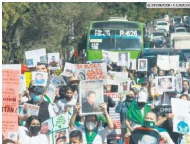
EL INFORMADOR • A. CAMACHO

De acuerdo con el último reporte del Registro Nacional de Personas Desaparecidas y No Localizadas, en Jalisco hay 15 mil 763 personas desaparecidas.