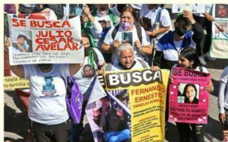
Hay personas que llevan años buscando a un familiar.