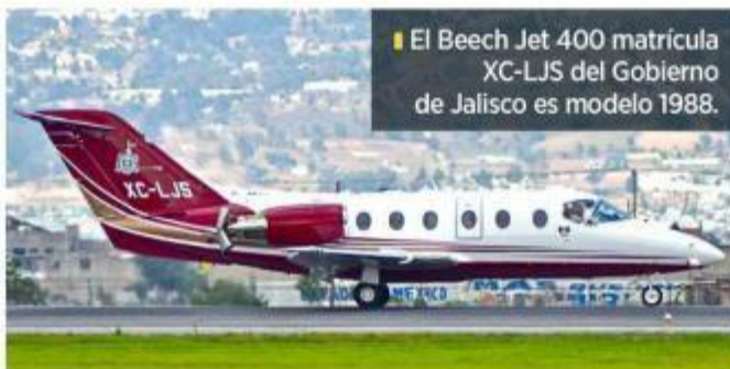
El Beech Jet 400 matrícula XC-LJS del Gobierno de Jalisco es modelo 1988.

Especialistas consultados por MURAL señalaron que para establecer si son muchos o pocos los viajes realizados en esta aeronave habría que conocer el uso que se hizo de la misma, sin embargo, en su respuesta a la solicitud de información, el Gobierno no especificó quiénes los realizaron ni cuáles fueron los destinos.