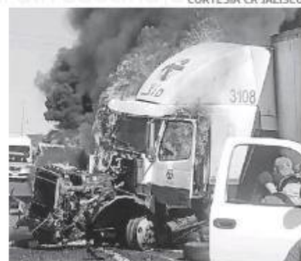
Fuerte choque entre trailers.

Cruz Roja de Zapotlanejo llegaron al sitio para auxiliar a los involucrados pero descartaron que hubiera personas heridas.