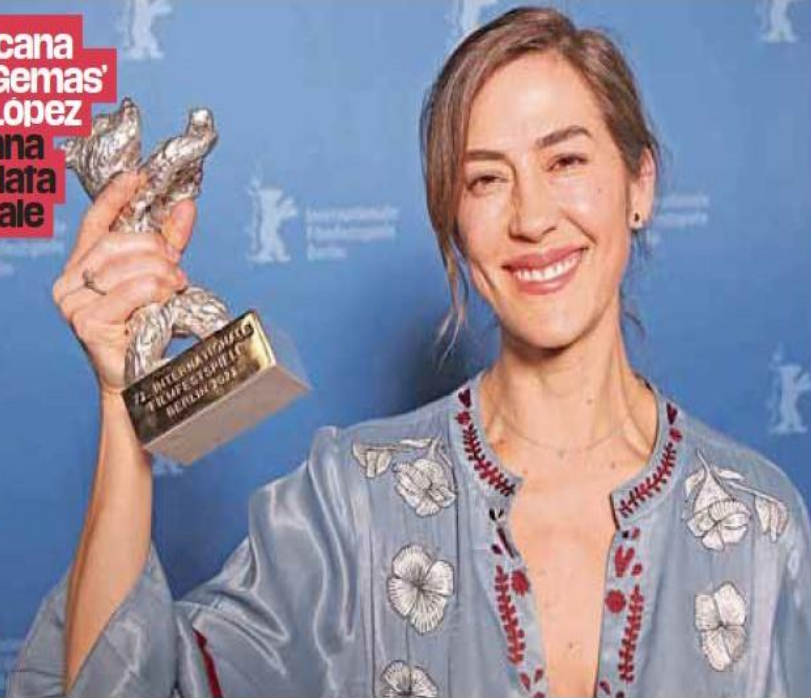
Cine. La película narra el miedo que se instala en el colectivo de una población de México ante la amenaza permanente del crimen organizado.

Cinta mexicana 'Manto de Gemas' de Natalia Lopez Gallardo gana el Oso de Plata de la Berlnale Pág. 08