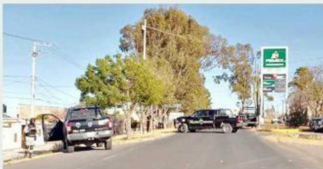
Los oficiales fueron atacados a tiros en Cañadas de Obregón.

“Los hechos ocurrieron cuando los oficiales estatales hacían un patrullaje por la zona y fueron agredidos por sujetos armados, quienes lograron escapar a bordo de varios vehículos, entre ellos dos camionetas Ford Lobo, colores negro y