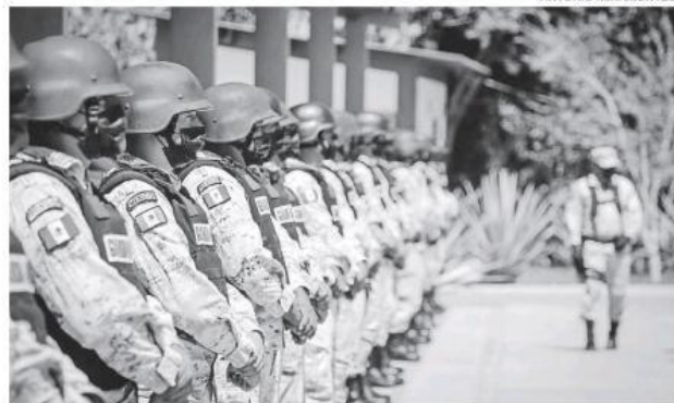
La Guardia Nacional y su carácter militar no civil.

El coordinador del Grupo Parlamentario de Movimiento Ciudadano en el Senado de la República, presentó un punto de acuerdo que plantea que rendición de un informe al Congreso de la Unión sobre los avances mensuales, de mayo de 2019 a enero de 2022 en la certificación de los elementos de la Guardia Nacional. Y diseñar un programa de incentivos presupuestarios para reconocer a los municipi-