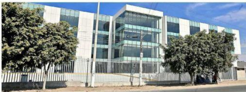
El Instituto Regional de Cancerología funcionará en la Colonia Miramar, en Zapopan.

La asociación civil Nariz Roja manifestó que sólo el 30 por ciento de los medicamentos que compra para entregar a la población, es para pacientes pediátricos; en 2019, cuando inició el desabasto, más del 70 por ciento del recurso era para niños.