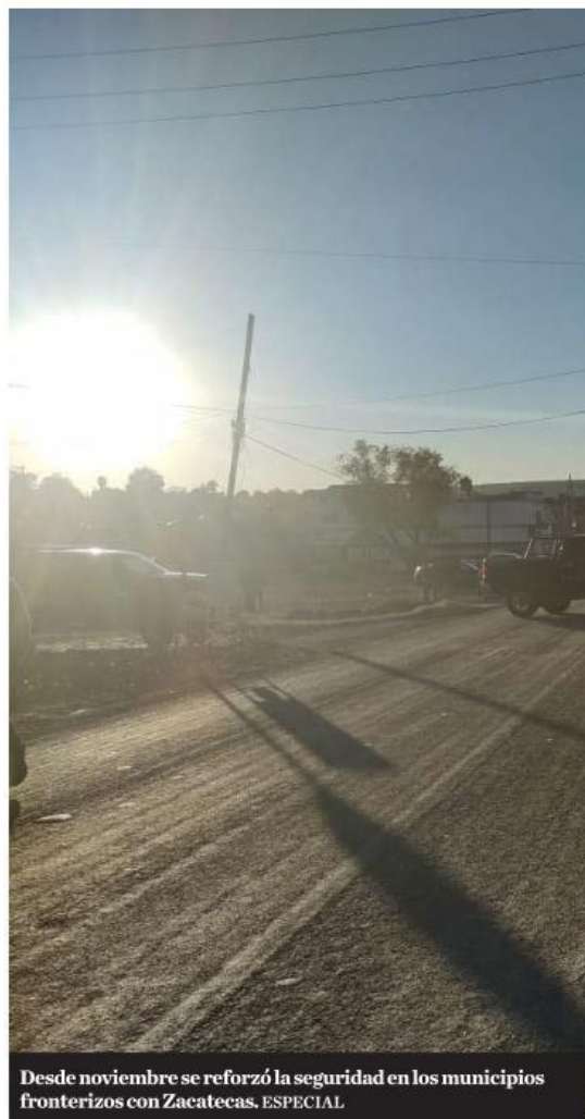
Desde noviembre se reforzó la seguridad en los municipios fronterizos con Zacatecas. ESPECIAL

La Fiscalía del Estado informó que un inmueble de la colonia Tabachines, en Zapopan, fue