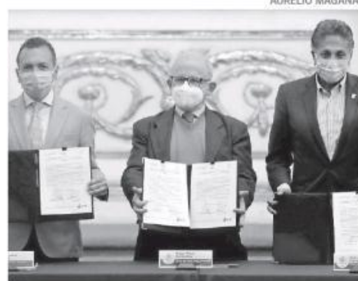
Firma del acuerdo de colaboración el INAH.

Con el tema de fincas dañadas en el primer cuadro de la ciudad, por los trabajos de la Línea 3 del Tren Ligero, recordó que es la SCT la que ya ha hecho y conti-