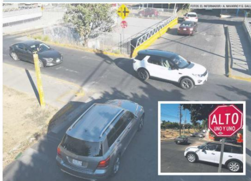
BUENAS PRÁCTICAS. Vecinos y conductores del cruce de Inglaterra y López Mateos coinciden en que el programa 'uno y uno' agiliza el paso y evita accidentes.

El aumento se aplicaría desde la madrugada de ayer miércoles; sin embargo, más tarde se informó que se suspendió hasta nuevo aviso.