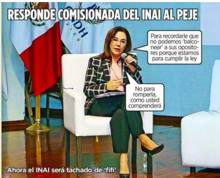
Ahora el INAI será tachado de 'fifi'

No para romperla, como usted comprenderá