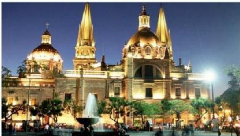
De enero a diciembre de 2021, visitaron el estado alrededor de 18 millones de personas.

La ocupación hotelera promedio fue de 41.89 por ciento,