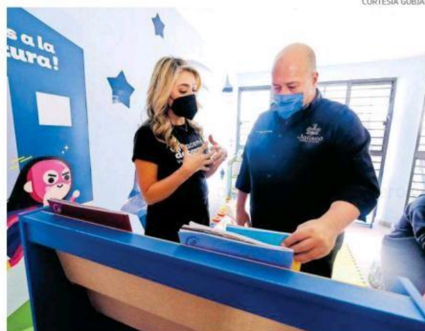
El Gobernador Enrique Alfaro y su esposa visitaron las instalaciones.

ra del Voluntariado Jalisco, indicó que hace más de un año se comenzó a pensar en la construcción de una ludoteca llena de dignidad, pero sobre todo visibilizar a las mujeres que están en ese espacio, que sepan que importan que busca dignificar su estancia y su vida.