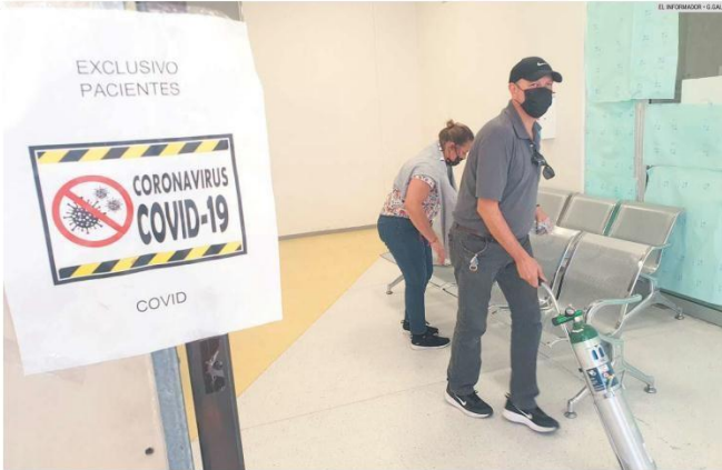
ZOQUIPAN. Hay menos hospitalizados por el COVID-19 en unidades médicas de Jalisco.

Durante enero y febrero se contrataron 166 trabajadores, y en febrero 186. El resto de los compañeros serán contratados a partir del 1 y 15 de marzo. El OPD añadió que el personal que tenga dudas o inquietudes sobre el proceso de regularización puede escribir a la dirección de correo electrónico: registrodhr.ssj@jalisco.gob.mx .