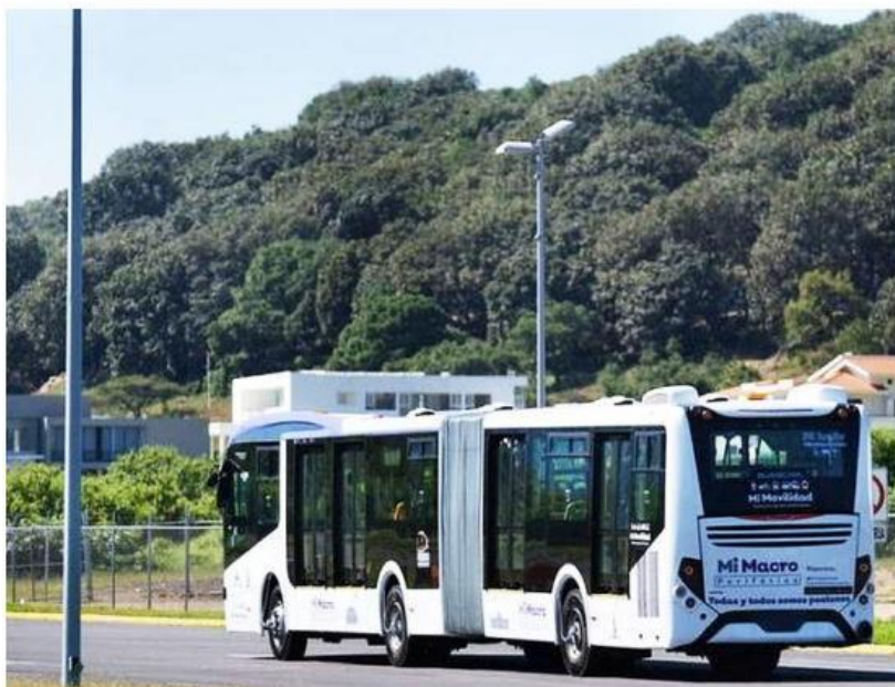
Existe una iniciativa aprobada en el Pleno para solicitar un crédito y concluir el transporte.

“Vamos a seguir insistiendo en una propuesta que tenga una cobertura amplia, completa, pero sobre todo que no desatienda en los momentos críticos, la necesidad que la gente está viviendo. Son par-