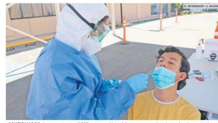
CONFIRMADOS. Ayer reportaron mil 827 casos positivos del nuevo coronavirus. La tendencia se mantiene a la baja.

Comentó que ha visto que entre semana si atienden a las personas. "Pero como mi mamá ya es grande de edad y me dijeron que las camas ya estaban llenas segu, yo mejor quise que la dieran de alta. Me pidieron que firmara una renuncia voluntaria y que trajera un tanque de oxígeno para colocárselo durante el traslado. Preferí eso porque hay más contagios aquí".