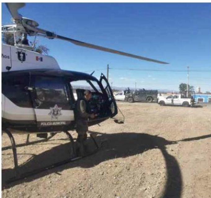
REACCIÓN. La agresión a los agentes motivó un despliegue de distintas corporaciones policiales.

ridad Pública de Zapopan desplazó al lugar su agrupamiento aerotático Halcón , en cuyo helicóptero recogió al agente policial que resultó herido para su traslado a un hospital privado en el Área Metropolitana de Guadalajara (AMG).