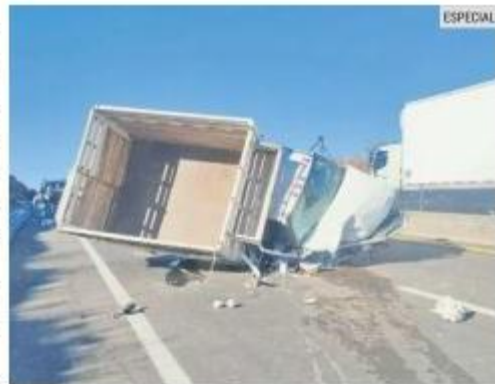
IMPACTO. El accidente también dejó dos lesionados, que fueron enviados al hospital.

De acuerdo con el reporte de las autoridades, los hechos ocurrieron en el kilómetro 90 de la autopista.