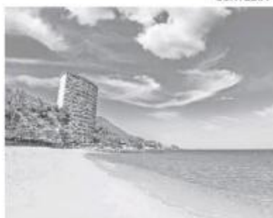
Hoteles poco a poco se recuperan.

De acuerdo con la dependencia, al Área Metropolitana de Guadalajara llegaron 8 millones 259 mil 286 per-