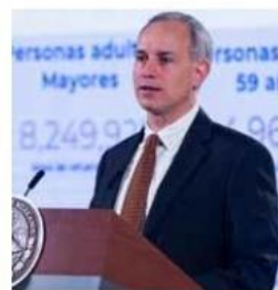
Hugo López-Gatell Ramírez, subsecretario de Prevención y Promoción de la Salud.

Un año después, en el mes de julio, cuando Alfaro Ramírez gestiona ante la Federación para que el Gobierno estatal tuviera una mayor injerencia en el proceso de vacunación, cuestionó de nueva cuenta al subsecretario.