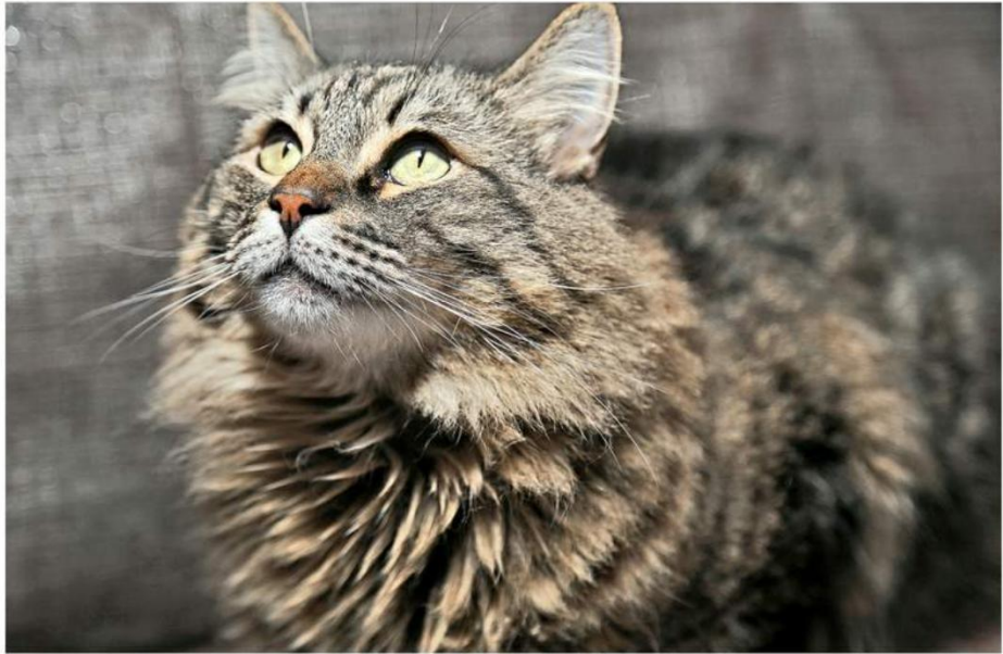
■ Hoy se celebra en México el Día del Gato.

“Otras muestras de amor puede ser que te acicalan y eso es como que te están considerando parte de su manada, entonces llegan y te dan besitos”, abundó Bocanegra.