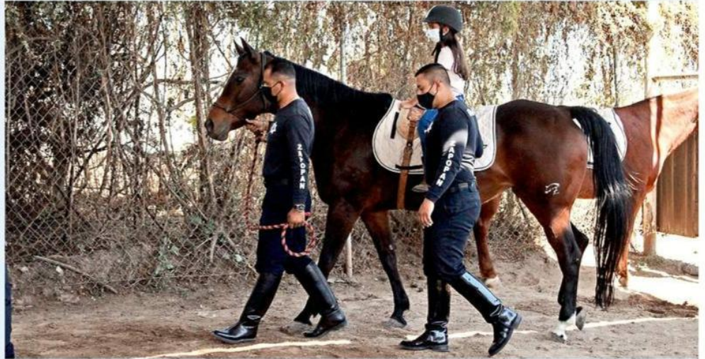
■ Zapopan brinda terapias a niños con discapacidad.

“Desafortunadamente la pandemia interrumpió las equinoterapias, pero esto va a continuar (...) daremos el presupuesto que necesitan para que no haya lista de espera”, aseguró el Alcalde de