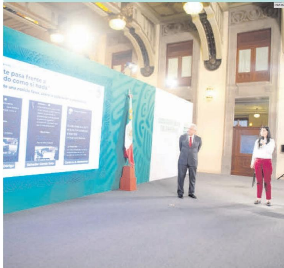
ES NECESARIO. El contrapeso debe venir no solo de los gobernantes, sino las audiencias y otros miembros de la prensa, siempre en el marco de la legalidad.