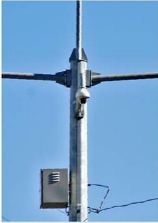
La licitación será para mantenimiento durante este año.

También publicó que dicho grupo ha tenido múltiples señalamientos en diversos proyectos en el País por falta de información básica y sobrepagos, según diversos órganos auditores.