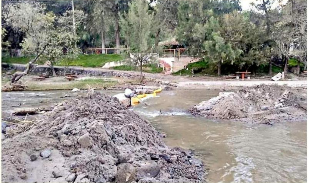
■ Un derrame de diésel en río Caliente, ubicado en La Primavera, mantiene afectada la zona.

Las autoridades señalaron que es imprescindible continuar con la vigilancia y monitoreo de este sitio, y