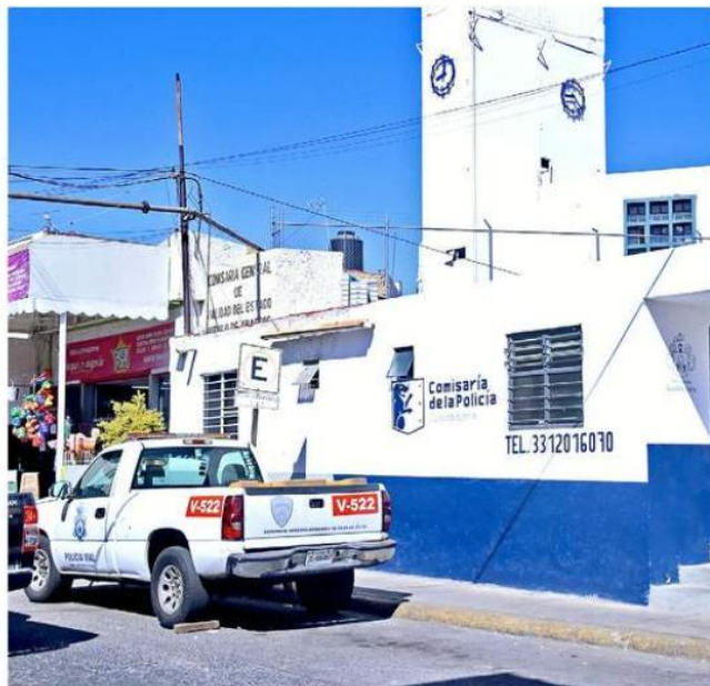
■ El módulo del Mercado de Abastos opera de forma intermitente.