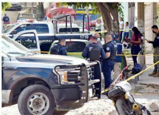
■ En la Colonia Las Huertas atacaron a otra persona.

médicos, tenía diversas huellas de violencia, además de que el deceso fue entre dos y cuatro horas antes de que fuera localizado.