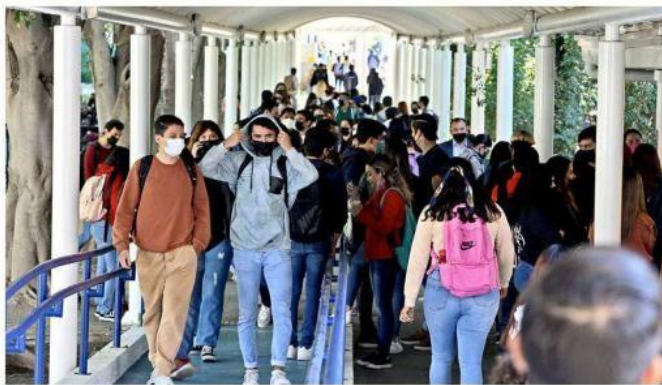
Los pasillos del CUCEA volvieron a la vida con el regreso de los estudiantes a clases.

"Me encanta la idea (de regresar a la presencialidad) porque en clases en línea me distraía mucho y me gusta mucho estar aquí (en el Centro Universitario) convivir