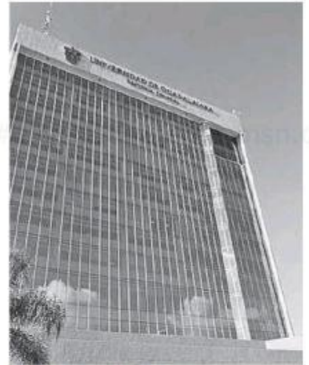
La UdeG excedió el monto.

El presupuesto de egresos aprobado para el ejercicio 2020 para la UdeG, el capítulo 2000 se integró por $774 millones 252 mil 476 pesos, el 3000 por $ mil 656 millones 251 mil 878 pesos, y el 5000 por