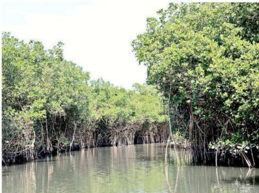
El Estero El Salado fue intervenido por el Gobierno estatal sin un estudio de impacto ambiental emitido por la Semadet.

“Los programas tomados como referencia datan de fechas anteriores a la declaración de Área Natural Protegida, lo cual pone de evidencia que la autoridad estatal (Semadet) dictaminó un proyecto de infraestructura en el ANP con base a criterios y políticas emitidas en