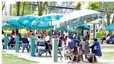
Las áreas comunes se mostraron como antes de la pandemia.

El 17 de marzo de 2020, con motivo de la emergencia sanitaria por Covid-19, la UdeG suspendió las clases presenciales para evitar contagios; ayer, tras 23 meses y 4 días, los 135 mil 347 alumnos de nivel superior y los 183 mil 676 de preparatorias, retornaron a sus aulas.