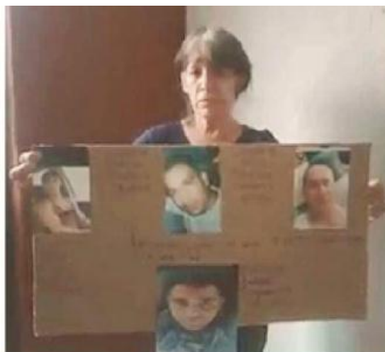
Los hermanos Camarena desaparecieron en 2019.