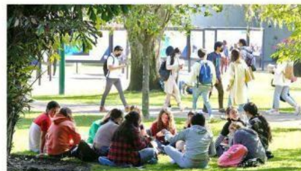
Los jardines fue el lugar ideal para charlar con los amigos.