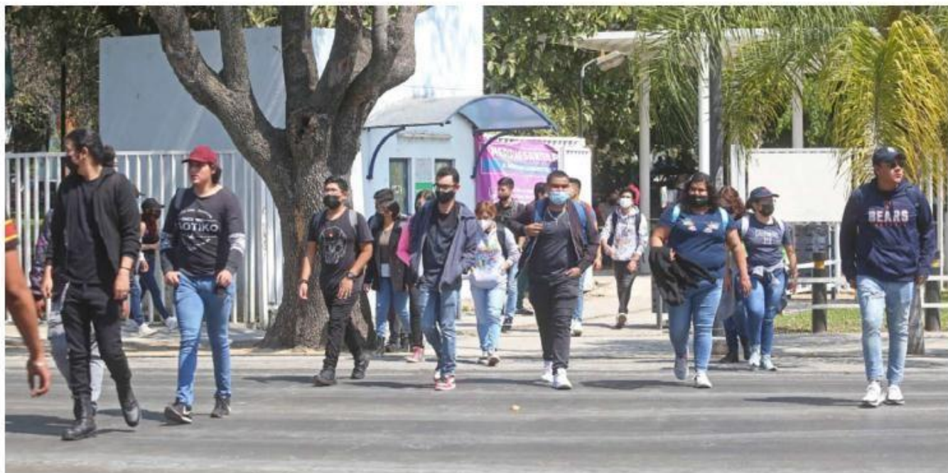
Este lunes, y tras 23 meses y cuatro días, los estudiantes retornaron a las aulas sin incidentes. FERNANDO CARRANZA