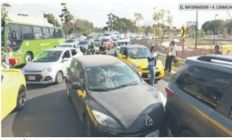
ATORÓN. Los dos accidentes ocurrieron a la altura del DIF Jalisco. De acuerdo con la Policía Vial, el primero fue a las 13:50 horas y el otro minutos después.

Desde el 9 de febrero pasado, la Agencia Metropolitana de Infraestructura para la Movilidad instaló señalamientos verticales para el doble sentido en las calles Carlos Pereira y José Juan Tablada. También se realizaron ajustes en los semáforos para acelerar el tránsito, pero los problemas persisten.