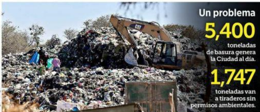
■ La Cajilota, en Tlajomulco, no tiene autorización de la Semadet como estación de transferencia de basura, pero aún así opera.

Actualmente, los únicos rellenos sanitarios metropolitanos autorizados por la Secretaría de Medio Ambiente y Desarrollo Territorial (Semadet) que reciben basura doméstica de recolección municipal son Picachos, en Zapopan, y PASA, en Ixtlahuacán de los Membrillos.