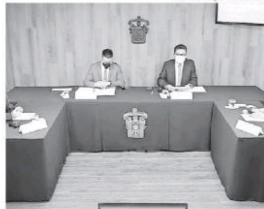
Radio CUCS convocó a sus nuevas voces.

Los programas de la primera temporada estarán disponibles hasta junio, y próximamente se abrirá una nueva convocatoria.