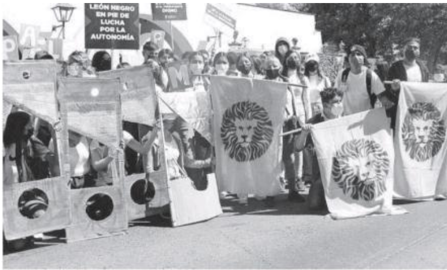
Estudiantes entregaron 2 mil 800 cartas firmadas.