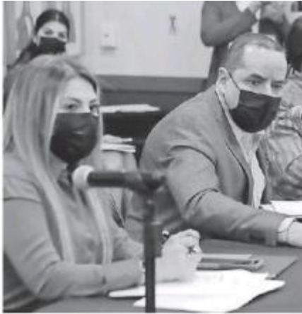
Informe del Simejora.