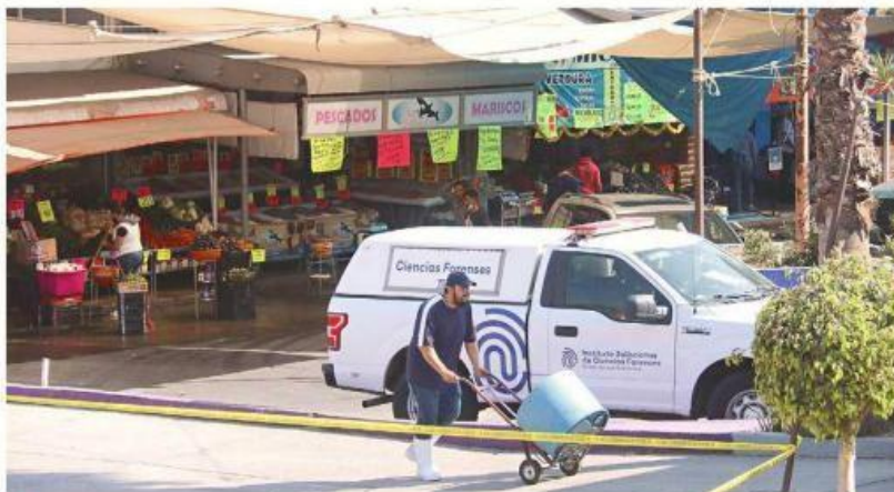
■ Afuera del Mercado Felipe Ángeles encontraron a una víctima.

La víctima tenía entre 45 a 50 años y, según los para-