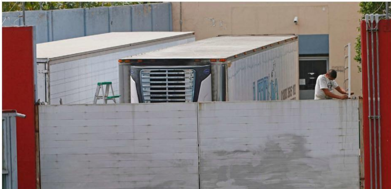
Almacenaban cadáveres en cajas refrigeradas de tráileres en 2018; los vehículos fueron movidos a diferentes puntos de la metrópoli.