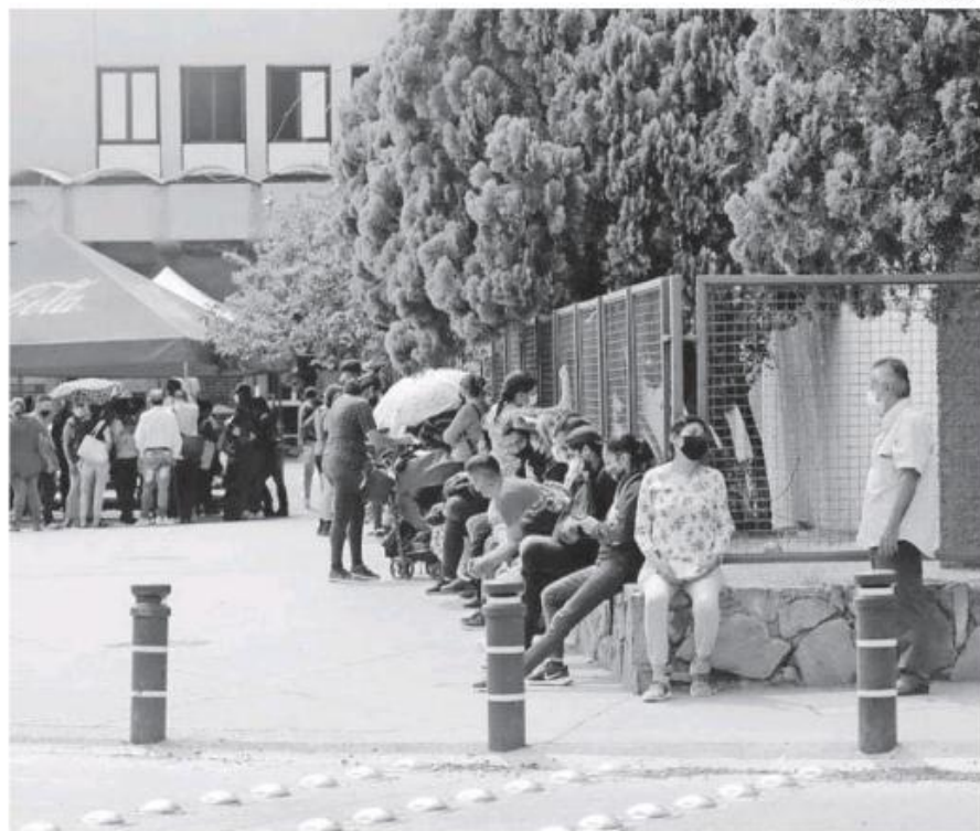
En enero, así fueron las filas de derechohabientes por una incapacidad.

“El IMSS implementó la versión 3.0 del Permiso Covid-19 a principios de 2022, ante la situación de emergencia ocasionada por el crecimiento en la tasa de contagios asociados a la variante Ómicron, en la demanda de atención médica, así como de incapacidades temporales para el trabajo por Covid-19. Con ello se facilitó el trámite digital de las incapacidades por esta enfermedad de manera más flexible a través de un cuestionario de síntomas, lo cual permitió que los asegurados contaran con protección legal ante sus patrones y poder resguardarse debidamente en casa. También esta acción permitió el desahogó la