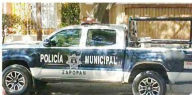
■ Policías de Zapopan fueron vinculados por abuso de autoridad.