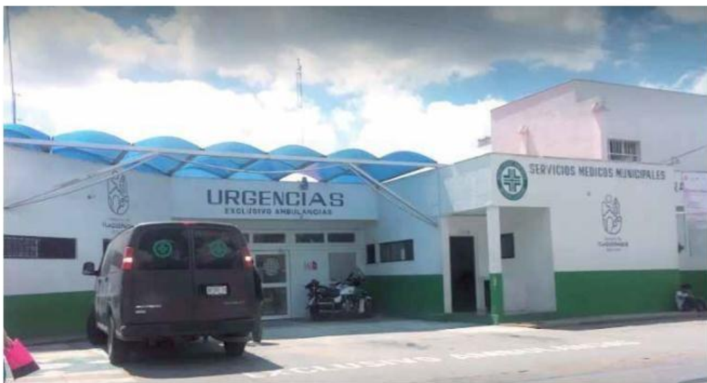
FALLECIMIENTO. Una de las víctimas alcanzó a ser trasladada a Cruz Verde Marcos Montero, pero murió.

El hombre alcanzó a ser trasladado a Cruz Verde Marcos Montero, donde murió.