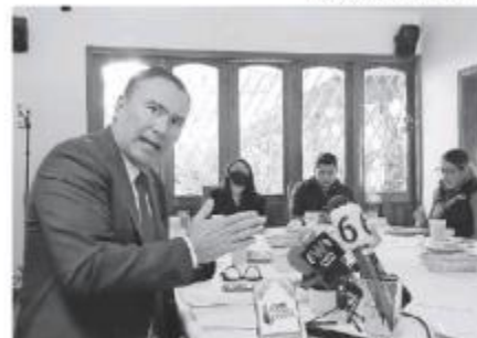
El diputado federal emecista.

El Ejecutivo Federal presentó la iniciativa a la Cámara con el objetivo de reformar los artículos 25, 27 y 28 de la Constitución.