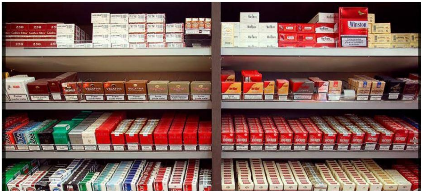
La mayor percepción se dio en comercio al por mayor, alimentos, bebidas y tabaco, con 322.1 mdd. ESPECIAL