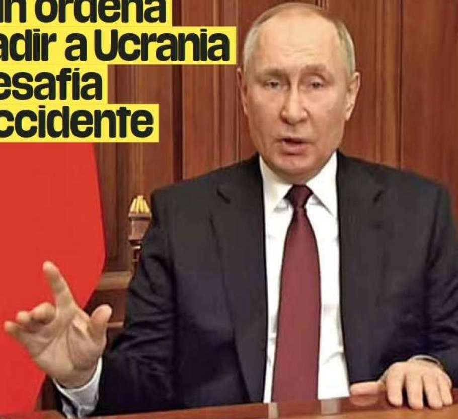
En mensaje televisado, Vladimir Putin expuso que entra al país para defender a los separatistas y pide que ucranianos depongan las armas.

Mundo. López Obrador aseguró que, para afrontar el alza del precio del gas y para garantizar el suministro eléctrico, tirará de las centrales hidroeléctricas y del combustóleo. Por su parte, Biden dice que responderá al ataque. Pág. 04