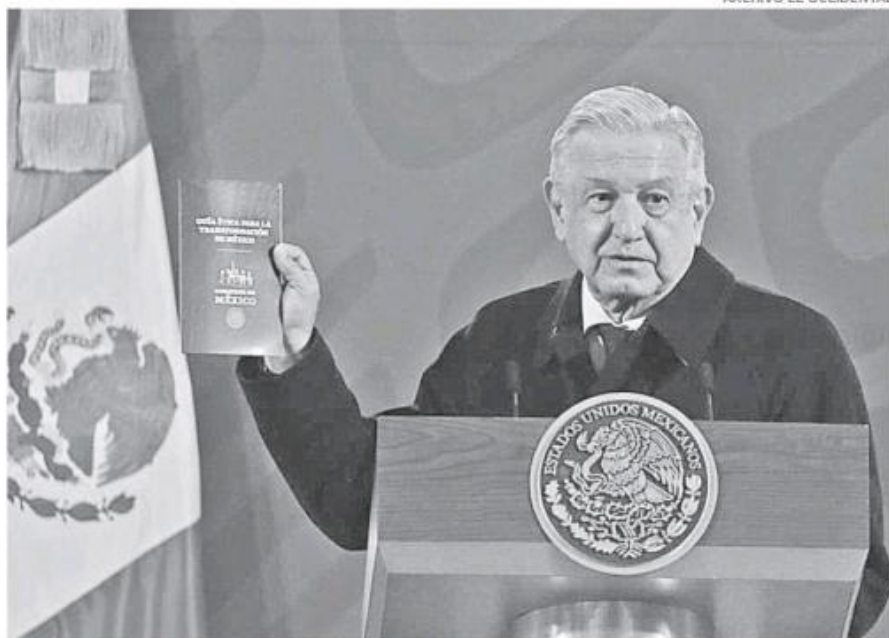
El presidente Andrés Manuel López Obrador visitará Colima.

Por cierto, trasciende que las organizaciones ciudadanas dedicadas a la defensa del medio ambiente se preparan de manera importante para defender espacios verdes de la ciudad y sus bosques. Vienen momentos complicados, los incendios intencionales y otras acciones, y ya se alistan varios de ellos, esperando por supuesto