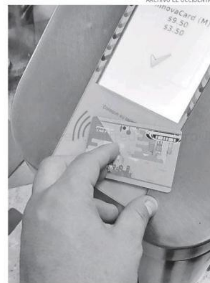
Las tarjetas electrónicas ya son de uso cotidiano.

Aunado a estos documentos, la dependencia estatal informó que por cada grupo poblacional se tendrán que presentar otros adicionales. En el caso de personas con discapacidad deberán llevar un certificado que avale su condición; estudiantes tendrán que presentar kardex, credencial u orden de pago que acredite que son alumnos en activo; y a jefas de familia se les pedirá una carta bajo protesta de decir verdad.