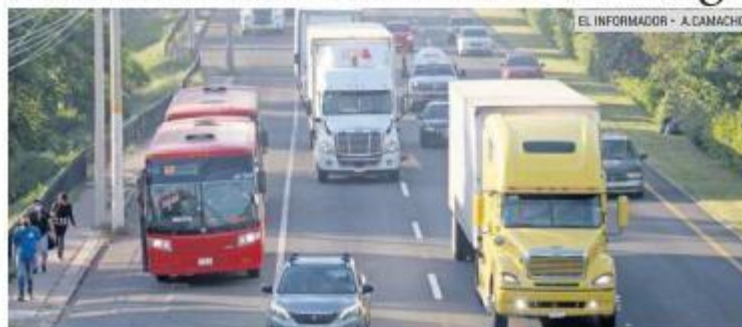
TRÁNSITO. Está en proceso un estudio sobre la velocidad en avenidas.