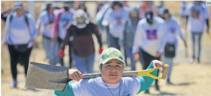
BÚSQUEDA. Colectivos realizan trabajos para hallar fosas en distintas zonas de la Entidad, con el objetivo de encontrar a sus seres queridos.