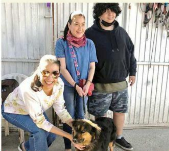
La perrita “Tomasa” fue adoptada luego de ganarse el cariño de su nueva familia.

Si desea pasar un día con los perros más viejitos del refugio, puede comunicarse con Grecia Ávila, al teléfono 332-255-1479, o con Ixta Ulloa, al 332-752-7405.