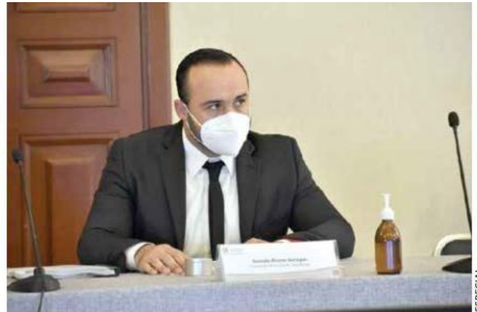
MÁS ALLÁ. El alcalde de Zapotlanejo pide una ruta para conectar al municipio con Periférico y la Central Nueva.

Además de la mesa específica en materia de transporte público, el gobernador propuso iniciar los trabajos de otra que trate temas como semaforización, movilidad no motorizada,