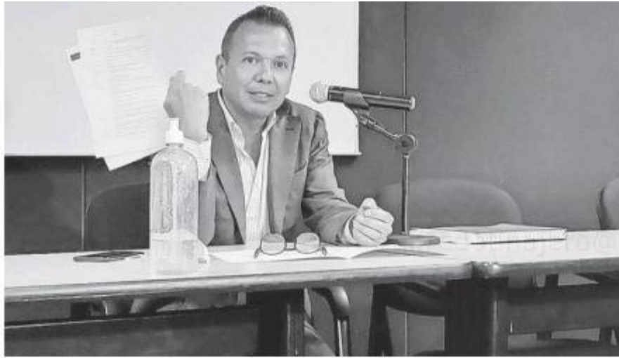
Pablo Lemus , alcalde de Guadalajara.