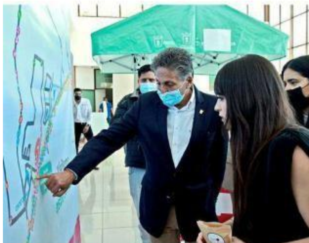
■ El programa Senderos Seguros en Zapopan buscará abarcar primarias, secundarias, prepas y universidades.

El Ayuntamiento ofreció a los estudiantes levantar reportes a la línea telefónica 332-410-1000, las redes sociales del Gobierno de Zapopan en Facebook, Twitter e Instagram, así como el chatbot con el que se puede interactuar mandando mensaje vía WhatsApp al 333-818-2222.