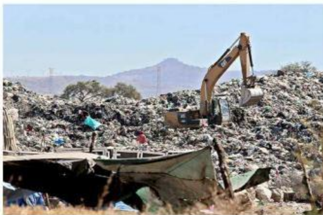
Los malos olores de la basura cubren fraccionamientos cercanos a los vertederos.

Aunque el olfato llega a fatigarse y deja de percibir el hedor, los gases que lo gene-