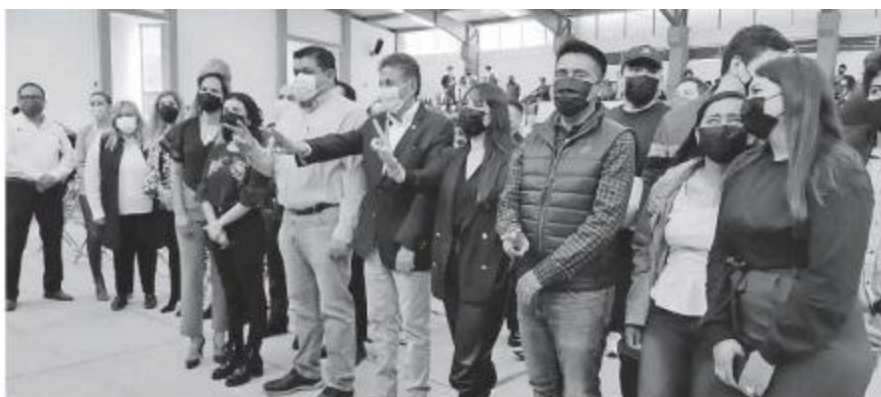
Anuncian el reinicio del programa de seguridad.