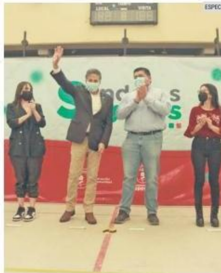
PROGRAMA. El Instituto Tecnológico José Mario Molina Pasquel será beneficiado con esta iniciativa.

Senderos Seguros forma parte de las acciones de la Coordinación General de Construcción de Comunidad.