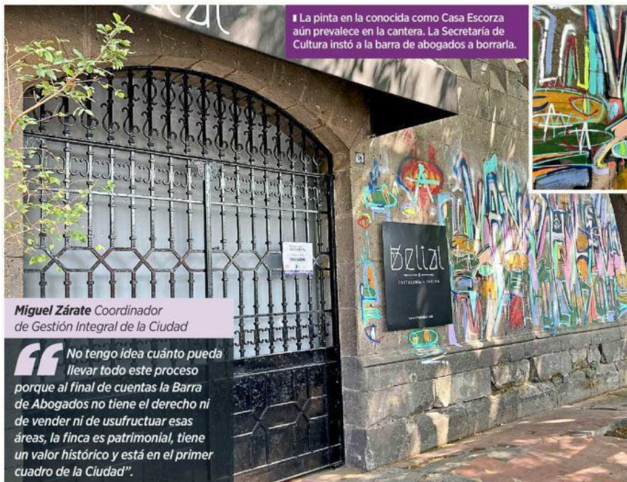
La pintura en la conocida como Casa Escorza aún prevalece en la cantera. La Secretaría de Cultura instó a la barra de abogados a borrarla.

"Dentro de la cláusula quinta (del contrato de permuta) se