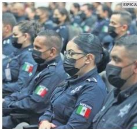
CALIDAD DE VIDA. El Ayuntamiento busca otorgar mejores condiciones para los oficiales.

Zapopan Bilingüe es una beca para que las y los hijos de policías, de los ocho a los 25 años, aprendan el idioma inglés.