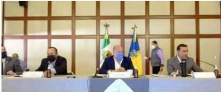
Enrique Alfaro Ramirez, gobernador del estado de Jalisco, al presidir la Junta de Coordinación Metropolitana de Guadalajara.

efectivo que no podemos perder, porque creo en ese mensaje que decía la presidenta de Tlaquepaque: que la unidad, más allá de agendas políticas y personales, es clave.