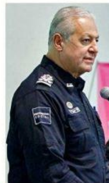
Jorge Arizpe García, Comisario de Zapopan.

Finalmente, Mi Estancia Zapopan es un subsidio mensual de mil 200 pesos por menor o mil 500 en el caso de tener menores con alguna discapacidad, para que puedan pagar sus servicios de guardería, estancia infantil y preescolar.