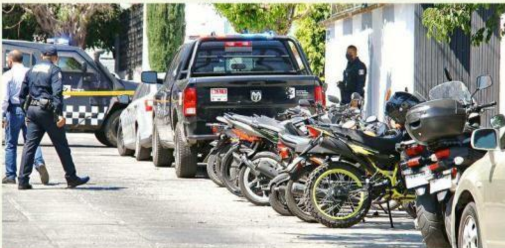
La finca se encuentra en Calle Paricutín y Montes Pirineos.

El sospechoso traía un objeto punzocortante y he-