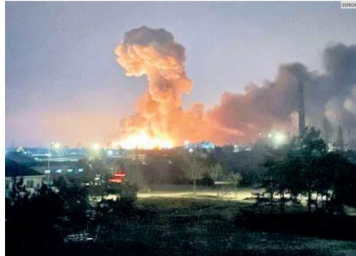
ATAQUE. En Kiev, Járkov y Odesa se oyeron grandes explosiones antes del amanecer, mientras los líderes mundiales condenaban el inicio de una invasión rusa que podría provocar enormes bajas y derribar al Gobierno ucraniano.

Recuerda que en 2017, Tlajomulco denunció a Pemex por un derrame de combustible, pero presentó sus recursos ante la Federación y se resolvió. Esa acción exhibe al Estado.