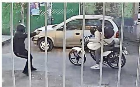
El agresor corre para interceptar a la víctima en la privada.

La iniciativa, que será presentada el lunes, sólo contempla la acción en el Centro, el corredor Chapultepec, Providencia y el Paseo Alcalde.