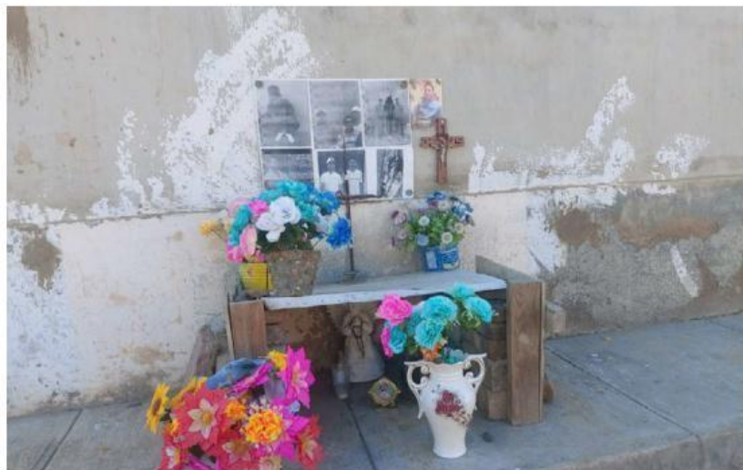
Colocan flores y velas en honor a los trabajadores asesinados. ROSARIO ÁLVAREZ

Ese sábado, los once trabajadores de la construcción habían terminado su jornada laboral,