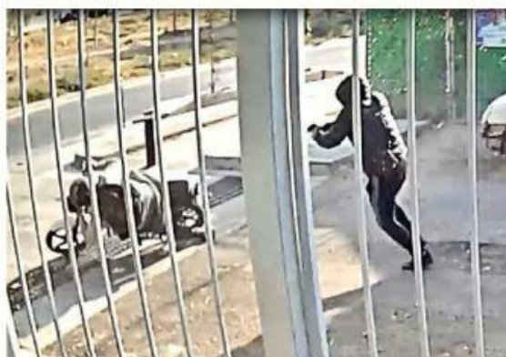
La víctima cae, pero el atacante sigue accionando el arma.