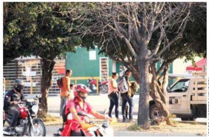
INDICE A IEGDTN & MCMUNDTA

La herramienta desarrollada por el IIEG tiene más de 19.6 millones de datos correspondientes a 91 mil 750 manzanas.