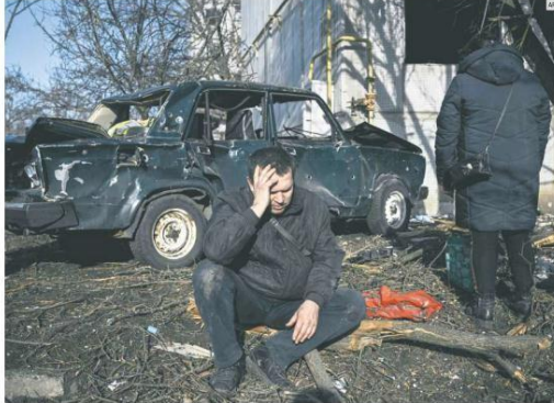
PRIMEROS DAÑOS. El ataque de Rusia causó innumerables afectaciones en diferentes ciudades de Ucrania, en la imagen, un hombre se sienta afuera de su edificio destruido después de los bombardeos en la región Este de esa nación.