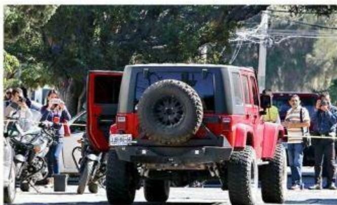
El trabajador de la CEDHJ viajaba en un Jeep cuando lo interceptaron, el 24 de noviembre de 2017.