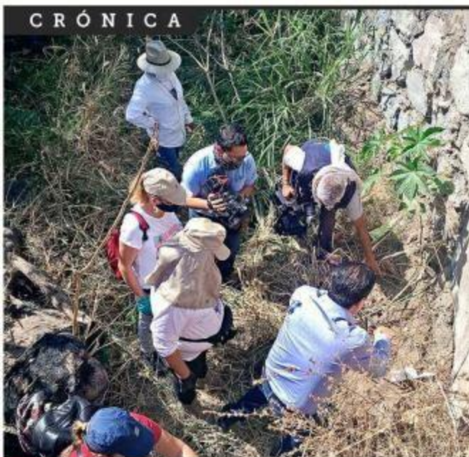
■ Ayer se cumplió el cuarto día de labores en la Ciudad, de las Madres Buscadoras de Sonora.

El lugar ya había sido revisado el martes por la tarde gracias a un anónimo, pero no se halló nada. Esta vez, el anónimo dejó una marca para ubicarlas.