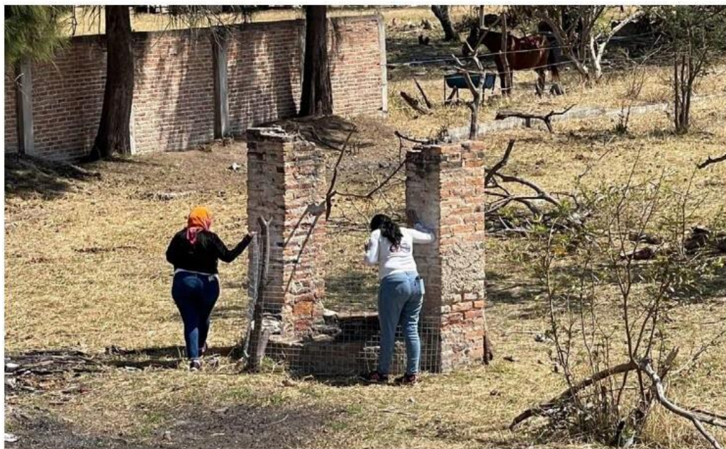
Integrantes de colectivos siguieron inspeccionando puntos en el municipio. KARLA VICTORIA RODRÍGUEZ

Al activarse una alerta de una persona desaparecida en Tlajomulco de Zúñiga, los elementos que la conforman se desprenderán de sus comandos y se unirán para comenzar el operativo de búsqueda. “Esta estrategia estará siendo coordinada con las autoridades federales y estatales, y reiteramos que vamos a seguir haciendo lo que nos toca por encontrar en algún momento, estoy seguro que así será, la paz y la tranquilidad que esperamos todos quienes habitamos nuestro municipio”,