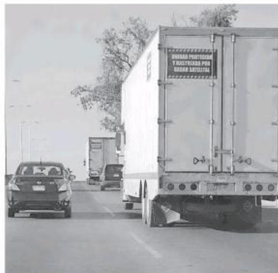
Sería entre las 6 y las 11 de la mañana.

Indicó además que buscarán a través de la Secretaría de Comunicaciones y Transportes (SCT) abrir un tramo que conecte la autopista Collima-Guadalajara con el par-