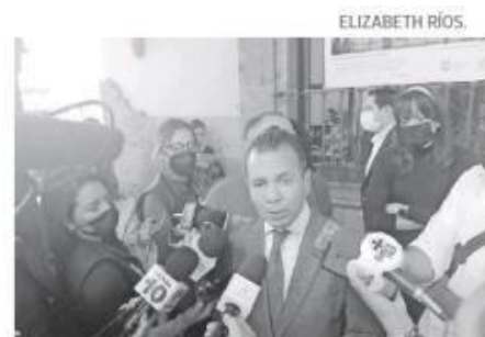
Pablo Lemus, alcalde Guadalajara.

" La verdad es que tengo dudas, o sea, debo