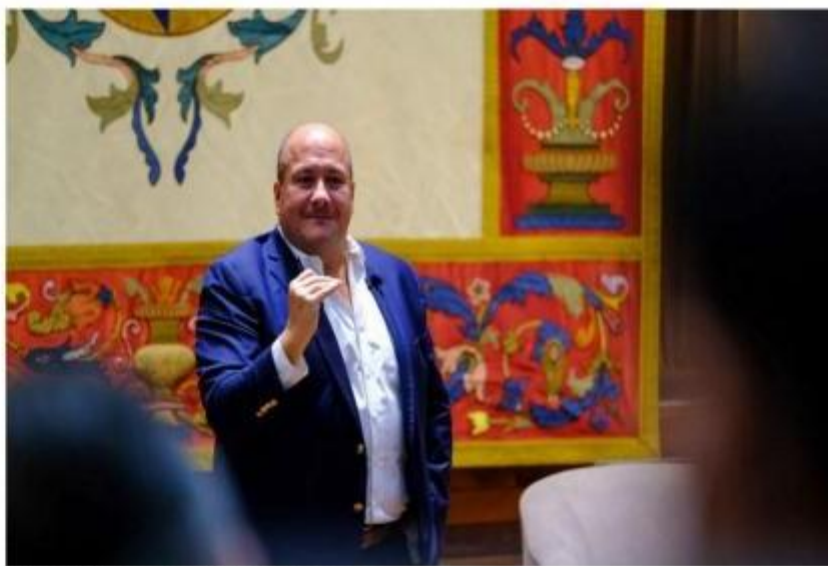
El Gobernador del Estado, Enrique Alfaro Ramírez.

El Gobernador del Estado, Enrique Alfaro Ramírez, presentó ante empresarios de Jalisco las acciones que se han tomado ante la pandemia donde después de dos años se realizó un modelo exitoso de la mano de expertos y dónde se creó una mesa de trabajo permanente para la alerta del COVID-19. Ahí resaltó que el estado fue de los primeros en tomar las decisiones de confinamiento y uso de cubrebocas en áreas públicas.