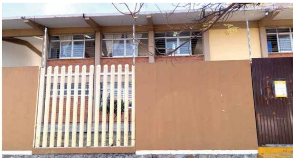
TRAS RESOLUCIÓN DE OIT. La docente volvió al trabajo frente a grupo el lunes.