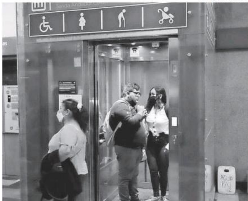
No hay respeto alguno por los elevadores exclusivos del tren ligero y Macrobus.