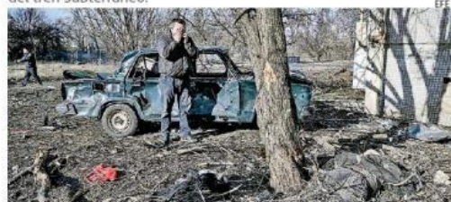
Se cuentan al menos 137 muertos en las primeras horas de ataque del ejército ruso.