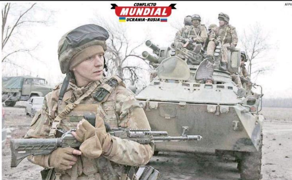
Los dejaron solos: el ejército ucraniano se prepara para defender su territorio.