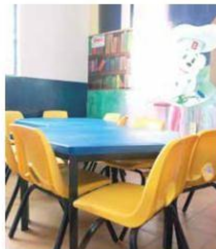
EMPRESA PRIVADA. En la renovación de la biblioteca participó Bimbo.

“Es la segunda biblioteca que trabajamos en colaboración con Bimbo. Para nosotros es muy grato poder tener esta vinculación con la iniciativa privada, en especial con Bimbo porque nos da herramientas”, comentó.