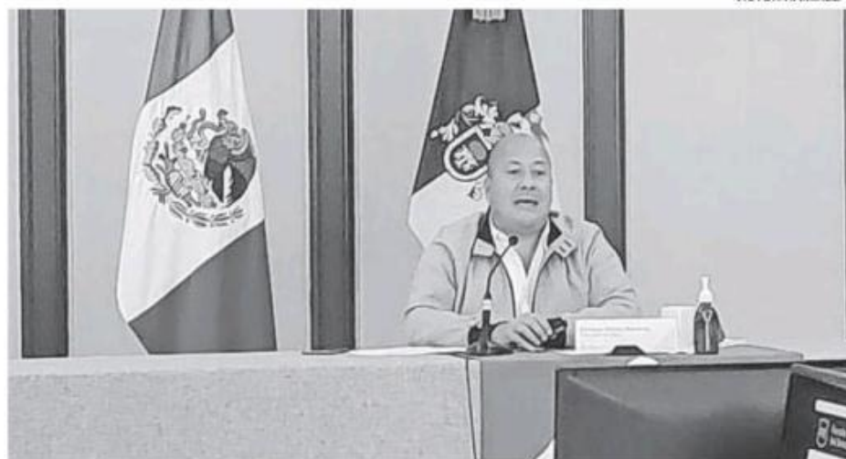
Enrique Alfaro, gobernador de Jalisco, habló sobre el conflicto entre Rusia y Ucrania.