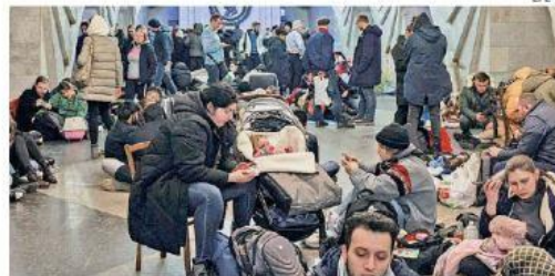
En Kiev, capital de Ucrania, ciudadanos durmieron en los andenes del tren subterráneo.

Las batallas continúan a lo largo de la frontera norte con Bielorrusia, en Lugansk y Donetsk en el este y alrededor de Kherson, el río Dneiper y las ciudades portuarias de Odessa y Mariupol en el sur. Un alto funcionario de Defensa de EU dijo que Rusia ha disparado más de 160 misiles contra objetivos ucranianos. Págs. 3, 4 y 13 y 14