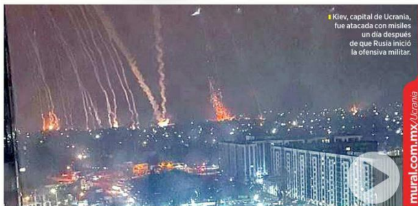
Kiev, capital de Ucrania, fue atacada con misiles un día después de que Rusia inició la ofensiva militar.