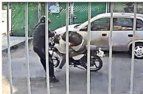
Dispara al motociclista, quien acababa de salir de su casa.