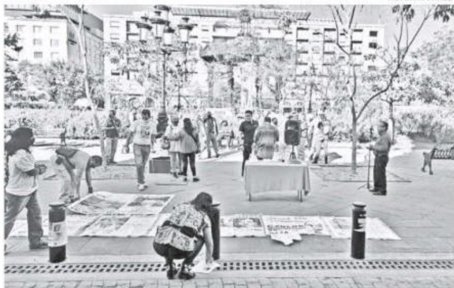
Frente a Palacio de Gobierno se manifestaron.

Es por eso que todos unieron esfuerzos y causa para decir a una sola voz "ya basta, no más, ya Jalisco no soporta vivir en la inseguridad donde nuestro bienestar, nuestra salud y nuestra vida está en juego, ya no podemos poner a los enfermos, a los muertos sin que nada suceda", es por eso que "a partir de hoy vamos a marchar juntos, en una unidad y aunque cada lu-