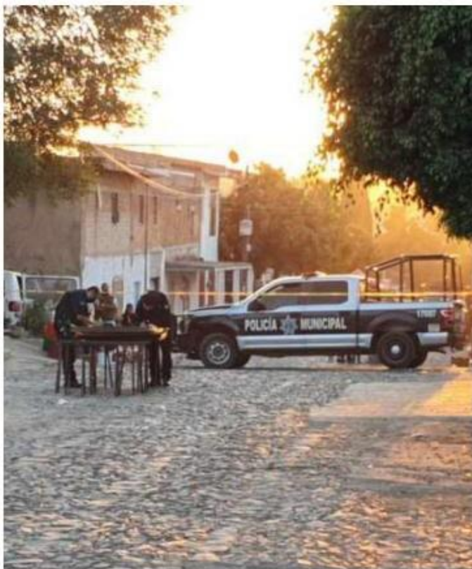
El hecho ocurrió en Lomas del Tapatío. JUAN CARLOS MUNGUÍA

Los lesionados son un hombre de tercera edad, quien recibió un impacto de bala en la cadera, y un joven de 32 años, con