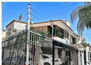
En la colonia varias fincas están resguardadas con mallas, cercas eléctricas y demás medidas de protección.

El año cerró con mil 949 robos de auto, 76 por ciento