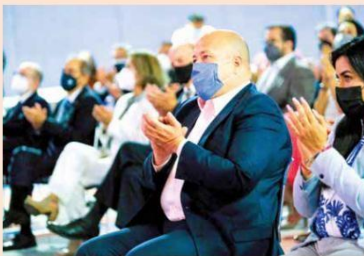
DIÁLOGO. Enrique Alfaro informó que se comunicó con el gobernador de Michoacán tras los hechos de violencia.

“Desde temprano en reunión de la Mesa de Seguridad (se planteó) establecer una estrategia de reforzamiento de la presencia (policial) en los límites de Michoacán en coordinación con el Ejército (y) la Guardia Nacional; la Policía Estatal está reforzando su presencia ante los hechos ocurridos el día de ayer (domingo) en San José de Gracia, Michoacán, por la cercanía que tiene, particularmente, con el municipio de Mazamitla”.