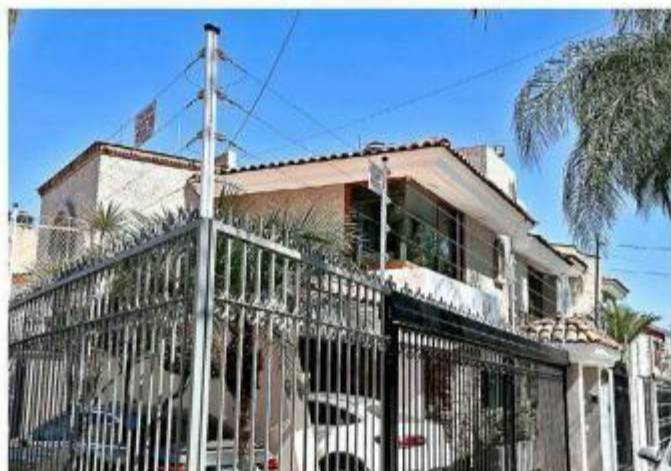
■ En la colonia varias fincas están resguardadas con mallas, cercas eléctricas y demás medidas de protección.

El año cerró con mil 949 robos de auto, 76 por ciento