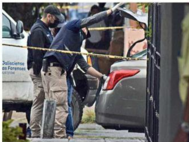
El año pasado, en "La Consti" se registraron 3 casos de desaparición y 3 homicidios dolosos.

de 2022, la dirección de Cultura lanzó el Corredor Cultural, a un costado de ese centro, con la misma intención.