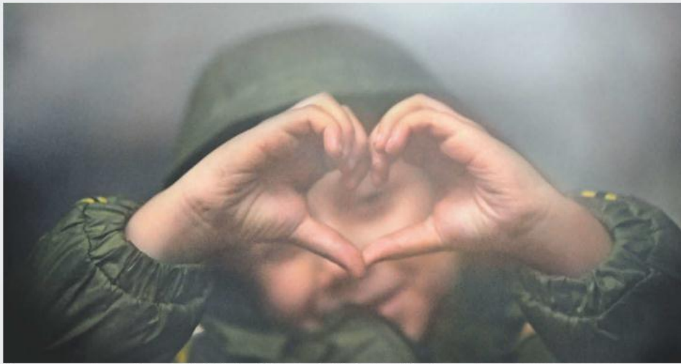
Un menor ucraniano realiza un gesto de fraternidad en la estación de Nyugati, en Bucarest.