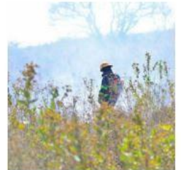
Arranca operativo. ESPECIAL

Personal de Protección Civil y Aseo Público realiza labores de limpieza en zonas de riesgo para evitar siniestros. PÁG. 9