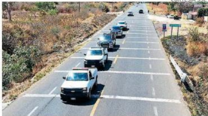
Elementos de la Secretaría de Seguridad de Jalisco ya se encuentran desplegados en municipios colindantes con Michoacán.

en la reunión de la Mesa de Seguridad se acordó realizar estos cambios tras conocer el informe de las 17 personas asesinadas en dicha comunidad michoacana y ante la cercanía con Jalisco, se decidió estas acciones de forma inmediata. Alfaro Ramírez dijo que no se tienen identificados riesgos para la población civil. PÁG. 10