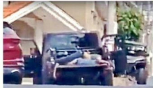
El comando que fusiló a 17 personas en Michoacán levantó los cuerpos y limpió la escena del crimen.

La colonia tuvo además el cuarto lugar del Municipio en robo a casas. Sumaron 13, y el decimosegundo en robo a negocios, con 22. No es gratuito que en la colonia varias fincas estén resguardadas con mallas, cercas eléctricas y demás medidas de protección.