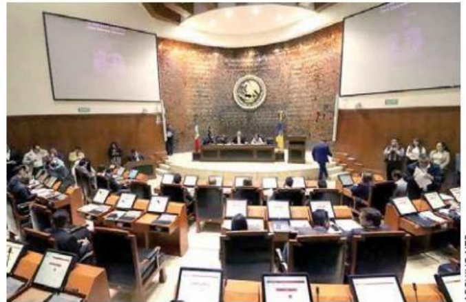
NO FUE UNÁNIME. El Congreso local avaló el gasto con 29 votos a favor y nueve en contra.

A la par acusó que no hubo voluntad para reducir la nómina, pues no se dieron de baja seis plazas vacantes por jubilaciones o muertes, así como 14 más por interinatos.