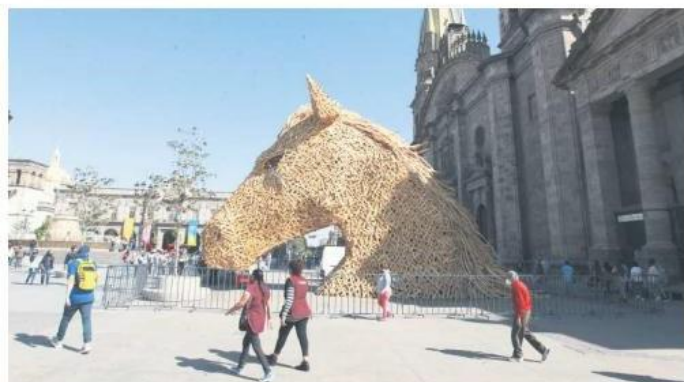
FIGURA ALUSIVA A UN CABALLO. La impresionante escultura ya se encuentra en el exterior de la Catedral.

De igual forma, Plaza Liberación albergará un show multimedia con actuación de DJ; el Paseo Fundadores tendrá escenarios donde actuarán 14 bandas musicales emergentes; la Zona Neón y un espectáculo de más de 800 mil píxeles se apreciarán en Plaza Tapatía y el Museo Cabañas ofrecerá, entre otras atracciones, la escultura tridimensional del Hombre de Fuego, de Orozco, y el espectáculo de Mariachi Rocko (también a las 20:00, 21:00 y 22:00 horas).