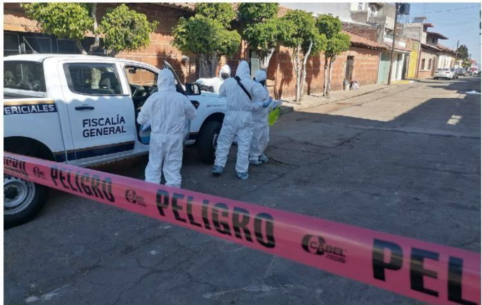
El fusilamiento ocurrió a unos pasos de la plaza principal del municipio.

Momentos más tarde de haberse ejecutado el multihomici-