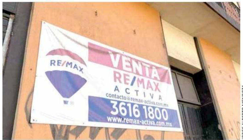
INDICE AL DOSTO AEMINUTTA

La funcionaria consideró que otra razón del aumento en la venta de casas por la vía virtual podría ser que “efectivamente ha aumentado la oferta y construcción de viviendas a lo largo de la ZMG, o sea, ha habido mayor construcción de casas y departamentos y