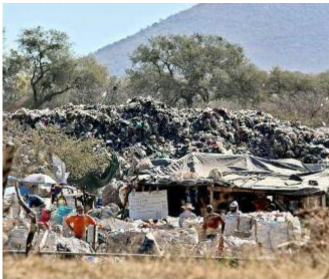
■ El predio de La Cajilota comenzó a ser utilizado como basurero a cielo abierto y se expandió la montaña de basura.

“Ya no se está quedando basura ahí, la transferencia de la basura está dándose, vamos lentos, pero esperamos que el concesionario cumpla, se comprometió a triplicar el número de góndolas para dar el servicio (...) todos los días apretándolo, como ustedes saben son muy orejones”, justificó Zamora.