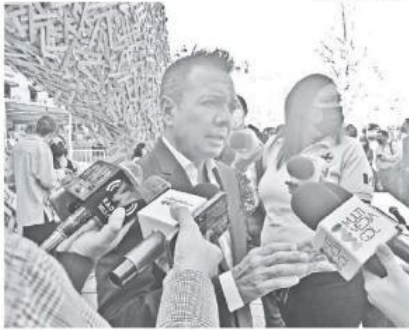
Pablo Lemus , alcalde de Guadalajara.

“Sí estamos viendo ubicaciones para que las tradicionales empanadas se puedan poner, ejemplo el propio Mercado Corona y sus alrededores, los alrededores de Jardín Reforma o San José, también la explanada de los Dos Templos”.