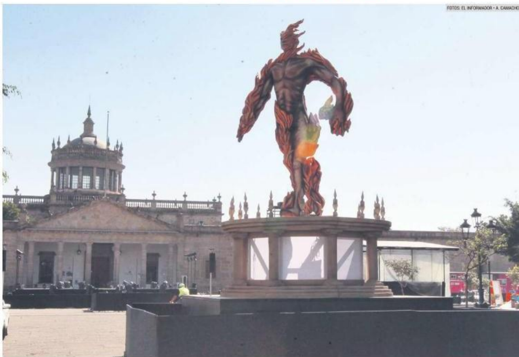
HOMBRE DE FUEGO. La espectacular efigie será parte de GDLuz, y ya se encuentra en el exterior del Museo Cabañas.

El director creativo del festival, Marcos Jiménez Monroy, señaló que GDLuz es el evento de su tipo “más grande de Latinoamérica”, un evento “que la gente disfruta” y con el que se genera “sentido de orgullo y pertenencia”; así, de las “40 actividades previstas” en el recorrido de 2 km que irá de la Catedral al Museo Cabañas, destaca el inicio con el tributo “en honor” de Vicente Fernández, con un video mapping, una escultura alusiva y monumental de un caballo, así como tributo musical de la Banda Municipal y un mariachi, todo esto en Plaza de Armas (a las 20:00, 21:00 y 22:00 horas).