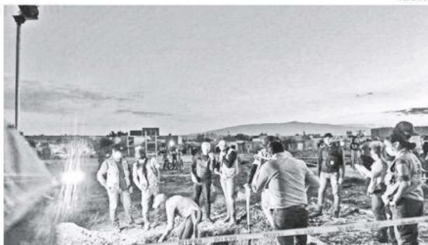
Madres Buscadoras de Sonora encontraron varias fosas en Tlajomulco.