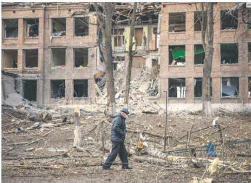
RESISTENCIA. Autoridades ucranianas afirman que Rusia trata de aumentar la presión en medio de las conversaciones. En la imagen, un hombre camina frente a un edificio destruido después de un ataque en la ciudad de Vasylykiv, cerca de Kiev.

Mientras las conversaciones sólo consiguen un acuerdo para seguir hablando, Rusia envía caravana de tanques que abarca 64 kilómetros