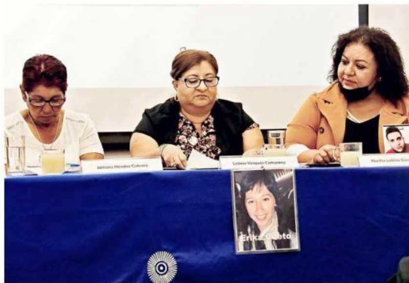
■ Diversos colectivos y el CEPAD hicieron el análisis ayer.

La mujer pidió que se sancione a quienes no cumplan con el documento que