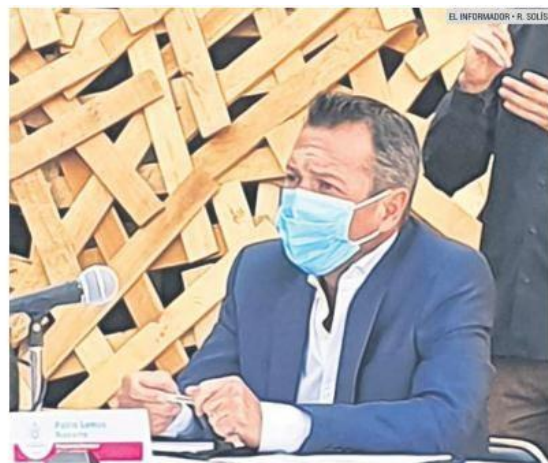
PABLO LEMUS. El alcalde de Guadalajara compartió que estamos ante la "oportunidad de reposicionar Guadalajara como Capital Cultural de Latinoamérica".

Indicó el presidente municipal que esto "es una gran noticia, porque dentro del MUPAG deseamos colocar distintas exposiciones itineran-