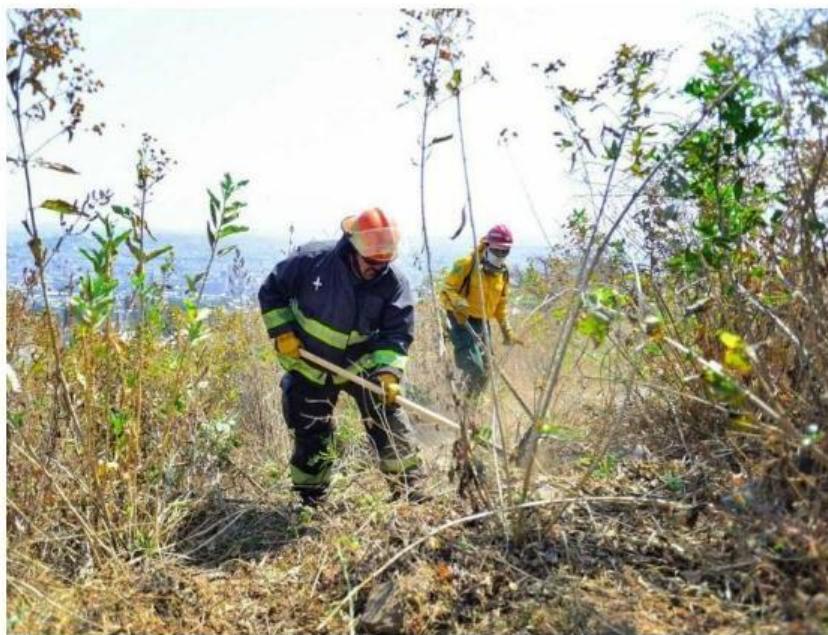
Personal de Protección Civil lleva a cabo trabajos de limpieza.

2 mil 670 hectáreas en las que comúnmente se presentan incendios, la mayoría provocados por las personas. "Tenemos la principal que es el Cerro del Cuatro con 260 hectáreas en áreas donde es susceptible a incendiarse, tenemos después el Cerro del Gato y después a San Juan, con 115 hectáreas, el Cerro del Tesoro con 40, el Cerro de Santa María con 20 hectáreas, y unas áreas que están cercanas al Arroyo de En medio, ahí tenemos 15 hectáreas también en las inmediaciones del fraccionamiento Villa Fontana, con 13 hectáreas", dijo Manzano.