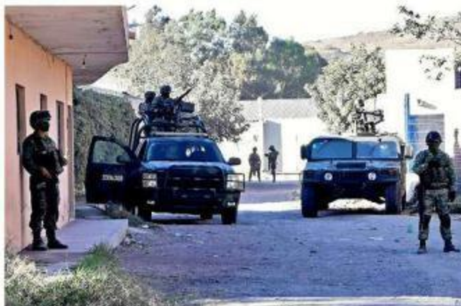
La detención ocurrió el 10 de febrero de 2021, en Toluquilla.

El familiar aseguró también que no hubo un registro de la detención, que no se dio aviso al consulado, pese a