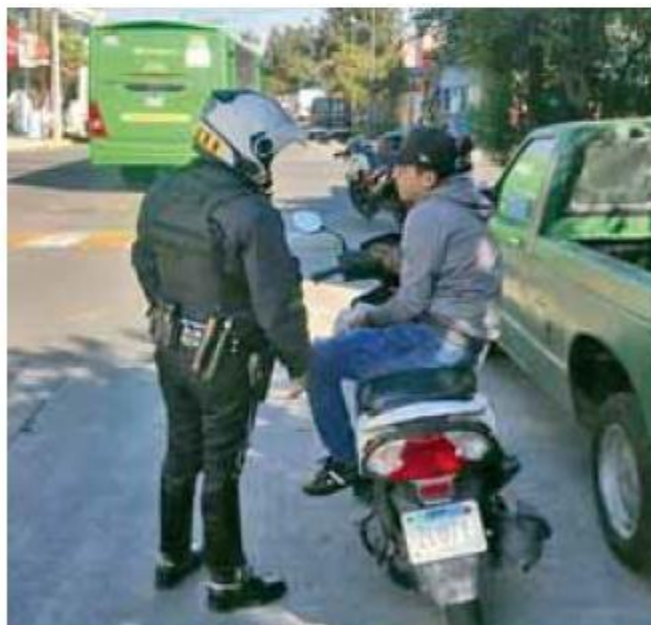
Cultura Vial. No se ha podido educar a la población sobre esta deficiencia.

Estadística. Entre 2015 y 2020, estos percances provocaron la muerte a cerca de 400 personas; más que los choques de automóviles