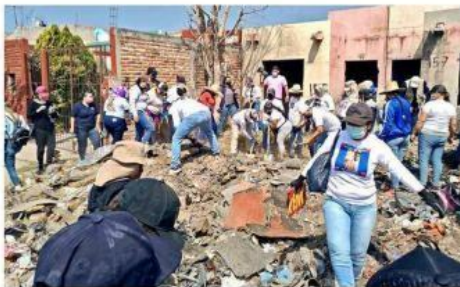
La búsqueda se concentró en el Fraccionamiento Chulavista.

“Se estuvo trabajando en diferentes aspectos, desde un hallazgo que se encontraba