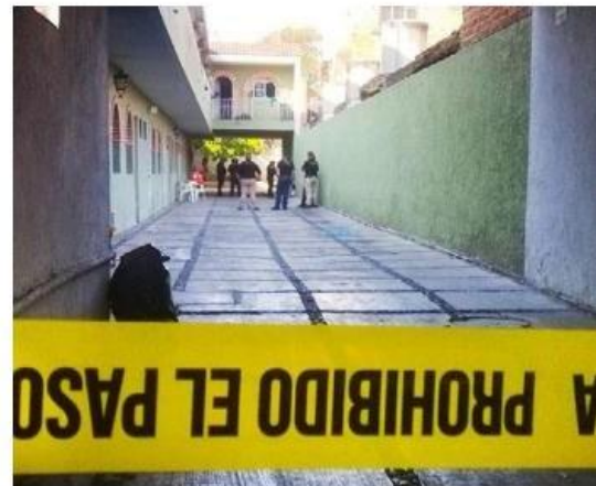
Las menores tenían dos días solas en un cuarto. USITOLEDO

El caso fue vinculado al Ministerio Público para investigar el paradero de la madre y resguardar a las pequeñas. ■