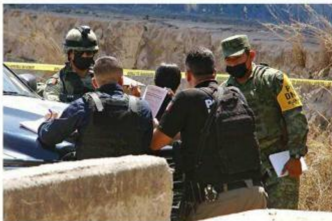
■ En Tlaquepaque fue asesinado a tiros un muchacho.

En ninguno de los casos se reportaron personas detenidas.