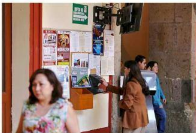
Los diputados contratan a personal supernumerario y éste no tiene obligación de registrar hora de entrada ni salida.

Para contratar personal supernumerario, cada uno de los 38 diputados locales tiene una bolsa mensual de 219 mil 495 pesos, y hasta la primera quincena de febrero el Congreso sumaba una plantilla de 400 empleados bajo esa modalidad.