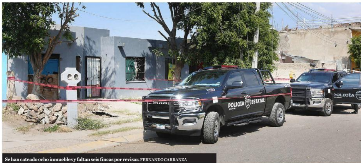
Se han cateado ocho inmuebles y faltan seis fincas por revisar. FERNANDO CARRANZA