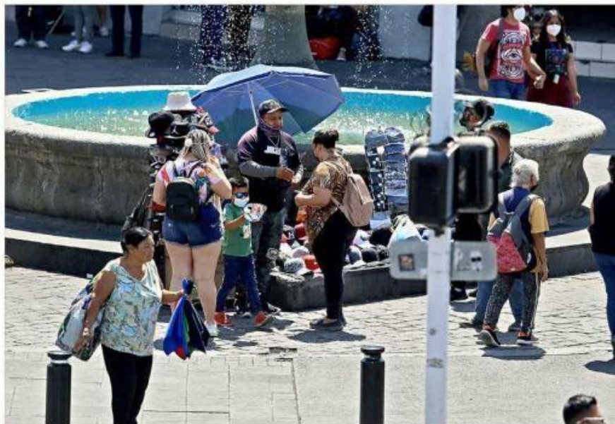
Este ambulante ofreció ayer gorras sin ningún problema.

En la Avenida 16 de Septiembre, entre Calzada Revolución y la Calle Colegiales, y a las afueras del Mercado Corona, también se observó ambulante.