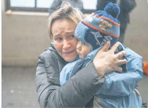
DOLOR. Una mujer sostiene a su hijo mientras intenta abordar un tren gratuito a Polonia en una estación de Lviv, en Ucrania occidental, luego de que las fuerzas rusas tomaron la ciudad de Jersón, el primer centro urbano importante en caer.

"Se busca tener un registro de prestadores de servicios, regular hacia la digitalización, capacitación y profesionalización, que se sepa cuando vas con un asesor reconocido y que tiene licencia".