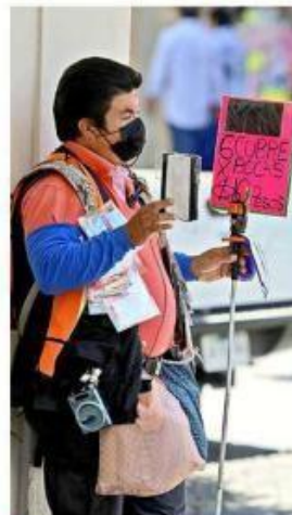
Ante la pandemia de Covid, se ha disparado la venta de cubrebocas.

Luego del decomiso de los artículos, los comerciantes tienen 15 días para pagar la multa correspondiente –que puede oscilar entre los 2 mil 200 y 3 mil 500 pesos– y acreditar ante la autoridad competente la propiedad de los bienes incautados para su posterior devolución.