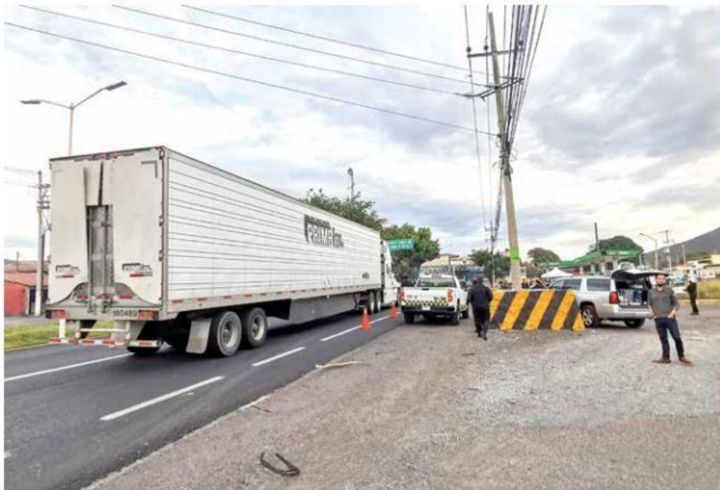
AFECCIÓN. En el Comce aseguran que los robos han generado pérdidas millonarias.

“No sólo la carretera Manzanillo-Guadalajara es donde hay