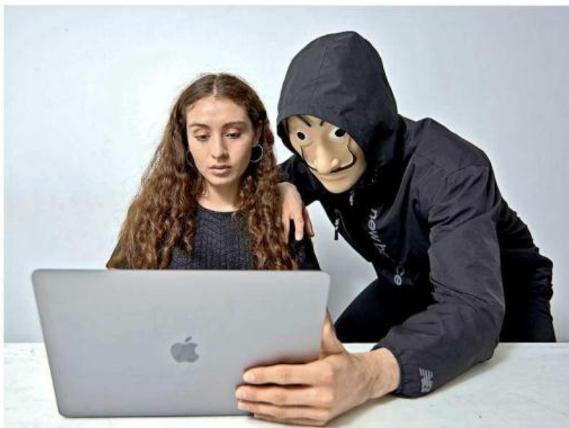
La Ley de Acceso a las Mujeres a una Vida Libre de Violencia en Jalisco se reformó en 2020 tras aprobar la Ley Olimpia en el Estado.

Ciberacoso, fraude de compra venta, fraude amoroso y robo de identidad, son otras de las modalidades de este tipo de delito que se presentaron durante el periodo