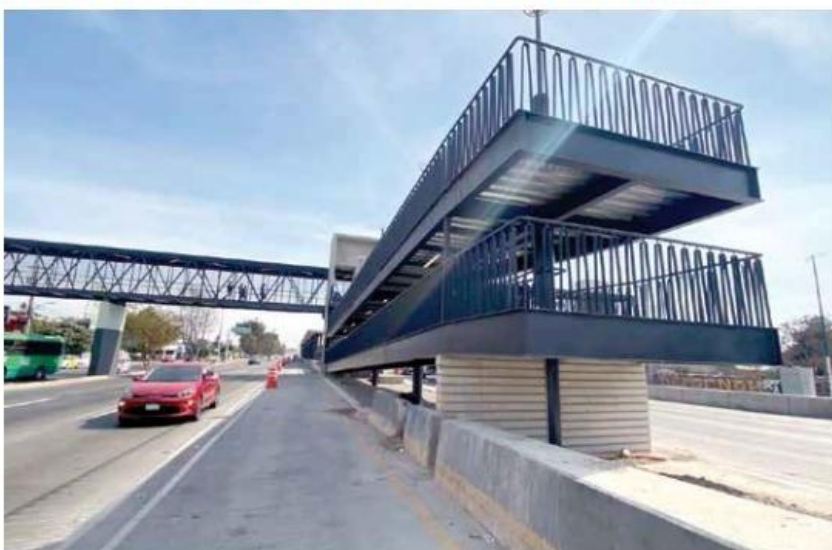
ESTE AÑO. MiMacroPeriférico inició operaciones el 30 de enero.

La situación, añadió, ha afectado a estudiantes del CUCEA, Centro Universitario de Ciencias Sociales y Humanidades (CUCSH), Preparatoria 10 y el Politécnico.