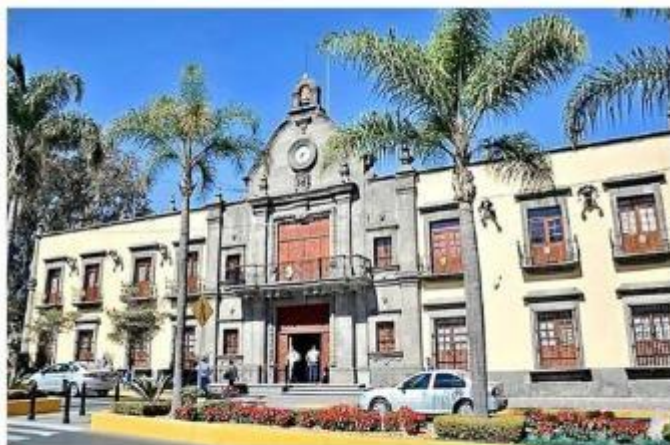
■ El Alcalde de Zapopan ya discute con el área administrativa otorgar el día libre a las trabajadoras del Ayuntamiento.