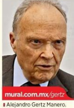
Alejandro Gertz Manero.