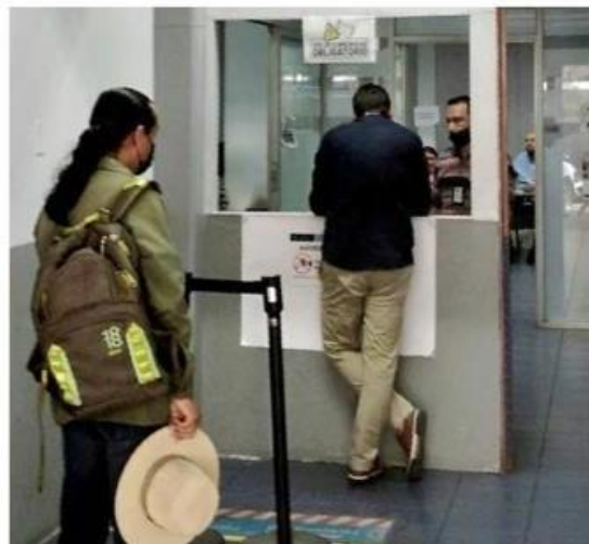
■ En el área de recepción de denuncias por robo de vehículos, en la Calle 14, falló el sistema de cómputo.

Personal de la Fiscalía informó que las víctimas de robo de vehículo que acudieron a la Calle 14 obtuvieron citas con agentes del Ministerio Público para regresar después y que no contaban con un tiempo estimado para resolver la falla.