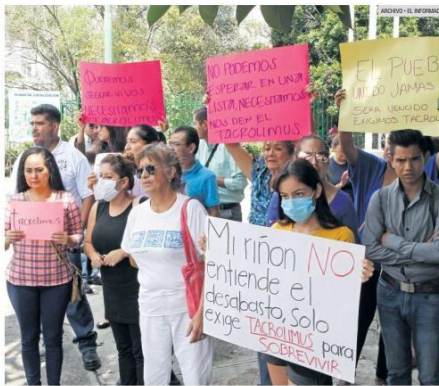
PROTESTAN. En 2018 se registró un desabasto de medicamentos para receptores de órganos en Jalisco.

"No es lo mismo que llevar a tu potencial donante, como un familiar, a que esperes en la lista nacional. No tiene que ver lo económico, sino que tengamos donantes cadavéricos. Desde CETRAJAL fomentamos este tipo de donantes", añadió.