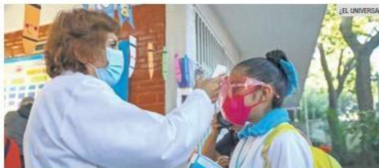
DISMINUCIÓN. Luego de la cuarta ola, los contagios van a la baja en Jalisco.

De acuerdo con el calendario de la Secretaría de Educación Pública (SEP), las vacaciones comenzarán el lunes 11 de abril para finalizar el 22 de ese mes. Por lo que se espera que los alumnos, junto con el personal docente y administrativo puedan reanudar actividades de manera ordinaria el lunes 25 de abril, siguiendo las medidas sanitarias para la prevención de COVID-19.