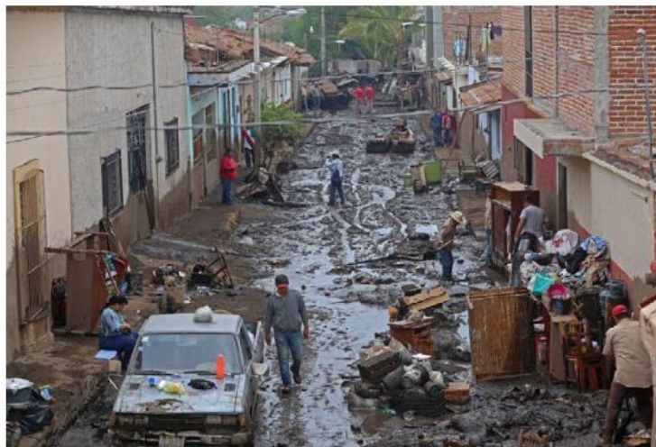
En junio de 2019 el desbordamiento del río dejó afectaciones en San Gabriel. FERNANDO CARRANZA