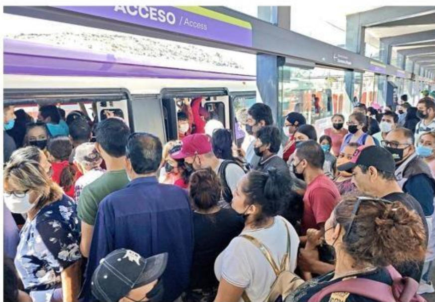
La estación Chapalita Inn ha sido una de las más conflictivas del Peribús.