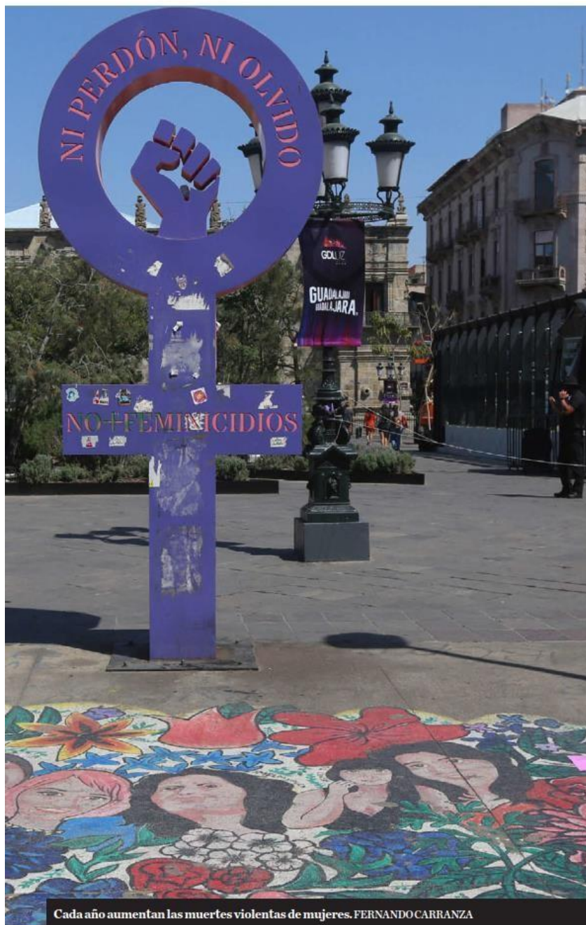
Cada año aumentan las muertes violentas de mujeres.

por parte de un funcionario de Zapopan; su agresor no fue procesado, pues el juez consideró que no había elementos suficientes en su contra.