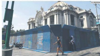
TEMEN ACTOS VANDÁLICOS. El Gobierno de la Ciudad de México comenzó la protección de monumentos y negocios ubicados a lo largo de la ruta pactada, como parte de las acciones preventivas ante las movilizaciones de mujeres del próximo martes. México padece una ola de violencia con más de mil feminicidios registrados en 2021, asesinatos tipificados por razones de género, más que en 2020. Al sumar los asesinatos clasificados como homicidios dolosos, en México matan a más de 10 mujeres al día, según las cifras oficiales.