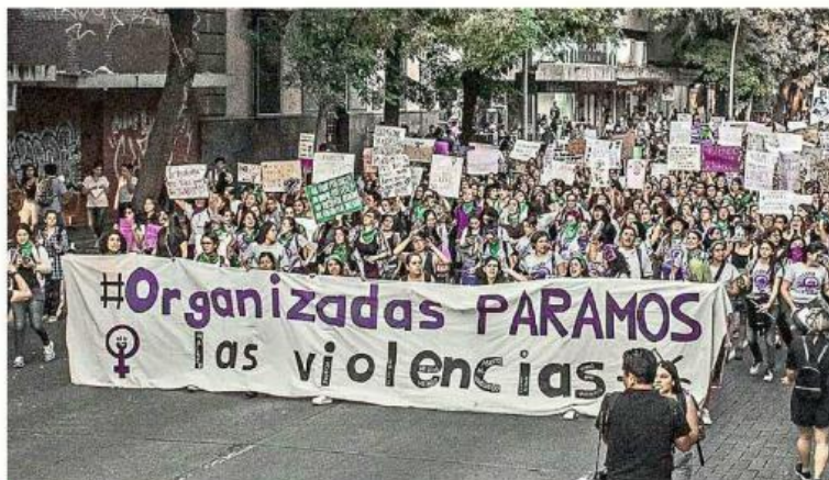
Red #YoVoy8deMarzo gestiona, desde la colectividad y horizontalidad, las marchas del Día Internacional de la Mujer.

Esta red se encuentra presente en 12 Estados de la República, incluyendo Jalisco. Se dedican a difundir y hacer activismo para garantizar los derechos sexuales y reproductivos. También acompañan procesos de aborto. Trabajan desde el marco de derechos humanos y con perspectiva de género.