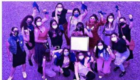
Las Paritaristas es una agrupación de mujeres que hacen política en Jalisco y que militan en el feminismo.

Agrupación multipartidista de mujeres que se dedican a la política en Jalisco y que militan en el feminismo. Defienden, principalmente, la paridad entre hombres y mujeres en la conformación de los partidos políticos y monitorean la política pública en materia de género.