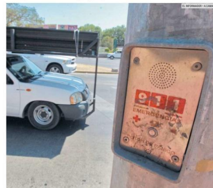
EMERGENCIA. Hay mil 500 botones de pánico que forman parte del Escudo Urbano.

Referente al cuestionamiento de que el proveedor debiere tener contratos con otros gobiernos, "le informamos que es necesario que quienes participen en estos procesos acrediten la mayor experiencia en temas de seguridad pública, específicamente en los temas que atañen a esta convocatoria".