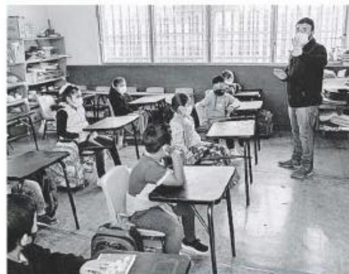
Hicieron un llamado a la autoridad.

Entre los riesgos señalan la posible deserción escolar, la prevalencia de embarazo adolescente y el incremento de los pequeños en tareas no remuneradas.