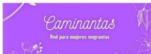
Caminantas se creó con el propósito de tejer redes entre mujeres migrantes que llegan a Jalisco.

Colectiva creada con el propósito de tejer redes entre mujeres migrantes que llegan a Jalisco. Además se les auxilia en trámites para solicitar refugio, conseguir trabajo y, en general, para regular su situación migratoria en el Estado.