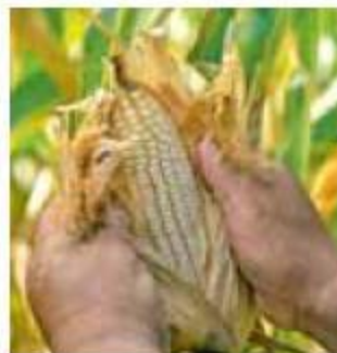
Encarecimiento. El precio de la tortilla subiría.

alimentaria, por la falta de materia prima para el principal producto de la dieta mexicana: la tortilla. Jalisco pasó del primer lugar nacional en producción de maíz al segundo en los últimos años (detrás de Guerrero). Durante 2021 se produjeron cerca de tres millones de toneladas. HÉCTOR ESCAMILLA