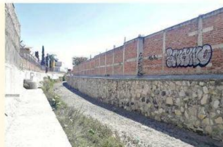
Los delincuentes aprovechan el canal pluvial que pasa cerca del Fraccionamiento Bonanza, para robar en los negocios.

Barba, por su parte, sospecha que algunos elementos de Seguridad Pública de Tlajomulco están coludidos.