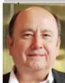
Por | Gabriel Ibarra Bourjac