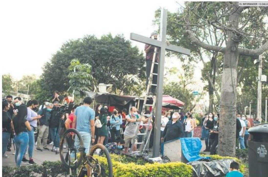
DEUDA. La cruz es para recordar al Estado mexicano la falta de justicia en los casos.