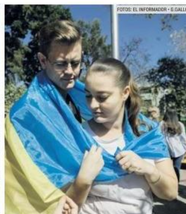
UNIÓN. Alrededor de 150 personas fueron a la marcha.