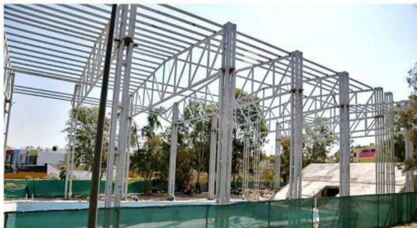
Caabsa Constructora realizó obras de rehabilitación en el Parque Solidaridad.

Aunque el contrato se firmó el 23 de abril de 2020 para rehabilitar unidades deportivas en 7 municipios metropolitanos por ese monto, que incluía mantenimiento mensual hasta septiembre de 2024, el 1 de junio de ese