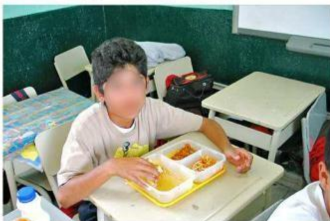
■ En las Escuelas de Tiempo Completo, alumnos de escasos recursos reciben alimento. La Federación quitaría el programa.

gativo en la nutrición, equilibrio emocional, desarrollo de habilidades de sociabilidad y convivencia necesarias para el aprendizaje”, subrayan.