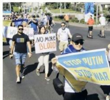
CAMINATA. El contingente aprovechó la Vía RecreActiva de Avenida Vallarta.

Ucranianos cuentan que sus familiares están preocupados por los ataques y bombardeos