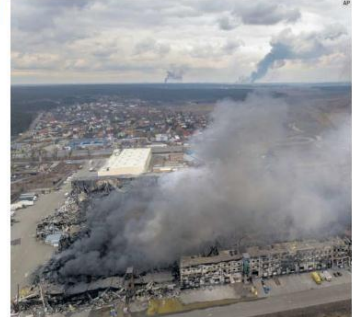
BOMBARDEO. Rusia retomó los ataques a las ciudades cercanas a Kiev e impidió que miles de civiles escaparan a zona segura, pese a la tregua prometida.