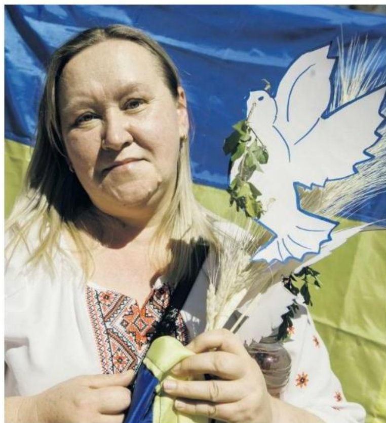
PAZ. La comunidad ucraniana solicitó que se termine la guerra en su país.

EN IMÁGENES Recorren calles de la ciudad