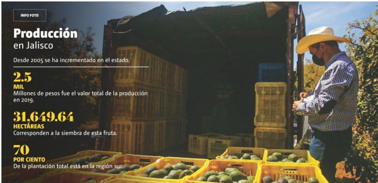
• Fuente: Instituto de Información Estadística y Geográfica de Jalisco. / Foto: Especial

De la plantación total está en la región sur.