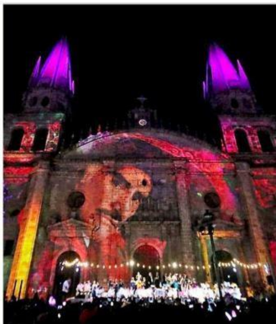
En el festival se rindió homenaje a Vicente Fernández.