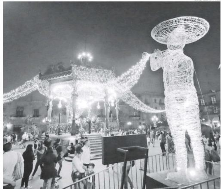
Con gran éxito se llevó a cabo el GDLuz en la ciudad.

Por otro lado, explicó que durante los primeros tres días del festival se recabaron 16 mil 865 kilogramos de desechos a