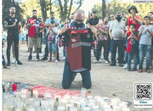
SOLIDARIDAD. Decenas de aficionados de Atlas y Chivas se dieron cita ayer afuera del Estadio Jalisco para manifestar su apoyo a los familiares de los seguidores Rojinegros que resultaron afectados en la trifulca del sábado en Querétaro.