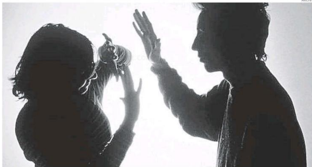
Un fenómeno que agudizó la violencia contra la mujer fue la pandemia por Covid-19.