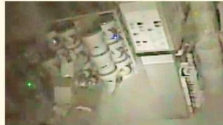
Una cámara de seguridad captó cuando un ladrón se metió por el techo, pero cayó desde esa altura.