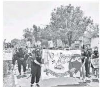
Mujeres en lucha.

frecuencia en 2020, solo después del robo. Además, fue el único que presentó un aumento de 5.3% entre 2019 y 2020, mismo que podría atribuirse al periodo de confinamiento por Covid-19 en el primer año de la pandemia, las mujeres, al permanecer más tiempo en sus hogares con otros miembros de su familia, se encontraron más expuestas a la violencia por parte de sus agresores. Los delitos contra las mujeres (273,903) en 2020 representan 14.8 por ciento del total de delitos.