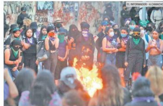
BAILE. Al terminar la primera protesta, manifestantes encendieron la fogata y cantaron alrededor de ella.