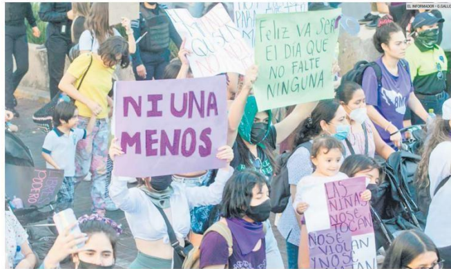
ACTIVISMO. Participantes con pañuelos morados y verdes invadieron la ciudad, junto con letreros con peticiones como "ni una menos".