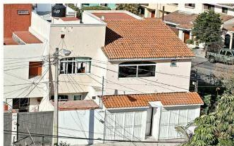
■ La finca, ubicada en Calle Paseo del Rocío, terminó con impactos.