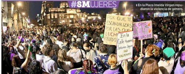
En la Plaza Imelda Virgen repudiaron la violencia de género.