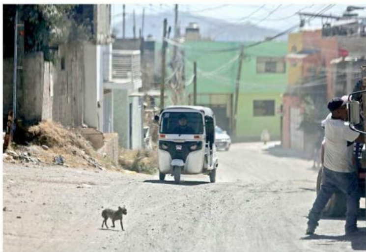
■ A falta de transporte público, en la zona circulan mototaxis que cobran 10 pesos.

Por problemas de circulación, Rocío, mujer de la tercera edad, lamenta que la parada le quede tan lejos, y considera que el servicio de