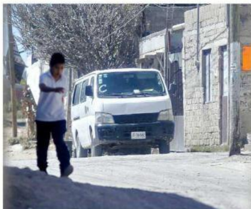
■ Hace como un año comenzaron a operar vans en la colonia.