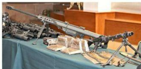
■ A la cédula del presunto capo le aseguraron armas de alto poder.