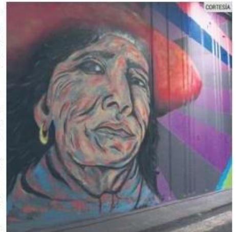
EJEMPLO DE OBRA. Así luce uno de los murales temáticos que engalanan la frontera entre Guadalajara y Zapopan.

Autoridades de ambos municipios señalaron que este tipo de acciones forman parte de las actividades para respaldar el llamado de las mujeres a una vida libre de violencia.