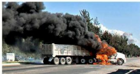
■ En total fueron quemados 25 vehículos en todo el Estado.

Mientras que él y su cédula de guardaespalda hacían frente a los soldados, se dio la instrucción de desatar el caos.