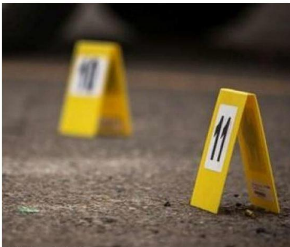
El priista fue asesinado a balazos. ESPECIAL