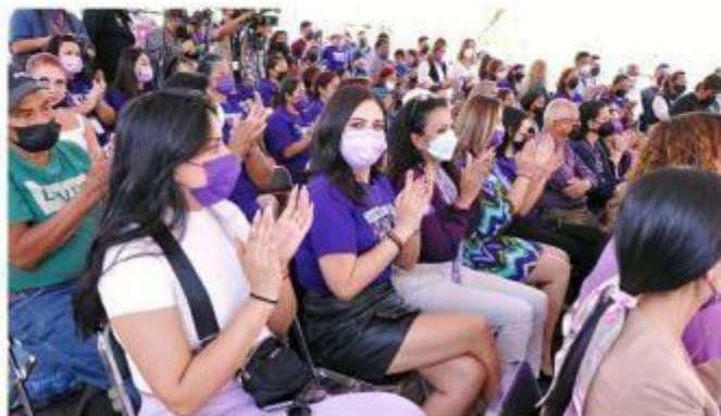
■ En Zapopan se ofreció ayer el Foro Moviéndonos Seguras.

“Y nosotros los hombres no lo hemos entendido, no