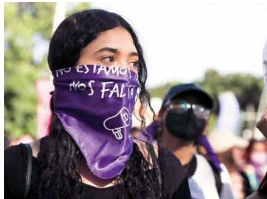
JUNTAS. Las calles del primer cuadro de la ciudad se inundaron de cánticos, consignas, reclamos y unión.