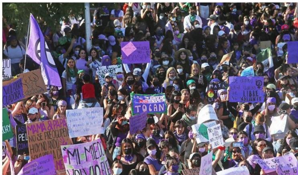
Más de 15 mil participaron en la manifestación que inició en la Glorieta de las y los Desaparecidos. FERNANDO CARRANZA

Antes de partir, recordaron a las asesinadas y desaparecidas en Jalisco, y dieron a conocer las alarmantes cifras de violencia de género. "No son muertas, son asesinadas", "Señor, señora, no sea indiferente, se mata a las mujeres en la cara de la gente", "El Estado no me cuida, me cuida mis amigas" fueron algunas de las consignas que se escucharon fuerte cuando las mujeres empezaron a avanzar por la avenida Chapultepec, hasta dar la vuelta en Hidalgo, en ese punto, no se alcanzaba a ver ni el principio ni el fin del contingente; después tomaron Federalismo