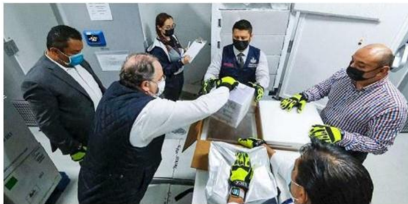
Ayer arribaron las vacunas a la entidad.

El secretario de Salud también señaló que habrá vacuna para los residentes de municipios en otras regiones del estado, por lo que pidió estar atentos a los canales oficiales del Gobierno del Estado y de la Secretaría de Salud donde se darán a conocer todos los detalles de las nuevas jornadas. "Esperamos además a todas aquellas personas mayores de 18