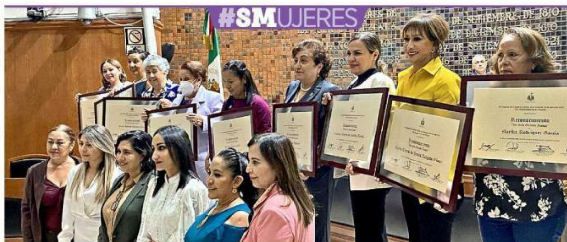
En el Día Internacional de la Mujer, el Congreso de Jalisco entregó el reconocimiento Hermila Galindo a 10 mujeres.

Distinguen a activistas por aportaciones a la equidad