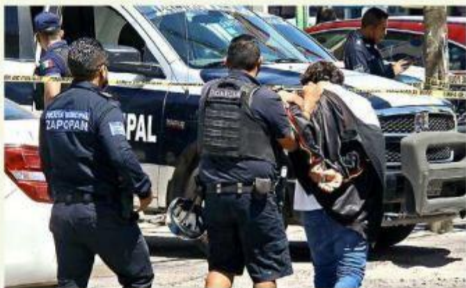
La Comisaría de Zapopan reportó la detención de dos sujetos.