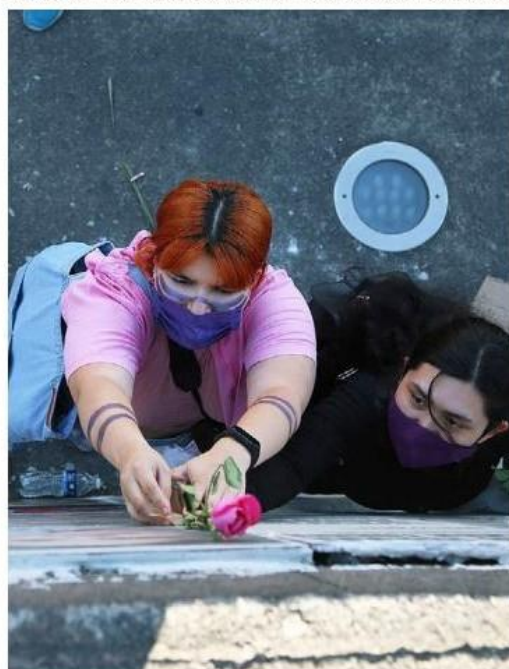
Recuerdan a las desaparecidas. FERNANDO CARRANZA