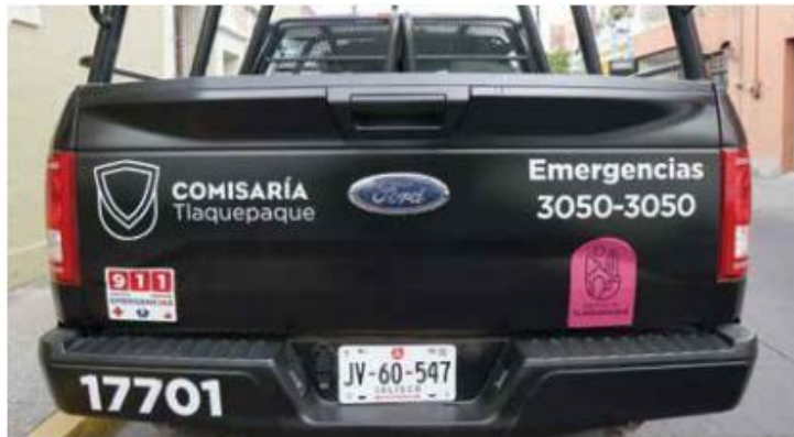
VILLA ALFARERA. Dos de los crímenes ocurrieron en San Pedro Tlaquepaque.