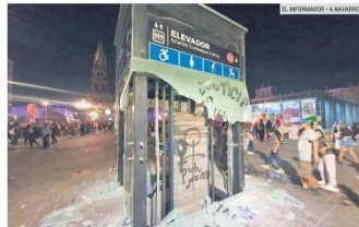
DAÑO. Un grupo destruyó las paredes de vidrio que cubren el elevador de la Estación Guadalajara Centro de la Línea 3 del Tren Ligero.