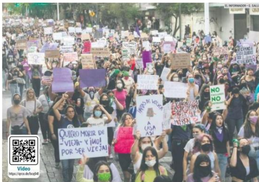
RECLAMO. Las mujeres salieron a las calles de la Zona Metropolitana de Guadalajara para señalar los pendientes de las autoridades de Jalisco en el combate a la violencia de género.