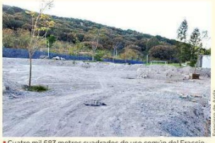
■ Cuatro mil 683 metros cuadrados de uso común del Fraccionamiento Ayamonte están concesionados a un particular.

El Ayuntamiento de Zapopan dejó en manos de un particular 4 mil 683 metros cuadrados de uso común dentro del Fraccionamiento Ayamonte, lo que informó a vecinos organizados de esta zona residencial. Esa fracción formaba parte de las áreas de cesión para destinos del fraccionamiento, cuya extensión total ascendía a 79 mil 317 metros cuadrados, que Zapopan entregó a la Asociación de Colonos de las Bellas Artes AC en 2010 mediante un convenio de colaboración por 10 años. El contrato para que la asociación vecinal se hiciera cargo de las áreas