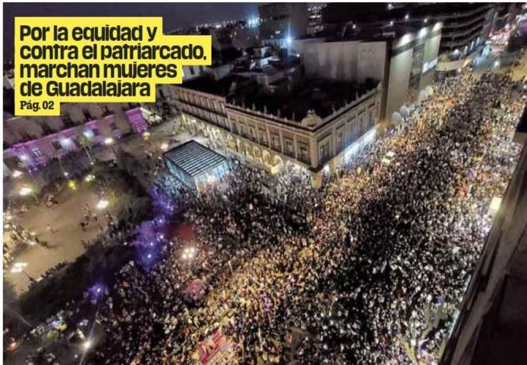
8M. La segunda marcha 8M partió de la Glorieta de los Desaparecidos hacia la Antimonumenta en el Centro de Guadalajara.

Por la equidad y contra el patriarcado, marchan mujeres de Guadalajara Pág. 02