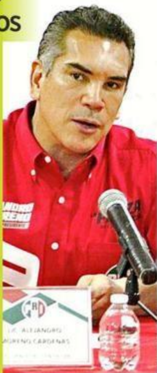
Francisco de Anda

"No hay dados cargados para nadie, que nosotros habremos de construir en el consenso, en el acuerdo político como es el PRI sumando a todas las expresiones", señaló Moreno.