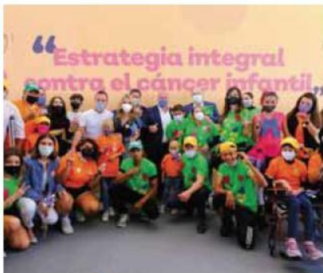
Compromiso. La administración reiteró el apoyo.

Vigencia. El decreto entra en vigor al día siguiente de su publicación, es decir, este martes