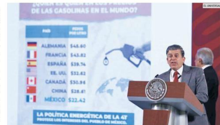
ANÁLISIS. Ricardo Sheffield Padilla comparó con otros países el precio de la gasolina regular.

mex, y los resultados se notan con los costos. "Debe de ser un orgullo para Pemex, en especial para los trabajadores, para los técnicos, y para el pueblo para todos los mexicanos, el precio de la gasolina es de los precios más bajos en el mundo. Imagínense que en Estados Unidos cuesta 32 pesos el litro, y aquí 22 pesos el litro de gasolina. ¿Por qué? Bueno porque se está rescatando a Pemex, no hay corrupción, hay eficiencia", afirmó.