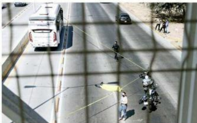
■ La persona fue embestida justo debajo de un puente peatonal en el Periférico.

En los números de emergencias recibieron reportes para alertar sobre una persona atropellada, por lo que oficiales motorizados de la Comisaría de Zapopan acudieron al lugar.