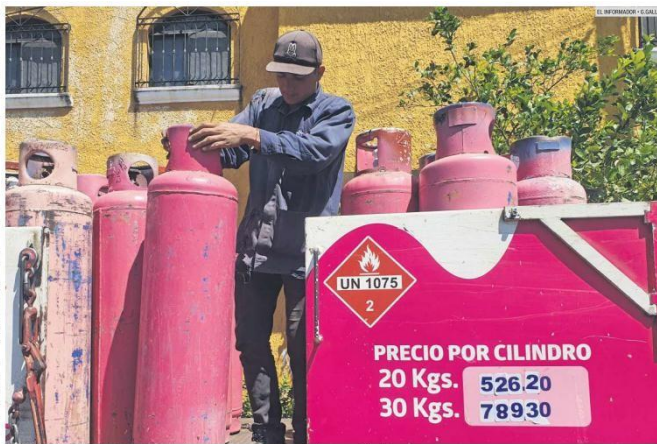
AFECTACIONES. Los habitantes de la ciudad remarcan que el aumento pega a la economía familiar.

"Si no controlamos el precio de los combustibles y de la energía eléctrica, se va todo a las nubes", advirtió.