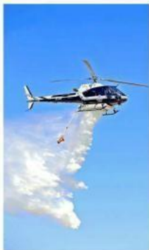
■ Varios helicópteros hicieron ejercicios durante la presentación del programa.

incendios en el estado de Jalisco, estamos a 14 de marzo, ayer hubo tres aquí en las colindancias de este hermoso paraje en los municipios