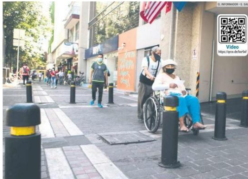
OBSTÁCULOS. En Avenida Vallarta, casi al cruce con Federalismo, los espacios reducidos por la colocación de bolardos son parte de los obstáculos que las personas con discapacidad deben enfrentar cuando transitan por el Centro tapatío.

7 603003 834007 Hoy 16 páginas | $ 10.00