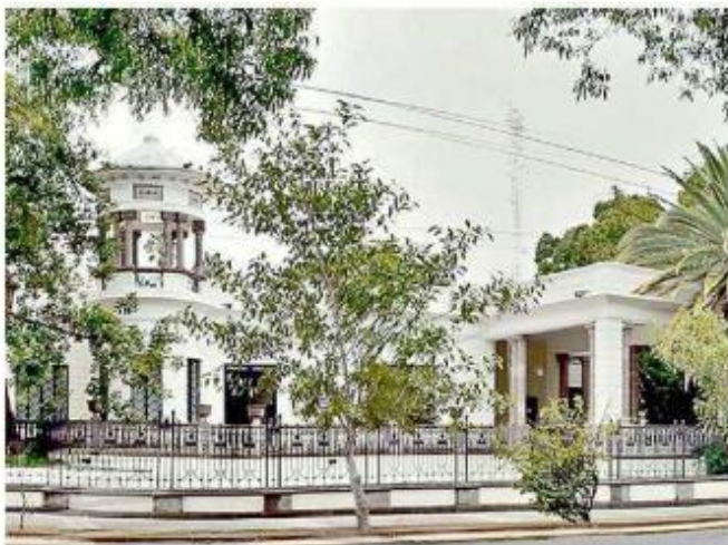
La dirección de Verificación y Control de Obras de la Contraloría cuenta con un área de quejas y denuncias.

Además, esta invitación a que los ciudadanos reporten incumplimientos por parte de las empresas contratistas se da luego de dar a conocer