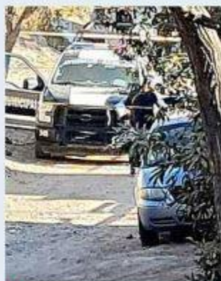
Uno de los crímenes ocurrió en Zapopan.

“No tenemos alguna información respecto de la edad o si este fuera vecino de la zona; los vecinos pues no nos proporcionan mayor información si fuera