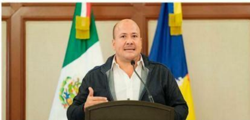
"Es un hecho, este 2022 es oficialmente el año de la atención integral a niñas, niños y adolescentes con cáncer en Jalisco", señala el gobernador del Estado de Jalisco, Enrique Alfaro Ramírez.

La nueva leyenda que será plasmada en documentos oficiales recordando la importancia que tiene el Gobierno del estado por atender la causa a través de su Programa de Cobertura Universal y Atención Integral a los menores que viven con este padecimiento