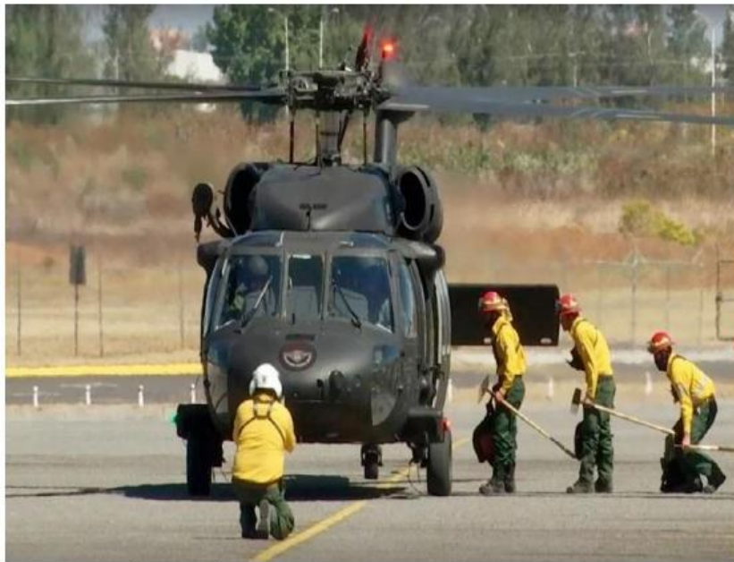
Con una exhibición de helicópteros, las autoridades se declararon listas. FERNANDO CARRANZA

“Tenemos este año nuevamente el fenómeno de La Niña , y con esto, una inconsistencia en el clima que nos traerá un riesgo, por eso me parece de vital importancia que las dependencias de