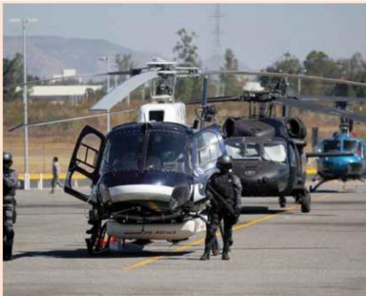
FUEGO. Nueve helicópteros y 200 vehículos participarán en la estrategia ante el estiaje.