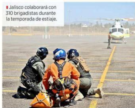
■ Jalisco colaborará con 310 brigadistas durante la temporada de estiaje.