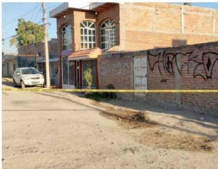
EX VILLA MAICERA. En la colonia La Higuera, en Zapopan, fue hallado el cadáver de un hombre con dos heridas en la nuca.

Antes, a las 6:30 horas, fue localizado el cuerpo de un hombre con dos