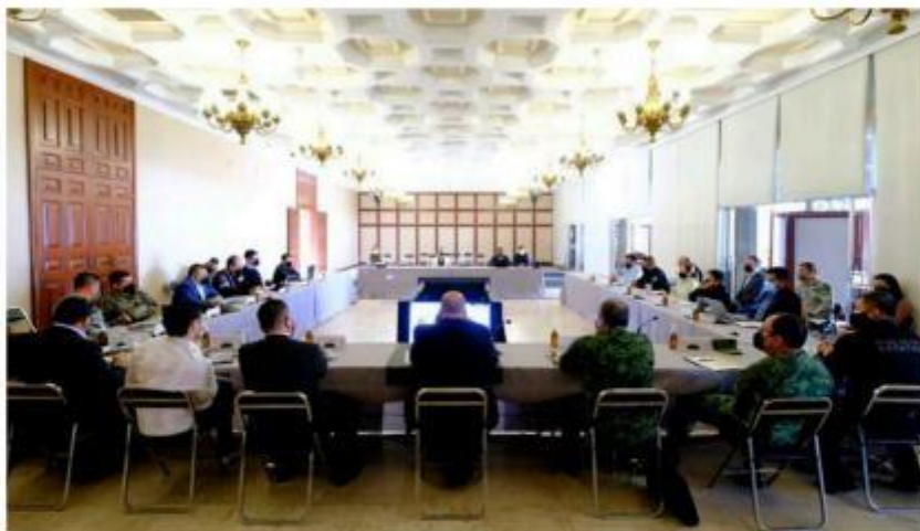
El Gobernador, Enrique Alfaro en reunión con la Comisión Ejecutiva del Consejo Estatal de Seguridad.

"Un tema fundamental fue el reforzamiento de nuestra presencia en los límites con Michoacán o