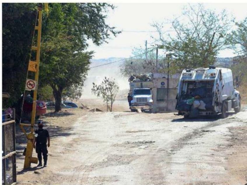
■ No se ha resuelto a dónde llevarán los residuos después del cierre de Matatlán.

MURAL informó que Caabsa comenzaría a llevarse la basura desde el 24 de enero, ya que utilizó ilegalmente Matatlán como vertedero tras el cierre de Laureles.