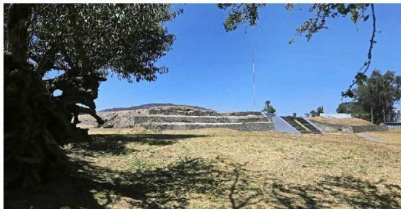
Las zonas arqueológicas de Jalisco tendrán actividades desde el próximo sábado.

Informó que todos los días se va a abrir a las 9:30 de la mañana y se va a cerrar a las 6:40 horas, y durante estos tres días iniciará con un toque de caracoles prehispánicos y el saludo a los cuatro puntos cardinales en la zona arqueológica. Los asistentes podrán presenciar actividades como el juego de pelota en el museo de sitio y posterior-