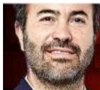
DAVID GÓMEZ-ÁLVAREZ @gomezalvarezd

Movimiento Ciudadano tiene indefiniciones elementales, como su ambigüedad frente a temas controvertidos.