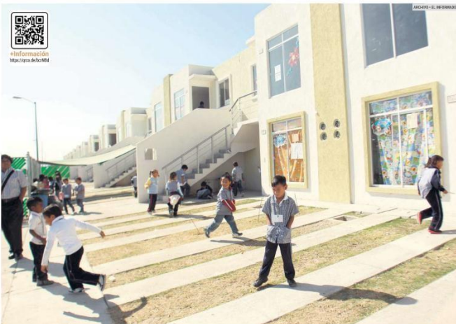
PROGRAMAS. Los trabajadores tienen la oportunidad de recuperar su patrimonio o mejorar condiciones en los créditos de sus viviendas.

El Instituto puntualiza que la recuperación resulta de las acciones implementadas para estimular la colocación de financiamientos, "con el fin de que quienes habían iniciado o estaban por iniciar la adquisición de un crédito no fueran afectados y pudieran continuar con sus planes".