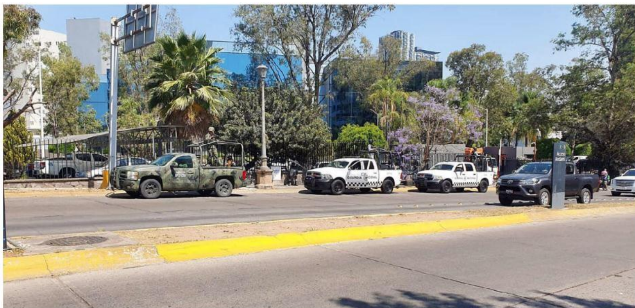
Elementos de la FGR, Guardia Nacional y la Secretaría de la Defensa Nacional participaron en el operativo. JUAN CARLOS MUNGUÍA