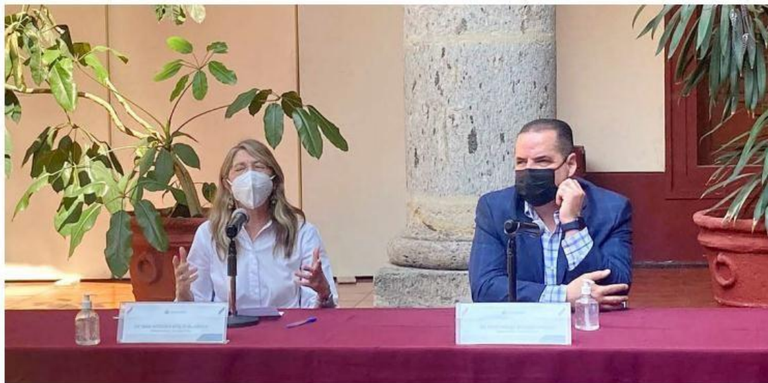
Los legisladores de Hagamos acusaron al gobierno estatal de ejercer presión a los presidentes municipales. ESPECIAL