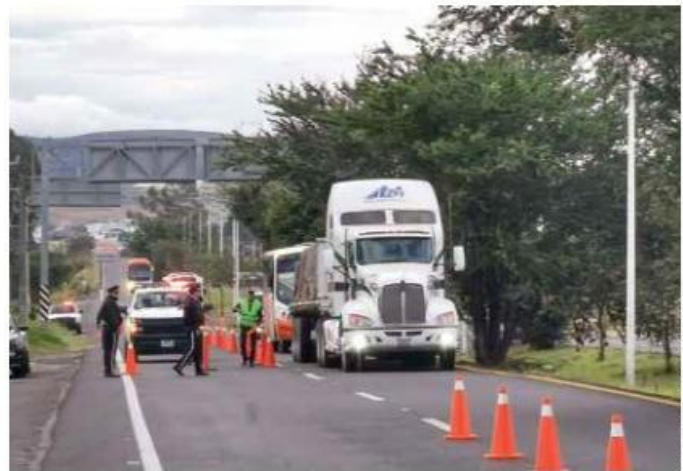
JORGE ALBERTO MENDOZA

LÍMITE. El horario de restricción actual es de 6 a 9 de la mañana y entró en vigor desde el 1 de enero de 2020.