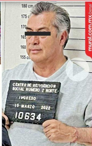
EL PRESO # 10634. El ex Gobernador entró ayer cerca de las 16:00 horas al Penal número 2 de Apodaca, donde se le asignó su número de interno.

La detención de Rodríguez fue realizada ayer antes del mediodía en General Te-