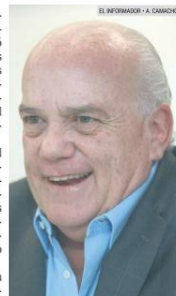
EJEMPLO. Horacio Fernández, diputado federal y presidente de Industrias Tajín.

yecto será de entre cuatro y cinco millones de pesos mensuales y beneficiará a las siguientes colonias: La Floresta, El Colli, La Noria, Jardines Tapatíos, Colinas de La Primavera, San Nicolás de La Primavera, 5 de Noviembre, Loma Alta, Los Cerritos, Villa de La Primavera, Brisas de La Primavera y Lomas de La Primavera.