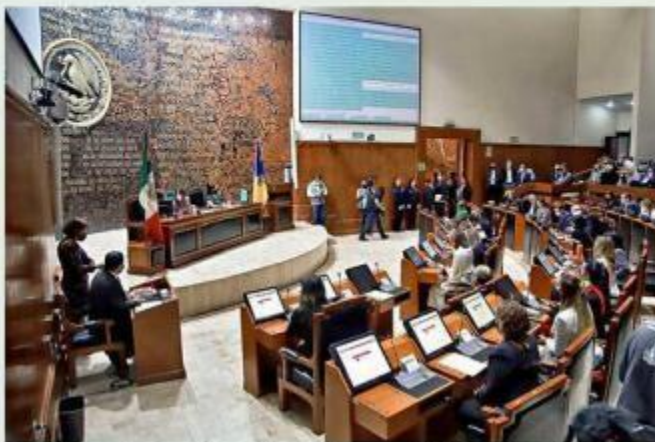
La Junta de Coordinación Política recibió una lista de 96 supernumerarios que deberían salir del Congreso.