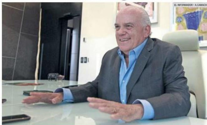
APOYO. Los sistemas han sido adquiridos gracias a la donación íntegra del salario del diputado.

“El chiste es que todos sumen. Si no cambiamos nosotros no va a cambiar México”