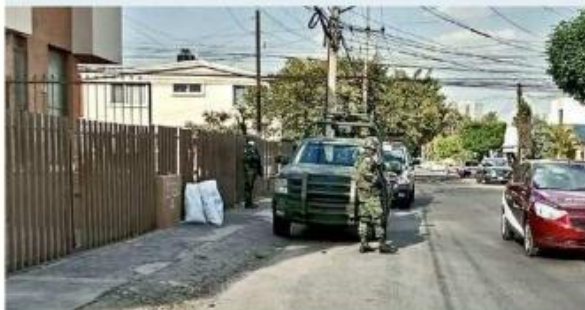
■ Militares resguardaron una finca en La Calma.

Hasta las 19:00 horas de ayer no se habían revelado los resultados de los operativos.