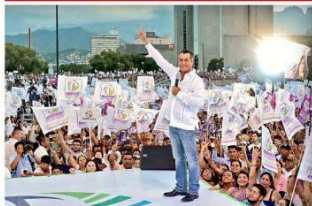
PAGA LAS BRONCOFIRMAS. Como Gobernador, "El Bronco" desvió recursos públicos al usar funcionarios para recabar firmas para su campaña presidencial.