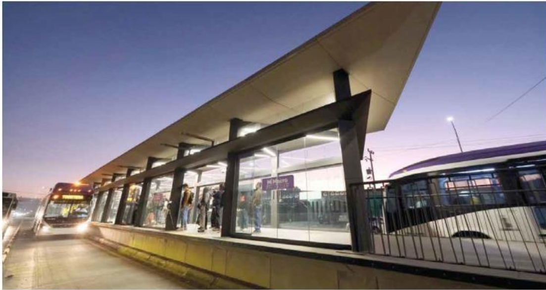
HACE CASI DOS MESES. Luego de más de dos años de obras, MiMacroPeriférico fue inaugurado el 30 de enero.