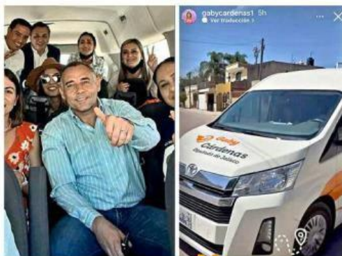
Funcionarios de MC han hecho eventos usando el logotipo y utilizan vehículos con sus nombres rotulados.