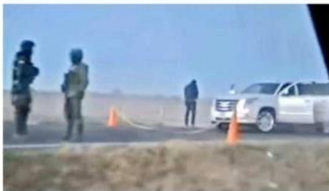
El tiroteo ocurrió el jueves en los límites de Jalisco y Zacatecas.

En ella viajaban la ex golfista y otras personas, aunque el chofer, supuestamente, no se detuvo —por causas que no han sido esclarecidas—, lo que derivó en una persecución seguida de disparos.