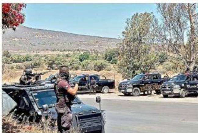
La vigilancia en la Región Sureste ha sido reforzada.