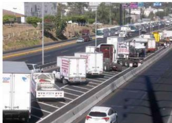
POR MÁS DE 10 HORAS. Los camioneros bloquearon acotamientos y carriles de baja en la carretera a Chapala y la autopista a Zapotlanejo.