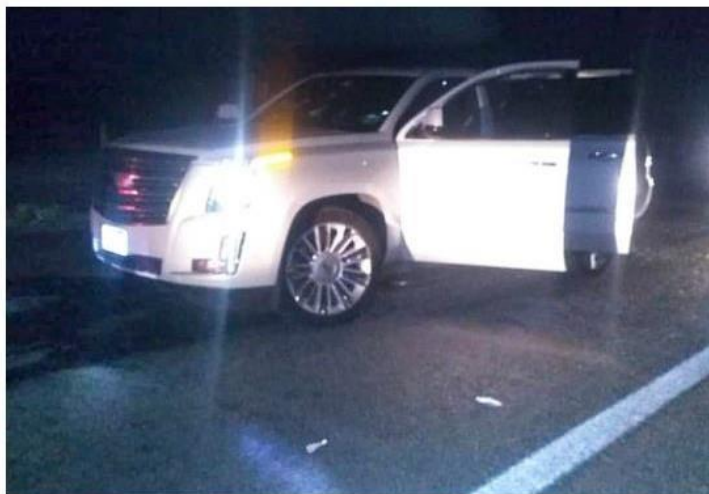
El hecho ocurrió el pasado jueves en el municipio de Ojuelos.