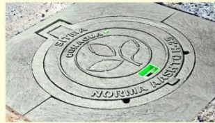
Tapas para alcantarillado hechos con basura plástica.

Ahora están en pláticas con empresarios de España para colocar una planta en Galicia o Madrid, con una inversión de un millón de dólares. "Cada vez son más los in-