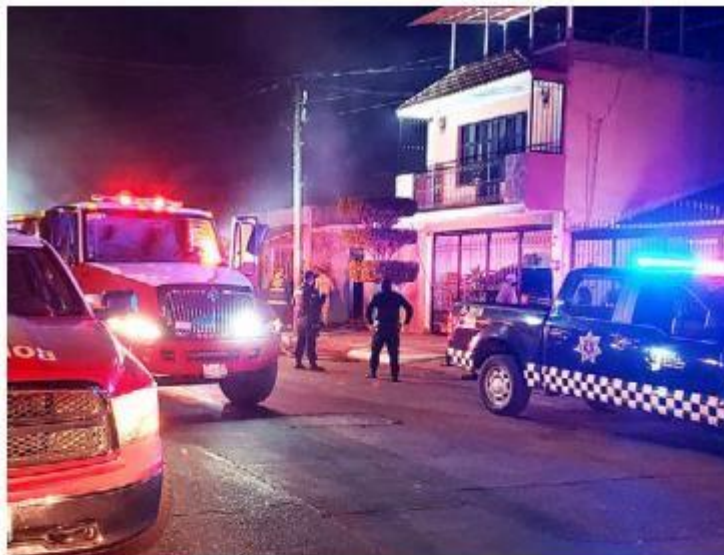
Una mujer murió en la colonia San Andrés. JUAN CARLOS MUNGUÍA