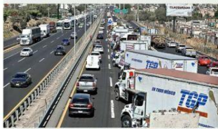
En la salida a la autopista Guadalajara-Zapotlanejo (foto) y en Carretera a Chapala pararon unos 250 camiones.

En Jalisco participaron 250 camioneros, que desde las 8:00 horas y hasta el cierre de edición pararon en la salida a la autopista Guadalajara-Zapotlanejo y en Carretera a Chapala.