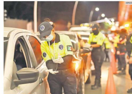
SALVANDO VIDAS. En enero y febrero de 2022 se han realizado más de 148 mil pruebas de alcoholimetría.

En diciembre de 2020, la Fiscalía Anticorrupción anunció la participación de personal de esta dependencia para vigilar la operatividad del programa Salvando Vidas, con el objetivo de que opere de acuerdo a lo que establece el protocolo.