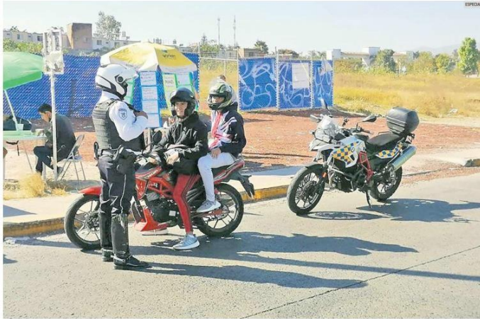
PERCEPCIÓN. El 73.9% de entrevistados opinó que los policías viales en Jalisco son corruptos, según encuesta del Inegi.

Lo que sí respondió fue sobre las unidades fuera de servicio. Reportó que a mediados del año pasado, un total de 231 vehículos de la corporación estaban sin funcionar: 203 por falla mecánica, 25 por siniestro, una por mantenimiento y en dos casos se iniciaron los procesos de baja.