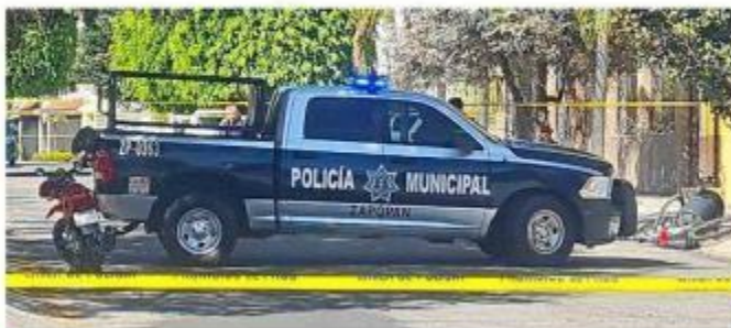
■ Hombres armados amagaron a policías de Zapopan.

Los sospechosos amagaron con armas de fuego a los