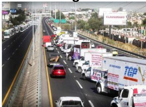
La manifestación duró 10 horas. FERNANDO CARRANZA