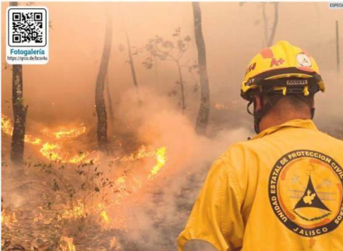
DANEO AMBIENTAL. El bosque pierde terreno cada año a causa de los incendios; en algunas ocasiones, son provocados de manera intencional por temas agrícolas o por cambio de uso de suelo.