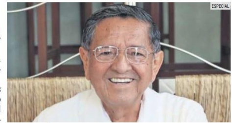
APROBACIÓN. Ciudadanos destacan el actuar de "El Profe" Michel.

Por otra parte, la última Encuesta Nacional de Seguridad Pública Urbana del Inegi, confirmó un repunte en el incremento de la percepción de seguridad en Vallarta. Entre octubre y diciembre de 2021, el 73.4% de los vallartenses contestó que se sentía seguro.