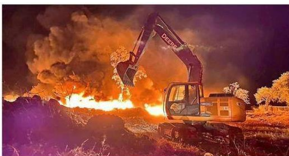
■ La Cajilota es una planta de transferencia de residuos domésticos, pero el municipio permitió neumáticos.