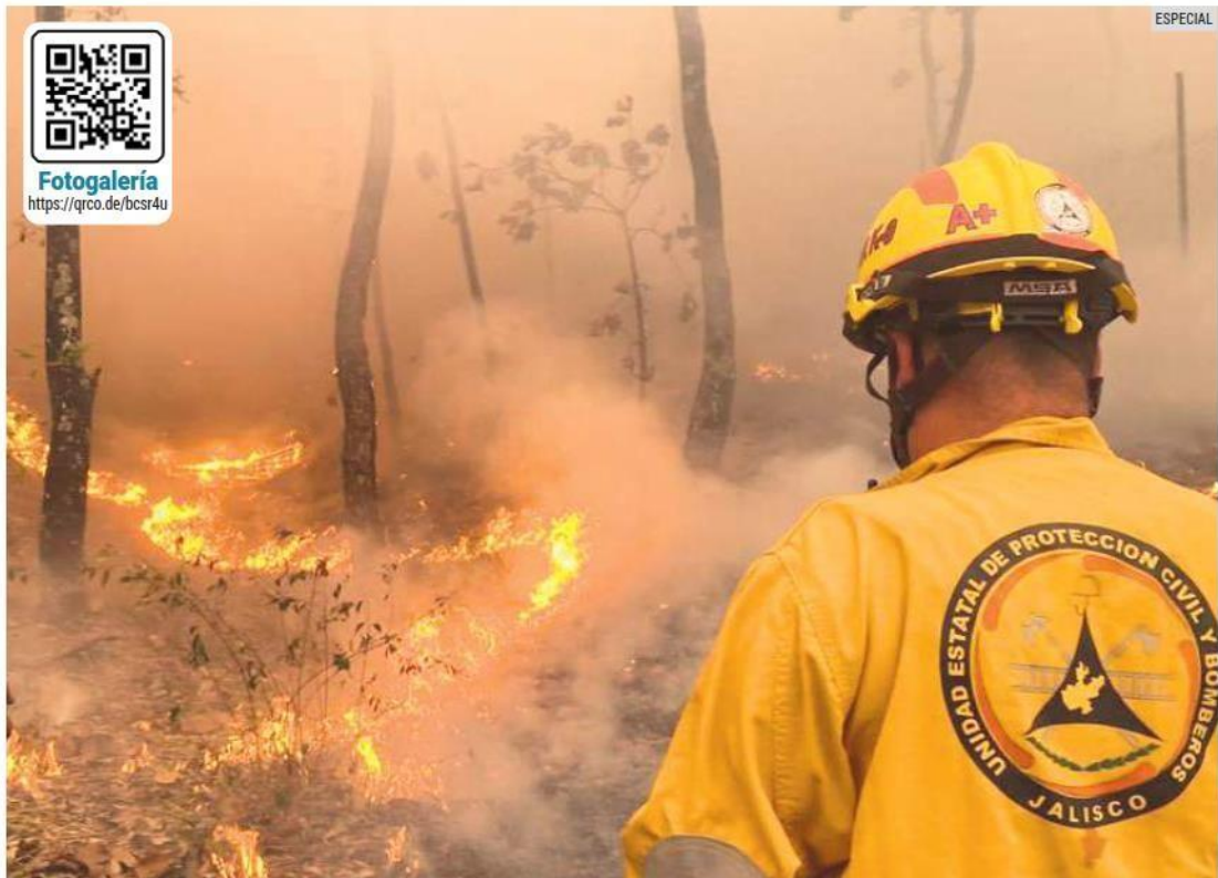
DAÑO AMBIENTAL. El bosque pierde terreno cada año a causa de los incendios; en algunas ocasiones, son provocados de manera intencional por temas agrícolas o por cambio de uso de suelo.