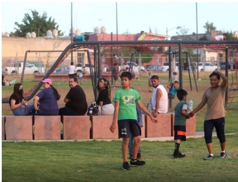
Este parque será contemplado para la activación de academias deportivas. FERNANDO CARRANZA

“Estamos entregando un par de etapas de la intervención que estamos haciendo en el Parque Solidaridad y arrancar las siguientes etapas que vamos a