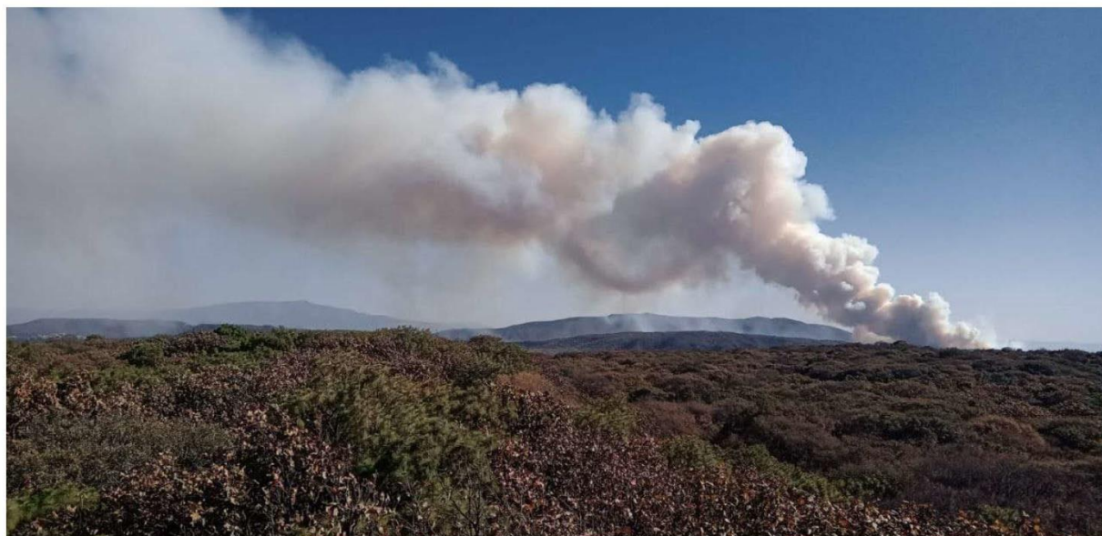
La columna de humo se apreciaba desde varios puntos de la Zona Metropolitana de Guadalajara.