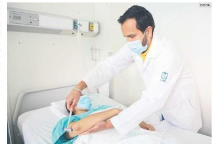
AYUDA. Los pacientes que presenten afectaciones pueden acudir a revisión a su Unidad Médica Familiar.

Protocolo El Instituto Mexicano del Seguro Social (IMSS)