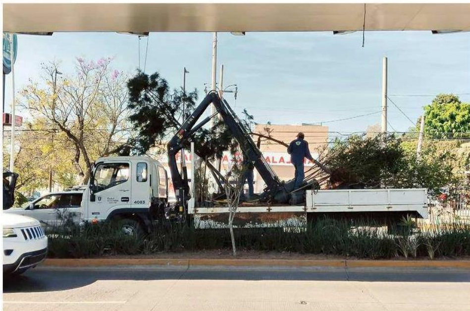
Este martes fueron retirados 30 pinos del camellón ubicado debajo del viaducto de Zapopan.

Al cuestionar a Zapopan sobre la coloración y posterior retiro de los pinos, entregó solo una ficha informativa para responsabilizar a la Secretaría de Comunicaciones y Transportes, que fue la dependencia que entregó los ejemplares en 2020.