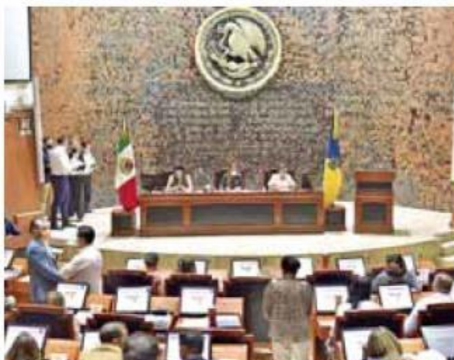
Derecho. El recursos busca visibilizar un derecho.

En el resolutive, el juez señaló que las leyes estatales violan los derechos reproductivos de las mujeres pues no le permiten tomar decisiones autónomas