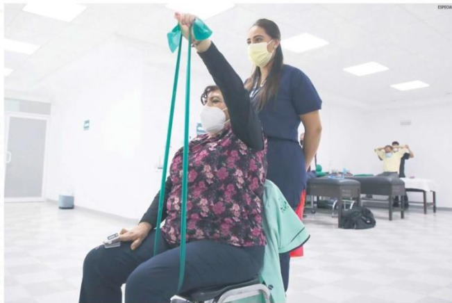
PROGRAMA. El IMSS ofrece a derechohabientes un programa de rehabilitación integral para manejo de secuelas.

"Es notorio cómo las personas adultas de edad intermedia de 40 a 59 tienen menor proporción de refuerzos", remarcó.