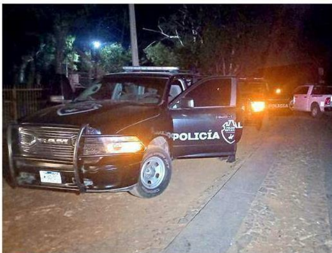
Las víctimas fueron localizadas en Juanacatlán.

La Fiscalía del Estado indicó que el hallazgo ocurrió en una propiedad utilizada