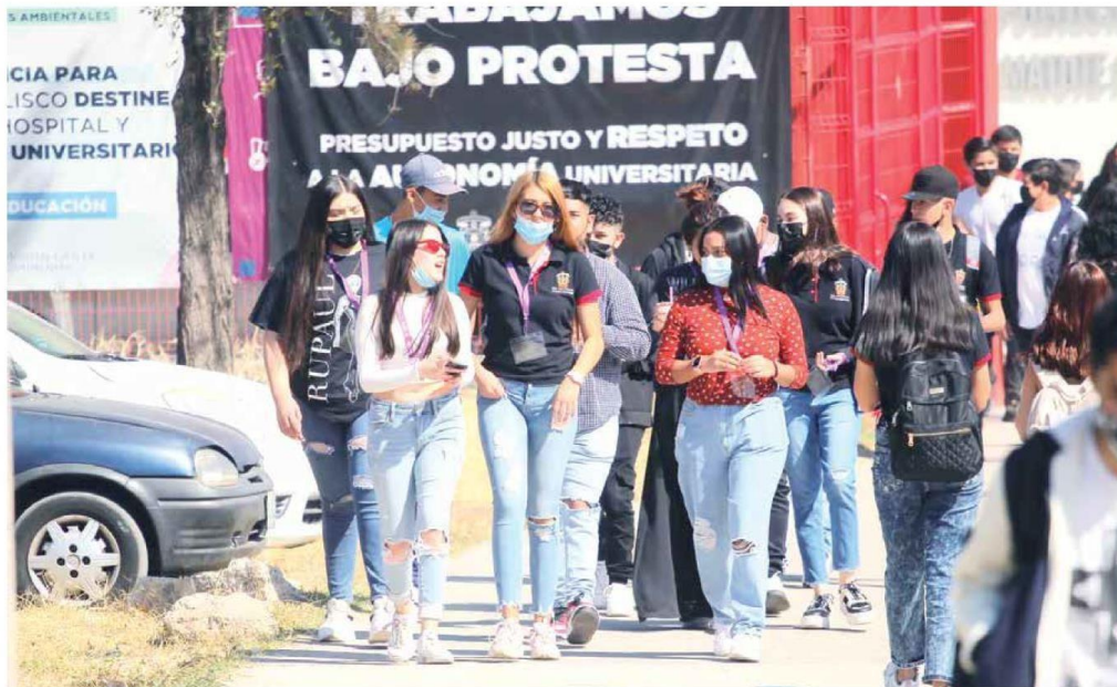
MÁS EN ELAS. El 50.25 por ciento de los estudiantes que dejaron las aulas son mujeres.

En la información que la UdeG entregó sobre deserción en preparatorias re-