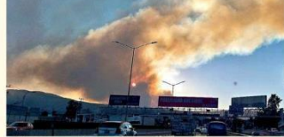
El humo atravesó la Ciudad y se activó la alerta atmosférica, que recomienda a la población evitar actividades al aire libre.