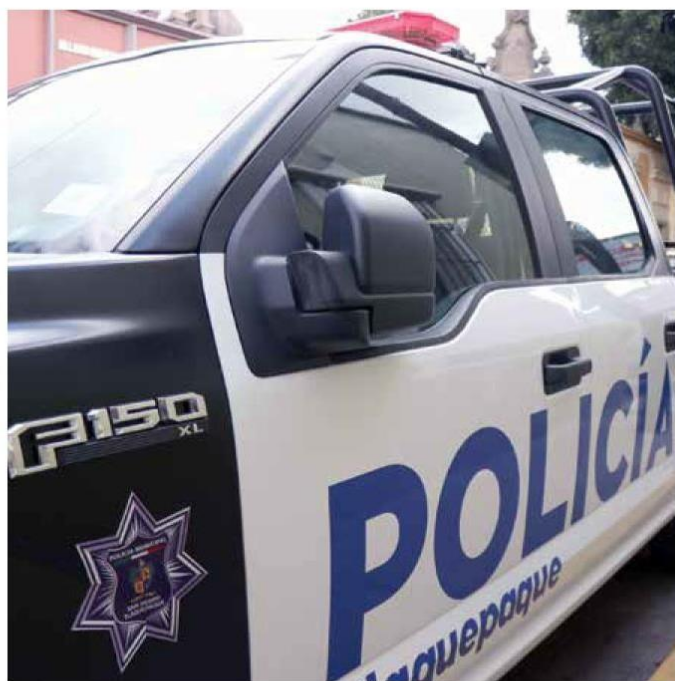
COMISARÍA. A los uniformados se les acusa de la desaparición de un hombre de 34 años cometida el 27 de febrero de 2020 en la colonia Tateposco.

Este mismo año ya se procesó a cuatro policías de Tonalá por otro caso de desaparición forzada en el Área Metropolitana de Guadalajara (AMG). Fueron vinculados el 10 de febrero.