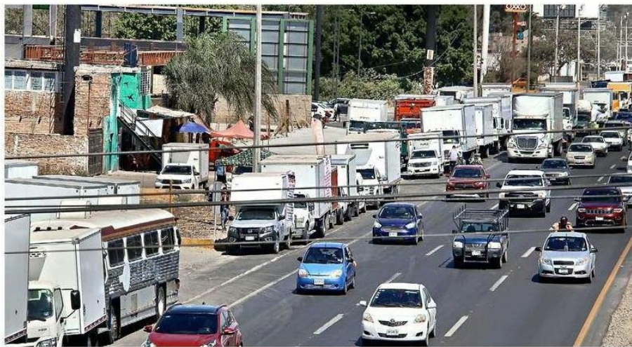
Transportistas se manifestaron el martes en la Carretera a Chapala para exigir más seguridad.

Según datos oficiales de la Fiscalía de Jalisco, la colo-