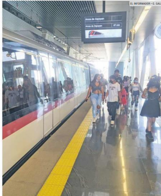
CRECIMIENTO. El Tren Ligero registró 313 mil viajes diarios en 2021, prevén que la nueva ruta realice 106 mil viajes al día.