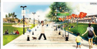
AVANCE. Prometen que este año definirán la licitación para la iniciativa privada en la Línea 4.