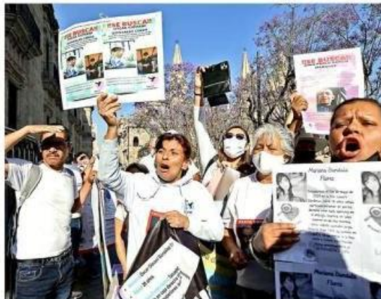
■ Familiares de personas desaparecidas se manifestaron el lunes afuera de Palacio de Gobierno.

En su lugar envió a otros funcionarios, con los que se llegó a diversos acuerdos, como mejorar la atención a los familiares de los desaparecidos.