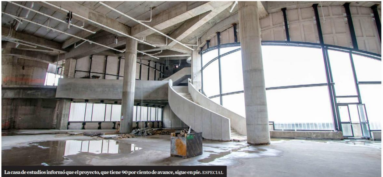
La casa de estudios informó que el proyecto, que tiene 90 por ciento de avance, sigue en pie.