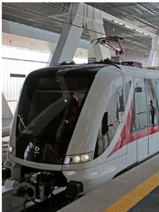
Recorrerá 20 kilómetros. FERNANDO CARRANZA

Con relación a la presa El Zapotillo, señaló que para junio se reactivarán los trabajos para concluir su construcción y abastecer de agua a la Zona Metropolitana de Guadalajara con una inversión de 6 mil millones de pesos. ■