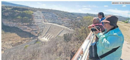
SUPERVISIÓN. Comunidades vigilan que la Conagua cumpla con las especificaciones en El Zapotillo.

Complementariamente, la administración estatal reforzará el programa de aprovechamiento de agua de lluvia, hará ajustes al sistema de distribución del líquido, rehabilitará las infraestructuras en plantas potabilizadoras y dará mantenimiento al sistema de Chapala.