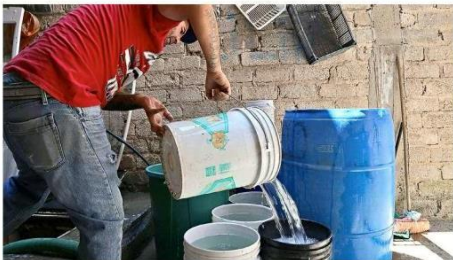
Vecinos temen que el desabasto de agua se agrave como el año pasado. Tuvieron que pedir pipas ante el desabasto el año pasado.