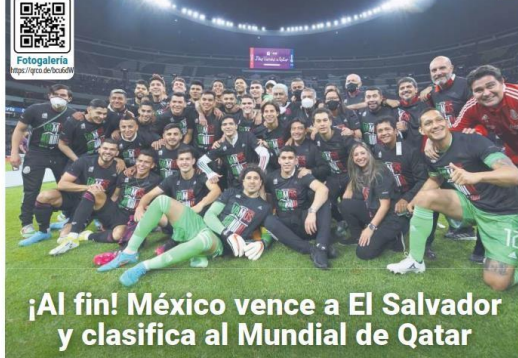
¡Al fin! México vence a El Salvador y clasifica al Mundial de Qatar