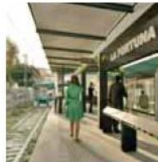
Pacto. El gobierno gestionó los recursos.

Metropolitana de Guadalajara. En rueda de prensa para explicar los alcances de la reunión que tuvo con el presidente Andrés Manuel López Obrador, explicó que las obras de la Línea 4 iniciarán con la construcción del primer nodo vial en Adolf Horn y después otro más en Periférico.