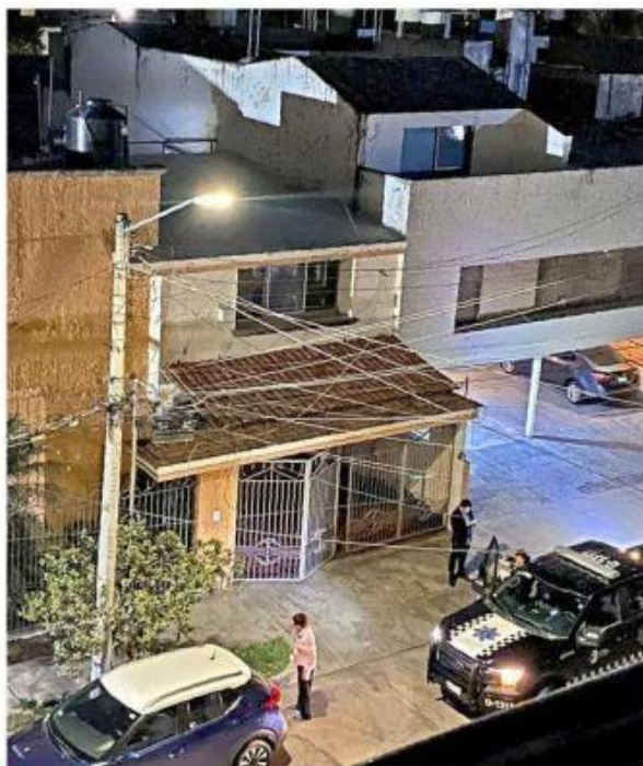
■ El 12 de marzo fue recuperado un vehículo en Providencia.

El 8 de marzo documentaron robos ocurridos en las