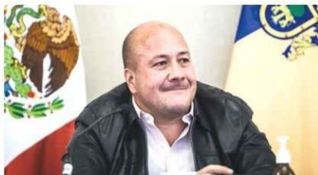
L4. El gobernador dijo que el presidente Andrés Manuel López Obrador visitará Jalisco para dar el banderazo al megaproyecto.