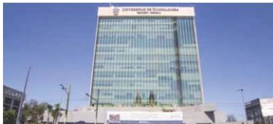
La UdeG planeaba invertir una partida presupuestal en el Museo de Ciencias Ambientales, pero el Gobierno estatal reasignó el recurso.

¿Lo de Vila Dosal fue solo una cortésia política o quizá un guiño a Alfaro Ramírez y al partido naranja ?