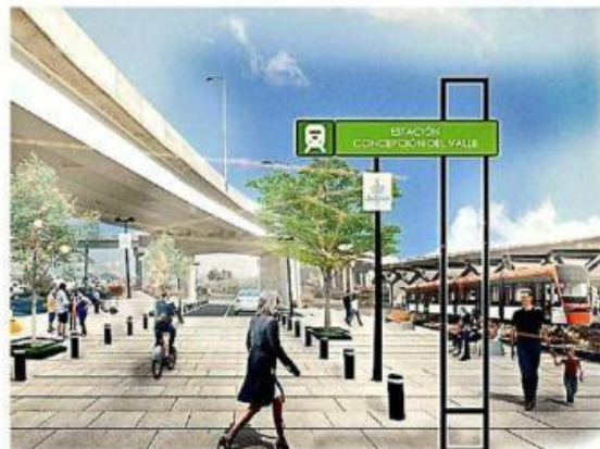
La Línea 4 del Tren Ligero conectará con Tlajomulco.

Dicho corredor del Tren Ligero tendría una longitud de 21.9 kilómetros y ocho estaciones. Se estima que mantendría una demanda de 103 mil 885 viajes al día.