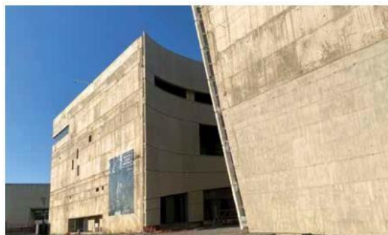
PROYECTO. La Universidad de Guadalajara afirma que el Museo de Ciencias Ambientales lleva 90 por ciento de avance.