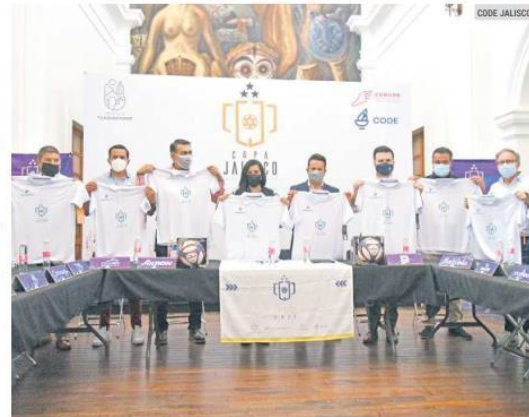
LISTOS. Los municipio jaliscienses se preparan para el arranque de este certamen a partir del próximo 9 de abril.

La Gran Final se jugará el 7 de agosto en el Estadio Jalisco y se otorgarán viajes a Europa y Sudamérica a los equipos campeones y subcampeones. Cihuatlán (varonil) y Cabo Corrientes (femenil) llegarán como los vigentes monarcas del torneo.