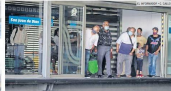
PLAN. La propuesta es que la nueva línea conecte con el Macrobús; tendrá una extensión de 20.8 kilómetros.