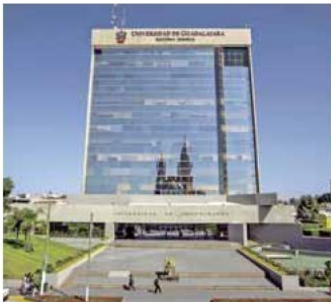
Polémica. La asignación del dinero generó controversia en distintos ámbitos de la entidad.

Fallo. Ministros de la SCJN desecharon la controversia de la CEDHJ para frenar la reasignación del dinero; era el último recurso legal que le quedaba a la casa de estudios