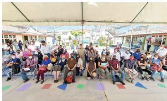
HASTA AHORA. Las familias beneficiadas no fueron consideradas en una primera entrega de apoyos.

"Se hizo una evaluación de daños. Se visitaron poco más de mil domicilios, de los cuales en ese momento 689 familias fueron registradas y procedieron con las reglas de operación del Foeden. Fueron beneficiadas, fueron apoyadas (...) Posteriormente, en una