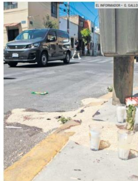
TRAGEDIA. Habitantes de la colonia pusieron veladoras en el lugar del percance.

“Venían rápido, no frenaron, el impacto fue de lleno, la muchacha estaba esperando el paso para cruzar la calle y recibió todo el golpe, salió proyectada. Todos los cruces de aquí son peligrosos, muy seguido chocan”, lamenta.