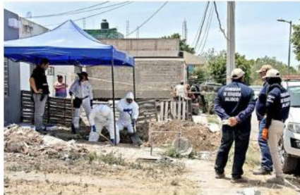
En la cochera de una finca localizaron 10 bolsas enterradas.