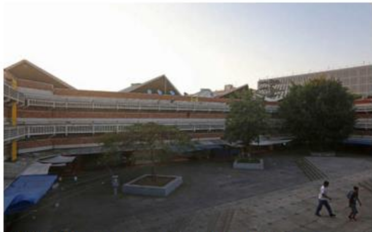
Más de 400 locales se vieron afectados por el siniestro.

“Los peritos de Obras Públicas están haciendo todavía el cálculo, el presupuesto de remodelación, en una primera instancia podríamos hablar de un piso mínimo de 40 millones de pesos; esto es el cálculo mínimo y pues el gobernador me ha dicho que le van a entrar y yo quisiera que fuera cuando menos en 50 y 50 (del estado y municipio), pero el gobernador está en muy buena actitud de ayudar a los comerciantes”, dijo el alcalde tapa-