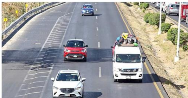
Con la nueva Ley de Movilidad, el límite en carriles centrales de avenidas de acceso controlado será de 80 kilómetros por hora.

La iniciativa busca lineamientos más estrictos, por ejemplo, en la obtención de