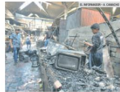
LAMAMDO. El alcalde de Guadalajara pidió a los comerciantes hacer lo necesario para evitar incendios.

En Guadalajara, Zapopan, Tlaquepaque, Tonalá, Tlajomulco de Zúñiga y El Salto hay 124 mercados.