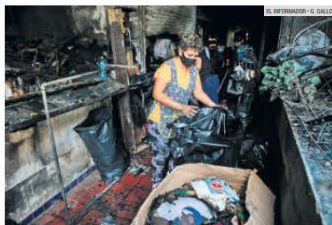
PÉRDIDA. Los locatarios acudieron a revisar los productos que se dañaron por el fuego.