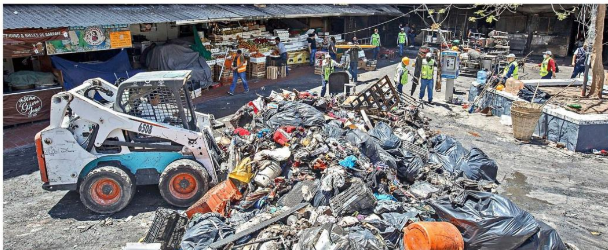
UN CÚMULO DE SUEÑOS. Son más de 105 toneladas de residuos los que se han sacado del mercado; ver su mercancía calcinada fue, para los locatarios, enfrentarse al dolor de una pérdida