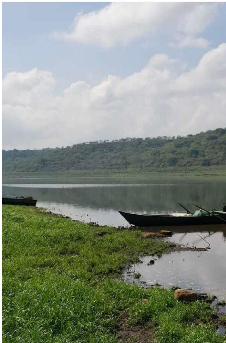
La presa Calderón se encuentra al 70 por ciento de su capacidad.

el Instituto de Información Estadística y Geografía (IIEG) Jalisco. Además, pide modernizar los sistemas de mediación para saber con cuánto líquido se dispone y cuánto es el que se utiliza.