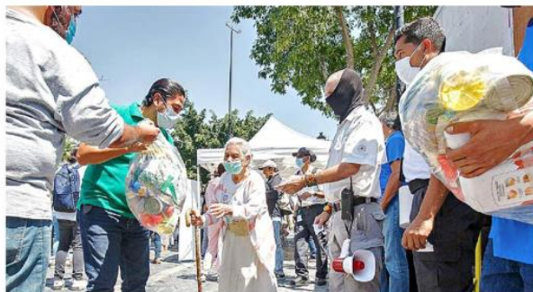
ALIMENTOS GARANTIZADOS. El Gobierno de Guadalajara entregó las primeras despensas a los empleados de los locales.