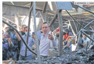
SUPERVISIÓN. Pablo Lemus recorrió nuevamente la zona más afectada por el siniestro en compañía de los ciudadanos.