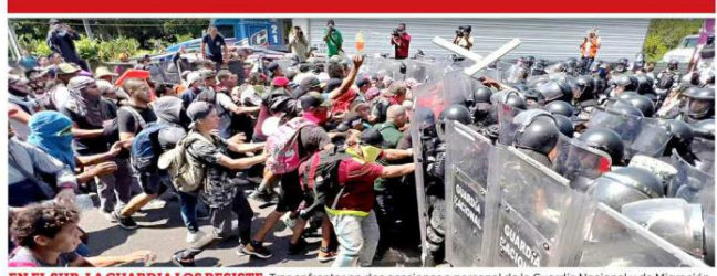
EN EL SUR, LA GUARDIA LOS RESISTE. Tras enfrentarse en dos ocasiones a personal de la Guardia Nacional y de Migración, una caravana de migrantes que salió de Tapachula fue desarticulada.

Anuncian que terminarán en mayo expulsiones sumarias