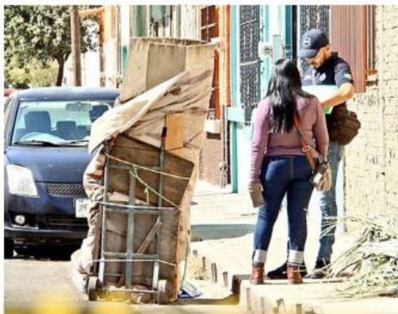
El hallazgo del cadáver ocurrió en la Calle Churubusco.