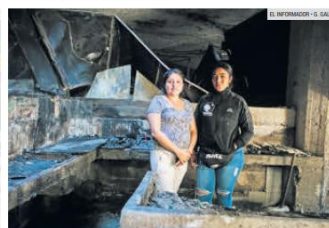
CAMBIO. Los comerciantes afectados serán reubicados en lugares como Plaza de La Estampida, la plazoleta central y el estacionamiento del inmueble.