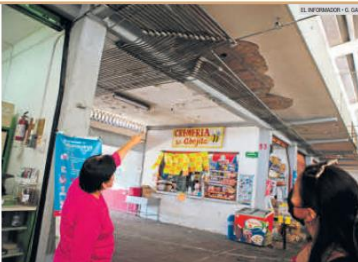
OLVIDO. Calculan que el Mercado Dionisio Rodríguez no recibe mantenimiento integral desde hace 10 años.

Para tratar de evitarlo, los mismos comerciantes realizan maniobras, como mantener la puerta cerrada donde creen que hay más peligro y cooperan para darle mantenimiento, pero no es suficiente.