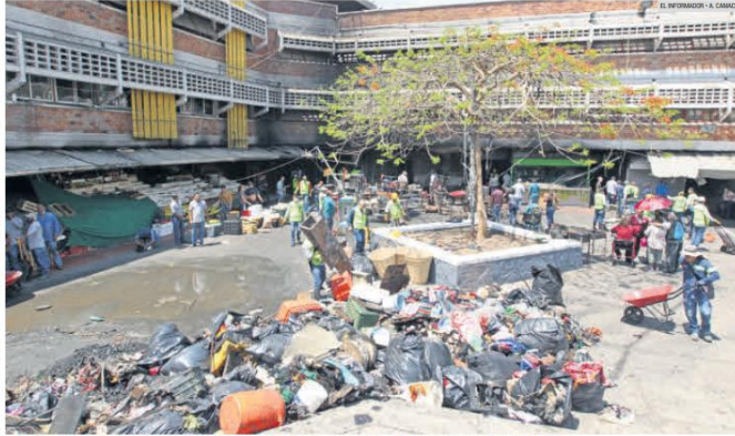
ORDEN. Los trabajos de limpieza y saneamiento al interior del mercado son realizados por 189 servidores públicos del municipio.

La Comisaría de la Policía Vial dio a conocer que ya abrieron la circulación de las calles y avenidas aledañas al mercado, las cuales fueron cerradas tras el percance. Las vialidades que ya fueron liberadas son Avenida Javier Mina y sus cruces con Calzada Independencia, Belisario Domínguez y Vicente Guerrero, a excepción de Dionisio Rodríguez, desde la Calzada Independencia hasta la calle Alfaro.