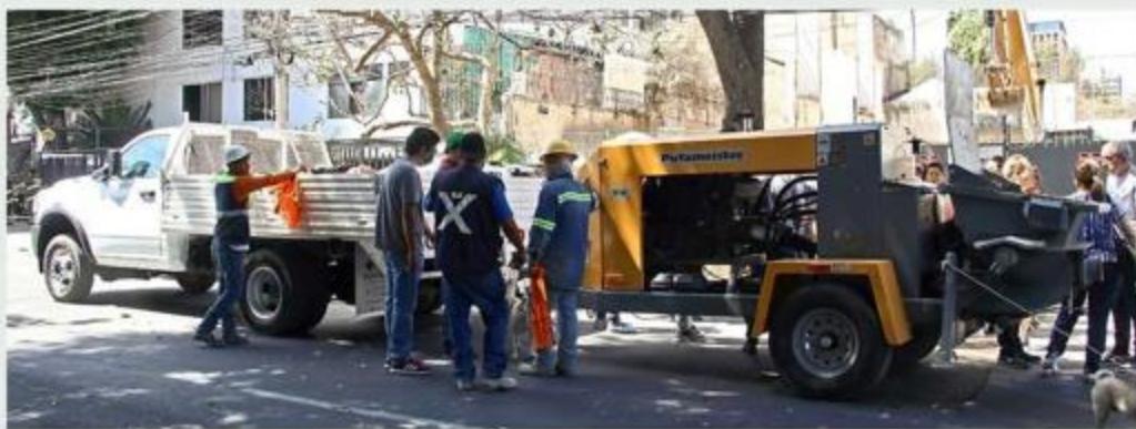
Residentes de Departamentos Europa, en la Colonia Americana, resultaron afectados.

De acuerdo con Obras Públicas del Ayuntamiento de Guadalajara, en el pre-