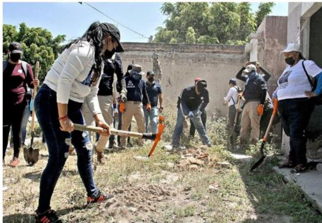
Voluntarios y familiares de personas desaparecidas participaron en la jornada de búsqueda.