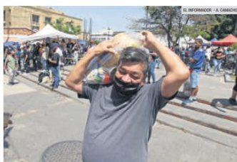
DESPENSAS. Ayer se distribuyeron mil apoyos alimentarios; hoy continuarán con la entrega.