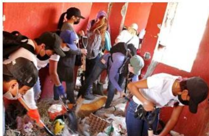
Los jóvenes revisaron también algunas viviendas.