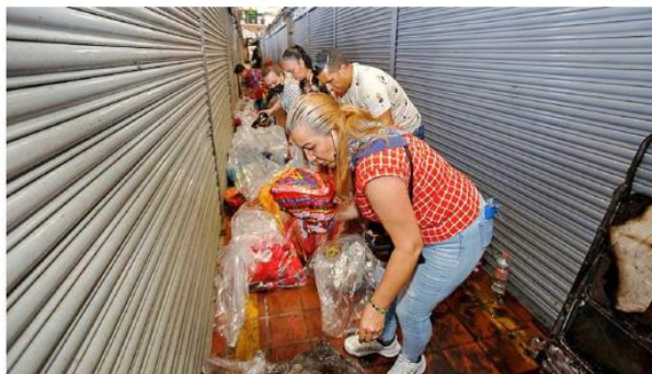
ESPERANZA EN BOLSAS. La mercancía rescatable se empacó para revisarla a detalle.