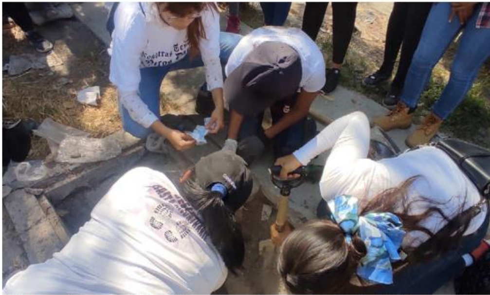
Entre buscadoras y autoridades, 200 personas participaron en la brigada. FERNANDO CARRANZA