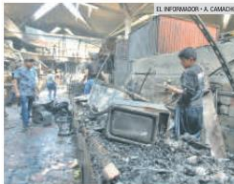
LLAMADO. El alcalde de Guadalajara pidió a los comerciantes hacer lo necesario para evitar incendios.

En Guadalajara, Zapopan, Tlaquepaque, Tonalá, Tlajomulco de Zúñiga y El Salto hay 124 mercados.