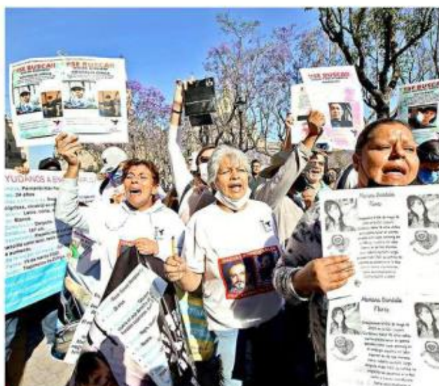
El informe debe servir para que la ciudadanía mida la eficacia de los trabajos en materia de búsqueda de personas.

Chimiak consideró que los instrumentos de evalua-