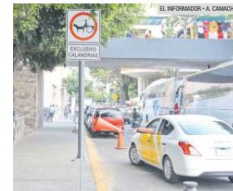
LE ESTORBA. Un taxista tiró un cono para estacionarse en una zona prohibida en Dionisio Rodríguez.

Añade que 22 agentes trabajan en las labores de supervisión en el Centro Histórico.