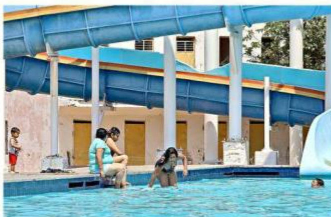
Personas se divierten en el balneario Lindo Michoacán.