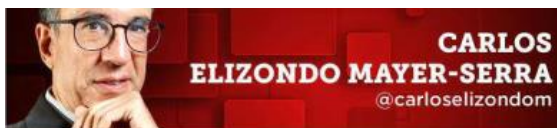
CARLOS ELIZONDO MAYER-SERRA @carloselizondom

La distribución y el sentido del voto a lo largo del país será la verdadera revelación de hoy.