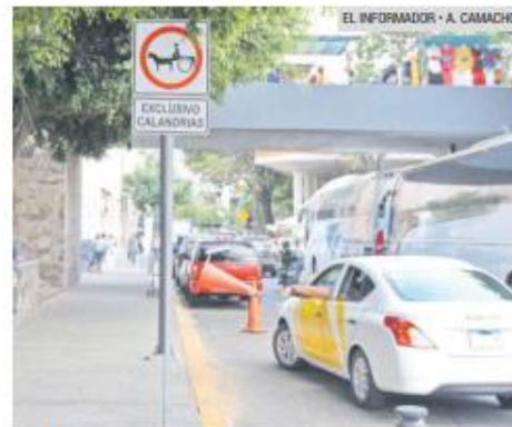
LEESTORBA. Un taxista tiró un cono para estacionarse en una zona prohibida en Dionisio Rodríguez.

Añade que 22 agentes trabajan en las labores de supervisión en el Centro Histórico.