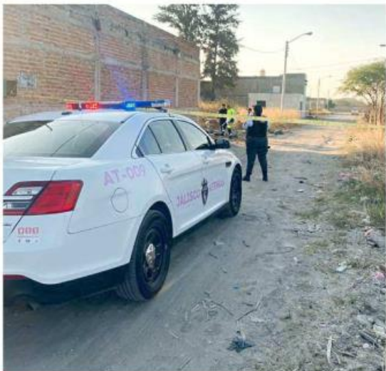
■ En Tlajomulco se registró el asesinato de una mujer.