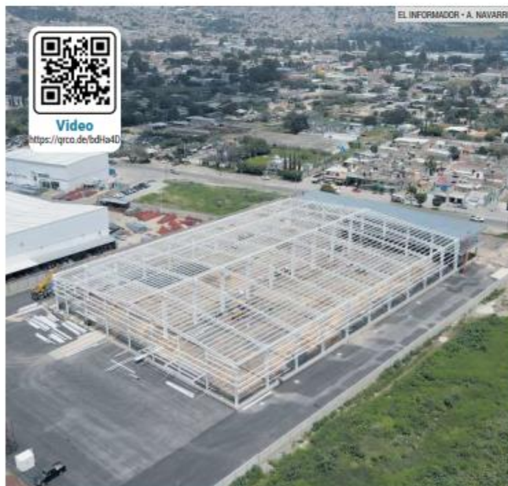
APOYO. La nueva sede, en Santa María Tequepexpan, tiene un terreno de 33 mil metros cuadrados que fue donado por la Secretaría de Agricultura y Desarrollo Rural.

Entre los sitios beneficiados hay casas hogar, asilos, comedores comunitarios, centros de rehabilitación y estancias infantiles.