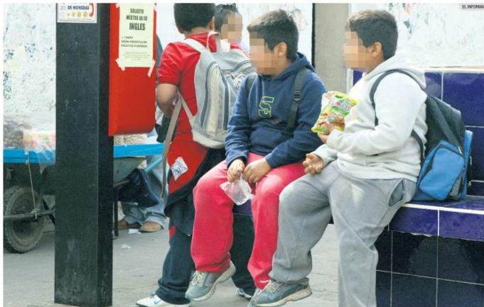
DESCUIDO. Los niños de cinco a 11 años tienen un problema más alto de obesidad en México.