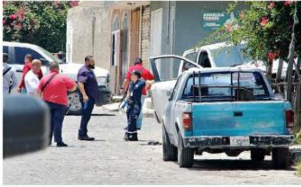
■ Autoridades aseguraron una camioneta y un arma de fuego.