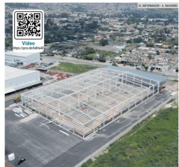
APOYO. La nueva sede, en Santa María Tequepepan, tiene un terreno de 33 mil metros cuadrados que fue donado por la Secretaría de Agricultura y Desarrollo Rural.

Entre los sitios beneficiados hay casas hogar, asilos, comedores comunitarios, centros de rehabilitación y estancias infantiles.