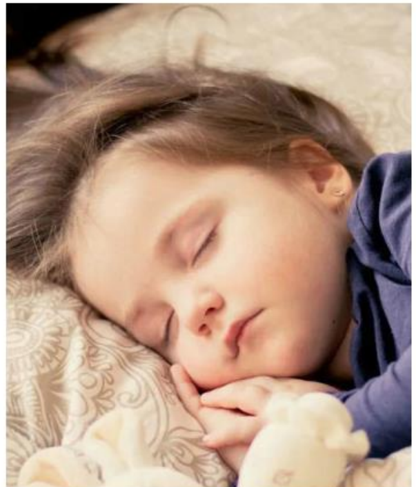
Deben descansar al menos ocho horas.

El consumo de alimentos no saludables antes de ir a dormir puede generar problemas de sueño.