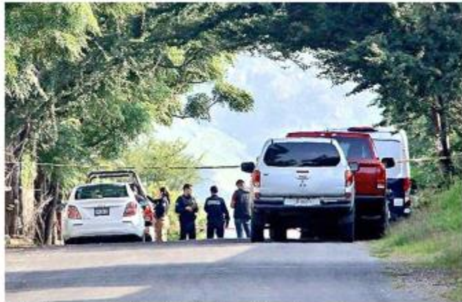
■ En Zapopan fue localizado el cadáver de un hombre.

Personal de la Fiscalía confirmó más tarde que el fallecido, de entre 35 y 40 años, tenía dos heridas en la cabeza.