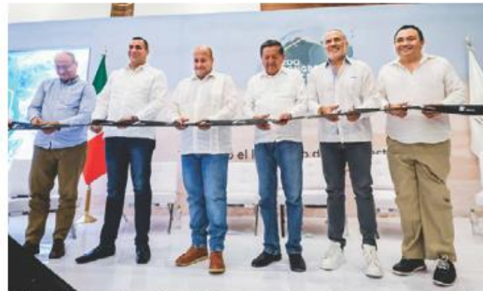
El gobernador Enrique Alfaro Ramírez estuvo presente en la inauguración del Segundo Congreso Nacional Joyero.

“En este encuentro seguramente tendrán la oportunidad de reflexionar, analizar, discutir y entender que sigue para el sector, que tenemos que hacer para cerrar filas en esta ruta de transformación y ajustes que son necesarios”, agregó. ■