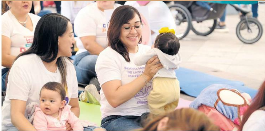
AMAMANTAR. La salud de las madres es fundamental cuando realizan la lactancia.

Una nueva investigación de la Universidad de Harvard sugiere que padecer sobrepeso u obesidad durante la lactancia reduciría la calidad de la leche materna, lo que podría afectar la salud y el buen desarrollo de la o el recién nacido, pues a la larga también podría tener problemas para mantener un Índice de Masa Corporal adecuado.