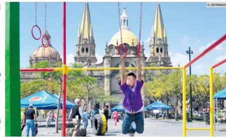
HÁBITOS. Motivar a los menores a hacer ejercicio les ayudará en su salud toda su vida.

Los CDC destacan que los niños de tres a cinco años deben estar activos durante todo el día. Los menores de seis a 17 años deben realizar actividad física al menos 60 minutos por día. Es importante incluir actividad aeróbica, que es cualquier cosa que haga que sus corazones latan más rápido. También hay que llevar a cabo actividades de fortalecimiento óseo, como correr o saltar, y de fortalecimiento muscular, como trepar o hacer flexiones de brazos.