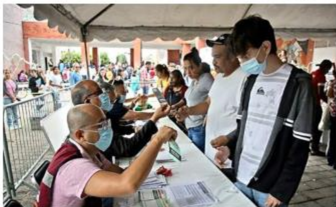
Las 10 mujeres y 10 hombres electos en los Distritos 10 y 16 serán consejeros estatales y congresistas nacionales.