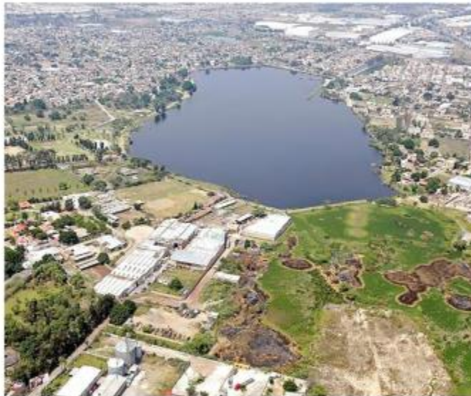
La Presa de El Ahogado poco a poco ha sido rellenada, de manera parcial, por invasiones.

Cuando concluya este proceso, parte del terreno será entregado a ejidatarios