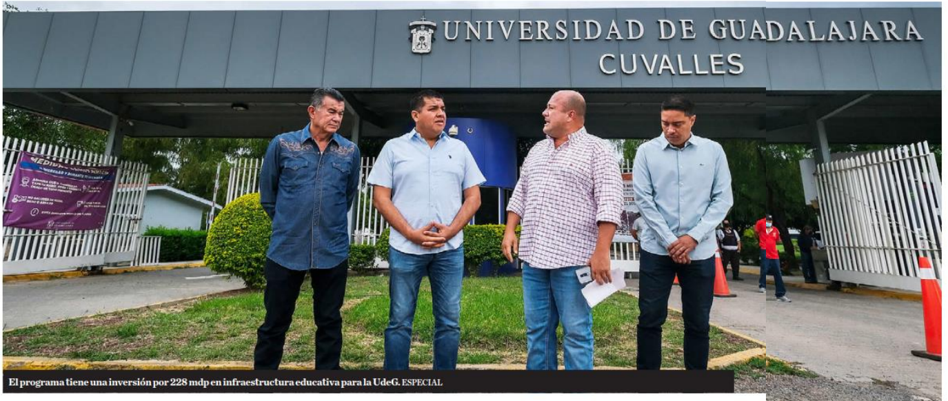
El programa tiene una inversión por 228 mdp en infraestructura educativa para la UdeG.