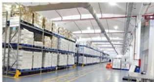
Foto tomada en diciembre pasado de las medicinas en bodegas de Birmex. Fuentes reportan que los fármacos siguen ahí.

Sobre estas adquisiciones, la Secretaría de la Función Pública, a través del Órgano Interno de Control en Birmex, inició en abril una auditoría para revisar las contrataciones realizadas por la paraestatal en 2020 y 2021. La revisión, de acuerdo con el oficio 12/277/O1C-