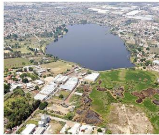
La Presa de El Ahogado poco a poco ha sido rellenada, de manera parcial, por invasiones.

Cuando concluya este proceso, parte del terreno será entregado a ejidatarios