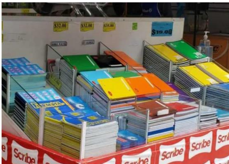
Algunos útiles escolares han aumentado de precio. ESPECIAL