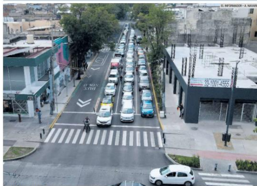
CONGESTIONAMIENTO. La habilitación del carril BusBici provocó que aumentara el tráfico en Avenida Hidalgo, donde en horas pico se pueden observar largas filas de autos; los choferes exigen que la Policía Vial ayude a agilizar la circulación.

7 503003 834007 Hoy 16 páginas | $ 10.00