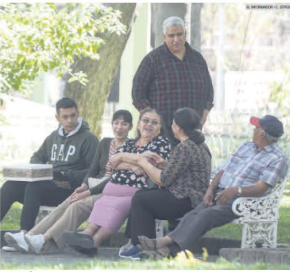
POBLACION PAREJA. Del total de habitantes de la colonia, el 50.1% son hombres y el 49.9% son mujeres.

Pero eso no es lo único que se considera una ventaja, "pues la adminis-