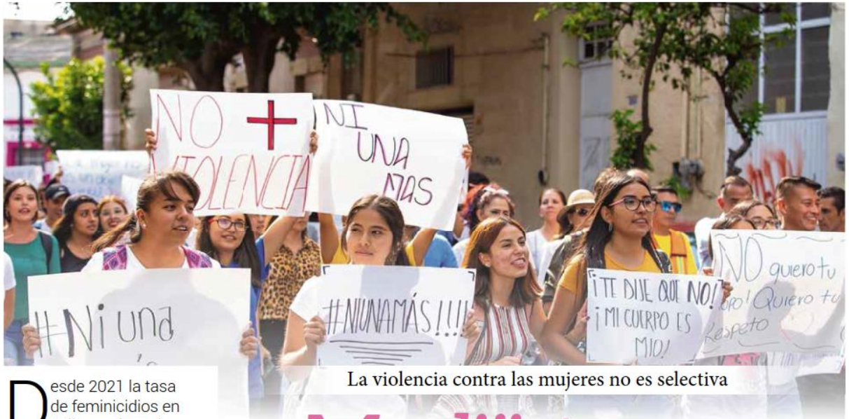
La violencia contra las mujeres no es selectiva

Desde 2021 la tasa de feminicidios en Jalisco rebasa la media nacional al tener 1.7 feminicidios por cada 100 mil mujeres en la entidad.