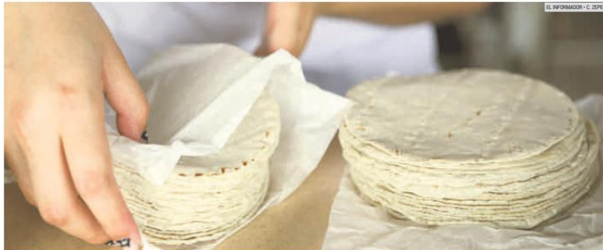
ALERTA. Si la tortilla se continúa vendiendo sin un control sanitario, se puede causar un daño a la salud de los consumidores.

La Profeco no realizó revisiones en Jalisco sobre los costos del producto el año pasado