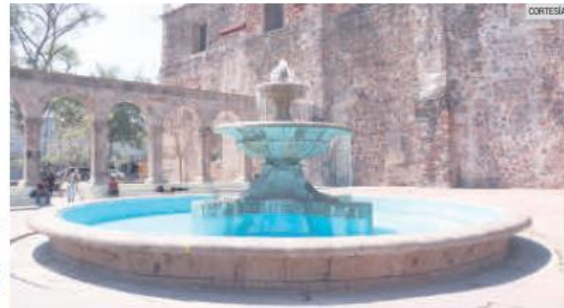
TEMPLO DE SAN FRANCISCO DE ASÍS. El rescate de este inmueble responde a la tarea del Estado por preservar el patrimonio arquitectónico.

“Es un templo que tiene abierto al culto más de 300 años (...), y hoy representa de los pocos y grandes edificios que son patrimonio histórico edificado del municipio de Guadalajara, de todo el Estado y por supuesto de México. Para nosotros, de verdad, nos llena de orgullo que estés dentro del marco de Paseo Alcalde, donde tenemos una serie de edificios que son muestra de la historia que hemos tenido como ciudad”, señaló el coordinador gene-