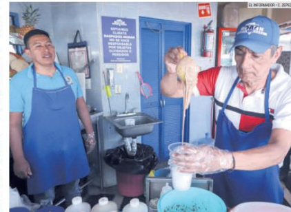
RASPADOS MORÁN. La tradición de este negocio le ha valido el cariño de sus comensales.