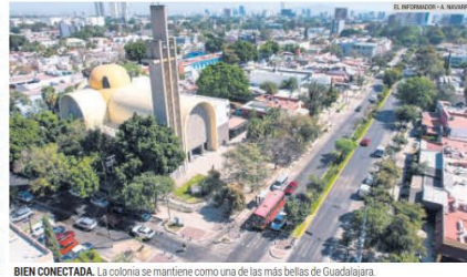
BIEN CONECTADA. La colonia se mantiene como una de las más bellas de Guadalajara.