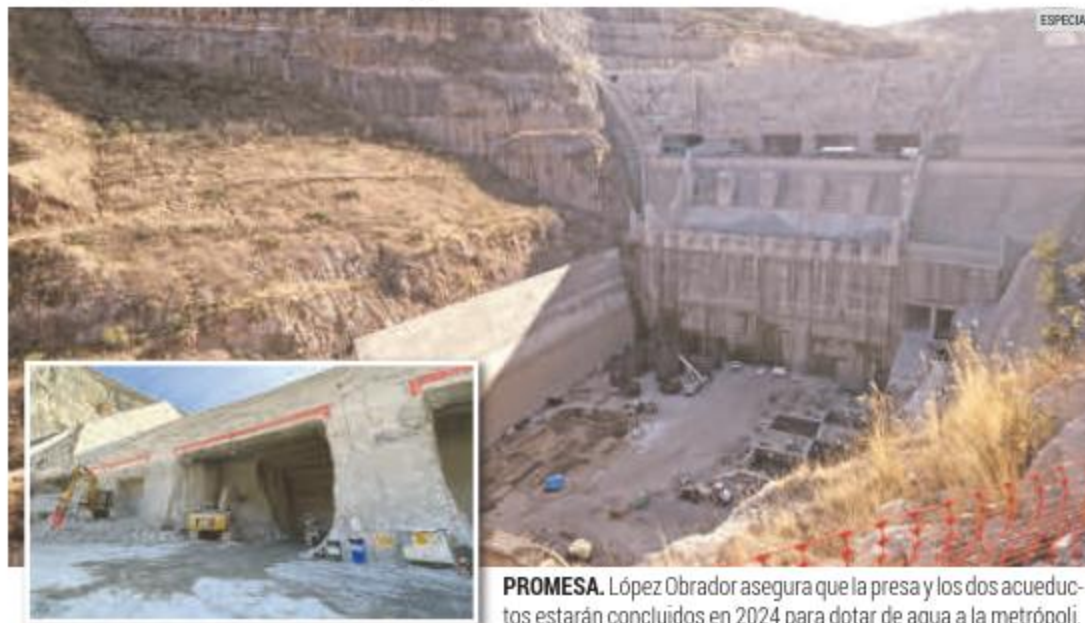
PROMESA. López Obrador asegura que la presa y los dos acueductos estarán concluidos en 2024 para dotar de agua a la metrópoli.

Las obras en la cortina de El Zapotillo y los acueductos para conectarlos con el sistema de las presas El Salto, La Red y Calderón avanzan conforme a lo programado, confirma el Gobierno de Jalisco, luego de realizar un recorrido de supervisión encabezado por Andrés Manuel López Obrador.