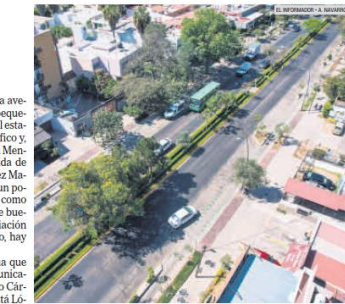
COORDINACIÓN. Los vecinos se han unido para darle una mejor presencia a la colonia.

Como ventaja final, acentúa que Chapalita "está muy bien comunicada, porque el eje Vallarta-Lázaro Cárdenas no es el único, también está López Mateos, y se cruza en cinco minutos de uno a otro".