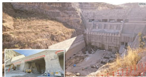
PROMESA. López Obrador asegura que la presa y los dos acueductos estarán concluidos en 2024 para dotar de agua a la metrópoli.

Las obras en la cortina de El Zapotillo y los acueductos para conectarlos con el sistema de las presas El Salto, La Red y Calderón avanzan conforme a lo programado, confirma el Gobierno de Jalisco, luego de realizar un recorrido de supervisión encabezado por Andrés Manuel López Obrador. En la pasada visita, el Presidente