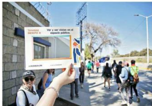
La colectiva Transeúntas participó en la caminata.