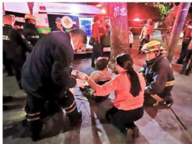
■ Paramédicos y bomberos auxiliaron a las afectadas.

La Fiscalía de Jalisco inició una investigación al respecto.