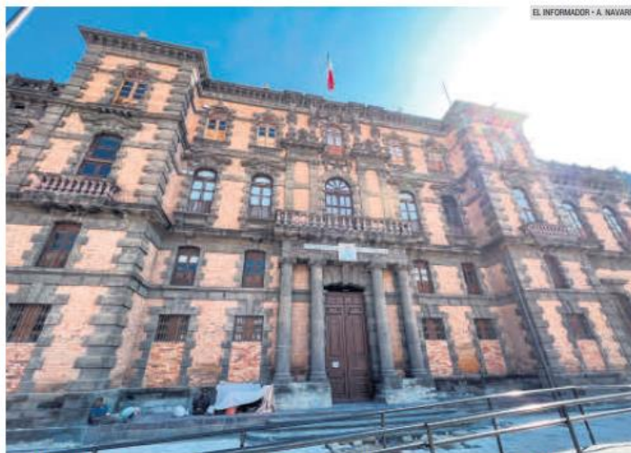
EDIFICIO ARRONIZ. Esta construcción está catalogada como monumento histórico por el INAH.

La fachada principal de la finca se ubica por la calle Zaragoza, cuenta con un pórtico marcado por cuatro columnas, y en el piso inferior se halla el ingreso principal, mientras