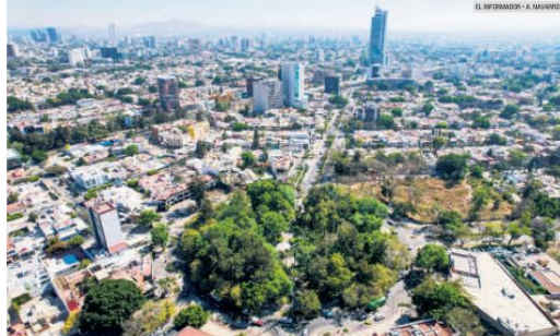
CHAPALITA. La glorieta con el mismo nombre de la colonia es el emblema de una de las zonas con mejor calidad de vida en la ciudad.

La coordinación de colonos y el "Operativo Sin Fronteras" tienen efectos positivos en la zona limitrofe de Guadalajara y Zapopan