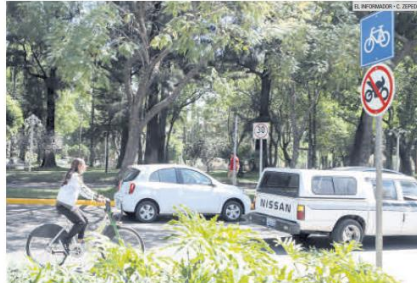
LA BICI GANA ESPACIOS. Los lugares exclusivos para este tipo de transporte van en aumento.

Las direcciones de Movilidad y Transporte de Guadalajara y Zapopan presentaron unido mapa para que los ciclistas tengan información valiosa para realizar sus trayectos, como ubicación de ciclovías, comercios para servicios de bicicletas, lugares turísticos, sitios de emergencias y rutas de transporte para realizar viajes intermodales, es decir, combinar trayectos entre distintos medios de movilidad. El mapa se puede consultar en www.luchadorevial.mx/mapa-ciclista-gdl/