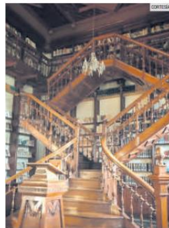
BELLEZA. La biblioteca del Edificio Arroniz es digna de ser visitada y admirada.

En 1901 ya con una presencia profesional y un prestigio notorio en la ciudad, el ingeniero Arroniz Topete inició la construcción de su fábrica de productos cerámicos, la primera en Guadalajara en producir ladrillos horneados a alta temperatura, con lo que recubrió los muros de su empresa, así como los del Seminario Mayor (que ahora es el Edificio Arroniz), además de algunas casas particulares que también edificó. Para 1926, a la edad de 68 años, murió víctima de una bronquitis aguda, padecimiento que desarrolló como consecuencia de las largas jornadas de trabajo dentro de su fábrica.