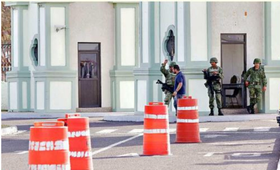
La reunión se desarrolló en la Base Aérea Militar, en Zapopan.

En la vista que llevó a cabo AMLO a Jalisco el 10 de febrero, aseguró que Jalisco contaría con 129 sucursales del Banco de Bienestar, de las cuales más de medio centenar ya estaban operando.