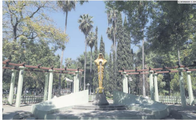
GLORIETA CHAPALITA. Un espacio emblemático de la zona, donde el arte y la tranquilidad van de la mano.