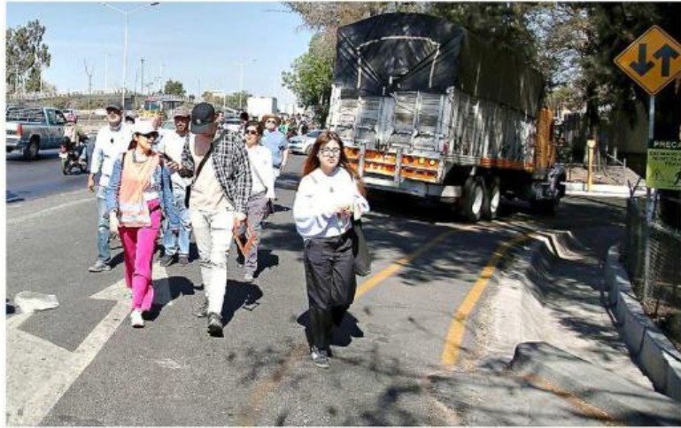
En algunos puntos, las banquetas casi desaparecen.