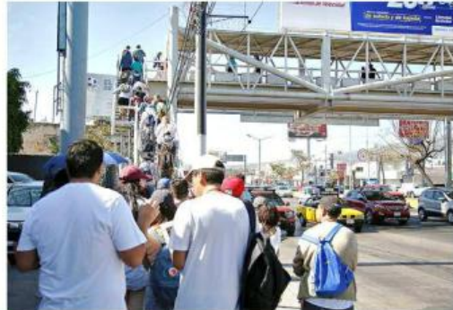
Señalan como puentes "antipeatonales" varias estructuras de la Avenida.

"Es generar condiciones para transitar la vía pública a modo de peatón, de ciclista y de transporte público", concluyó la coordinadora del Observatorio de Movilidad.