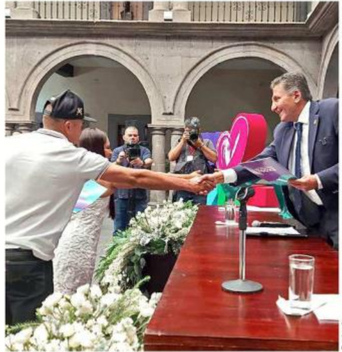
La ceremonia fue encabezada por el Alcalde de Zapopan.

Además del matrimonio, el Gobierno de Zapopan también exentó el cobro de trámites requeridos como las pláticas prenupciales en el DIF y los certificados de exámenes médicos en Cruz Verde.