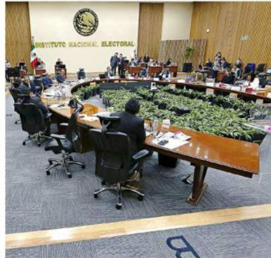
El INE elegirá a cuatro nuevos consejeros.

El IFE nació en 1990, tras la crisis política que se generó en el País en el marco de las elecciones de 1988. 24 años después, en el 2014, el organismo mutó a INE.