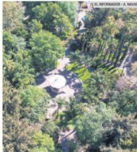
INFINITAMENTE VERDE. Es un espacio de enorme riqueza natural.