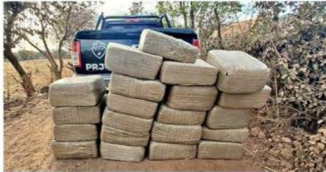
El 20 de enero, la Policía estatal aseguró 250 kilos de marihuana en San Juanito de Escobedo.