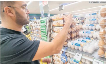
EL OTRO LADO. El huevo continúa como uno de los productos que más se han encarecido.

Se anticipaba una moderación de la inflación, con algunos de los ajustes relacionados al inicio del año desvaneciéndose. Sobre la dinámica del periodo, algunas presiones de la primera quincena se habrían extendido a la segunda.