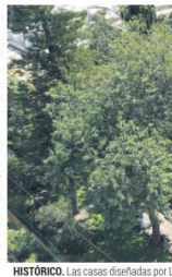
HISTÓRICO. Las casas diseñadas por Luis Barragán son emblemáticas no sólo de la zona, sino de la ciudad.

Según un análisis demográfico del Instituto de Información Estadística y Geográfica (IIEG), el 4.4% de la población de la Colonia Americana presenta alguna limitación en la actividad (discapacidad). En 2020, en Jalisco el grado promedio de escolaridad de la población de 15 años y más de edad fue de 9.9, lo que equivale a casi el primer año de bachillerato en grados estudios. Pero en este barrio el promedio es de 14.4 años estudiados, que equivale al segundo año de universidad. El 0.9% de la población de tres años o más habla alguna lengua indígena; es decir, apenas 36 personas. Mientras que el 0.6% de la población de 15 años y más es analfabeta.