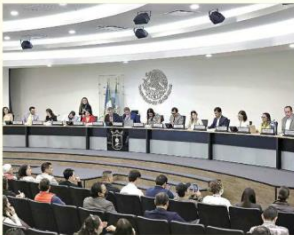
El Reglamento se aprobó en 2019.

Por su parte, Díaz argumentó que se trata de una violación a los derechos de