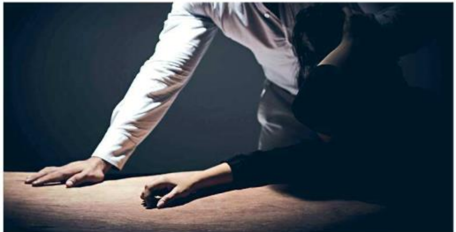
■ En Jalisco se registraron 13 mil 747 denuncias por violencia familiar durante 2022.

En Jalisco hay grupos especializados de policías como Ateneas y, aunque no hay una Fiscalía especializada, existen los Centros de Justicia para