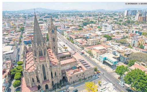
AMERICANA. El Templo Expiatorio es uno de los edificios emblemáticos de la colonia, calificada como el "mejor barrio" del mundo, según la revista Time Out.

Aunque los delitos van a la baja, vecinos y turistas piden mejorar la seguridad y más estacionamientos