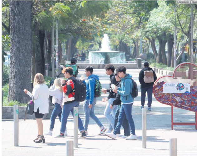
MÁS QUE PEATONAL. El camélon de la Avenida Chapultepec se ha convertido en un espacio multicultural para los tapatíos.

La zona tiene una de las plusvalías más caras de la metrópoli