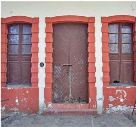
■ Parte de la infraestructura luce deteriorada.

roducción de mascotas tales como perros y gatos dentro de las instalaciones de la Red, excepto en aquellos que su infraestructura tenga una área canina -no es el caso de Colomos-”.