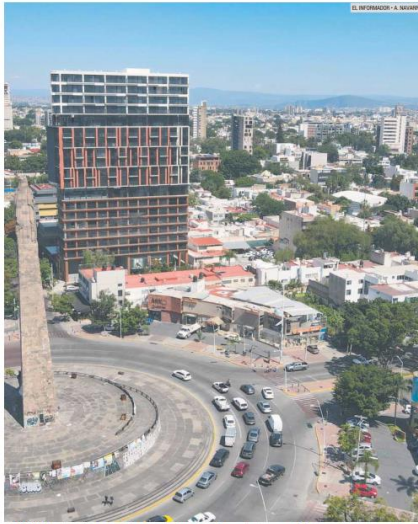
COLONIA. La Americana se distingue por brindar espacio para todos, con actividades culturales, deportivas y de convivencia, entre otros.

Además, se recuperaron 74 vehículos y 10 motocicletas.