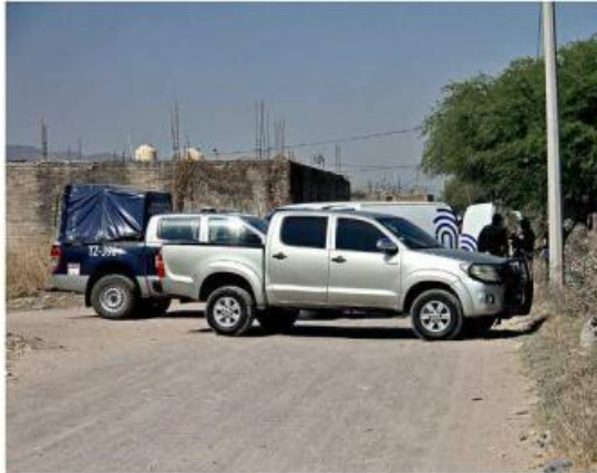
■ En Santa Cruz del Valle fue localizado un joven sin vida.

Un reporte sobre un bulo sospechoso en la vía pública atrajo a los primeros patrulleros, quienes confirmaron el crimen en la Calle