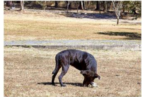
■ Denuncian que se han registrado ataques de perros.