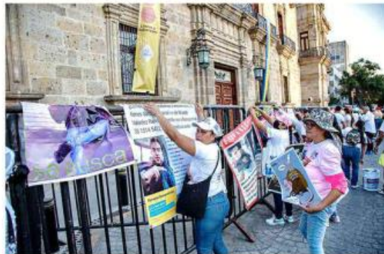
Colgaron fichas de personas desaparecidas en las vallas colocadas frente a Palacio de Gobierno.

zaron con la frase acuñada en últimos meses como defensa al INE por la reforma electoral: “mi carro no se toca”, coreaban.