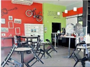
Varias sucursales en distintos puntos de la Ciudad, como en Avenida Servidor Público, están cerradas.