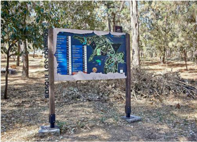
■ Luce en mal estado el mapa guía de los espacios que comprende el parque.

De acuerdo con el Artículo 31 del Reglamento relacionado al uso de los espacios administrados por la Agencia Metropolitana de Bosques Urbanos, “se prohíbe la in-