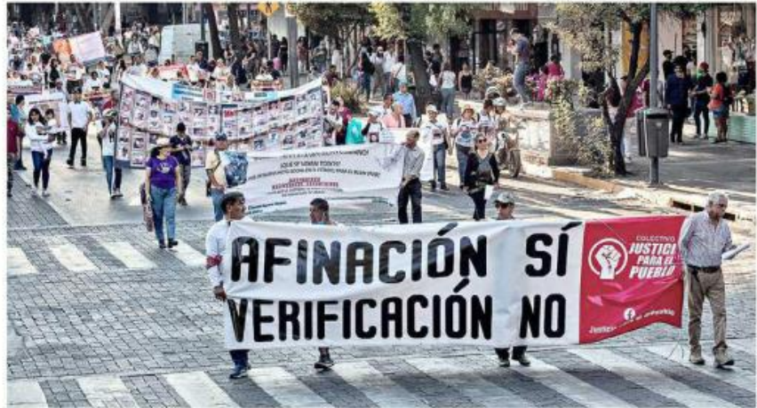
Están en contra de los operativos de verificación vehicular.