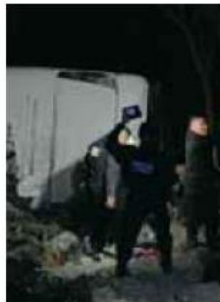
Apoyo. Se acompaña a los familiares.