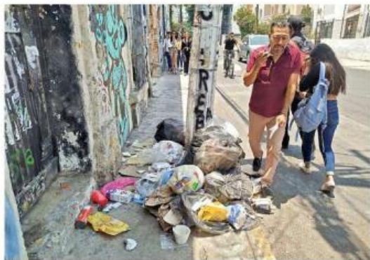
■ La limpieza de las calles estuvo entre lo peor evaluado en GDL.

ra (ZMG), la mitad de sus habitantes percibe suciedad en las calles por una deficiente recolección.