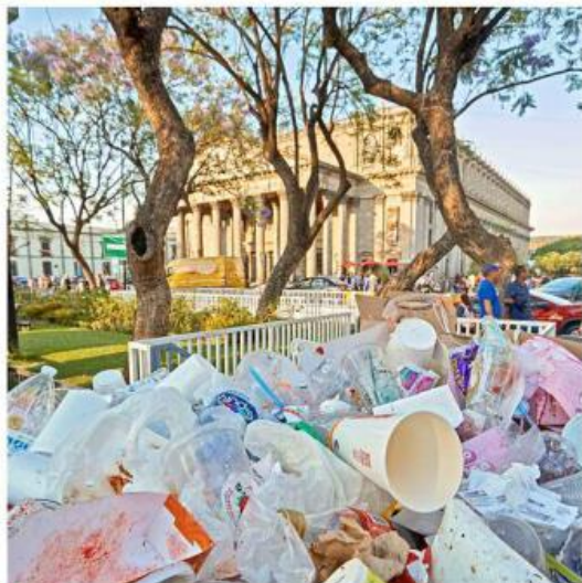
■ Basura recolectada en el Centro Histórico de la Ciudad.

En los Municipios de la Zona Metropolitana de Guadala-