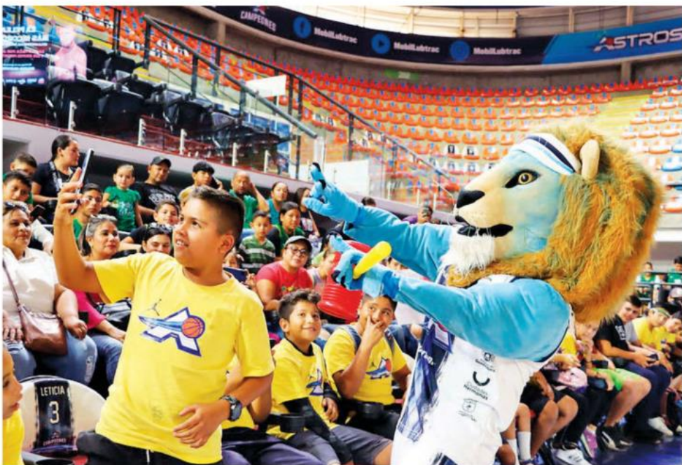
El sorteo se llevó a cabo con la presencia de la Notaría Pública Número 1 de San Pedro Tlaquepaque.

Este fue el último sorteo que competía a la SSAS, ya que se entregaron a personas con discapacidad y sus acompañantes; para las niñas, niños y adolescentes de Academias Deportivas;