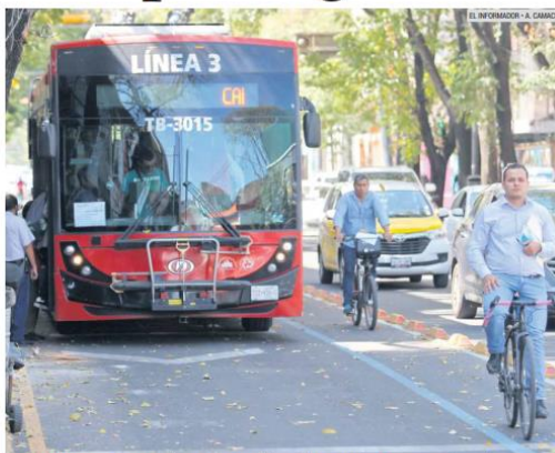
PARA TODOS. Peatones que utilizan transporte público, ciclistas que circulan por su carril exclusivo, y automovilistas por las vías centrales, conviven diariamente en la zona del BusBici.

Antes de ello será necesario ir atendiendo etapas prioritarias que dan continuidad una a otra, por ejemplo, y en primer lugar, la ampliación del BusBici ya existente en la ave-