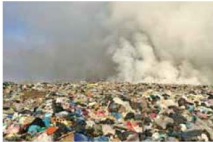
Norma. Aunque la basura tenía que estar sepultada, los desechos se encuentran a cielo abierto.

El incendio del lunes fue considerado por algunos vecinos como motivo suficiente