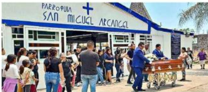
Familias comenzaron a despedir a víctimas del "camionazo".