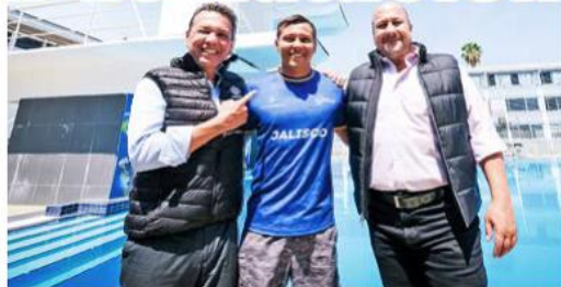
Estuvieron presentes deportistas y funcionarios estatales y municipales.

“Estamos terminando el recorrido aquí en el Code Alcalde, en donde entregamos obras por 75 millones, más 12 millones de equipamiento y arrancamos una siguiente etapa con 65 millones de inversión para este año, que forman parte de un programa muy ambicioso de renovación de nuestra infraestructura deportiva, particularmente aquella que está destinada para preparar a los grandes atletas de Jalisco, a los que nos han hecho campeones, a los que aquí se preparan para representar a nuestro estado”.