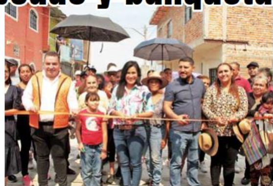
Se invirtió más de 1.2 millones de pesos en las obras.