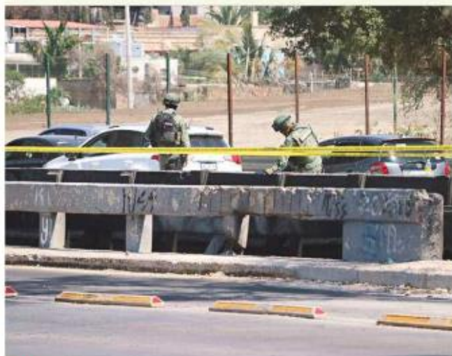
■ El cadáver de Rancho Nuevo estaba carbonizado.