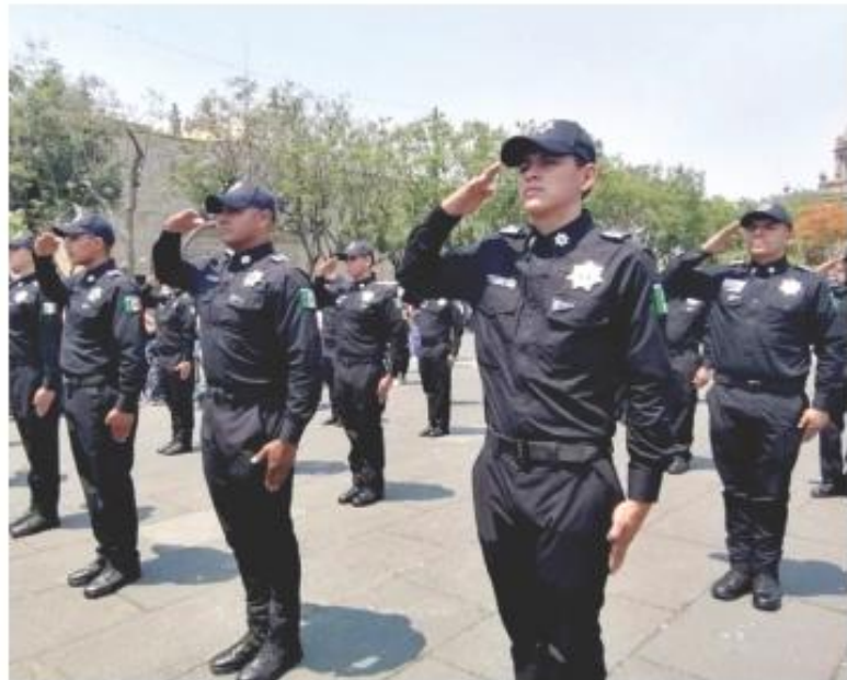
La ceremonia fue realizada en la Plaza Liberación, en el Centro Tapatío.