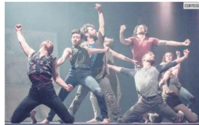
"EL GRITO DE LAS MEDUSAS". La puesta en escena es una creación de Alan Lake.

► Teatro Degollado: El Festival Cultural de Mayo tiene prepara-