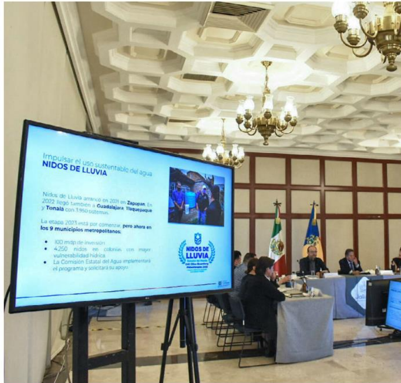
Celebra sesión ordinaria la Junta de Coordinación Metropolitana. ESPECIAL

Urbanidad. Revisarán viabilidad para reglamentar sistemas de captación de lluvia en edificios; analizan sistemas de alerta