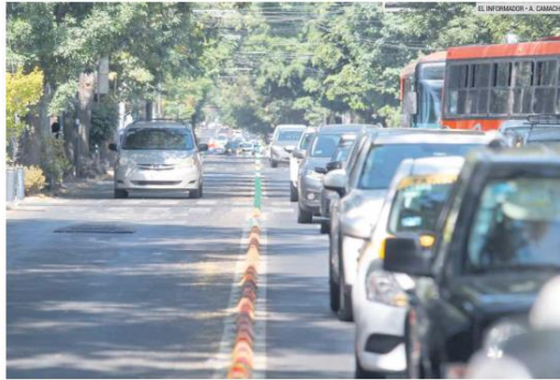
SIN MIEDO A LAS AUTORIDADES. Pese a que pueden ser multados por invadir el carril BusBici, en Avenida Hidalgo, hay automovilistas que deciden circular por esa vía exclusiva para ciclistas, unidades del transporte público y de emergencia.

Las sanciones no han impedido que los conductores circulen por zonas exclusivas para transporte público y unidades de emergencia