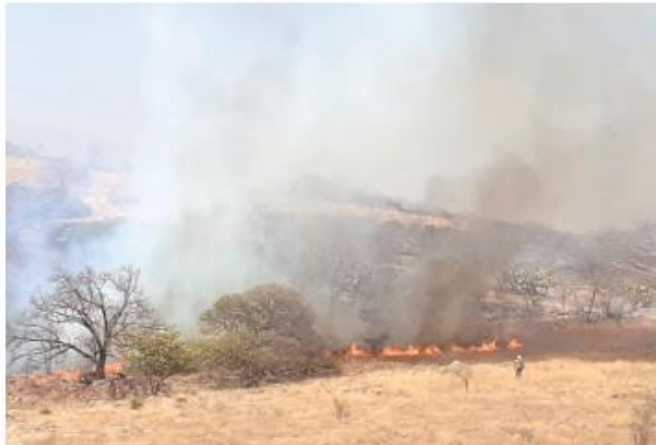
Hay sujetos detenidos como presuntos causantes de las conflagraciones.

También en la zona de Atemajac de Brizuela en los parajes conocido como La Joya y El Capulín están combatiendo diversas brigadas