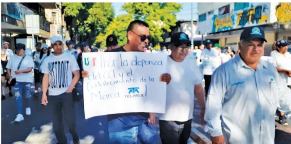
Los manifestantes pidieron respeto a los contratos colectivos de trabajo.