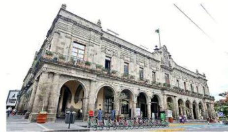
El servidor público sancionado labora en el Municipio tapatío.

Este tipo de violencia consistente en la acción u omisión que atenta contra la igualdad y dignidad de la persona receptora dañando su autoestima, salud, integridad, libertad y seguridad, e impide su desarrollo armónico.