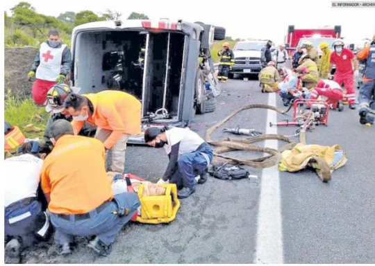
LA MENTABLE. La Carretera federal 200 se considera como muy peligrosa, principalmente la zona de curvas y de carriles de ida y vuelta, entre Tepic y Puerto Vallarta.

Las 18 víctimas fatales del accidente del sábado pasado, es el mayor registro a nivel nacional