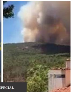
El combate al fuego se complica debido a las condiciones climáticas, que ha provocado que el humo llegue a la zona metropolitana.