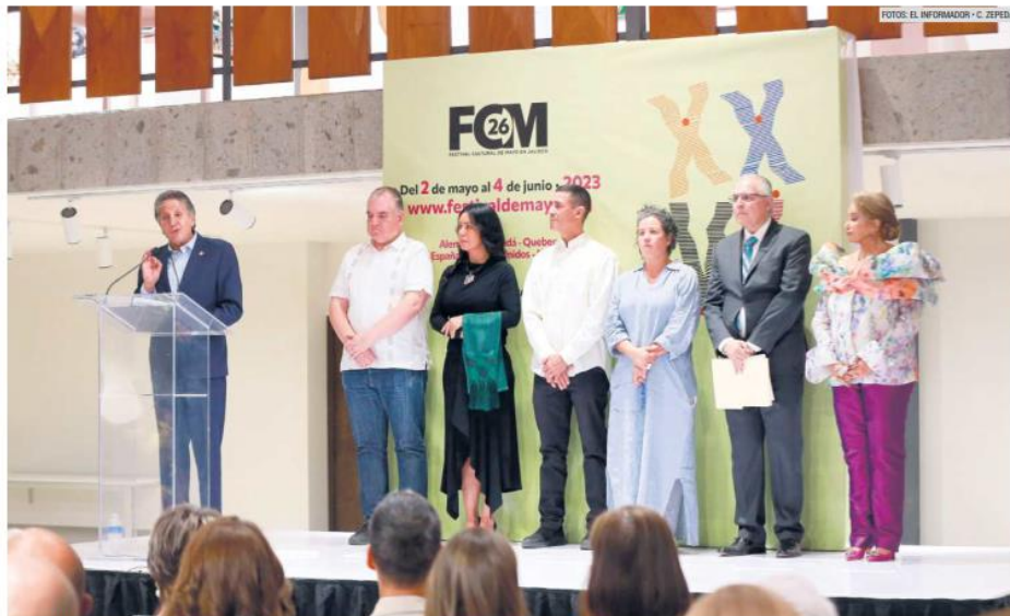
APERTURA. El acto de inauguración del FCM se realizó en la Casa de las Artesanías en Guadalajara.