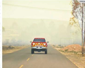
LUCHA. Brigadistas de los tres niveles de Gobierno y voluntarios combaten el fuego que sigue afectando a la zona de Atemajac de Brizuela y Chiquilistán.

En Zapopan, los incendios ocurrieron en La Tiznada, fuera del Área Natural Protegida (ANP) del Bosque La Primavera, en La Mesa de los Indios y en La