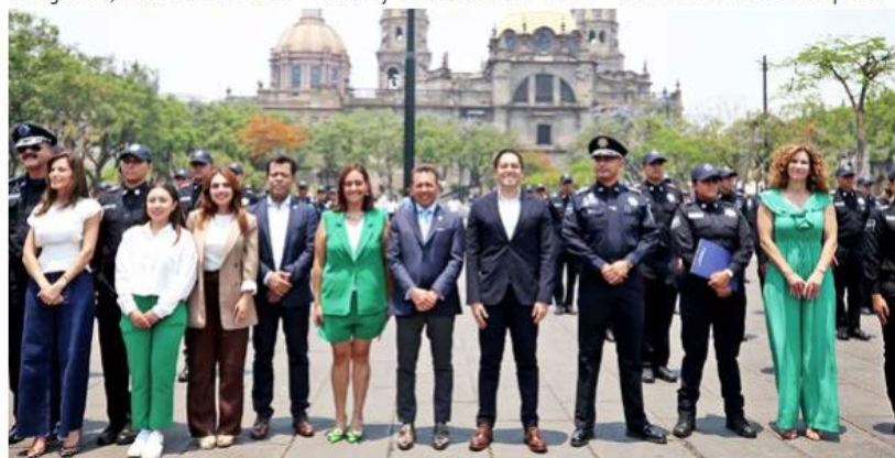
La ceremonia de graduación se desarrolló en Plaza de la Liberación.

El alcalde agregó que el presupuesto en Seguridad en la ciudad aumentó más de 60 por ciento, al pasar de mil 244 millones de pesos en 2021 a 2 mil 72 millones de pesos en 2023: "Es decir, aunque nos falta mucho por recorrer en el camino, nos marca que estamos tomando la ruta correcta (...) La vida de un policía es dura en su trabajo, en las jornadas, en la atención, en el estrés, pero siempre hay que disfrutar del trabajo. Siempre hay que hacerlo con una sonrisa, con compañerismo, con un sentido de servicio a la comunidad".