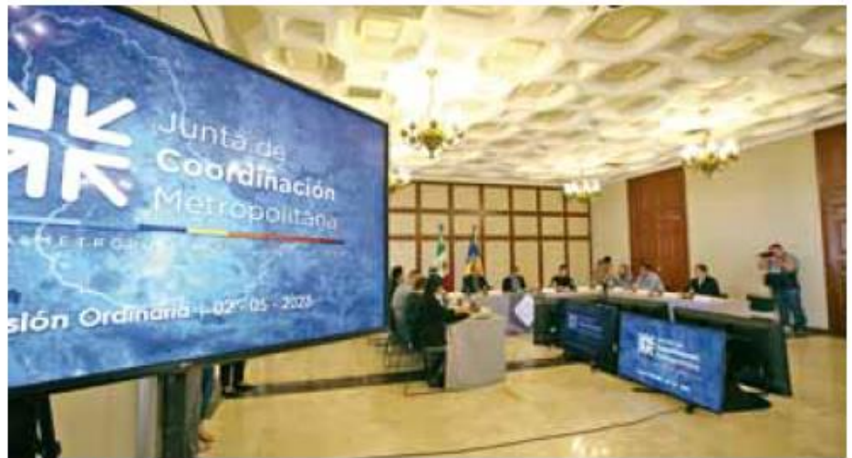
Puntos. El Imeplan estableció que se requiere definir un marco legal adecuado.

En sesión ordinaria de la Junta de Coordinación Metropolitana (JCM), la directora general del Instituto de Planeación y Gestión del Desarrollo (Ime-