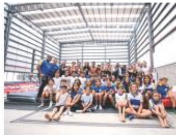
Con los 75 millones de pesos anunciados por el mandatario se renovará la alberca.

pensamos en ese momento que se quemaron también muchos sueños, pero hoy estamos muy contentos, la verdad que al tener estas instalaciones de primer mundo somos privilegiados, no cualquier gimnasio tiene lugares específicos y aquí tenemos un área