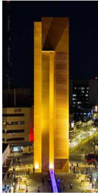
La transmisión comenzará a las 17:00 horas. ESPECIAL

John Ryder es el rival que enfrentará al Canelo ante 50 mil personas en el Estadio Akron, pero priorizando que todos los tapatíos tengan la oportunidad de disfrutar del evento, el go-