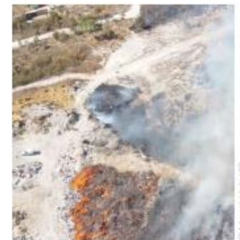
El fuego se activó en tres puntos diferentes.

tratando un incendio en tres puntos diferentes que lógicamente esto es provocado para causar un menoscabo a nuestro gobierno municipal, pero no vamos a permitir, por lo que estamos trabajando junto con las dependencias involucradas, Protección Civil, seguridad pública y servicios públicos, estamos trabajando de manera muy intensa para controlar esta situación grave que está sucediendo en el vertedero", dijo el primer edil de Tala.