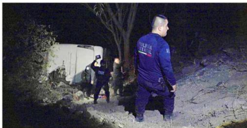
■ El percance vial ocurrió la noche del 29 de abril.

bos resultaron heridos y el menor fue intervenido quirúrgicamente tras ser trasladado a Guadalajara.