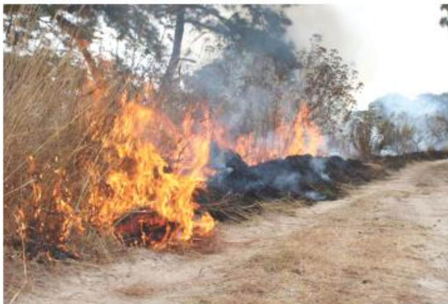
Se darán avisos municipales sobre el uso del fuego en terrenos cuando se puedan realizar.

Señala el Gobierno que algunas alternativas al uso del fuego que son promovidas por la Secretaría de Medio Ambiente y Desarrollo Territorial (Semadet) y las Juntas Intermunicipales de Medio Ambiente (JIMA) son: