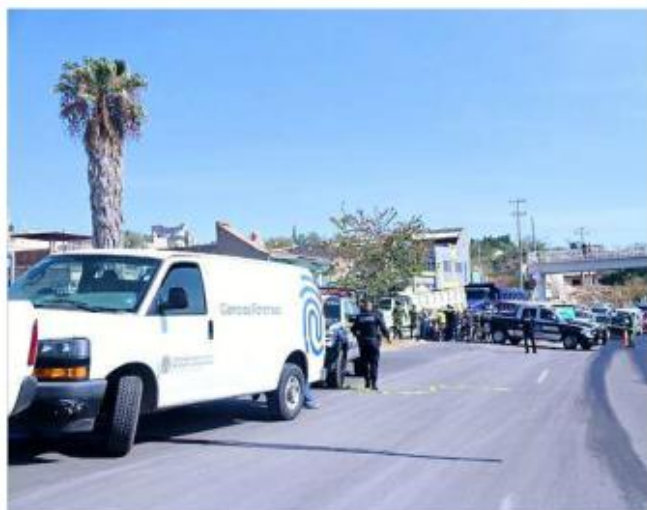
■ En la vía a Saltillo hallaron a un joven acuchillado.