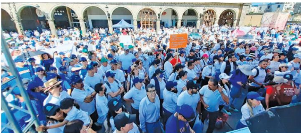
En el DIF Guadalajara y DIF Jalisco se debe dar también una homologación salarial.