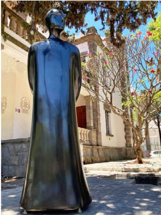
Invitan a disfrutar la ruta escultórica. ESPECIAL

Durante un mes se podrá disfrutar de "Música en Iglesias", una serie de presentaciones de cámara que se darán cita en templos y parroquias de toda la región; exposición "Jalisco Tradicional y Contemporáneo", una