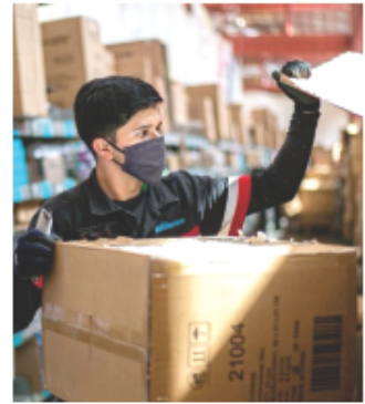
Las actividades primarias en el Estado tuvieron un crecimiento del 5.9 por ciento.

Este estudio también revela que Jalisco mantiene un crecimiento sostenido de cartera vencida en el Infonavit con el 13.2 por ciento, aunque por debajo de la media nacional que es del 14 por ciento.