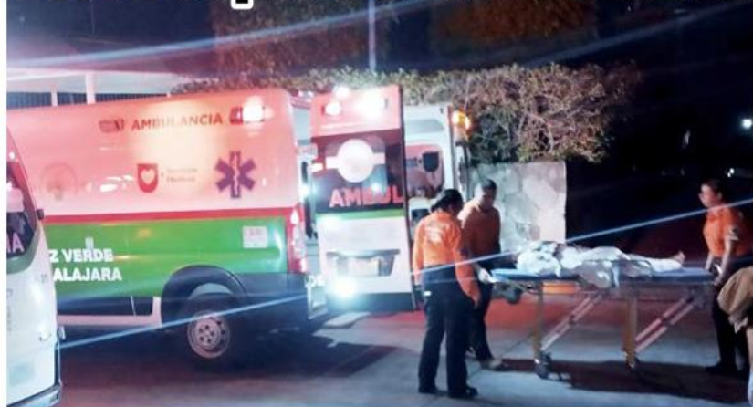
Dos pacientes fueron trasladadas en ambulancias terrestres.

Los trayectos aéreos del fin de semana se hicieron en la UTIM área del SAMU, en una aeronave de la Secretaría de Seguridad Jalisco y otra de la Comisaría de Guadalajara, mientras que los despegues y aterrizajes se hicieron desde el helipuerto de Zapopan.