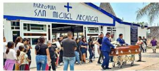
Familias comenzaron a despedir a víctimas del "camionazo".

Apenas el lunes se logró sofocar otro incendio severo en Tapalpa, a sólo unos kilómetros de donde inició este último, y al cierre de la edición se habían realizado ocho en Jalisco.