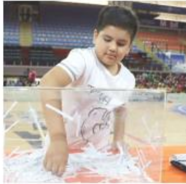
La tómbola se realizó en la Arena Astros ante alumnas y alumnos de Academias Deportivas.