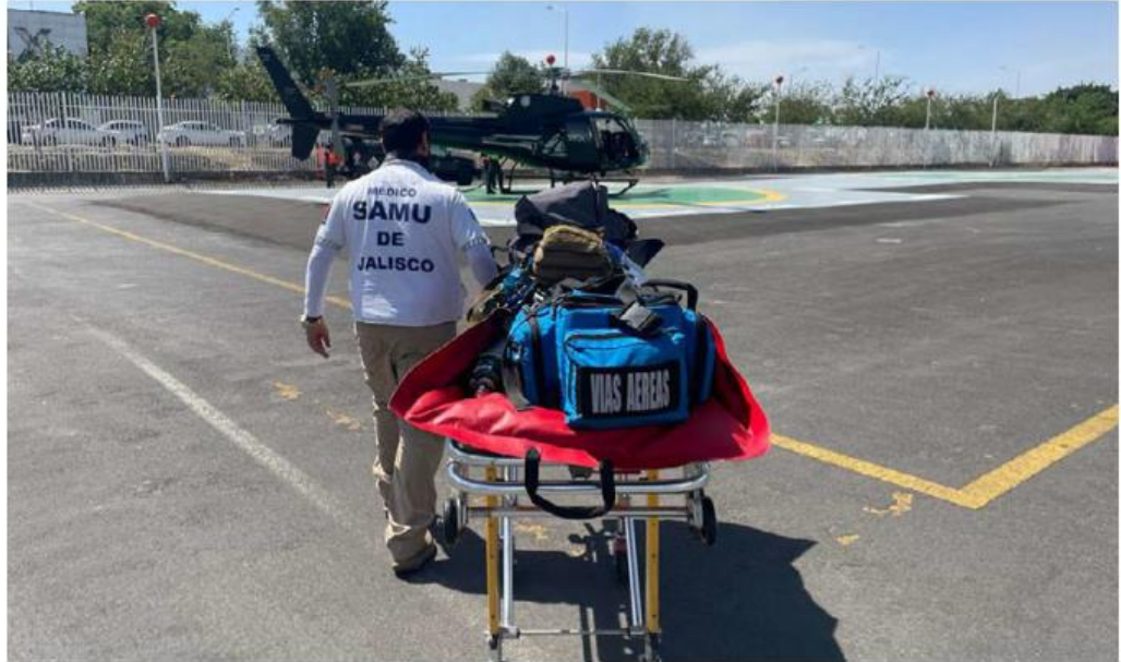
Este lunes fueron trasladados cuatro pacientes más a la metrópoli. ESPECIAL

Del total de heridos, diez se consideran urgencias absolutas, es decir, graves, quienes ya se encuentran en hospitales de segundo y tercer nivel de la metrópoli; 19 son urgencias relativas y ocho asis-