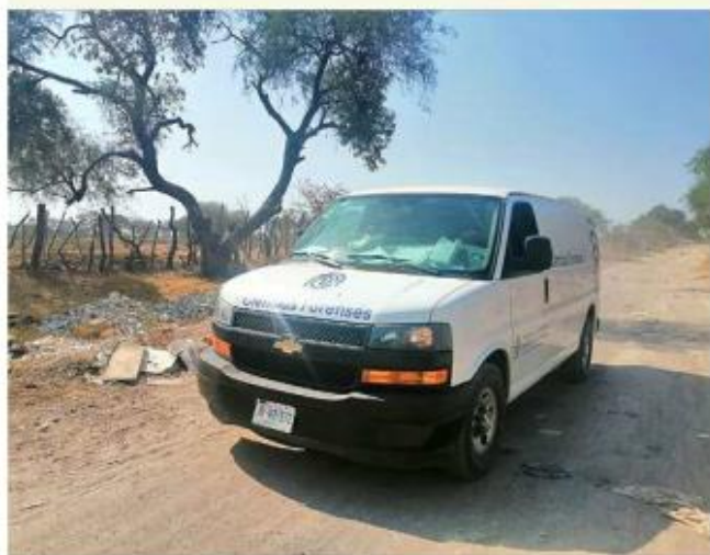
■ A la víctima de Tlajomulco la golpearon.