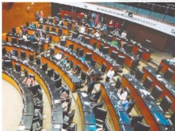
Pleno del Senado de la República