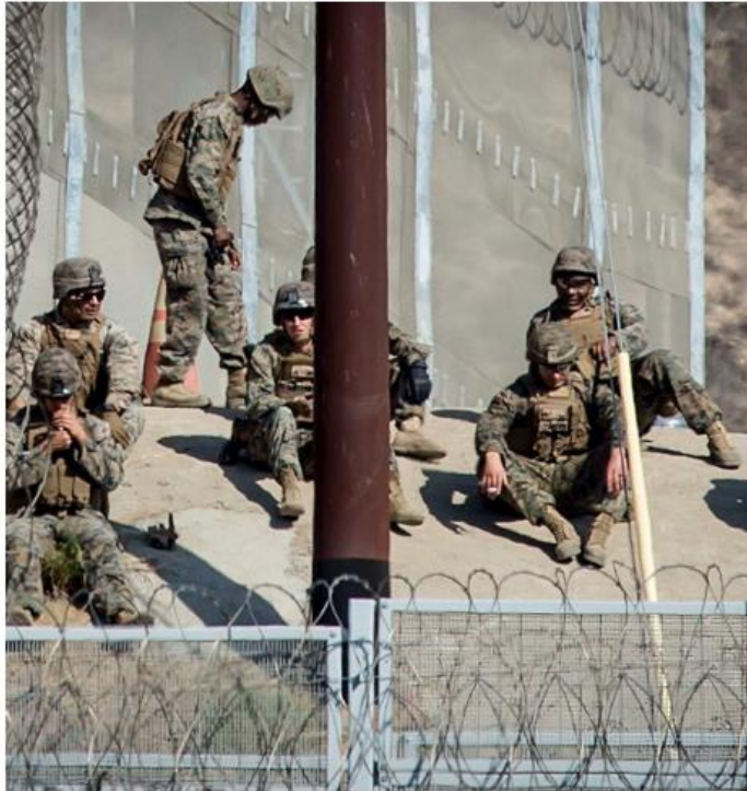
Mil 500 soldados estadounidenses reforzarán la frontera con México.

El mandatario aseguró que su Gobierno también enviará a 1.000 jueces especializados en asilo para acelerar los procesamientos de las personas que llegan