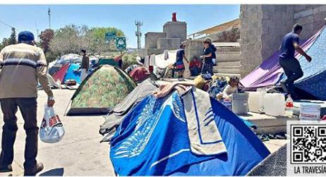
En Ciudad Juárez, un campamento de venezolanos fue instalado frente al INM.

El flujo de venezolanos se había ralentizado en el último trimestre de 2022, luego de que EU anunciara, el 12 de octubre, un nuevo procedimiento de admisión pa-