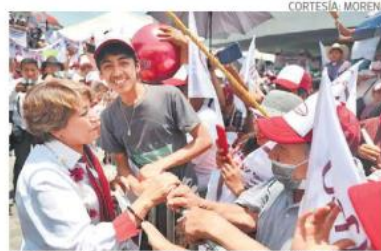
Llamó a simpatizantes cuidar el voto el 4 de junio

puntos de ventaja sobre la abanderada de la alianza opositora, pero recomendó a sus seguidores no confiarse.