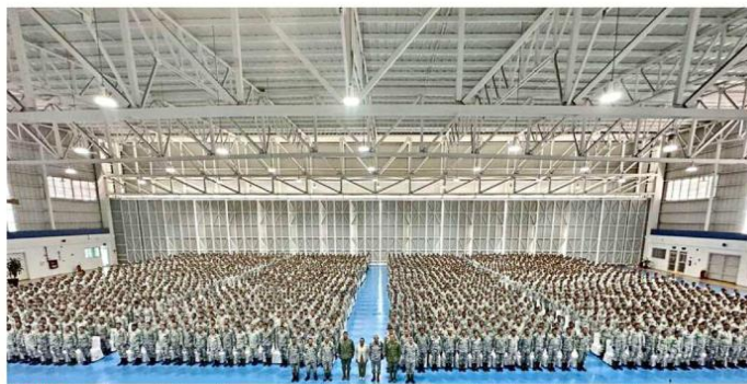
FIRMES. Cupo lleno registró la reunión que se efectuó el 28 de abril en el cuartel de la Guardia Nacional de Nuevo León.

Visita gabinete de seguridad cuarteles, tras revés de Corte