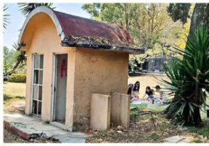
Pese a los malos olores y abandono, algunos hacen pícnicos.

La desatención de esta infraestructura que alguna vez fue comercial, es todavía más notoria, pues está en el perímetro de museos, justo en la entrada donde en 2011