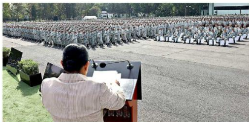
La Secretaría de Seguridad y Protección Ciudadana, Rosa Icela Rodríguez, frente a 12 mil 600 elementos de la Guardia Nacional, en el inicio de la 'gira del convencimiento'.

Para el miércoles 3 de mayo se completó la gira "informativa" ordenada por el Presidente en las 11 entidades restantes: Veracruz, Tlaxcala, Aguascalientes, Jalisco, Colima, Nayarit, Zacate-