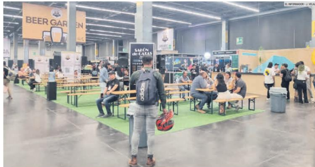
EVENTO. Los cerveceros buscan que se reduzca el pago del IEPS de su producto a cinco por ciento.

Atoran iniciativa en el Congreso para bajar el Impuesto Especial sobre Producción y Servicios