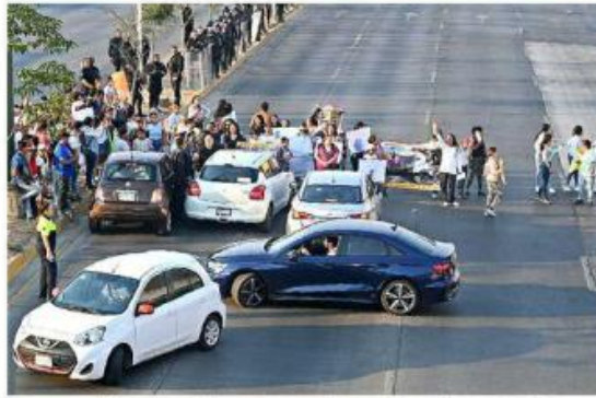
Los manifestantes bloquearon el paso en ambos sentidos.