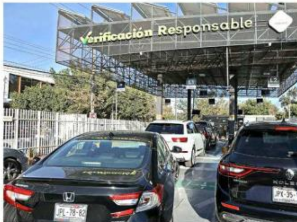
■ El 32 por ciento del trámite de verificación supuestamente se destina al Fondo Ambiental Jalisco.

el porcentaje correspondiente a los casi 472 millones de pesos obtenidos por el programa.