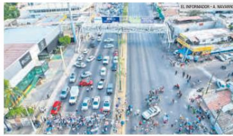
DESESPERADOS. Familiares de desaparecidos critican el trabajo de la Fiscalía. Por eso bloquearon ayer López Mateos, en el cruce de la calle de Santa Ana.

Familiares y amigos de desaparecidos de las zonas de Santa Ana Tepetitlán y Miramar se reunieron en la plaza principal del primer poblado para hacer una protesta "por el poco apoyo" que reciben de la Fiscalía de Jalisco para resolver los casos. Luego avanzaron por la calle de Santa Ana hasta el cruce con López Mateos, donde bloquearon esta vialidad durante la tarde de ayer. Fue a las 19:00 horas cuando el contingente se disolvió de forma voluntaria.