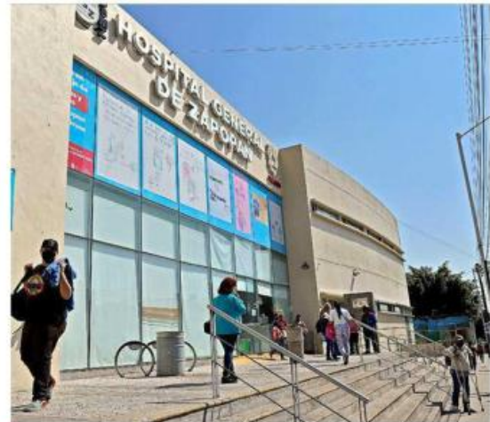
Lo recaudado ayudará a pacientes de instituciones como el Hospital General de Zapopan para que adquieran una prótesis.

Para inscribirse al evento puede comunicarse al teléfono 333-412-0193 o un inbox a la fan page de Facebook "Patronato de Salud Zapopan".