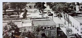
Imagen antigua de Colotlán, municipio del Norte de Jalisco.

chuzas que vigilaban la ciudad desde la torre de la Parroquia de San Juan Bautista. Incluso hay fábulas que cuentan sobre una pareja de brujos muy pobres que, a veces, transformaban al marido en gajolote para que la mujer vendiera a las personas del pueblo y que él, por las noches, se transformara para regresar a casa sin un resguño.