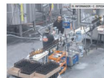
ÚNICA. "Elaboramos cerveza con pasión, noción y respeto", señalan orgullosos en Cerveza Fortuna.

Cerveza Fortuna nació en el 2014 en Zapopan, con el objetivo de elaborar una cerveza de calidad, aroma y sabor que no se había ofrecido en el mercado.