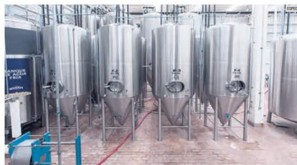
EJEMPLO. La Cervecería Minerva inició operaciones en 2004 y ahora busca trascender en Estados Unidos.

La Cervecería Minerva cuenta con cinco marcas de linternas y recientemente acaba de lanzar la lager light en lata.