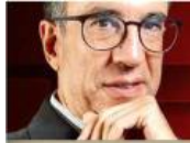
CARLOS ELIZONDO MAYER-SERRA @carloselizondom

AMLO prometió hacer de la elección del 2024 un plebiscito constitucional. La división de poderes estará en juego.