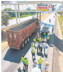
ZONA DE CONFLICTO. Los manifestantes piden agentes viales y obras en la zona para reducir los accidentes y el caos en horas pico.

"En concreto, pedimos apoyo de la Policía Vial durante todo el día, que se habiliten calles (como Jilgueros, Ocampo y todas las alejadas). Solicitamos una veda en las construcciones de fraccionamientos y naves industriales hasta que esto se resuelva".