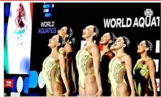
Las mexicanas triunfaron en la Copa Mundial de Egipto.