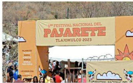
■ El primer Festival Nacional del Pajarete congregó a cuatro mil personas, de acuerdo con Protección Civil.

“Vamos a empujar en serio el desarrollo agropecuario, vamos a apoyar a los ganaderos, porque Movimiento Ciudadano el próximo año