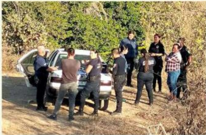
■ Un hombre fue atacado a tiros en Puerto Vallarta.

Las víctimas quedaron en un domicilio de la Calle Venustiano Carranza, casi