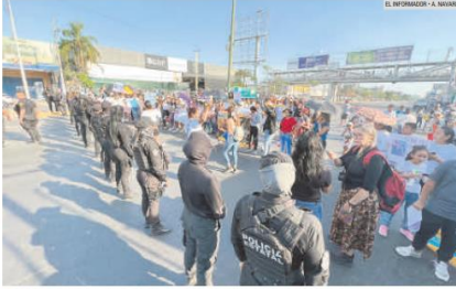
BLOQUEO. Familiares de desaparecidos, junto con vecinos de Santa Ana Tepetitlán, tomaron las calles.