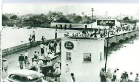
Puente que cruza el Río Ameca, en Ameca, Jalisco.

único requisito era taparles los ojos para llevarlos a la fiesta con el fin de que no supieran cómo llegar al sitio. Cuando arribaron al salón elegante, donde sería la tocada, reconocieron a algunos de las personas que estaban allí bailando en personas que habían muerto, pero que en vida se dedicaban a labores ilícitas. Sin hacer muchas preguntas al final les pagaron con monedas de oro, pero los abandonaron a su suerte en plena noche para que caminaran hasta el pueblo. Amaneció y cuando menos se dieron cuenta sintieron las bolsas de sus pagos más ligeras para darse cuenta que estaban llenas de abroces, sapos, víboras y arañas por lo que dejaron que habían tocado en el infierno y regresaron muy asustados a retar a sus casas.