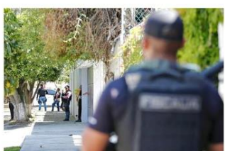
La Fiscalía cateó una finca en la Colonia La Estancia y otro domicilio en Jardines Vallarta.