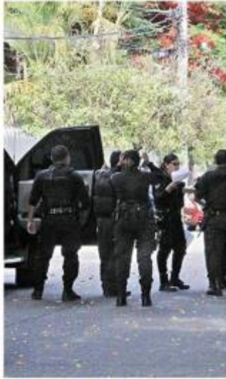
El sujeto fue abatido en Jardines del Bosque.