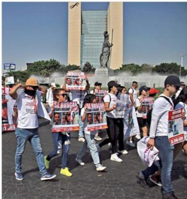
Decenas de personas marcharon ayer, por segunda vez en la semana, hacia Casa Jalisco.