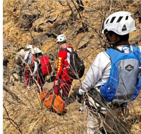
■ Bomberos tapatíos encontraron el cadáver de un hombre.

La Cruz Roja pidió a la ciudadanía llamar al 333-502-5492, en caso de tener datos que ayuden a la localización del voluntario.