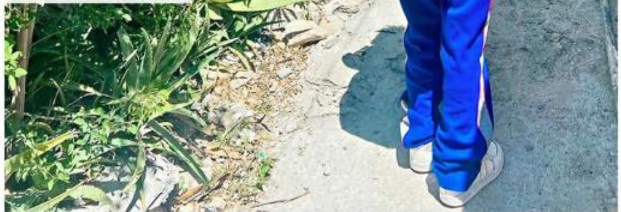
■ Los adolescentes trans han enfrentado discriminación en escuelas.

■ Cuando un estudiante dice ‘soy trans y quiero ser nombrado así’, las escuelas pueden entrar en conflicto por diferentes razones, sus uniformes, el baño, el control administrativo”.