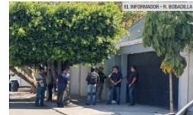
BÚSQUEDA. La Fiscalía realizó ayer el cateo a un segundo inmueble relacionado al call center.