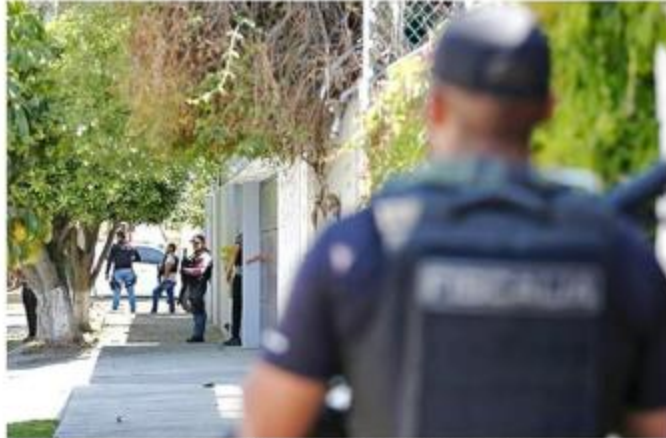
La Fiscalía cateó una finca en la Colonia La Estancia y otro domicilio en Jardines Vallarta.

El Fiscal explicó que llegaron a este domicilio gracias a la denuncia de desaparición por la sexta joven ausente,