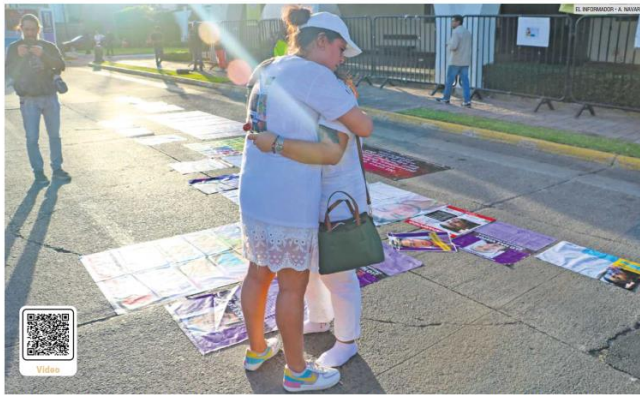
DOLOR. Familiares de los ocho desaparecidos del call center se manifestaron ayer frente a Casa Jalisco, en espera de recibir una respuesta que todavía no llega.

Señalan que desde hace tiempo se había alertado sobre la red del CNG que estafaba a extranjeros