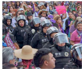
BARRERA NEGRA La tensión surge cuando se cruzan dos grupos de mujeres que representan dos realidades distintas: uno luchando contra el sistema y el otro intentando hacerlo cumplir.