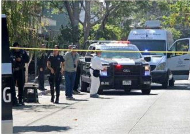
Uno de los homicidios ocurrió en Jardines de San Francisco.