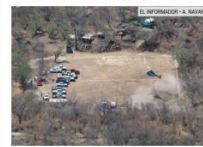
ÁEREO. El helicóptero Zec ha sido fundamental en el operativo en el Mirador Escondido.