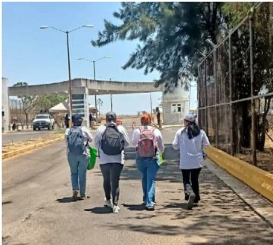
Exigen la liberación de las dos mujeres. ESPECIAL

“En el momento en que ellas se dan la espalda, porque hay un video donde ella se da la espalda para ya irse, la agarran (los policías) por la espalda y las empiezan a amagar, y entonces es como eso no está bien, a una de nuestras compañeras le sembraron una navaja que ella no traía y no