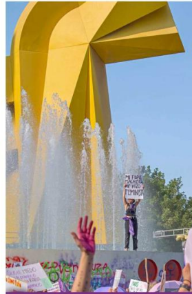
LA MANO DE LA ESPERANZA A la distancia, una mujer sostiene un cartel con el mensaje: "Mi padre machista me hizo feminista", mientras una mano pintada de rosa se alza en el aire. Es claro el contraste entre el mensaje de protesta de la mujer y la mano pintada de rosa, sugiriendo una conexión entre ambos y expresando la diversidad de las voces presentes en la marcha. Resalta la importancia de la unión en la lucha por la igualdad de género.