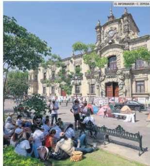
CENTRO TAPATIO. Miembros del colectivo Luz de Esperanza se manifiestan afuera del Palacio de Gobierno, en donde anunciaron un plantón hasta que las autoridades atiendan sus peticiones.