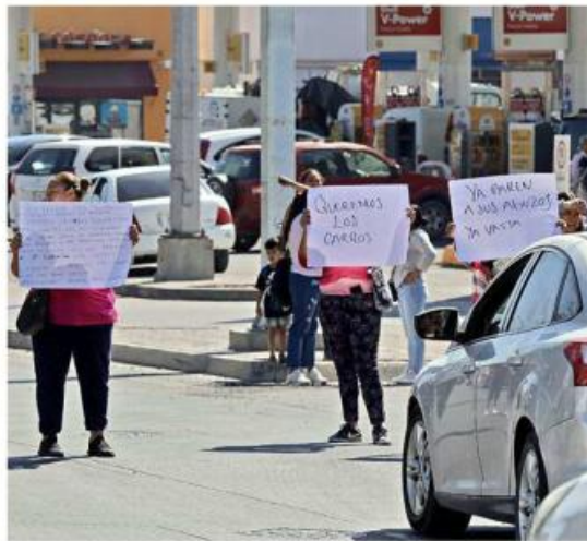
Las manifestantes cerraron Periférico durante cinco minutos, luego se instalaron en la lateral.

Las trabajadoras prevén organizar más bloqueos en Periférico la próxima semana.