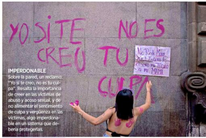
IMPERDONABLE Sobre la pared, un reclamo: "yo si te creo, no es tu culpa". Resalta la importancia de creer en las víctimas de abuso y acoso sexual, y de no alimentar el sentimiento de culpa y vergüenza en las víctimas, algo imperdonable en un sistema que debería protegerlas.