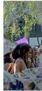
CRISTALES ROTOS, ESPERANZA INTACTA A través de un vidrio roto, dos mujeres sonríen durante la manifestación feminista del 8 de marzo de la Ciudad de México. El vidrio capta la tensión y la violencia, mientras que la sonrisa de las mujeres transmite una sensación de esperanza y resistencia.