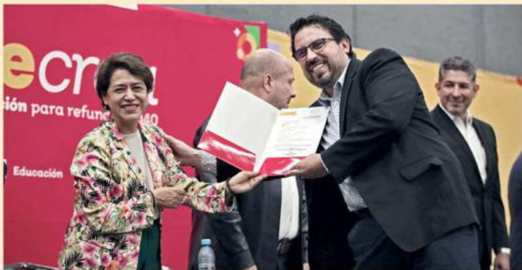
Los docentes participaron por admisión, horas adicionales y promoción vertical.

Sin embargo, MURAL ha documentado que algu-