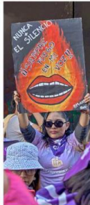
EL FUEGO DE LA LUCHA Enérgica e icónica: "Nunca más silencio. Siempre fuego en mi voz". Un deseo para que nunca más se ignore la voz de las mujeres y que siempre exista la fuerza para luchar por los derechos y la igualdad de género.