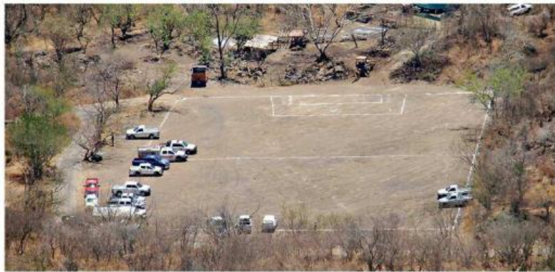
Más de 100 agentes participan en recorridos y en la recuperación de restos humanos.

La Fiscalía espera que el Instituto Jalisciense de Ciencias Forenses concluya los