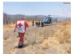
COLABORACIÓN. Los labores para recuperar el cuerpo requirieron del apoyo de un helicóptero.

Uno salió esa misma noche y el otro hasta la mañana del jueves. También se tuvo que usar un helicóptero para sacarlos del terreno en el que estaban.