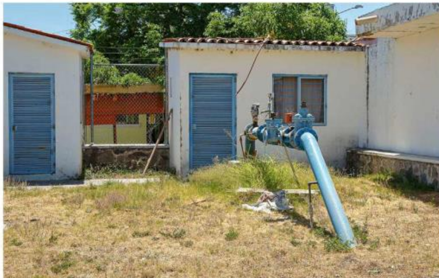
Los pozos profundos surten agua que no cumple con las normas de calidad.