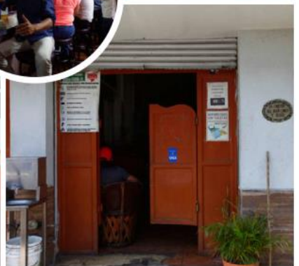
El lugar es conocido por su peculiar decoración. FERNANDO CARRANZA

para hacer más atractivo al lugar; también cambió la política de las mujeres y entonces llegaron las zapatillas, trofeos, fotos y... tangas.