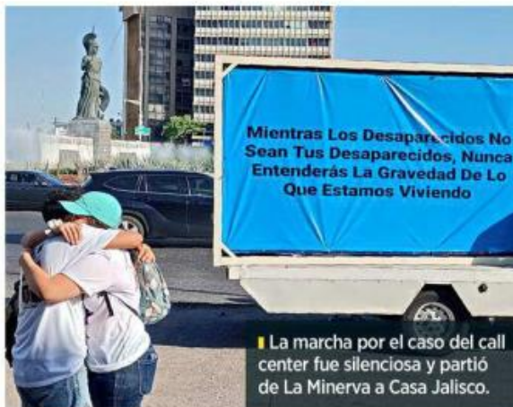
La marcha por el caso del call center fue silenciosa y partió de La Minerva a Casa Jalisco.

Durante el recorrido no se hizo el acostumbrado pase de lista, al que se han ido