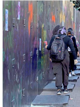
MURALLAS DE METAL El grupo feminista "Bloque Negro" avanza por la calle. A su izquierda, una imponente muralla metálica que rodea a los edificios y comercios para protegerlos durante la marcha. Las mujeres portan herramientas con las que golpean con fuerza la pared metálica en un acto de resistencia y rechazo al sistema opresor.