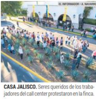
CASA JALISCO. Seres queridos de los trabajadores del call center protestaron en la finca.