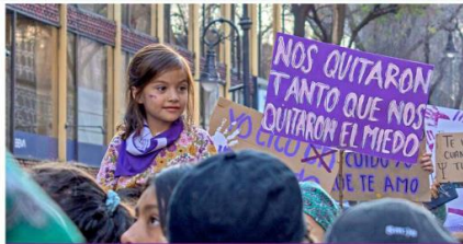
EL FUTURO ES FEMINISTA "Nos quitaron tanto que nos quitaron el miedo", una frase que describe el coraje y la determinación de las mujeres, incluyendo a las más jóvenes, que salen a las calles para luchar por un futuro más justo y seguro.