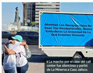
La marcha por el caso del call center fue silenciosa y partió de La Minerva a Casa Jalisco.

Durante el recorrido no se hizo el acostumbrado pase de lista, al que se han ido