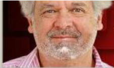
JUAN ENRÍQUEZ CABOT

A diario sufrimos una narrativa violenta. Dejemos de consumir veneno. Busquemos un liderazgo que sepa que sí se puede y no es inevitable el colapso.