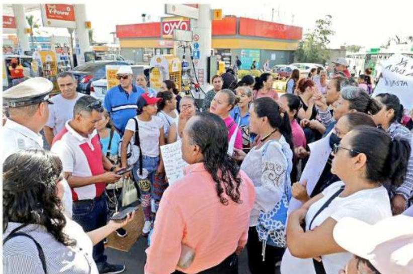
Las empleadas domésticas señalaron que el transporte oficial es insuficiente para sus necesidades.

"El camión llega en la mañana, a las 9:00, a veces a la 10:00; a veces no llegan y no hacen su recorrido completo, llegan a (Avenida) Juan