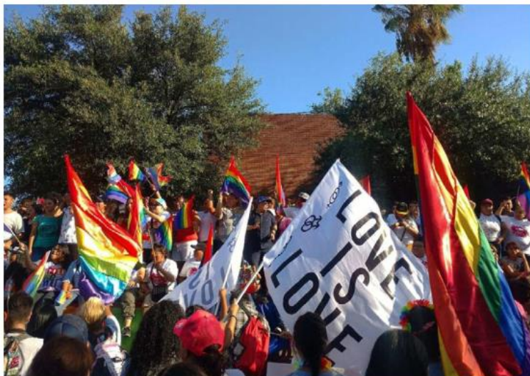
Este año esperan a miles de asistentes en la marcha del orgullo. ESPECIAL