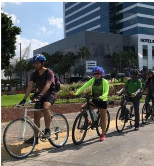
El uso de la bicicleta es cada vez más común en GDL.

Actualmente se interviene el tramo de la Calzada y Belisario Domínguez, con renovación de todas las banquetas, iluminación con sentido peatonal mobiliario, cru-