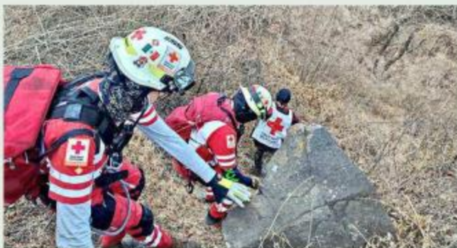
La búsqueda del voluntario comenzó el 21 de mayo.

El hombre estaba desaparecido desde el 21 de mayo. Ese día acudió a ejercitarse a la barranca y alrededor de las 11:00 horas se comunicó con su familia para avisarles que reser-