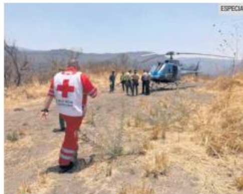
COLABORACIÓN. Las labores para recuperar el cuerpo requirieron del apoyo de un helicóptero.

Uno salió esa misma noche y el otro hasta la mañana del jueves. También se tuvo que usar un helicóptero para sacarlos del terreno en el que estaban.