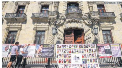
SON DEMASIADOS. No sólo son los ocho del call center, ayer colectivos de personas desaparecidas como Luz de Esperanza también levantaron su voz, para pedir la atención del Gobierno del Estado.

“Al menos encontraron los cuerpos. Porque pasa el tiempo y no sabemos nada. Falta que se confirme que son ellos, y por otro lado es triste porque había esperanza que estuvieran con vida”.