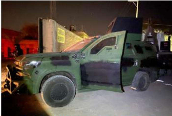
VIGILANCIA. La Secretaría de Seguridad del Estado localizaron y aseguraron un vehículo con blindaje artesanal, así como dos armas de fuego y enervantes, en el municipio de Teocaltiche.