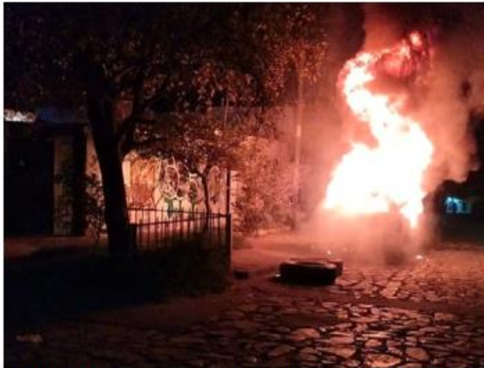
VANDALISMO. Durante la madrugada de este viernes un sujeto incendió una camioneta particular en Lomas del Paraíso en Guadalajara. El sujeto huyó del lugar con rumbo desconocido