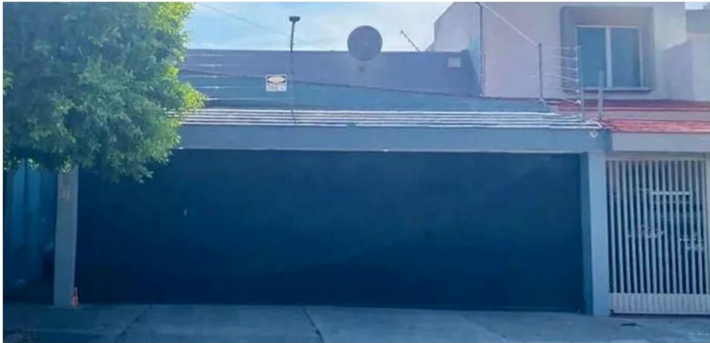
Uno de los domicilios donde trabajaban los jóvenes hoy desaparecidos; el lugar se ubica en Zapopan.