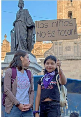
LA SONRISA DE LA RESISTENCIA Un mensaje fuerte y claro: "Las niñas no se tocan". Transmite una sensación de inocencia y esperanza por un futuro más seguro para las niñas y las mujeres.