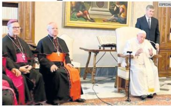
ENCUENTRO. El cardenal (a un costado del Papa) compartió fotos de la reunión.

"Tuvimos el gozo de que el Santo Padre Francisco nos diera su consejo y orientación para la tarea pastoral en nuestras diócesis. Antes habíamos tenido un encuentro con el personal de la Sección para las Relaciones con los Estados y las Organizaciones Internacionales, de la Secretaría de Estado de Ciudad del Vaticano".