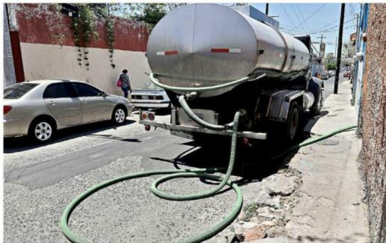
Los colonos han solicitado pipas para hacer frente al problema.

Carecen aún del servicio algunos vecinos