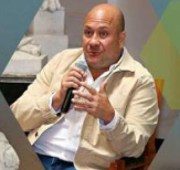
El Gobernador Enrique Alfaro dio todo su apoyo.