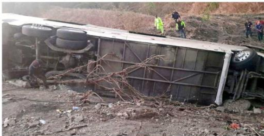
El accidente ocurrió en la Carretera federal 200, a la altura de Las Piedras, en Compostela.

el yeso por la fractura de la muñeca, mi niña, gracias a Dios, ella está mejor, ella solamente tuvo raspones.