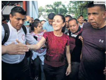
ASPIRACIÓN. Claudia Sheinbaum, jefa de Gobierno de la CDMX, esperará al Consejo Nacional de Morena para definir si deja el cargo a partir del lunes.

“Le mandé un mensaje ayer, preguntándole cómo va a estar. Y si vamos a participar”, destacó.