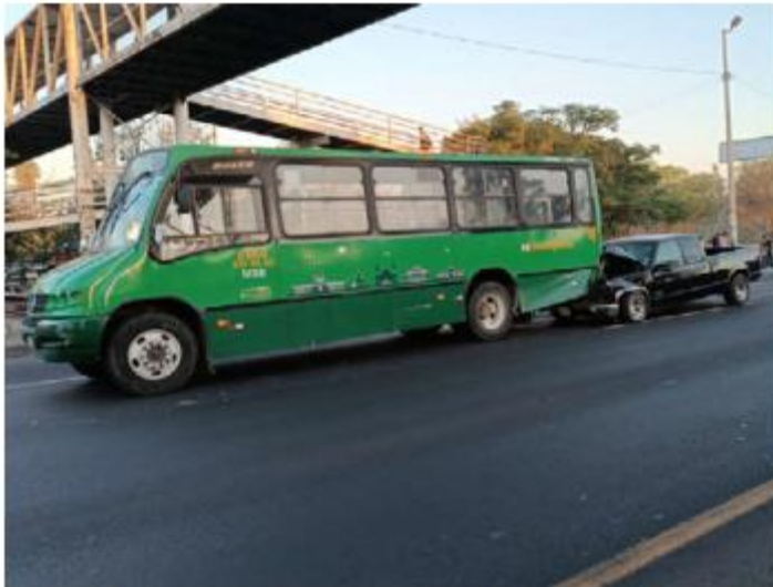
CHOQUE. Una camioneta se estrelló en la parte trasera de un camión del transporte público sobre Carretera Chapala, en el municipio de Tlaquepaque. Por este hecho no hubo heridos.