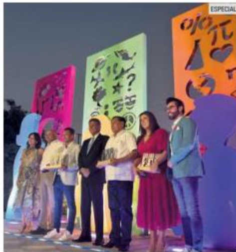
HOMENAJE. La escultura "La Maestra" está ubicada en el Parque de las Niñas y los Niños.