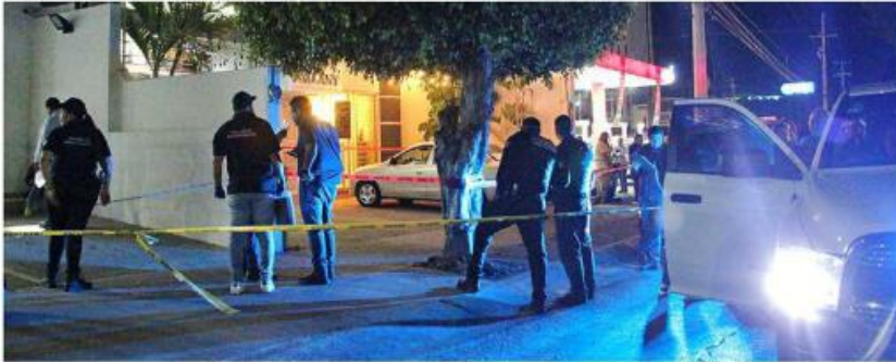
■ Un sujeto vestido de negro disparó a la víctima en la cafetería ubicada en Av. Rafael Sanzio.

De forma extraoficial, la víctima fue identificada