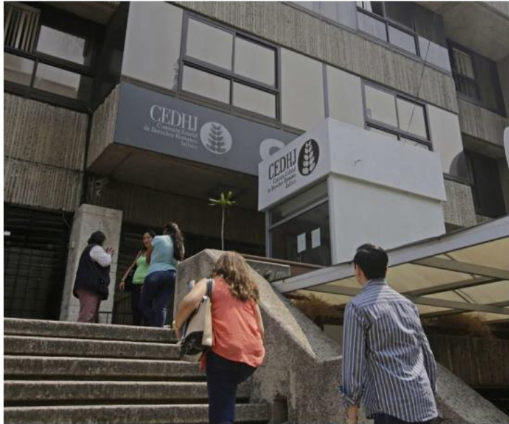
Las quejas han sido interpuestas ante la CEDHJ.