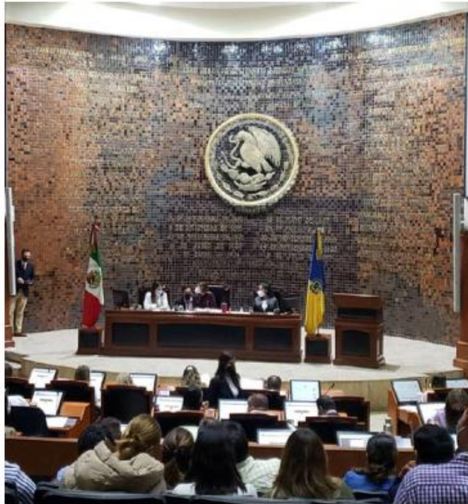
Mercado participará en las mesas de trabajo. R.HURTADO

El secretario del Sindicato independiente indicó que ya están preparados para participar en las mesas de trabajo para analizar la reducción de la nómina.