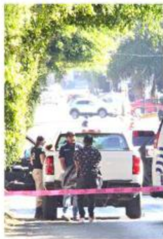
■ Un conductor fue asesinado en El Álamo.