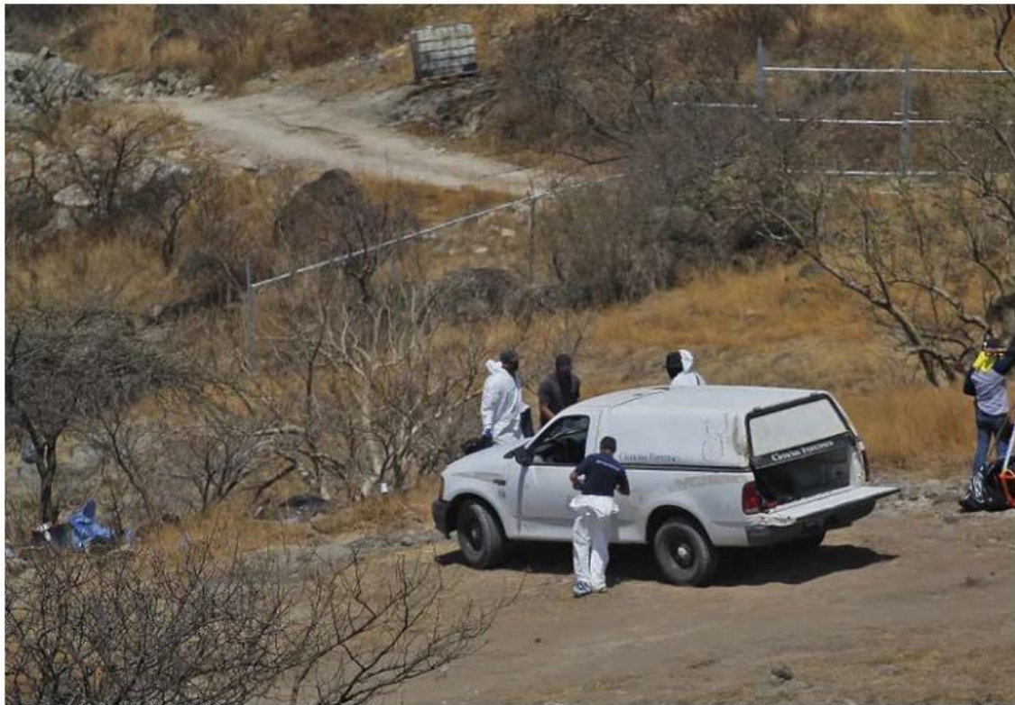
Los cuerpos fueron localizados en la zona de Tempisque, en Zapopan.

Las ocho personas desaparecieron entre el 20 y 26 de mayo, el 31 de ese mes iniciaron trabajos para rescatar 45 bolsas con restos humanos en la barranca de la colonia Mirador Escondido y el 6 de junio la Fiscalía del Estado confirmó que los cuer-