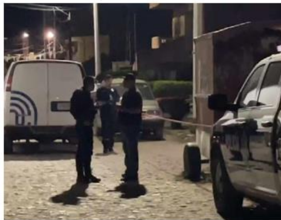
Ambos cuerpos fueron llevados a la morgue. ESPECIAL

Bomberos de Tlajomulco rescataron de una casa abandonada en llamas, en el fraccionamiento Quintas del Valle, a un hombre que fue abandonado a su voluntad, atado y con varias huellas de violencia. De acuerdo con la Policía Municipal el hombre fue arrojado al lugar por varios sujetos.