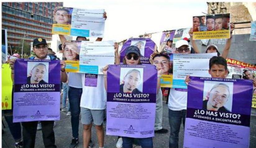
■ Jalisco es la Entidad que registra más casos de desaparecidos a nivel nacional.

Aseguró que Jalisco tiene un padrón actualizado, “totalmente revisado, totalmente veraz y el día que nos citen para poder exponerles los datos, como lo hemos solicitado desde hace mucho, estaremos listos”.