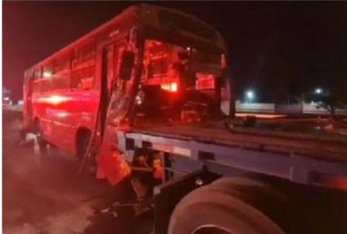
COLISIÓN. Diecinueve personas lesionadas fue el saldo que dejó el choque entre una unidad de transporte de personal y un tráiler a la altura del poblado de San Agustín, en Tlajomulco.