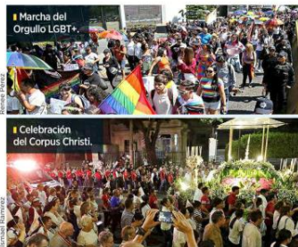
Marcha del Orgullo LGBTQ+.