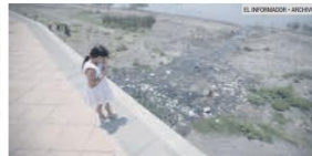
ALABAJA. El Lago de Chapala está lejos del nivel óptimo de su capacidad.

La Presa Calderón registraba agua al 65.4% de su ca-