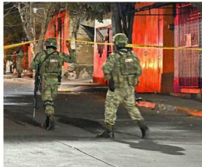
La víctima de la Colonia Nueva España recibió tres disparos.