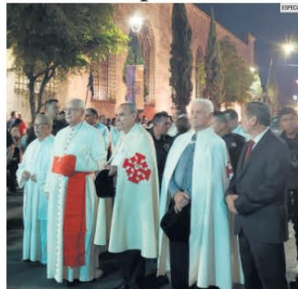
CELEBRACIÓN. El cardenal Francisco Robles Ortega encabezó anoche el Corpus Christi ante los feligreses.

ta de la Iglesia católica para celebrar la Eucaristía. El propósito es proclamar y aumentar la fe de los