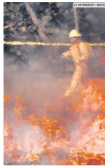
ARDE. La temperatura sube como los incendios.

Especialistas del Instituto de Astronomía y Meteorología de la Universidad de Guadalajara (UdeG) estimaron un déficit de precipitaciones en junio, debido a la presencia del fenómeno El Niño, que provocará que este año se registre un temporal irregular de lluvias; sin embargo, se prevé que las precipitaciones se regularicen a mediados del mismo mes.