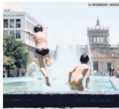
SE REFRESCAN. Es común ver a niños disfrutar de las fuentes del Centro.

Como resultado del consenso se trazan polígonos para cada intensidad de sequía y cuando los polígonos corresponden al análisis de métodos, utilizamos los días 15 de cada mes se utilizan para cuantificar la sequía sobre el territorio nacional y cuando corresponden a la evaluación final de cualquier mes complementa además al mapa regional.