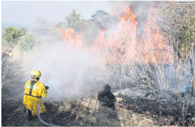
IMPARABLES. Los incendios forestales en Jalisco se han convertido en un problema que crece cada año.

Jalisco sufre 972 eventos entre enero y junio, que sobrepasan los 940 documentados en todo 2022