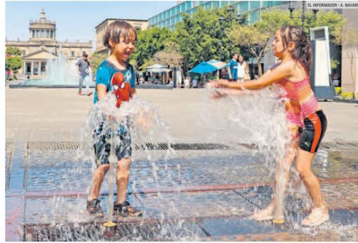
ALERTA. Se prevé que aumente la temperatura en estos días. Los niños se refrescan en las fuentes del Centro tapatío.