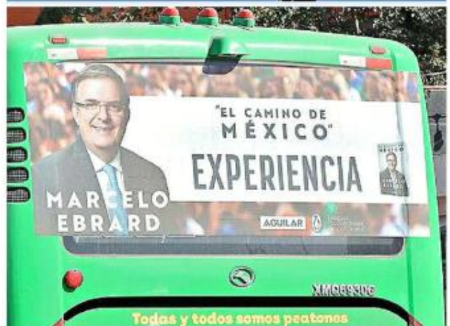
Algunos consejeros de Jalisco se han manifestado a favor de Sheinbaum o Ebrard.