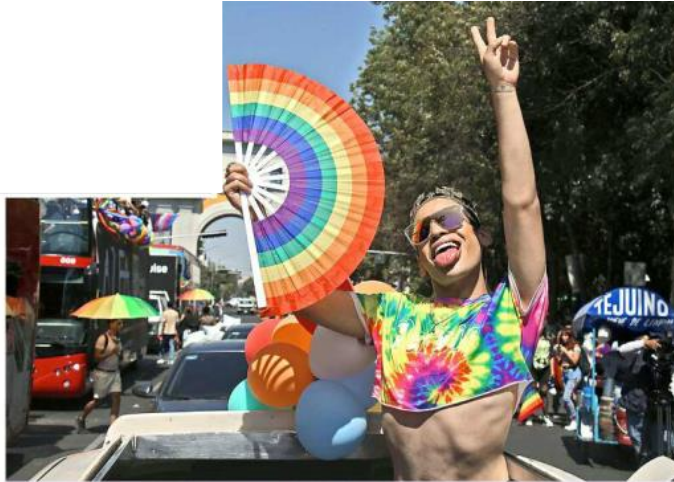
El recorrido se realizó de La Minerva a la Glorieta de las y los desaparecidos.