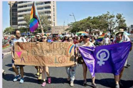
Durante la movilización, mostraron también solidaridad con familiares de personas desaparecidas.