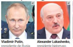
Vladimir Putin, presidente de Rusia. Alexander Lukashenko, presidente bielorruso. Yevgeny Prigozhin, líder del grupo Wagner.

Luego de pactar una amnistía, el líder del grupo paramilitar Wagner, Yevgeny Prigozhin, ordenó a sus tropas que avanzaban hacia Moscú regresar a sus campamentos. Lo anterior tras la mediación del Presidente bielorruso, Alexander Lukashenko, confirmó el vocero de la Presidencia rusa, Dmitry Peskov.