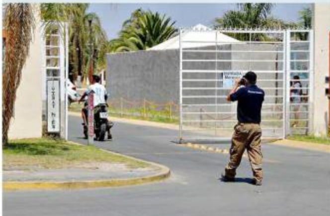
El accidente ocurrió en el Fraccionamiento Real del Sol.

Se trató de un motociclista que sufrió un derrape en la Avenida Ávila Camacho, cerca de la Avenida La Presa. Su pareja iba con él y resultó lesionada de gravedad.