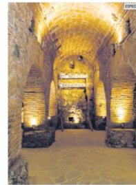
EXPLORAR. Para conocer los Arcos Hundidos del Centro Cultural El Refugio se pueden programar visitas guiadas.