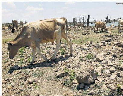
RIESGO. La falta de agua afecta a la ganadería y agricultura. Esto ocasionará altos precios en los productos del campo.

Afectaciones en municipios del Estado 56 CON SEQUÍA "EXTREMA" Hay pérdidas en cultivos y pastos, el riesgo de incendios forestales es extremo y hay restricciones en el uso del agua. 68 CON SEQUÍA "SEVERA" Hay probables pérdidas en cultivos o pastos, y alto riesgo de incendios. Se debe restringir el consumo del agua. 1 CON SEQUÍA "MODERADA" Hay algunos daños en cultivos y pastos. Hay bajos niveles en ríos y presas. Se sugiere la restricción voluntaria en el uso del agua.