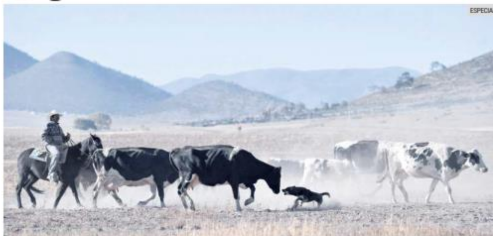
EN PELIGRO. En Jalisco existen alrededor de 80 mil ganaderos, que se encuentran distribuidos en todas las regiones del Estado.

El Consejo tiene un proyecto para impulsar en el Estado un programa de reconversión de cultivos más rentables como la chíá, mismo que incluye el acompañamiento y el financiamiento para los productores.