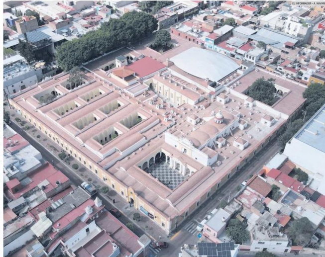
IMPRESIONANTE. Vista aérea del Centro Cultural El Refugio.