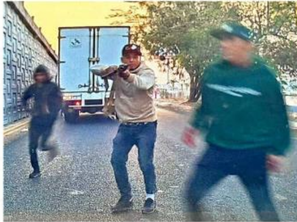
■ Sujetos armados robaron un vehículo de carga en Periférico Sur y privaron de la libertad a cuatro personas.

El robo con violencia del miércoles —el que fueron privados de la libertad un chofer, su acompañante y dos guardias de seguridad— se dio justo en la esquina de Periférico y Vía a Manzanillo, donde convergen La Llave, López Cotilla y Artesanos.