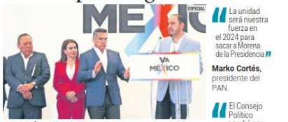
OPOSICIÓN. Líderes políticos preparan la estrategia para enfrentar a Morena en las elecciones de 2024.

Líderes del PAN, PRI y PRD anunciarán que avalaron ayer sus métodos internos para elegir a su candidato presidencial para el 2024 y se espera que mañana den a conocer oficialmente los procesos. El PAN aprobó que los interesados en registrarse como aspirantes tendrán que recabar y presentar al menos 150 mil firmas de apoyo. Tras ello, deberán participar en un sondeo de opinión para que sólo quede uno. Después se realizarán foros regionales y se hará un nuevo sondeo para concluir con una votación abierta a la ciudadanía. Por su parte, el PRI avaleó, durante su sesión del Consejo Político Nacional, que la elección de su aspirante sea a través de una consulta ciudadana. En tanto, el PRD también buscará a su candidato a través de una consulta ciudadana. Para ello, constituyó un Consejo Consultivo.