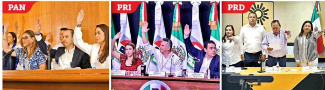
LUZ VERDE. Los órganos internos de los tres partidos aprobaron, por separado, el proceso para seleccionar a su candidato.

La Ley de Servicio de Protección de Jalisco permite proporcionar "guaruras" a funcionarios estatales y municipales, así como a ex servidores públicos y personas físicas o jurídicas, para lo cual debe haber un dictamen técnico y declaratoria de protección avalada por el Consejo Estatal de Seguridad.