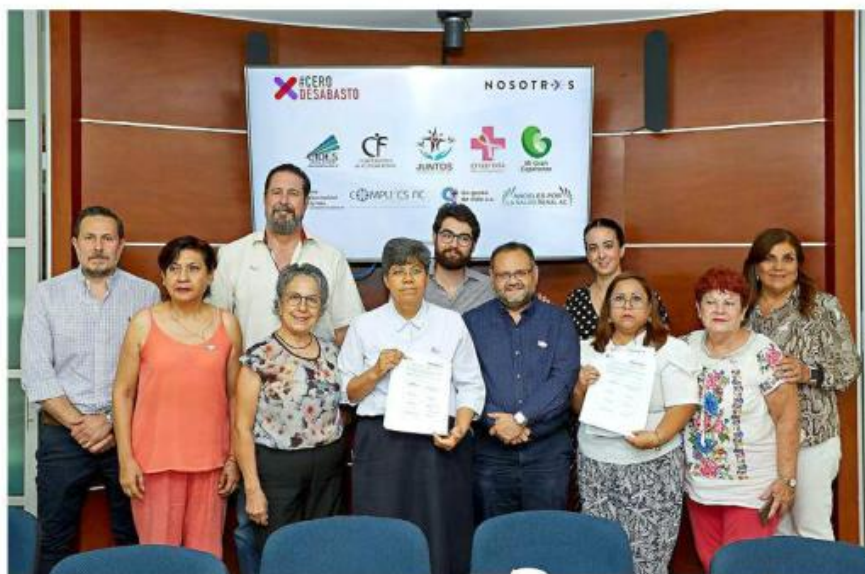
■ Agrupaciones locales firmaron el convenio de colaboración con la plataforma Cero Desabasto.

“La plataforma nos ayuda a identificar dónde hace falta un medicamento y qué medicamento hace falta. Esa