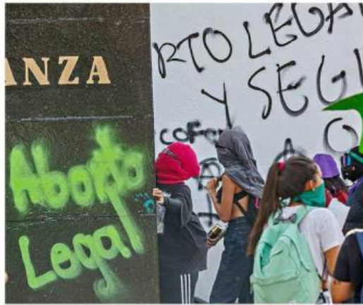
Continúa lucha para despenalizar el aborto.