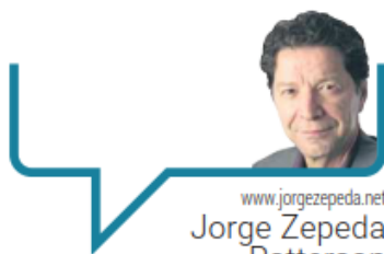
www.jorgezepeda.net Jorge Zepeda Patterson