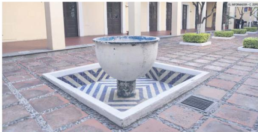
INTERIORES. Los patios de El Refugio guardan grandes historias.

En la capilla del centro hay una gran mural, una alegoría por la paz donde están plasmadas muchas de las cosas que le son importantes al pueblo de Tlaquepaque. "Este gran mural fue pintado por Guillermo Chávez Vega". Visitar El Refugio es gratis, no hay costo de entrada. Se puede acceder a él desde las 09:00 de la mañana hasta las 19:00 horas, también los fines de semana está abierto.