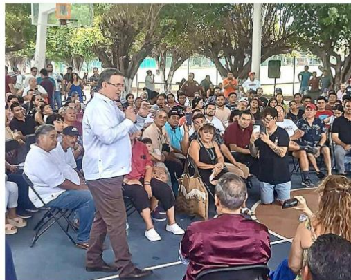
■ Marcelo Ebrard se reunió con jóvenes en la Unidad Deportiva Agustín Flores Contreras de Puerto Vallarta, Jalisco, para una conversación circular.