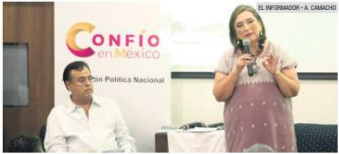
CANACD. Xóchitl Gálvez participó en la conferencia titulada "Derecho de Réplica". La acompañó Salvador Cosío.

Líderes del PAN, PRI y PRD anunciarán que avalaron ayer sus métodos internos para elegir a su candidato presidencial para el 2024 y se espera que mañana den a conocer oficialmente los procesos. El PAN aprobó que los interesados en registrarse como aspirantes tendrán que recabar y presentar al menos 150 mil firmas de apoyo. Tras ello, deberán participar en un sondeo de opinión para que sólo quede uno. Después se realizarán foros regionales y se hará un nuevo sondeo para concluir con una votación abierta a la ciudadanía. Por su parte, el PRI avaleó, durante su sesión del Consejo Político Nacional, que la elección de su aspirante sea a través de una consulta ciudadana. En tanto, el PRD también buscará a su candidato a través de una consulta ciudadana. Para ello, constituyó un Consejo Consultivo.