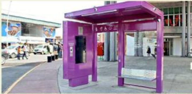
La Zona Pulso de Vida instalada junto al Centro Cultural de la Colonia Constitución fue inaugurada en febrero.

Se trata de una banca donde ellas pueden cargar su celular mientras esperan el transporte; además, hay un botón que conecta con el 911 y una cámara de