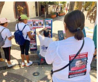
De los 34 botones que tienen en el Colectivo, 30 son de GDL y Zapopan y 4 de instancias federales.

Agregó que además hay 10 integrantes inscritos al Mecanismo de Protección para Personas Defensoras de Derechos Humanos y Periodistas, por lo que reciben rondas