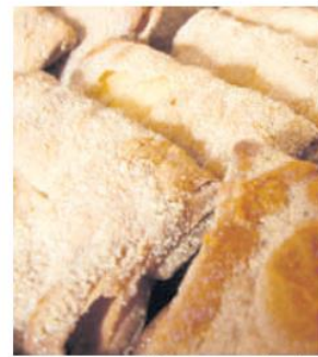
PAN AHUALULCO. Delicia que lleva el nombre de la ciudad que lo vio nacer.