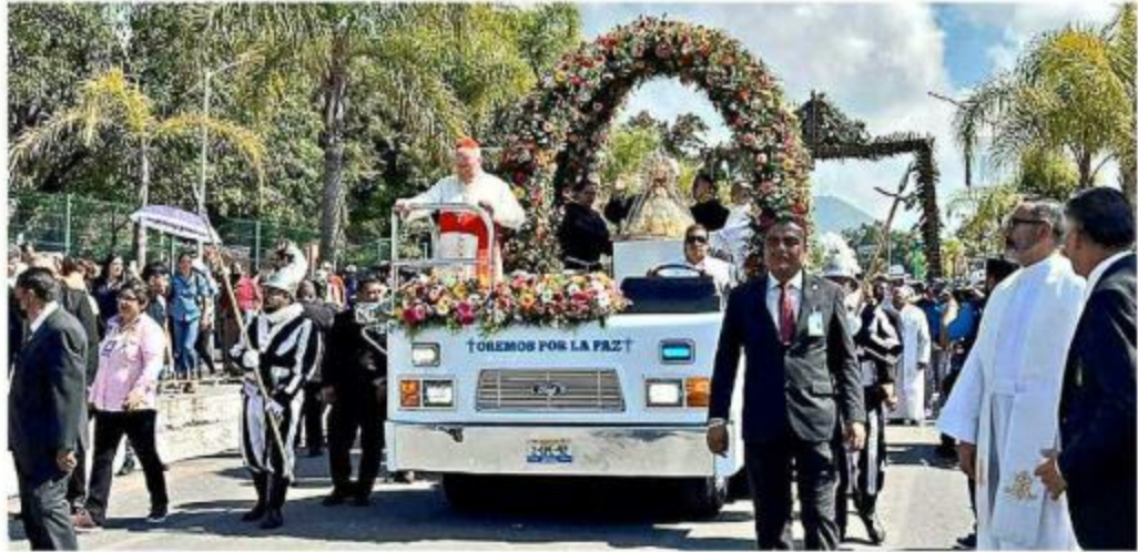
■ La Virgen de Zapopan llegará a Chapala alrededor de las 11:00 horas.

En cambio, la Calle Juárez (de Morelos a Ramón Corona) estará cerrada todo el domingo.