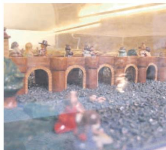
VIAJE AL PASADO. Esta maqueta muestra cómo lucía el puente, un legado del siglo XVIII, ubicado en el corazón de Guadalajara.