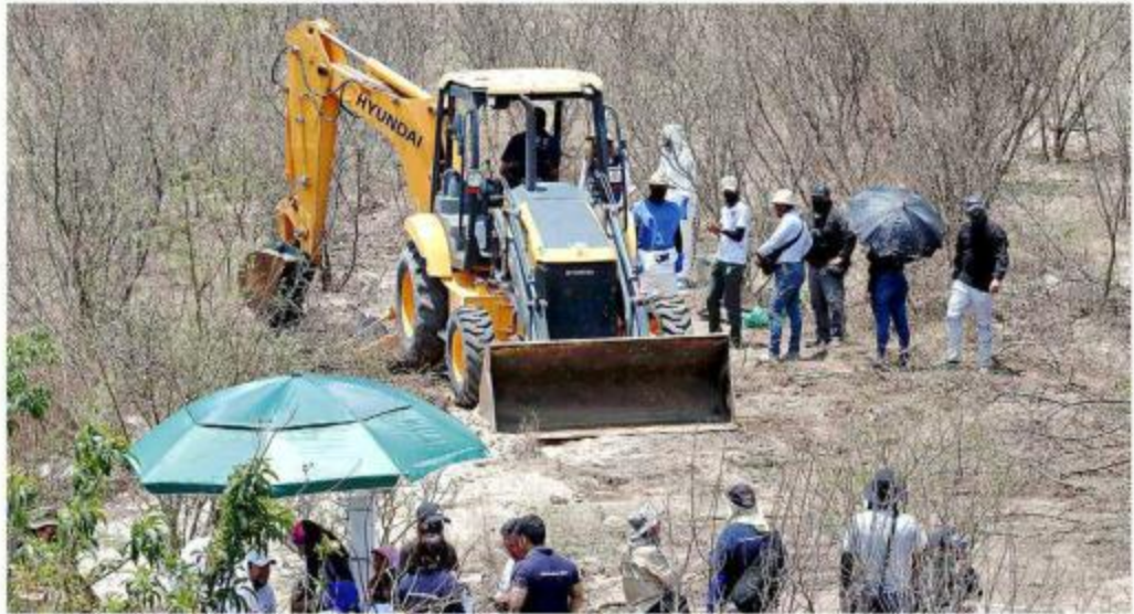
■ El predio se encuentra a espaldas de San Lucas Evangelista.

El martes, el colectivo encontró múltiples fosas, en las que habría por lo menos dos cadáveres en cada una, pero