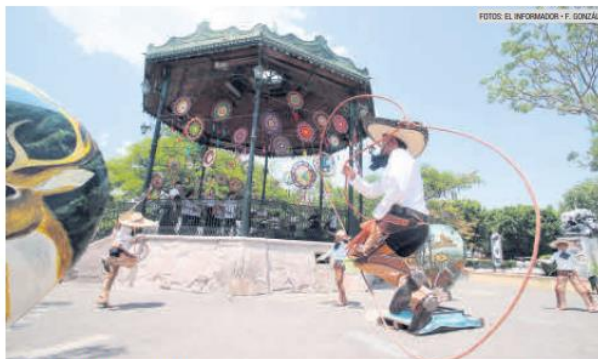
SUERTES, TRADICIÓN Y COLORES. Estudiantes de charrería hacen sus suertes con el kiosko y la expo de Corazones de Pueblos Mágicos a sus espaldas.

Tras la caminata nada como una buena comida, y en Ahualulco y sus alrededores vale la pena ir con el cinturón suelto. En la localidad de Santa Cruz de Bárcenas se encuentra (a unos minutos al Oeste de la cabecera municipal) se encuentra la ruta del pozole cocinado a la leña, con 18 restaurantes de este tipo, cada uno con su propia sazón, así que más vale asistir con mucha, pero