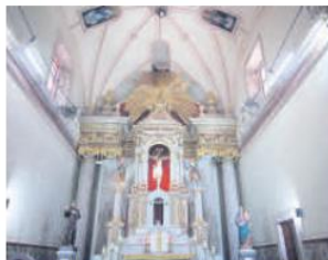
ESPLENDOR. Así luce el altar principal dentro de la Parroquia de San Francisco.