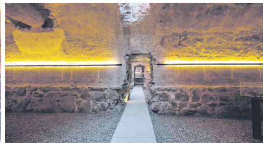
BELLEZA. Sumérgete en el pasado visitando el Museo de Sitio del Puente de las Damas, donde las leyendas y la arquitectura se entrelazan en un viaje único.