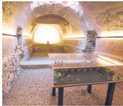
LEYENDAS. Descubre la historia viva de este sitio que ha sido testigo silencioso de la conexión entre el pasado y el presente en Guadalajara.

Si acudes a conocer el Puente de Las Damas, puedes armar un itinerario y conocer otros lugares importantes que están cerca de él. "Están el templo, el mercado y las nieves de Mexicaltzingo, pero también podemos encontrar Las 9 Equinas donde la comida es muy buena y por las noches están las famosas cantinas que siguen albergando a los bohemios", expresa la secretaria, reafirmando que toda esta zona es "una de las más bonitas de la ciudad".