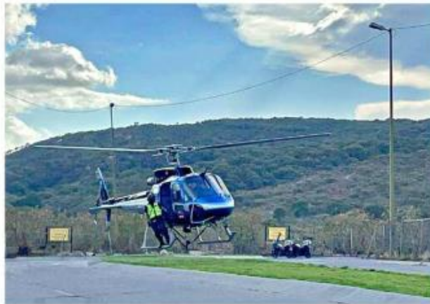
■ Autoridades extrajeron en helicóptero un cadáver del Bosque La Primavera.

Eran aproximadamente las 14:00 horas cuando la víctima, de 32 años, conducía un automóvil Ford Fusion y dos sujetos le dispararon en la Calle Ramón Corona, entre