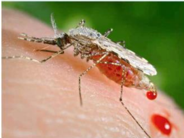
La enfermedad es transmitida por la picadura del mosquito “Anopheles”.

De acuerdo con la Secretaría de Salud Jalisco, el paludismo es una “enfermedad parasitaria, producida por cuatro especies de protozoarios del género ‘Plasmodium’, que se transmiten al ser humano por la picadura de mosquitos hembra infectados del género ‘Anopheles’”.