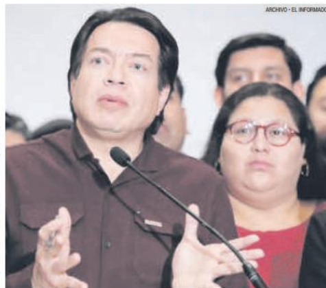
ADVERTENCIA. Líderes de Morena llaman a priorizar el proyecto de nación.

“(Debe ser) la gran discusión en las próximas semanas, meses, y eso es lo que tenemos que provocar: dirigentes, militantes, representantes populares, funcionarios, y no la