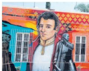
NUOVO MURAL. Se encuentra en el Centro Ahualulco de Mercado y es obra del artista David Varo Gudíño.