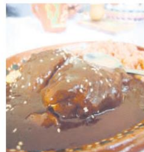
DIVINO MOLE. La gastronomía tradicional es una delicia en las manos de cocineras artesanales de El Teuchiteco.

Sería derrotado y fallecería cerca de San Blas en enero de 1811. Su valor y amor por la patria lo granaron que su ejemplo quedara como un eco en la eternidad, y claro, en el nombre de la ciudad que lo vio como párroco: Ahualulco.