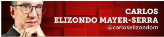
CARLOS ELIZONDO MAYER-SERRA