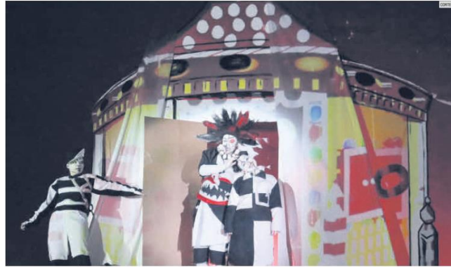
CULTURA. El Festival de Ópera de Zapopan se realizará del 5 al 20 de agosto.

Todo está listo para que se realice el Festival de Ópera de Zapopan y el Concurso de Canto Linus Lerner