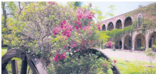
HACIENDA EL CARMEN. La antigua hacienda se convirtió en uno de los alojamientos más bellos con los que cuenta el Estado.