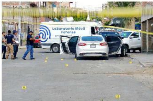
■ Un hombre fue asesinado a balazos en Tonalá.