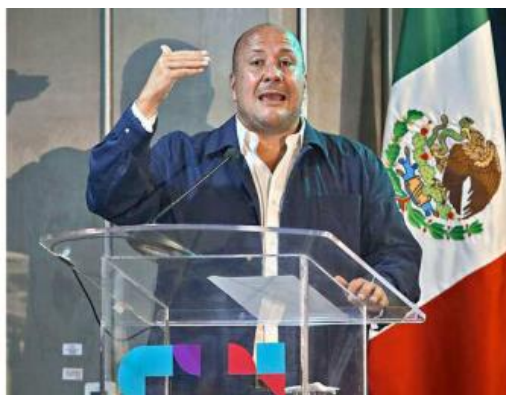
Alfaro informó en redes sociales que dialogó con el Presidente López Obrador.