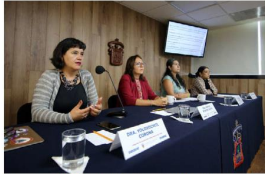
Integrantes del Observatorio compartieron las cifras.

Añadieron que la mayor incidencia de conductas violentas fue