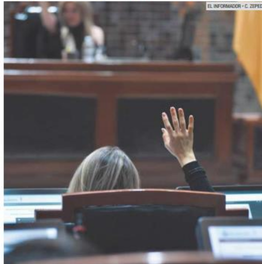
MANO ARRIBA. Fueron en total 30 votos a favor los que avalaron la reforma al Código Penal para aumentar las penas contra la trata de personas.

Ayer fue aprobada una reforma al Código Penal de Jalisco para aumentar las penas contra la trata de personas.