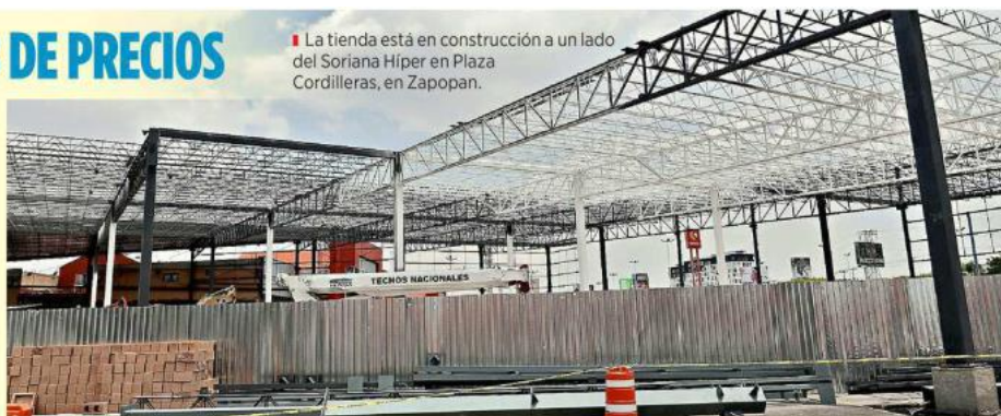
La tienda está en construcción a un lado del Soriana Híper en Plaza Cordilleras, en Zapopan.

"Ahorita la gente ya la está ubicando, muchos ya la identificaban de Colima. Hemos tenido muy buena respuesta.