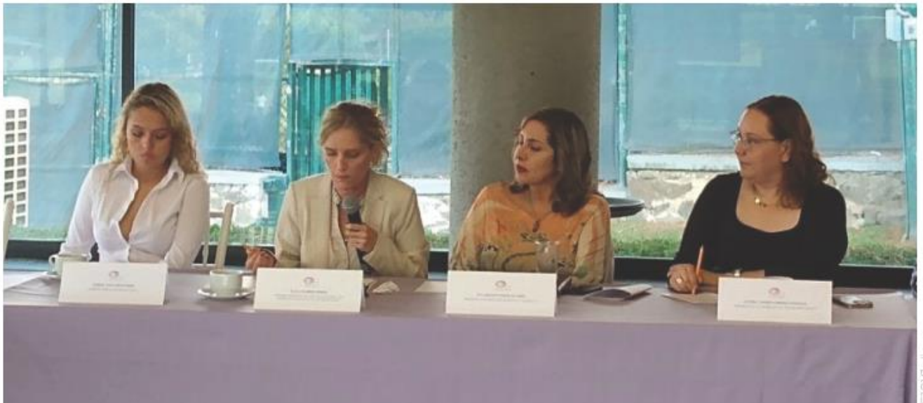
Durante el evento estuvieron presentes las integrantes la asociación civil G10XJalisco.