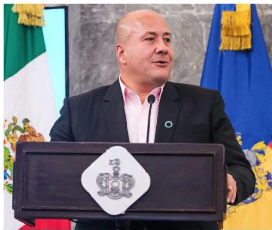
Enrique Alfaro habló sobre sus próximos proyectos personales.

Quando salí de Guadalajara hubo continuidad. Siguió Ismael (del Toro), y luego siguió Pablo (Lemus) y sigue habiendo una evaluación positiva de los proyectos de gobierno en la capital de Jalisco.