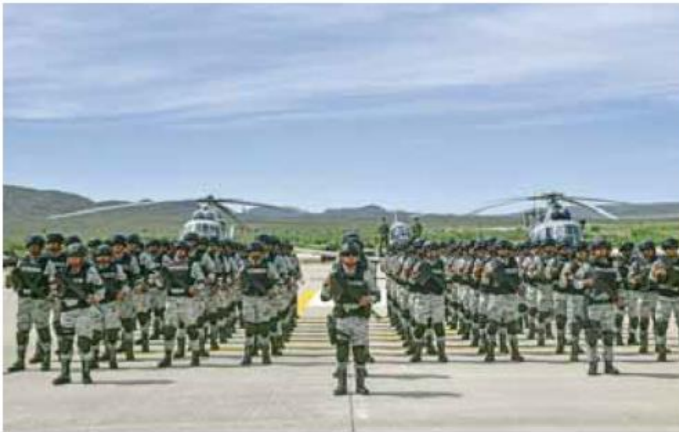
Seguridad. Los uniformados llegaron a reforzar la seguridad y tranquilidad de los ciudadanos.

elementos de la Guardia Nacional se contabilizaban hasta mayo de este año.