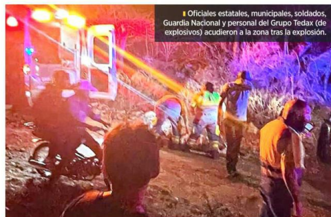
Oficiales estatales, municipales, soldados, Guardia Nacional y personal del Grupo Tepad (de explosivos) acudieron a la zona tras la explosión.

calía estatal y una policía municipal murieron por el ataque y 10 personas más resultaron lesionadas, entre ellas dos menores.