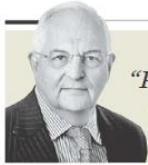
Martin Wolf "Potencias occidentales, autocomplacientes e hipócritas" - P. 26 Y 27