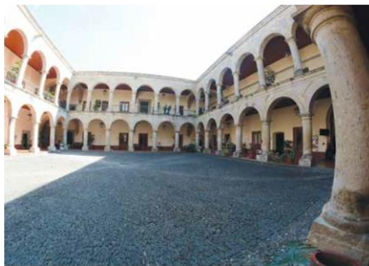
LEGISLATIVO. El plan de reingeniería incluye un catálogo de perfiles y un tabulador de puestos para el Congreso de Jalisco.