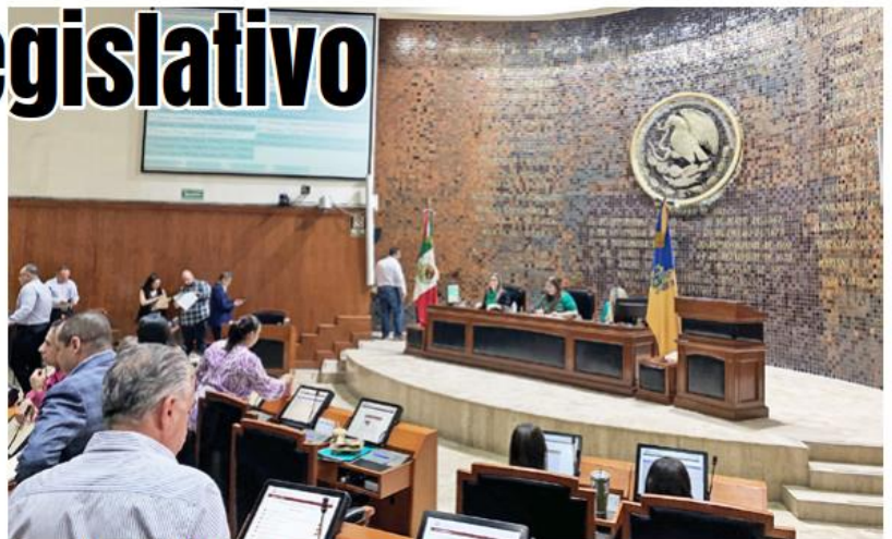
Sesión Ordinaria del Pleno del Congreso del Estado.

Para este fin se realizarán diversas mesas de trabajo, con la participación de autoridades administrativas, empleados y organizaciones sindicales, en donde se revisarán las propuestas presentadas por todas las partes, a fin de construir el mejor acuerdo, sin afectar los derechos laborales de quienes ya integran la nómina legislativa.