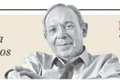
Héctor Aguilar Camín "Cuando la polarización lleva a la guerra: un eco de Tucídides" - P. 13

Inseguridad. Policía municipales de Tlajomulco y de la Fiscalía del Estado atendían un reporte de cuerpos en una fosa cuando un vehículo pisó un artefacto tipo mina