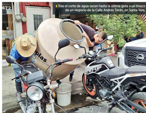
Tras el corte de agua sacan hasta la última gota a un tinaco de un negocio de la Calle Andrés Terán, en Santa Teresita.

Apenas el 22 de marzo se dio otro ataque con explosivo contra oficiales en Jalisco. Un uniformado de Tonalá resultó lesionado cuando le estalló un artefacto al revisar un vehículo en la Autopista Guadalajara-Zapotapano.