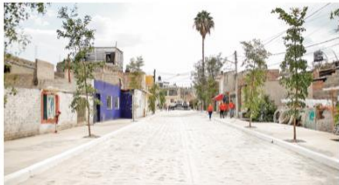
San Pedrito, López Mateos y Súper Manzana fueron las colonias intervenidas.

Por otra parte, la colonia Súper Manzana luce una nueva imagen luego de que se hiciera una rehabilitación integral de la zona, que consistió en la instalación de redes de agua potable y alcantarillado sanitario, así como la pavimentación en empedrado zampeado de calles y banquetas. En esta intervención se realizó una inversión de 18.6 millones de pesos.