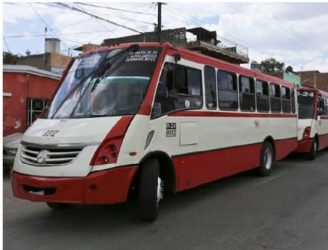
Las unidades fueron incautadas en el IJAS.

“El tema era que no pudiéramos ingresar a la prestación de servicio, que es lo que han querido desde el año 2021, a raíz de