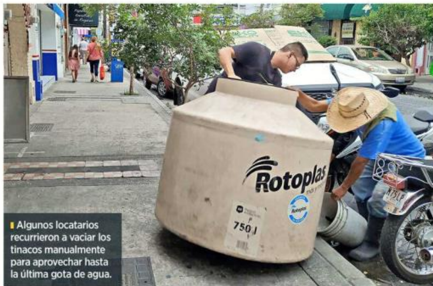
Algunos locatarios recurrieron a vaciar los tinacos manualmente para aprovechar hasta la última gota de agua.