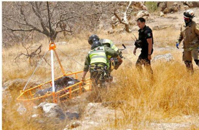
La fosa donde encontraron los cuerpos de las víctimas de call centers no está registrada.