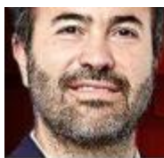
DAVID GÓMEZ-ÁLVAREZ @gomezalvarezd

Si MC no logra postular un candidato competitivo, es ocioso hablar de un proyecto alternativo de nación.