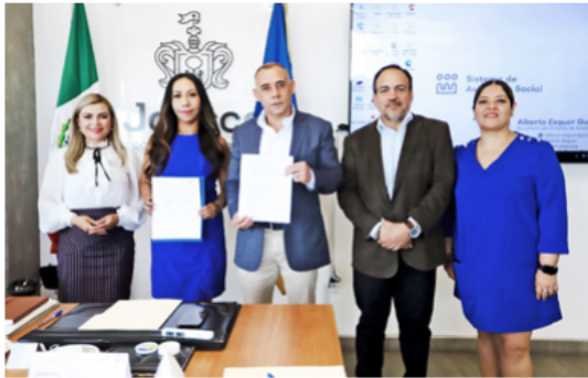
Se trabajará de manera coordinada entre las instituciones.