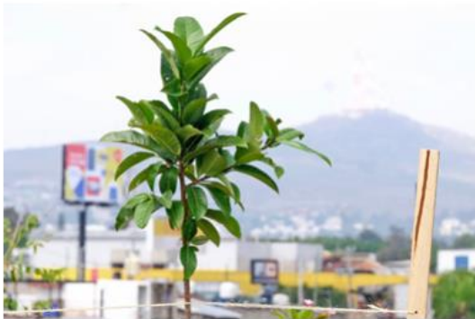
Estos ejemplares pueden llegar a medir entre 10 a 20 metros de altura.

Para la instalación del Arboretum, se seleccionaron 8 especies presentes en Jalisco: higuera negra, higuera blanca, camichin, jalamate, aguacatillo, amate caballo, texcalame, zalatillo.