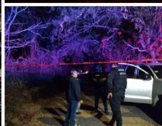
Elementos de los tres niveles de gobierno atendieron a las víctimas del ataque.