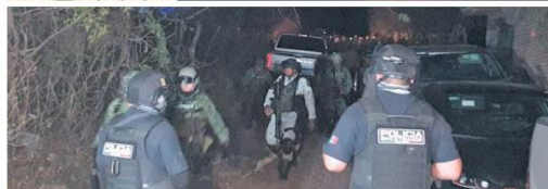
REACCIÓN. Al sitio de la agresión acudieron elementos de los tres niveles de Gobierno.

La agresión a los elementos de seguridad ocurrió en la cabecera municipal, también hubo 10 heridos, entre ellos civiles