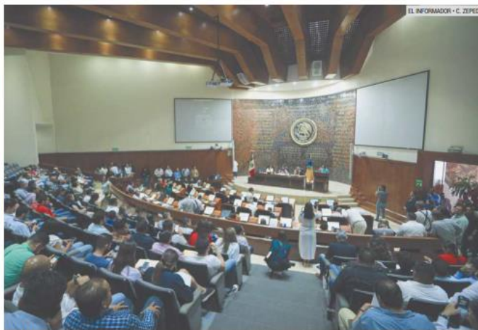
UNÁNIME. Se unieron los votos a favor por parte de los legisladores de todas las bancadas partidistas del Congreso del Estado de Jalisco, sin votos en contra o abstenciones.