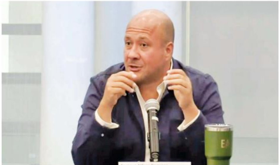
El gobernador de Jalisco, Enrique Alfaro Ramírez.

"A Dante lo respeto, aprecio y estaré siempre agradecido, lo digo abiertamente, por lo que él significó para la construcción de este movimiento en Jalisco. Pero no estoy de acuerdo con él en las decisiones que se han tomado en los últimos meses, no estoy de acuerdo en la idea de un diálogo simulado, no creo que se pueda hablar de diálogo cuando te sientas a platicar con alguien sin escucharlo, sabiendo que vas a ignorar lo que te diga, eso no es diálogo, es monólogo, ese ha sido la tónica de la relación de los últimos meses, pero eso no significa que haya algún mal ánimo o un tipo de ruptura, prefiero conservar la amistad y afecto que entrar en ese terreno", asegura el gobernador.