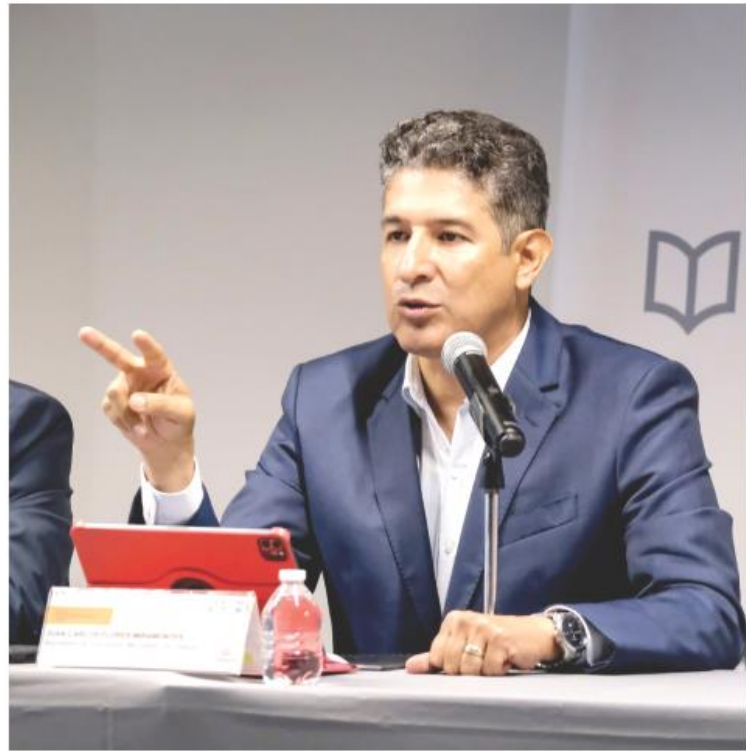
El secretario de Educación, Juan Carlos Flores Miramontes.

Para dudas y aclaraciones, la SEJ pone a disposición el Centro de Atención Telefónica 33 3030 7550, de lunes a viernes de 9 a 19 horas.