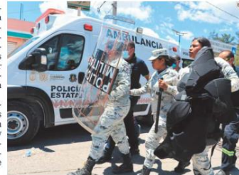
LOS DEJAN IR. Los servidores públicos retenidos, entre ellos miembros de la Guardia Nacional, fueron liberados tras un acuerdo con los manifestantes.