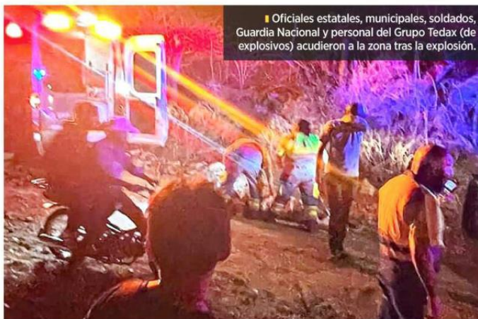
■ Oficiales estatales, municipales, soldados, Guardia Nacional y personal del Grupo Tedax (de explosivos) acudieron a la zona tras la explosión.

calía estatal y un policía municipal murieron por el ataque y 10 personas más resultaron lesionadas, entre ellas dos menores.