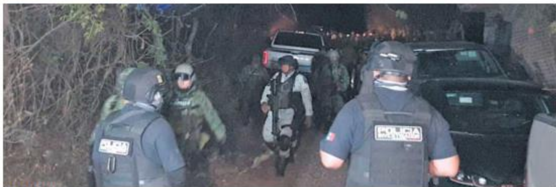
REACCIÓN. Al sitio de la agresión acudieron elementos de los tres niveles de Gobierno.