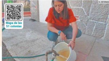
PROBLEMA ANEJO. Los habitantes han batallado por el agua turbia.