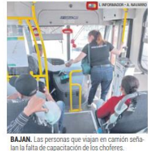
BAJIAN. Las personas que viajan en camión señalan la falta de capacidad de los choferes.

Que los conductores del transporte público en la Zona Metropolitana de Guadalajara vayan siempre "a las carreras", pasando los altos o sin dar la parada a quienes esperan por su servicio, es uno de los puntos que más molesta a los usuarios, de acuerdo con un sondeo realizado por este medio.