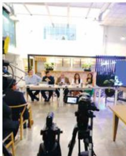
SEGUNDA EDICIÓN. El premio anunciado cuenta con cuatro categorías.

“Esperamos que esta (convocatoria) sea aún mejor y agradezco la muy distinguida presencia no solo de los miembros del presidium, que demuestra la importancia que tiene este Premio al Emprendimiento en un estado que se caracteriza por emprendedores, por innovadores”, agregó.