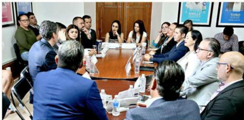
■ Diputadas se reunieron con inmobiliarios en el Congreso.

“Creo que vale la pena el que ya nos pongamos todos de acuerdo, que por fin po-