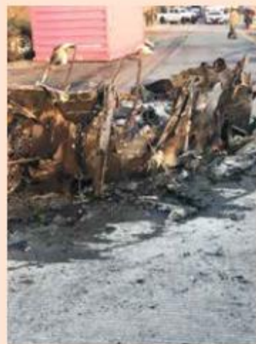
SE QUEMÓ. Una de las unidades se incendió tras una volcadura; su chofer murió calcinado.