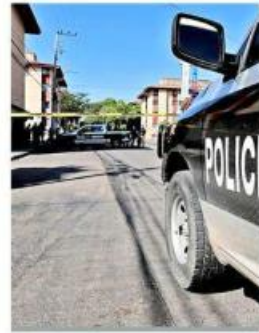
Los hechos ocurrieron en la Colonia El Sauz.

Por su parte, los uniformados de la Policía de Tlaquepaque informaron que el robo no se consumó, además de que se encargaron de resguardar el sitio, donde fueron aseguradas un arma de fuego, un arma blanca y cinco casquillos.