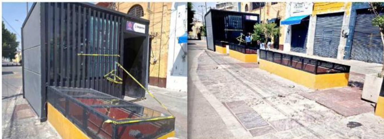
La ventana rota tiene cintas para evitar riesgos. Las losas de la plazoleta también están dañadas.