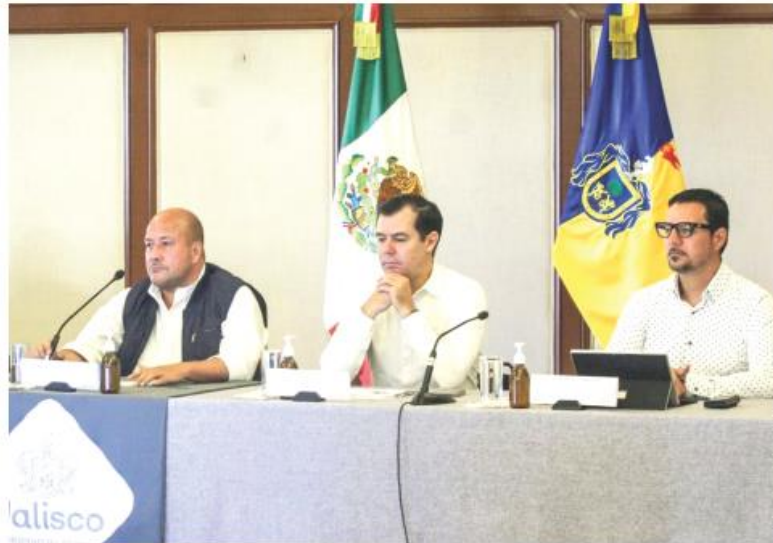
El Gobernador y el titular de Setran hablaron del tema de la ruta 24.

“¿Qué nos falta y en qué estamos trabajando?, Línea 4 que lleva 30 por ciento de avance, la modernización de la Línea 1, una apuesta muy