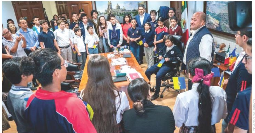
Los jóvenes representan a 16 municipios del Estado.

"Si a sus capacidades de matemáticas le sumas el segundo idioma entonces sí: agárrense. Tenemos que concentrarnos en eso, tenemos mucho que hacer y qué mejor de la mano de todos ustedes y sobre todo diría: son la inspiración