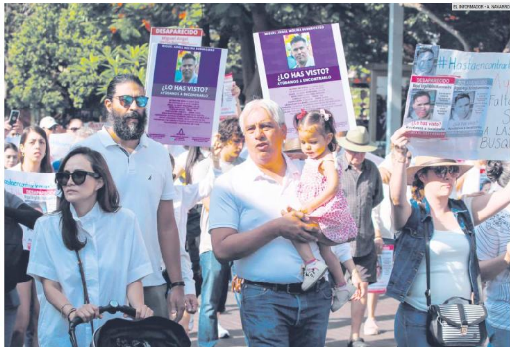
MANIFESTACIÓN. Familias de desaparecidos buscan garantías de seguridad para sus procesos de búsqueda.

El Consejo agregó que ante la petición de