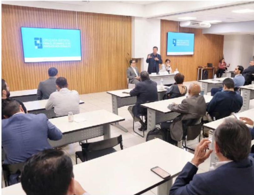
Expusieron las alternativas que facilitan a los desarrolladores su conexión.

A través de un comunicado, el Gobierno del Estado dio a conocer que el objetivo de este encuentro es conocer los retos a los cuales los desarrolladores de parques industriales suelen enfrentarse y proponer soluciones para garantizar la infraestructura para contar con suministro eléctrico.