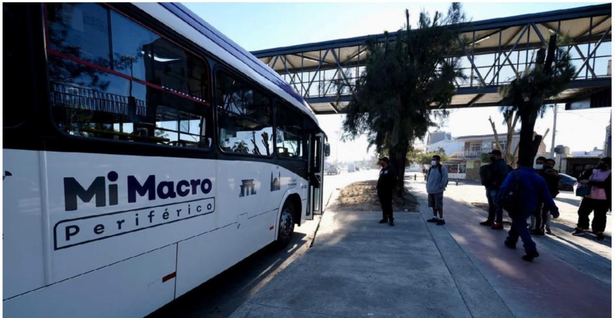
Mi Macro Periférico obtuvo una calificación de 8.39 contra 5.6 que tenían en 2018 las rutas que conformaban este derrotero. ESPECIAL