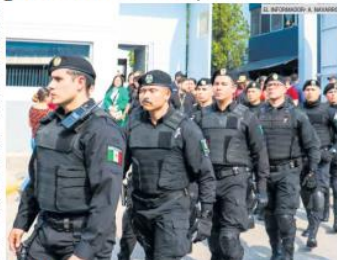
LABOR. Las autoridades continúan con la búsqueda de los responsables del ataque que mató a cuatro policías y dos civiles. Los agentes fueron homenajeados.

Con relación a los lesionados, detalló que la cifra subió a 15. La mayoría siguen en el hospital. De acuerdo con la última lista difundida por las autoridades, hay dos hombres de 19 y 20 años