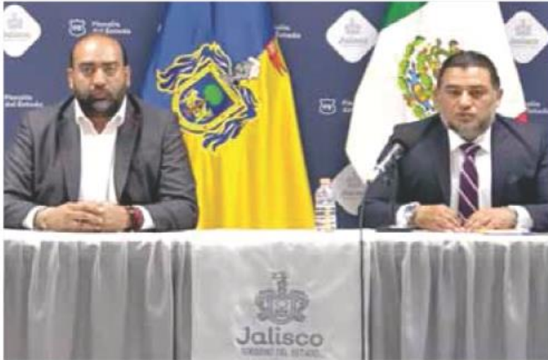
Investigación. Las autoridades dieron a conocer los avances de las investigaciones.