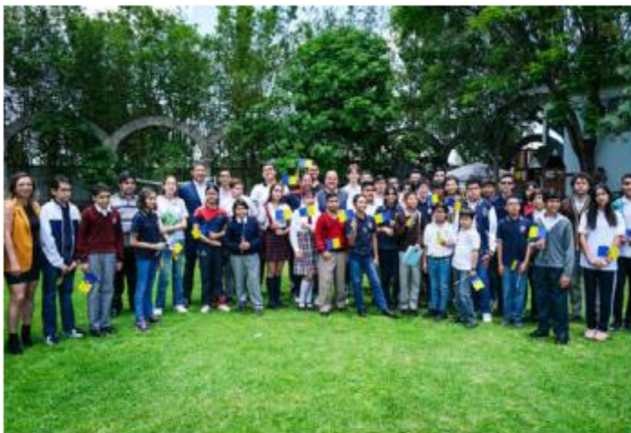
VISITA. El gobernador Enrique Alfaro despidió a 55 estudiantes de educación básica que viajarán a Singapur para participar en la Singapore International Math Olympiad Contest.