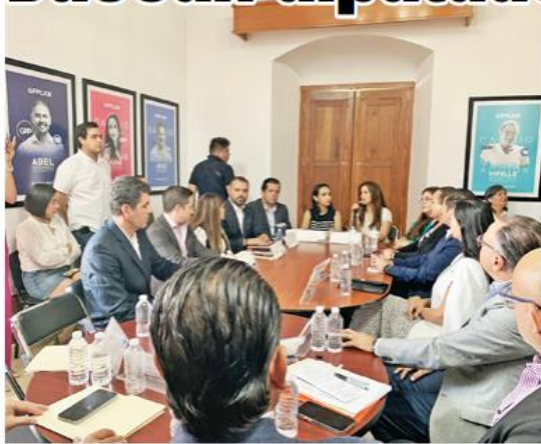
Reunión de legisladores con los representantes inmobiliarios del Estado de Jalisco.