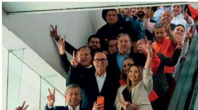
La ausencia de Alfaro Ramírez de la reunión del Consejo naranja añadió tensión a su relación con el dirigente del partido.

Entre los cambios que resultaron más atractivos , los usuarios señalaron la calidad de las terminales y estaciones, iluminación , seguridad personal y calidad de los asientos.