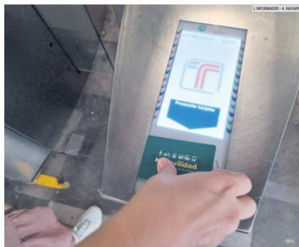
TECNOLOGÍA. En la Línea 1 se podrá conocer en tiempo real la frecuencia y tiempo de paso de los trenes.

El punto de seguridad respecto del chofer alcanzó un total de 9 puntos. Sin embargo, la menor calificación que se le dio a este sistema de transporte fue el de confort por cantidad de usuarios, con 6.8, menor que los 7.5 puntos dados a los camiones del antiguo sistema de transporte.