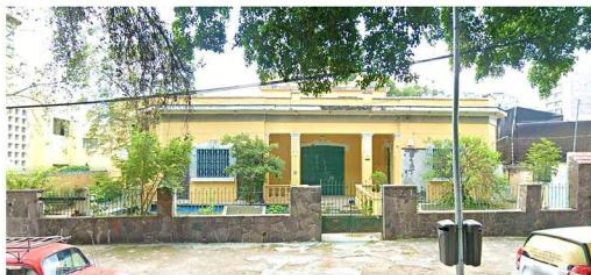
Esta fue la casa sobre José Guadalupe Zuno que fue demolida por disposición del Tribunal de Justicia Administrativa y aval del Ayuntamiento.