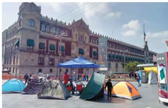
ENCUENTRO. Los tonaltecas se reunirán hoy con personal de la Segob en Jalisco.