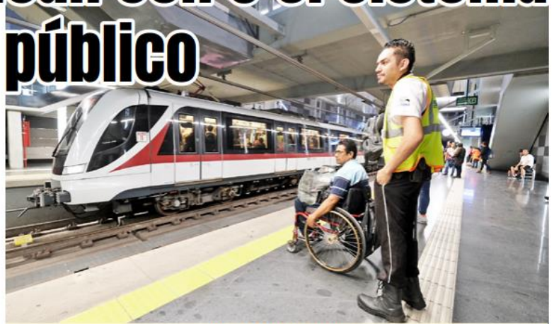
MEJORA MI TREN