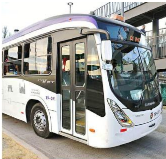
En general, el sistema de transporte público del área metropolitana tuvo un 8 de calificación, no así el Macrobus.

Alfaro también destacó la reducción del 50 por ciento en la ocurrencia de delitos a bordo de las unidades, pues mientras en 2021 el 12 por ciento de usuarios reportó haber sido víctima, en 2023 bajó a 6 por ciento.