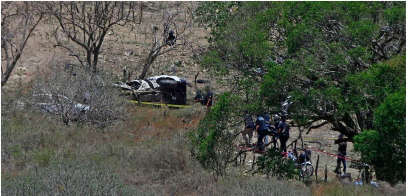
Desde el día de la agresión comenzaron las investigaciones por parte de las autoridades. FERNANDO CARRANZA