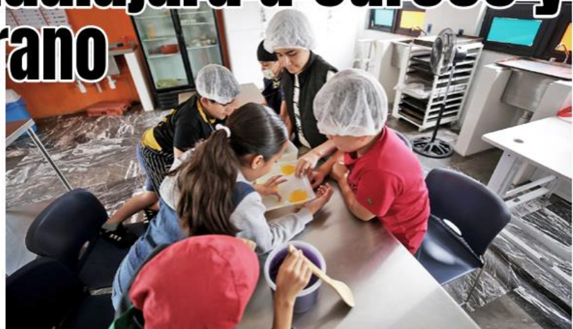
Los cursos tendrán modalidad gratuita y con costo y el horario será de 9:00 a 13:00 horas.

Por otra parte, la modalidad de talleres intensivos van enfocados, en su mayoría, a la formación para el empleo, brindando conocimientos en diferentes categorías como gastronomía, estilismo, manualidades, costura, arte, deporte, entre otras.