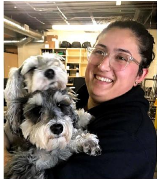
La ciudadana estadounidense de 29 años fue abandonada junto a su primo cerca de Zapotlanejo.

Debido a los indicios de que se trataba de un delito federal, la Fiscalía General de la República (FGR) atrajo el caso.