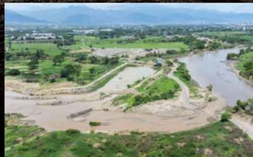
En marzo pasado el Seapal hizo tareas de mantenimiento del Pozo Radial para mejorar el suministro de agua. La fuente de abasto recuperó unos 90 litros por segundo.

También solicita al Seapal Vallarta, entre otros puntos, que: "Se deje de cobrar el servicio de agua potable de uso doméstico, hasta en tanto no se regularice el servicio de agua potable", y que corrija los recibos de cobro emitidos para que "no existan cobros injustificados y se hagan los descuentos correspondientes".