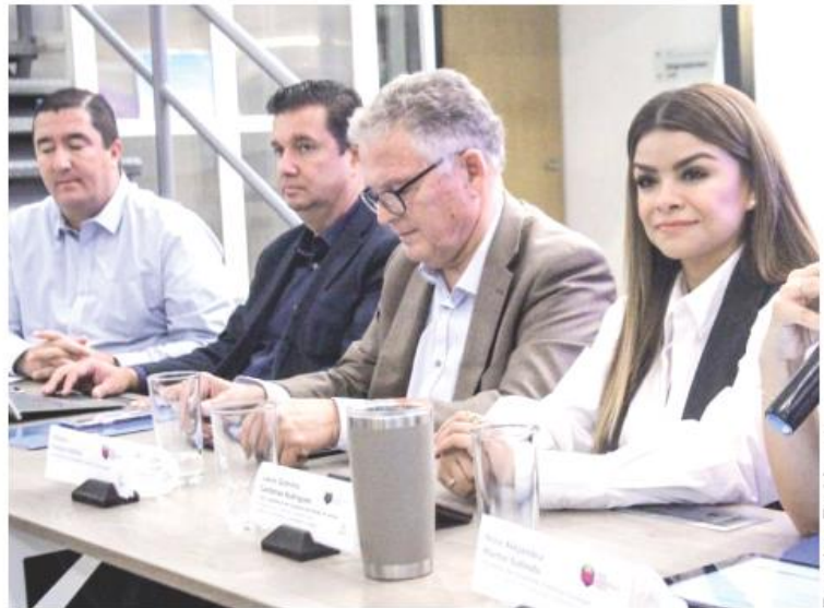
El ganador de cada categoría obtendrá 170 mil pesos.

Esta distinción se realizó por primera vez en 2022, en seguimiento a la Ley de Fomento al Emprendimiento del Estado de Jalisco, que además de promover la creación del premio, también fomenta acciones estratégicas para apoyar la creación de nuevos negocios.