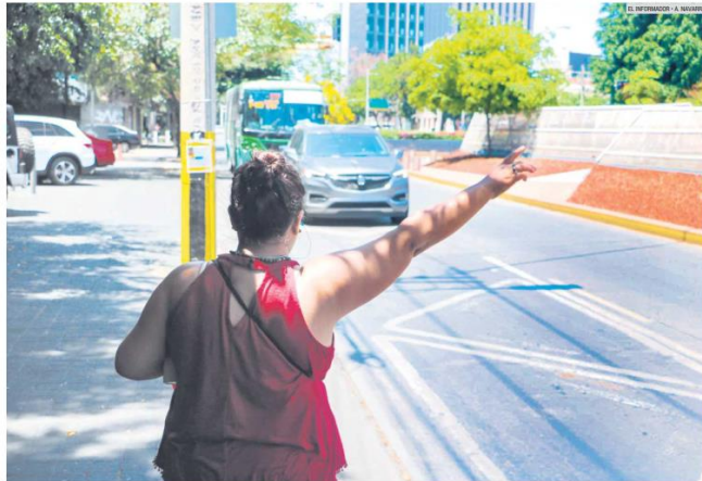
PACIENCIA. Los usuarios en la Zona Metropolitana de Guadalajara esperan alrededor de 11 minutos y 54 segundos para abordar un camión del transporte público.

El promedio que los usuarios deben esperar para subir a una unidad ha crecido un minuto