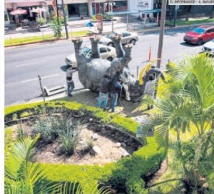
FUERZA. La escultura del Centro Magno pesa 300 kilos y fue derribada por el viento.