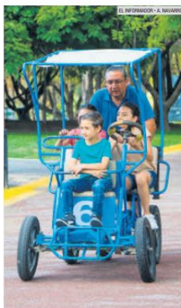
FAMILIAR. El Parque Metropolitano destaca por la variedad de actividades que ahí se pueden realizar.

El Metropolitano es el parque más visitado de la Zona Metropolitana de Guadalajara, según estadísticas Asociación Nacional de Parques y Recreación de México.