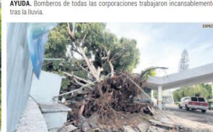
PELIGRO. Autoridades mantienen la vigilancia en los puntos de riesgo.