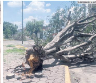
RIESGO. Cinco árboles cayeron en Mariano de la Bárcena.