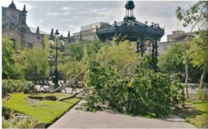
■ En la Plaza de Armas se reportaron árboles y farolas caídos.

Vecinos tapatíos reportaron la caída de 100 árboles en las Colonias Oblatos, La Perla, El Retiro, Mezquitán, Independencia y el Centro Histórico; así como en las calles Sierra Madre, Avenida Javier Mina, Jesús García, República, Gigantes, Chapultepec, Paseo de los Artistas, Pablo Valdez, Belisario Domínguez y Enrique Díaz de León, además de afectaciones a infraestructura urbana en la Plaza de Armas de Guadalajara. Otra "víctima" reportada fue