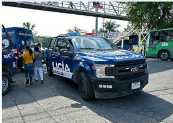
■ Dos hombres fueron asesinados en Ciudad Aztlán.

Los familiares explicaron ante las autoridades que dos sujetos llamaron a la puerta con el pretexto de pedir un presupuesto y, cuando la víctima se acercó, le dispararon en la cabeza.