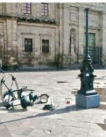
Una bicicleta derribada por el viento en un parque.

decena de vehículos sobre la Calle Manuel Doblado; además, en un sótano de Pablo Valdez y Luis G. Curiel hubo repercusiones en 17 automóviles.