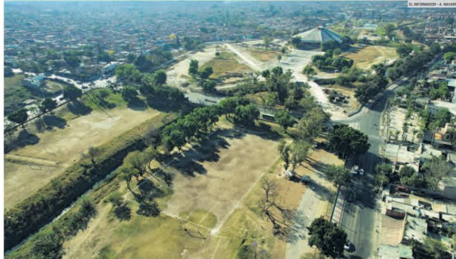
ATRACCIÓN. El Parque de la Solidaridad cuenta con espacios deportivos, de entretenimiento artístico y cultural, y de esparcimiento y convivencia social.

Los principales conflictos son daños y robos a infraestructura, asaltos e ingreso a zonas restringidas