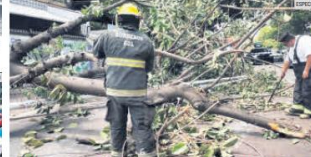
AYUDA. Bomberos de todas las corporaciones trabajaron incansablemente tras la lluvia.