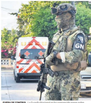
FUERA DE CONTROL. La Guardia Nacional no ha conseguido poner orden.

Por ese motivo, diputadas locales realizaron el foro "Jalisco Libre de Trata" para definir una estrategia contra este problema.