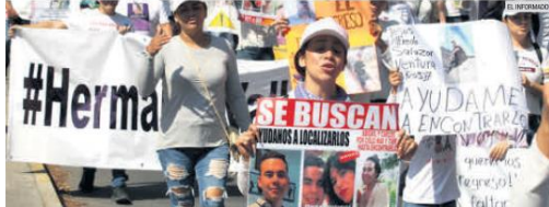
CRISIS. Además de los asesinatos, el Observatorio Nacional Ciudadano lamenta la crisis que padecen las familias por el aumento en las desapariciones.

El Observatorio Nacional Ciudadano sobre Seguridad, Justicia y Legalidad presentó el análisis de incidencia delictiva del primer semestre del año, con Jalisco como la entidad con más desapariciones en este sexenio, con seis mil 548 casos entre el 1 de diciembre de 2018 y el 30 de junio de 2023. Sin embargo, en el acumulado suman 14 mil