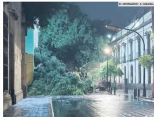
GUADALAJARA. Un árbol caído en Independencia y Belén derribó el cableado del trolebús.