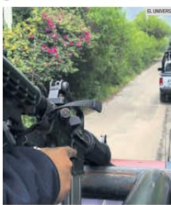
ARMADOS. La Policía y la Guardia Nacional compiten contra el poder de fuego del crimen organizado.

En un comparativo realizado con las gestiones anteriores, hay una mayor tasa de homicidio doloso, extorsión, robo a negocio, robo con violencia y violación en los primeros 55 meses de la gestión del Presidente Andrés Manuel López Obrador (AMLO), que en los primeros 55 meses de los ex Presidentes Felipe Calderón y Enrique Peña Nieto.