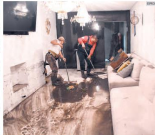
DAÑOS. Decenas de viviendas quedaron inundadas y sufrieron pérdidas de menaje.