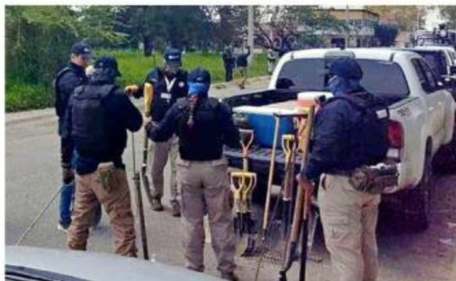
Los trabajos se centraron en un predio de Ocotlán.

El 17 de abril de 2021 fueron vinculados a proceso de los policías por la desaparición forzada de los hermanos, sin embargo, la audiencia intermedia se ha pospuesto.