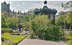
En la Plaza de Armas se reportaron árboles y farolas caídos.

Vecinos tapados reportaron la caída de 100 árboles en las Colonias Oblatos, La Perla, El Retiro, Mezquitán, Independencia y el Centro Histórico; así como en las calles Sierra Madre, Avenida Javier Mina, Jesús García, República, Gigantes, Chapultepec, Paseo de los Artistas, Pablo Valdez, Belisario Domínguez y Enrique Díaz de León, además de afectaciones e infraestructura urbana en la Plaza de Armas de Guadalajara. Otra "víctima" reportada fue