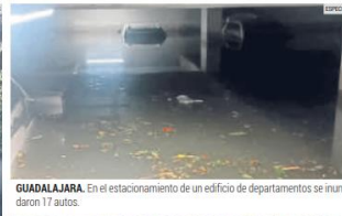
GUADALAJARA. En el estacionamiento de un edificio de departamentos se inundaron 17 autos.