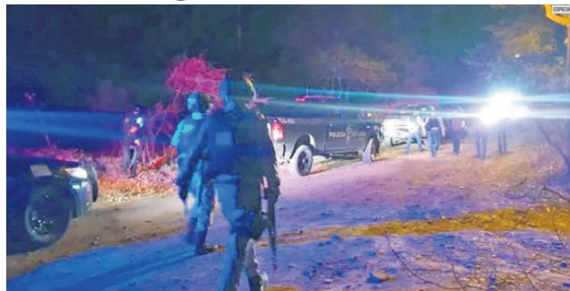
DETONANTE. El atentado con explosivos en Tlajomulco es la gota que derramó el vaso en la atención nacional e internacional sobre la violencia actual en México.

Destaca que el primer semestre del año se ha caracterizado por la alta intensidad de los crímenes