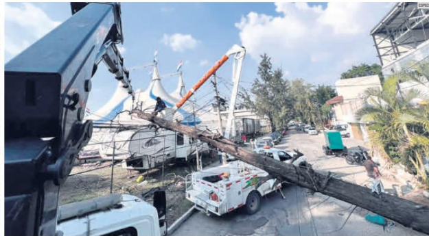
ZAPOPAN. Los fuertes vientos también derribaron postes de la CFE, que dejaron varias colonias sin electricidad.