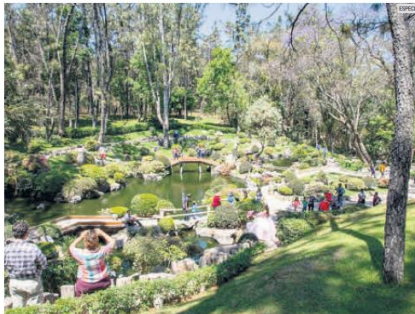
PULMÓN TAPATIO. El Jardín Japonés es un espacio único en la ciudad, que se ubica en Los Colomos. Es el parque urbano con mayor biodiversidad y servicios ambientales de la metrópoli.

“Por su cualidad de área protegida se busca el cuidado de la flora y la fauna que habita en el lugar, así como la invitación a los visitantes de la preservación para contribuir al mejoramiento del ecosistema y evitar el deterioro. Para este fin aporta el Centro de Educación y Cultura Ambiental Metropolitano de la Agencia Metropolitana de Bosques Urbanos, con actividades de educación ambiental”.