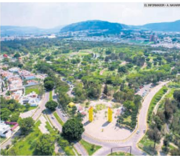
PREFERIDO. De todos los usuarios registrados en 14 parques o bosques urbanos más grandes de la ciudad, la mitad visitó el Metropolitano en el primer trimestre del año.

Los Colomos y el Parque Montenegro forman parte de los tres bosques urbanos con más visitas en la ciudad