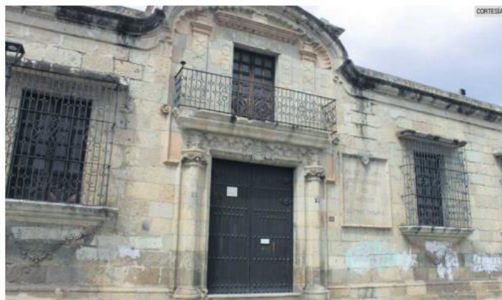
MUSEO PREHISPÁNICO. El recinto alberga más de 800 piezas.

"De esta manera, el patrimonio cultural de los oaxaqueños regresa al pueblo y está disponible para todas las personas que desean