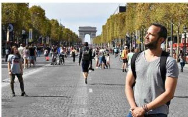
Los estudiantes reciben orientaciones previo al intercambio.