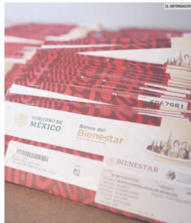
APOYOS. Los programas sociales sí han impactado positivamente en la reducción de la pobreza en México.

Por otro lado, en 2018 había 10.4 millones de hogares que recibieron ingresos de