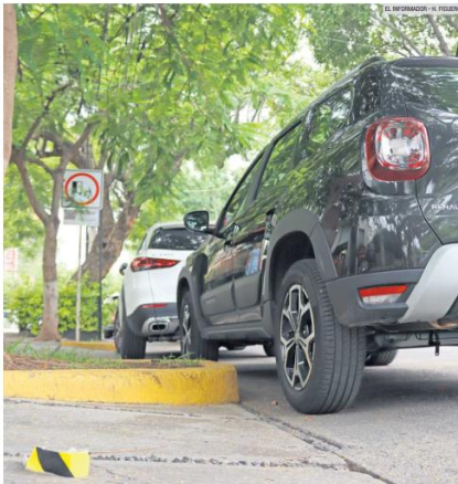
MULTA. Se ha vuelto común en la ciudad observar vehículos estacionados en línea amarilla.

"Los encuestados del nivel socioeconómico más bajo son los que más sufren por la baja calidad de las banquetas".