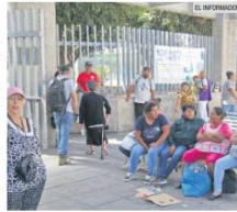
RADIOGRAFÍA. Más de 3.1 millones de jaliscienses tienen problemas para el acceso a los servicios de salud.

En Jalisco hay un retroceso importante en el acceso a los servicios de salud, que es cuando la población no está afiliada a las instituciones públicas. Mientras en 2016 el porcentaje del total de la población con esta cobertura era de 17.6%, el año pasado creció más del doble: llegó a 37.1%; es decir, 3.1 millones de jaliscienses están en esta situación, según la medición más reciente del Consejo Nacional de Evaluación de la Política de