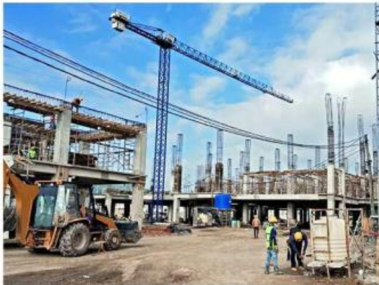
El Hospital Regional de Especialidades proyecta cobertura de 2.5 millones de derechohabientes.