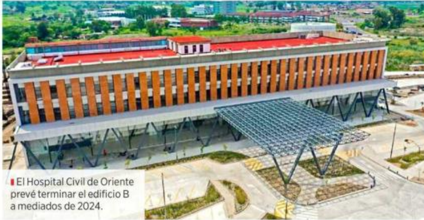
El Hospital Civil de Oriente prevé terminar el edificio B a mediados de 2024.

Dicho inmueble está conformado por tres niveles, 60 consultorios, farmacia, áreas de endoscopias, somatometría, anatomía patológica, hemodiálisis, gobierno, medicina preventiva, archivo clínico