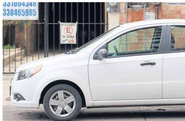
SIN RESPETO. La multa por estacionamiento en banquetas, camellones, andadores y otras vías reservadas a peatones, es la más común.

En total hay 21 causales por las que se pueden emitir infracciones viales en la ciudad