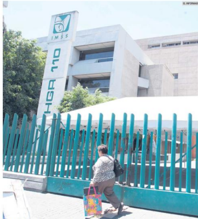
ALA BAJA. Se ha reducido la atención médica en instituciones de salud pública, al bajar de 22.4 millones de personas en 2018, a 18.1 millones de pacientes en 2022 en México.