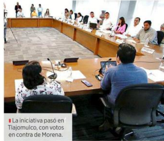
La iniciativa pasó en Tlajomulco, con votos en contra de Morena.

La iniciativa pasó a la Comisión de Finanzas y Patrimonio Municipal con cinco votos en contra de Morena.