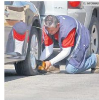
ADVERTIDOS. El programa contra autos mal estacionados está en marcha.

El Artículo 65 del reglamento de la Ley de Movilidad, Seguridad Vial y Transporte del Estado de Jalisco, publicado este mes de agosto, establece que las vías públicas y banquetas deberán estar libres de cualquier obstáculo u objeto que impida, dificulte u obstruya el tránsito vehicular y de peatones, excepto en aquellos casos debidamente autorizados por los municipios.