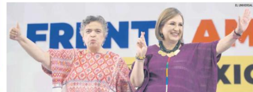
EVENTO. Beatriz Paredes y Xóchitl Gálvez participaron ayer en el quinto foro del Frente Amplio por México. El 3 de septiembre se conocerá a la ganadora.

Previo al quinto foro del Frente Amplio por México (ayer), Xóchitl Gálvez señaló que están en pláticas con diversos líderes de Movimiento Ciudadano para construir una alianza de cara a la elección de 2024, sobre todo porque un sector quiere unirse al bloque del PAN, PRI y PRD. A su llegada al Centro de Convenciones y Exposiciones Yucatán Siglo XXI, afirmó que ya se reunió con legisladores eme- cistas. En caso de ser elegida como candidata presidencial, el Frente buscará directamente al coordinador nacional, Dante Delgado. "Me he reunido en los Estados, nos hemos saludado con muchos diputados locales y federales, siempre en privado, respetando los tiempos en que MC tenga que tomar la decisión. En caso de serlo (la candidata presidencial), buscaré abiertamente a Dante Delgado y platicaremos".