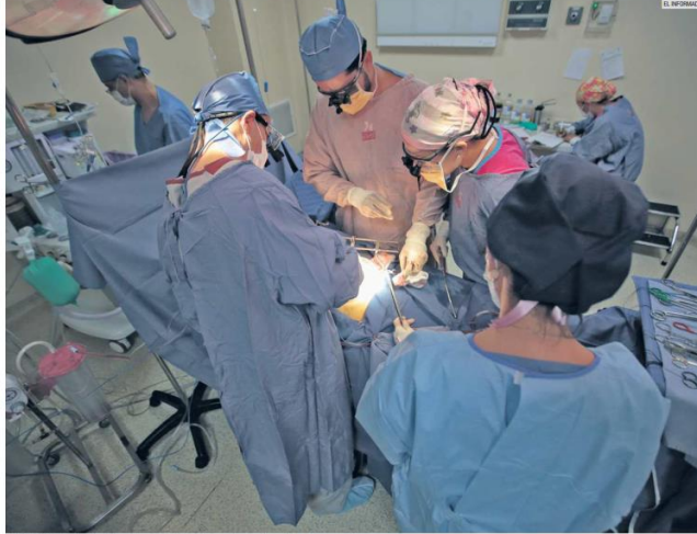
PROCESO. La cirugía de trasplante de riñón es la que tiene más solicitudes en el país.

La pandemia suspendió los trasplantes de órganos en el país, detonando el aumento de casos