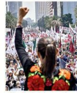
LA DIFERENCIA SUSTANCIAL ES: Claudia cree que ya llegamos a un destino y hay que defenderlo; su servidor sostiene que ya construimos un cimiento y hay que hacer mucho más", expresó.

Ebrard no cambió de postura sostuvo es un juego de dos, Claudia Sheinbaum y él.