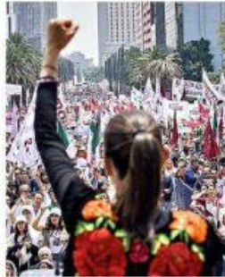
Claudia Sheinbaum celebró en el Monumento a la Revolución en la CDMX.

Ebrard no cambió de postura: sostuvo es un juego de dos, Claudia Sheinbaum y él.