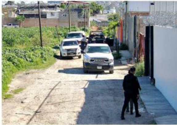
Uno de los crímenes ocurrió en San Pedro Tlaquepaque.