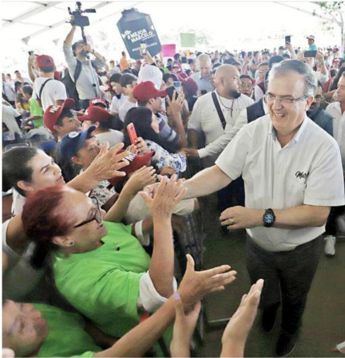
■ Ayer acudieron más de 9 mil personas al cierre de Ebrard.