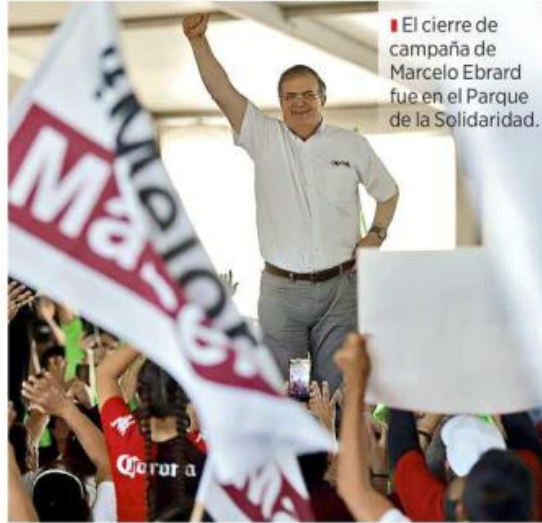
El cierre de campaña de Marcelo Ebrard fue en el Parque de la Solidaridad.