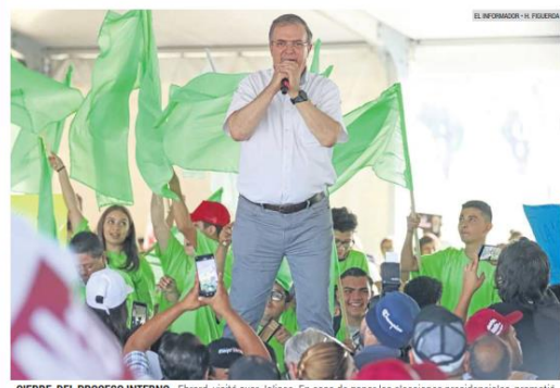
CIERRE DEL PROCESO INTERNO. Ebrard visitó ayer Jalisco. En caso de ganar las elecciones presidenciales, prometió aumentar el desarrollo económico, el crecimiento tecnológico, combatir la inseguridad y rescatar a Chapala.