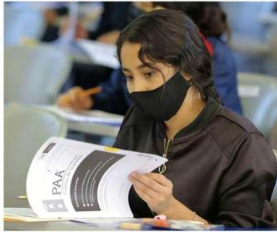
Los jóvenes también aprenden a controlar el estrés.