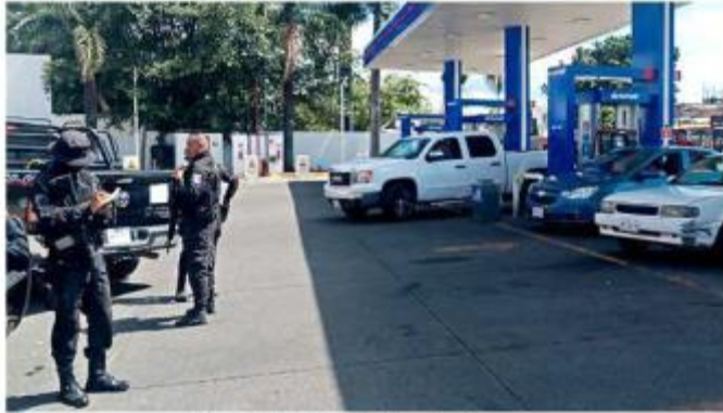
El atraco ocurrió en la Colonia Libertad.