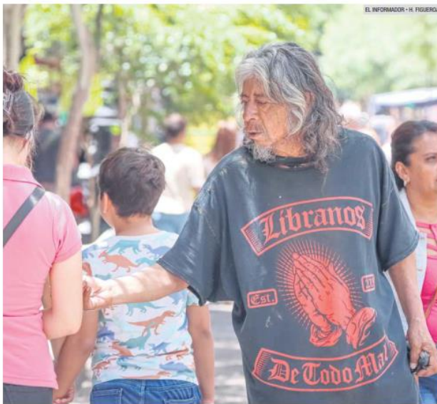
SIN AYUDA. Un tercio de los adultos mayores en México vive en situación de pobreza.