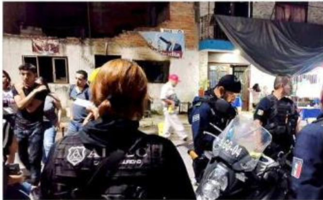
■ Policias y vecinos colaboraron en el rescate de las personas.

Los vecinos les advirtieron que en el interior había dos personas, una madre y su hijo, y se metieron con ellos para ayudarles. Para entonces ya iba en camino personal de Protección Civil y