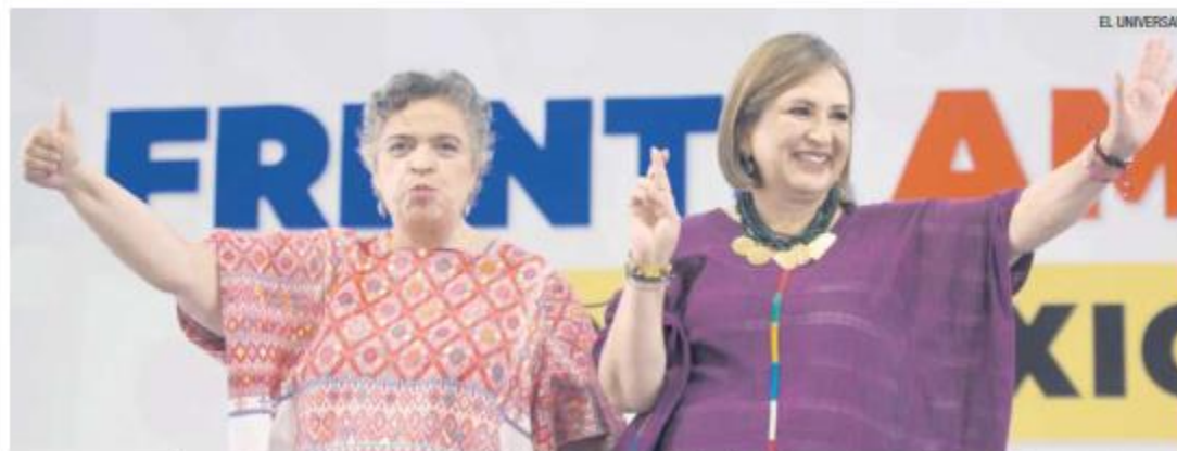
EVENTO. Beatriz Paredes y Xóchitl Gálvez participaron ayer en el quinto foro del Frente Amplio por México. El 3 de septiembre se conocerá a la ganadora.

"Tuvimos una gran reunión. Es un gobernador consistente. Tiene una visión clara".