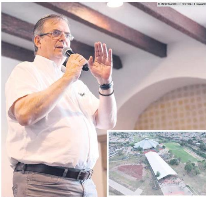
RESPECTUOSO. El ex canciller y aspirante a la candidatura presidencial de Morena se reunió con simpatizantes en el Parque Luis Quintanar. Aseguró que de todas las "corcholatas" es el más respetuoso de las reglas.

En total, se aplicarán 12 mil cuestionarios