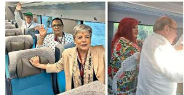
Entre los invitados al recorrido estuvieron la Canciller Alicia Bárcena, la Secretaría de Seguridad, Rosa Icela Rodríguez, y la Gobernadora de Campeche, Layda Sansores.