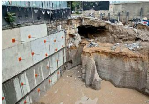
El desarrollador particular colocó un relleno provisional que cedió con la lluvia del jueves.