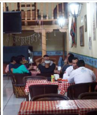
La decoración del lugar es sencilla, donde algunos cuadros y sombreros cuelgan de las paredes