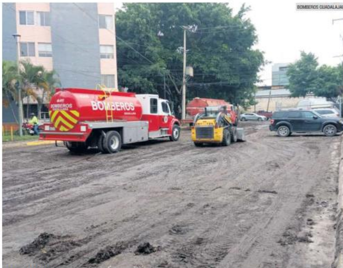
SANEAMIENTO. Las corporaciones de Bomberos y Protección Civil de los municipios de la metrópoli atendieron varios servicios en las zonas afectadas por la tormenta del jueves.

El municipio de Tlajomulco no reportó afectaciones, solamente algunos encharcamientos en vía pública.