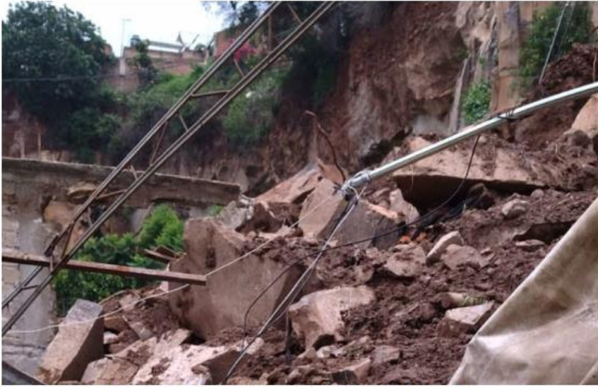
Resultaron afectadas al menos 10 casas de la colonia Rey Xoloth. DIANA BARAJAS