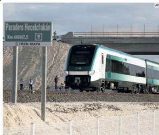
ESTRENO. El Presidente Andrés Manuel López Obrador realizó el primer recorrido en el Tren Maya, en compañía de funcionarios y algunos gobernadores.

El Quinto Informe de Gobierno que el Presidente Andrés Manuel López Obrador entregó al Congreso de la Unión omite los detalles del supuesto arranque de procesamiento de crudo de la Refinería Olmecca en Dos Bocas, Tabasco. "Con el objetivo de incrementar la elaboración de productos de mayor valor agregado en el país, cuidar la balanza comercial e impulsar el desarrollo económico y social, el Gobierno de México impulsa la terminación de la construcción y arranque de la Refinería Olmecca, ubicada en Dos Bocas, Paraíso, Tabasco, misma que próximamente se integrará al actual Sistema Nacional de Refinación (SNR)", apunta el documento. Ayer, en su discurso, el Presidente apuntó que "va a empezar a producir petrolíferos la nueva refinería de Dos Bocas, hoy empieza a producir. Y a finales del año, esta refinería estará produciendo un promedio de 290 mil barriles diarios de gasolinas", dijo. Indicó que la refinería Deer