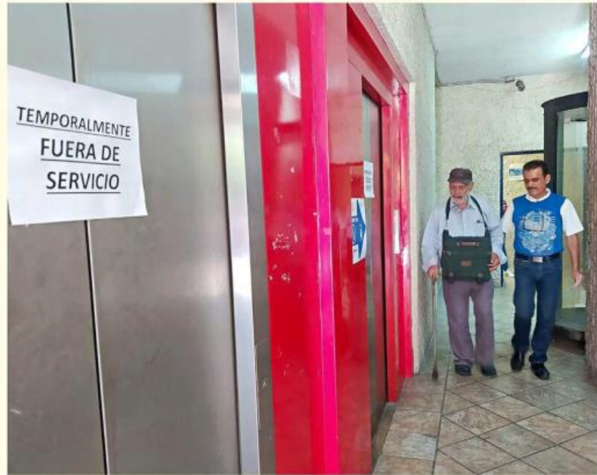
■ En ocasiones colocan el letrero de “no funcionan” aunque sí estén en condiciones de operar.

Este medio volvió a realizar un recorrido la tarde de ayer y corroboró que sólo uno de los elevadores ya se encontraba en funcionamiento, lo que incluso causó la extrañeza de los visitantes.