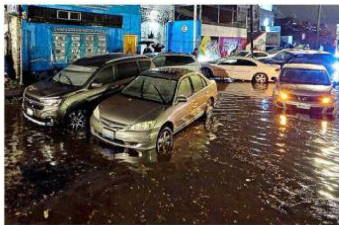
El servicio de grúas se retrasó el jueves debido a las avenidas inundadas y a que esperaron a que bajara el agua.

La lluvia del jueves, la más fuerte del temporal, colapsa el servicio de grúas