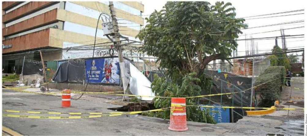
La circulación en la lateral oriente de Mariano Otero permanecerá cerrada.