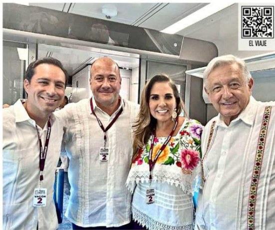
Los Gobernadores Mauricio Vila (Yucatán-PAN); Enrique Alfaro (Jalisco-MC) y Mara Lezama (Quintana Roo-Morena) posan junto al Presidente en uno de los cuatro vagones del Tren Maya.

Acompañado de Gobernadores, funcionarios de su gabinete y empresarios, el Presidente efectuó ayer el primer recorrido de prueba del Tren Maya, obra que prevé inaugurar en diciembre próximo