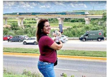
Decenas de pobladores se apostaron desde primera hora afuera de la estación S.F Campeche, para ver salir el tren.