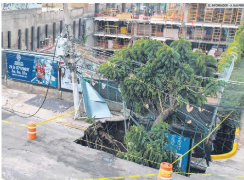
RIESGO. La lluvia ocasionó que el socavón de Avenida Ambar, que se formó el 12 de agosto, se abriera otra vez. El desplave de tres metros de profundidad engulló un árbol y dañó un poste.

La falta de infraestructura hidráulica y el rezago en la construcción de colectores acentúan afectaciones durante el temporal