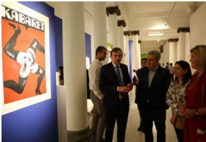
ARTE. Este viernes fue inaugurada la exposición Maestros del cartel polaco en el MUSA. Permanecerá hasta el 3 de diciembre.