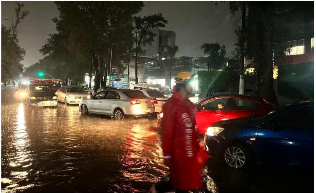
Bomberos municipales y estatales atendieron la emergencia.

El alcalde tapatío señaló que lamentablemente el temporal ha sido impredecible y la cantidad de