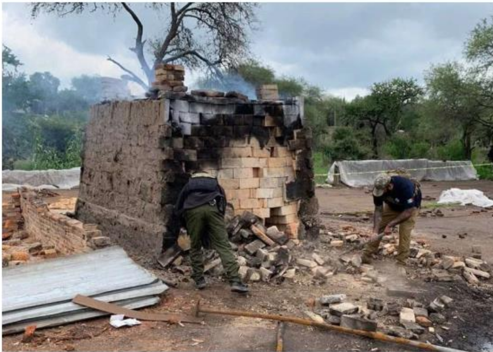
Continúan las investigaciones en los dos municipios de Los Altos. ESPECIAL