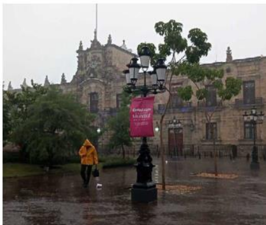
Las lluvias han alcanzado los 73 milímetros. ESPECIAL

Indicó que según Conagua arriba de 25 milímetros y se considera lluvia fuerte, mientras que arriba de 50 milímetros se clasifica como lluvia muy fuerte. Finalmente, la investigadora del Instituto de Astronomía y Meteorología de la UdeG mencionó que se espera que continuarán en lo que va del temporal. ■