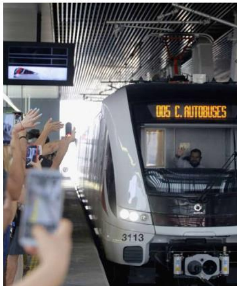
En 2021 se inauguró la Línea 3 del Tren Ligero.

En 2019 comenzó el servicio con trenes triples y se creó la estación Auditorio