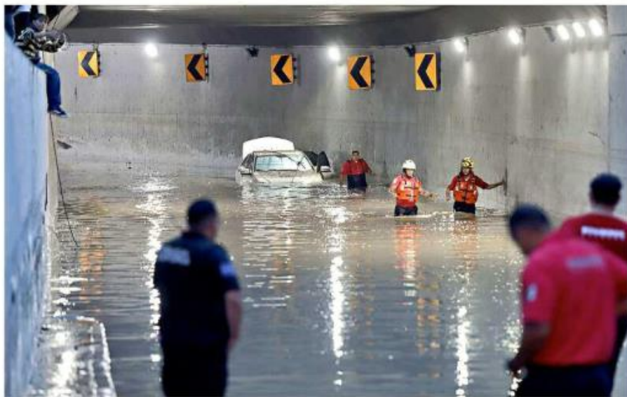
El jueves, dos personas quedaron atrapadas en su vehículo y fallecieron. El nivel del agua de lluvia alcanzó entre tres y cuatro metros de altura.

La intensa tormenta que se registró, aunado con la urbanización de la parte alta de esta microcuenca, es decir, por la zona de Solares, provoca que corra más agua y a mayor velocidad.