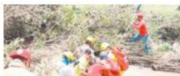
22 DE JULIO. El cauce del río El Taray se llevó a un hombre.