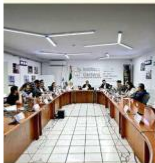
■ Los lineamientos fueron aprobados por el IEPC.

El IEPC también aprobó la Implementación de Disposiciones en Favor de Grupos en situación de Vulnerabilidad en la Postulación de Candidaturas a Diputaciones y Municipios.