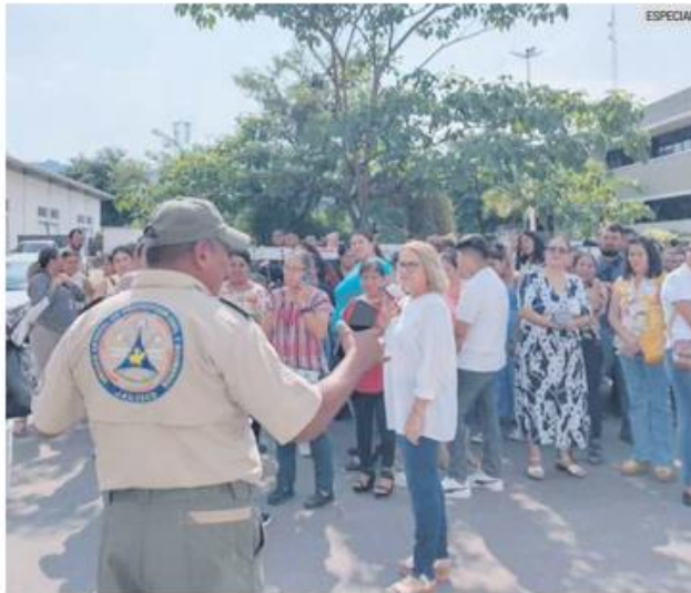
TEMBLOR. Los movimientos telúricos en Jalisco se sintieron principalmente en la franja costera del Estado y en algunos puntos del Área Metropolitana de Guadalajara.