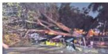
3 DE AGOSTO. Cayó un árbol y mató a un adolescente en Tonalá.