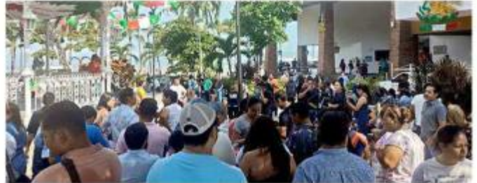
Desalojaron edificios públicos en Puerto Vallarta tras los sismos.

En Puerto Vallarta, además de pedir desocupar recintos como la Presidencia