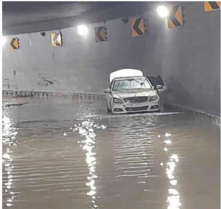
Los hechos se registraron este jueves en el paso desnivel ubicado en avenida Servidor Público y Periférico.

Dado a que en ese punto no se había registrado ese tipo de inundaciones por el desbordamiento de uno de los canales que baja desde San Juan de Ocotán, el municipio ya trabaja en dictámenes para realizar acciones