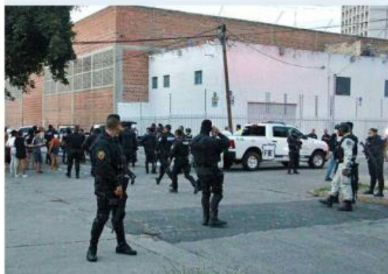
■ El enfrentamiento no dejó heridos ni detenidos.

"El Gordo", indicaron fuentes enteradas del caso, cuenta con antecedentes penales por los delitos de robo a casa habitación, en 2008, y delitos contra la salud en 2021.