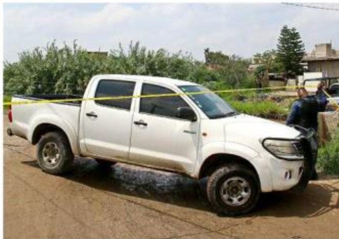
■ En El Salto fue localizado un torso humano.

La víctima, de 43 años, estaba en los asientos traseros del vehículo.