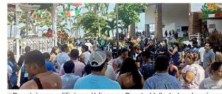
Desalojaron edificios públicos en Puerto Vallarta tras los sismos.

El funcionario descartó cualquier daño a infraestructura o a las personas.