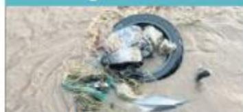
21 DE JULIO. Joven arrastrado en su moto por el arroyo Colorado.