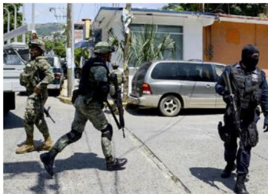
Pide más coordinación entre niveles de gobierno. ESPECIAL

Respecto a salud se logró la aprobación de una reforma para tener medicamentos accesibles frente al desabasto de medicamentos en México. En educación se ha pugnado por el regreso de escuelas de tiempo completo. —