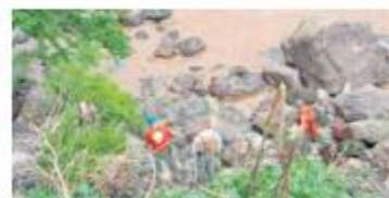
3 DE AGOSTO. La corriente del canal de Osorio se llevó a un sujeto en su auto.