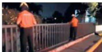
25 DE JULIO. La fuerza del agua arrastró a un joven en El Briseño.