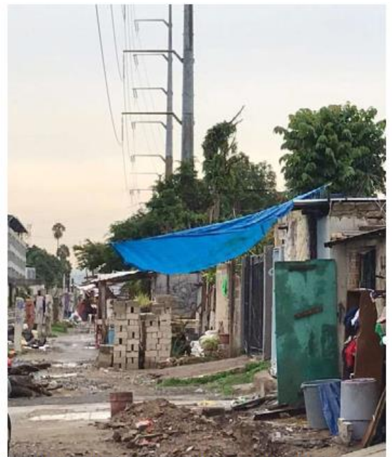
En el lugar se han registrado múltiples hechos.