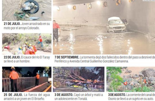
21 DE JULIO. Joven arrastrado en su moto por el arroyo Colorado. 22 DE JULIO. El cauce del río El Taray se llevó a un hombre. 7 DE SEPTIEMBRE. La tormenta dejó dos fallecidos dentro del paso a desnivel de Periférico y Avenida Central Guillermo González Camarena. 25 DE JULIO. La fuerza del agua arrastró a un joven en El Biseflo. 3 DE AGOSTO. Cayó un árbol y mató a un adolescente en Tonalá. 3 DE AGOSTO. La corriente del canal de Osorio se llevó a un sujeto en su auto.

La urbanización descontrolada y la falta de un sistema de alerta temprana elevan el riesgo para la ciudadanía en cada temporal