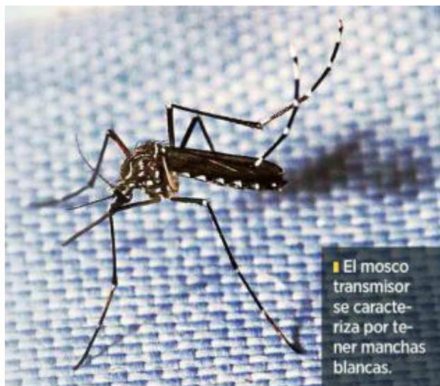
El mosquito transmisor se caracteriza por tener manchas blancas.

Con varios casos detectados, pero aún en zona de seguridad, se encuentra toda el Área Metropolitana de Guadalajara, Tala, Tomatlán, Jocotepec, Puerto Vallarta y Ocotlán.