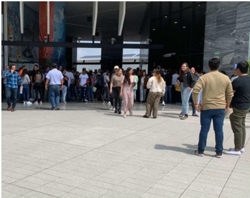
Evacuaron a personal durante el movimiento telúrico. ROBERTO HURTADO

Añadió que tampoco se reportan personas lesionadas, solo las evacuaciones de edificios públicos como presidentes municipales de Guadalajara, Palacio de Gobierno y otros edificios en el centro tapatío.