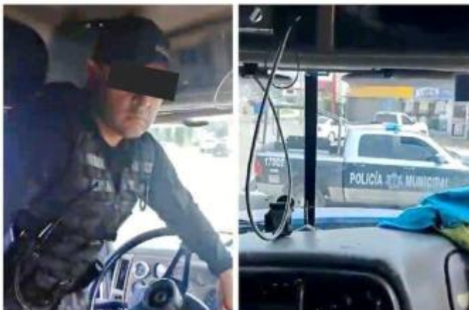
■ Parte del incidente fue grabado por el chofer con su celular.

En ese momento enfocó a uno de los agentes y le pregunta su nombre, pero a cambio recibe un manotazo